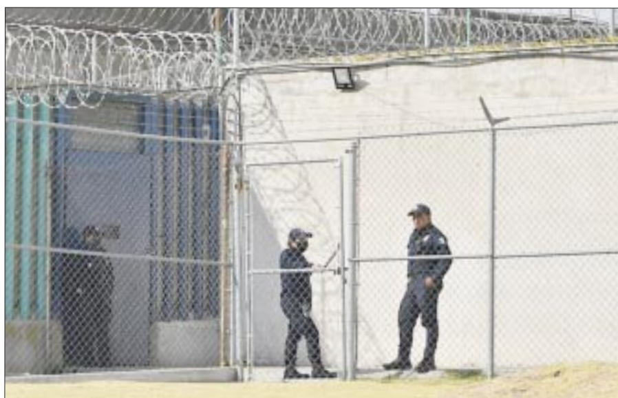
De las 233 mil 277 personas presas en México, 86 mil 984 personas no tenían sentencia, o sea el 37.3 por ciento, de acuerdo al Censo Nacional de Sistemas Penitenciarios del Inegi.

Quintana Roo tiene un alto nivel de ciberacoso, pero solo el 6.4% de la población usuaria reportó haber sido víctima de ciberdelitos, por debajo de la media nacional que es de 6.6%.