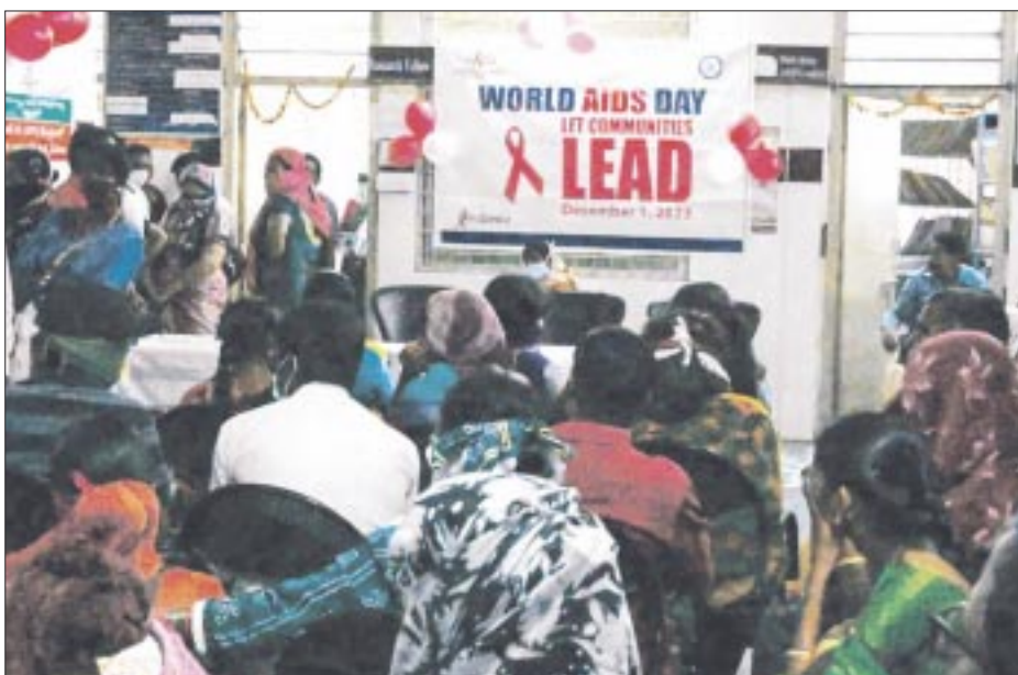
Los contagios por VIH están aumentando en tres regiones: Oriente Medio y África del Norte; Europa del Este y Asia Central y América Latina.

ONUSIDA subrayó que el estigma y la discriminación, así como la criminalización, de los que son víctimas ciertos grupos de personas impiden el progreso porque no pueden obtener ayuda y tratamiento sin peligro.