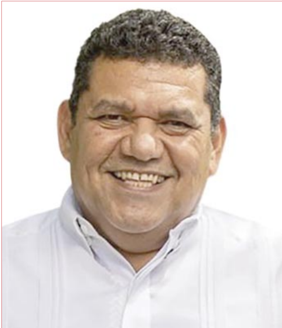
El gobernador Javier May Rodríguez sostuvo que, para recuperar la paz en Tabasco, las fuerzas estatales y federales trabajan en estrecha coordinación y con mayor empeño, porque la seguridad del pueblo es prioridad.

Por otro lado, en el municipio de Cárdenas fue ejecutada una persona del sexo masculino a quien perseguían, lo ultimaron en la calle Correidora cerca del Periférico.