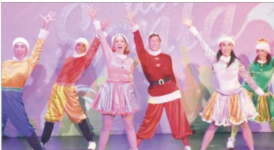
La obra con una duración aproximada de una hora y media, cuenta con 11 temas, solo 2 son covers y los demás son originales.

gunda semana de noviembre estarán a la venta los boletos en la página de Boletia o en la taquilla del Marketeatro. Con precios muy accesibles.