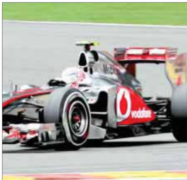
No deben descartar a Jenson Button en las 7 carreras que faltan de la F1.

Londres, Inglaterra.- El jefe técnico de McLaren, Martin Whitmarsh, aseveró que ‘aún quedan siete carreras más por ganar’ y que el mayor exponente de la escudería, Jenson Button, ‘sigue con suma de puntos’.