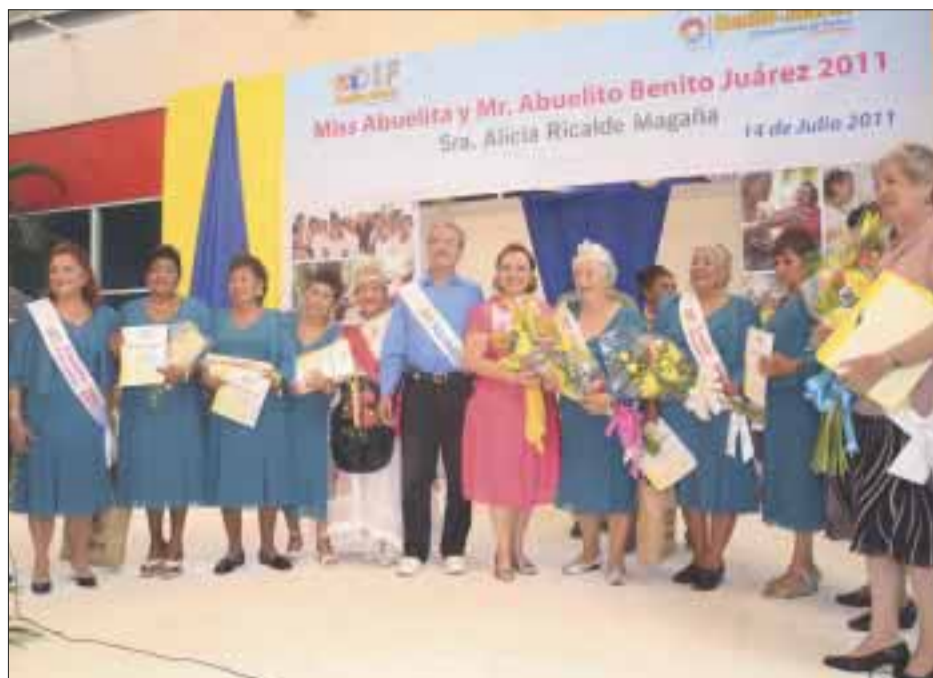
"Miss Abuelita y Abuelito 2011", en la foto del recuerdo.