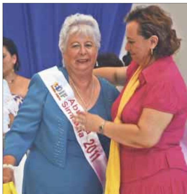
"Miss Abuelita Simpatía" es coronada por la presidenta del DIF municipal.