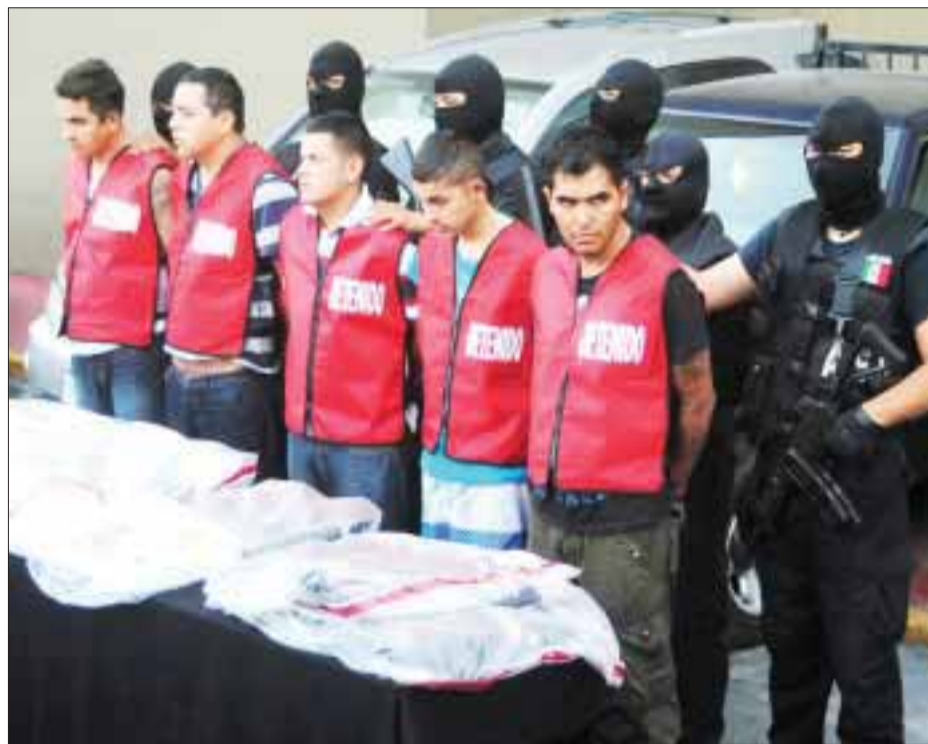
Estos son los primeros cinco participantes en el ataque al casino capturados, todos confesos y con pruebas de su participación.

Cuitláhuac Salinas, subprocurador de la Procuraduría General de la República, señaló que la dependencia ya busca al empresario recurriendo a agencias internacionales, como la Interpol.