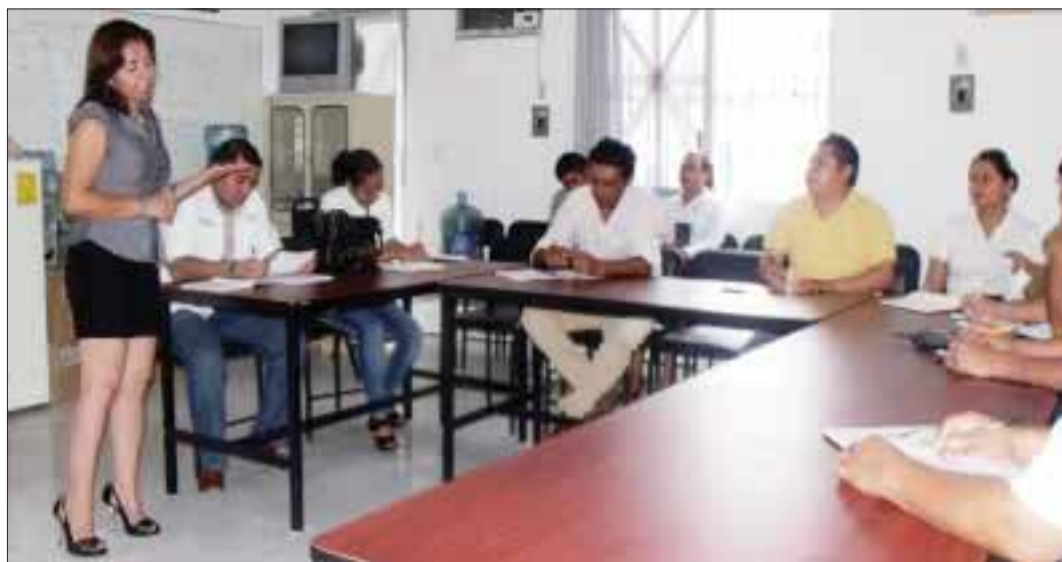
Al Comupra asistieron representantes de diferentes organizaciones como la Cruz Roja, Ángeles Verdes, Dirección de Tránsito Municipal, Dirección de Salud, entre otros.