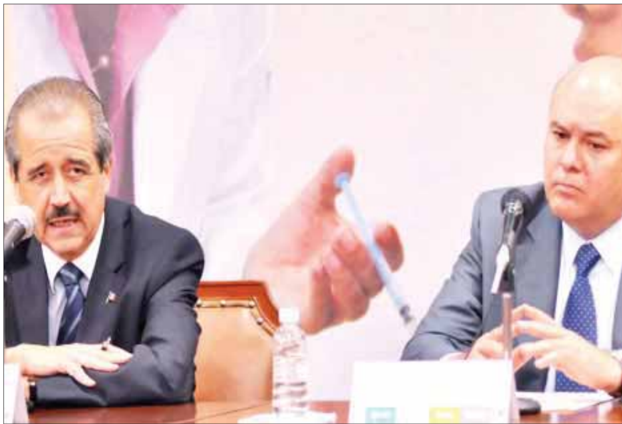
José Ángel Córdova Villalobos , titular de Salud, durante la presentación del Acuerdo de Transferencia Tecnológica para Producción de Vacuna contra Virus de Papiloma Humano entre Birmex y un laboratorio privado.

Son tres dosis: la de inicio, la segunda a los seis meses y la tercera a los 60 meses, informó José Ángel Córdova Villalobos