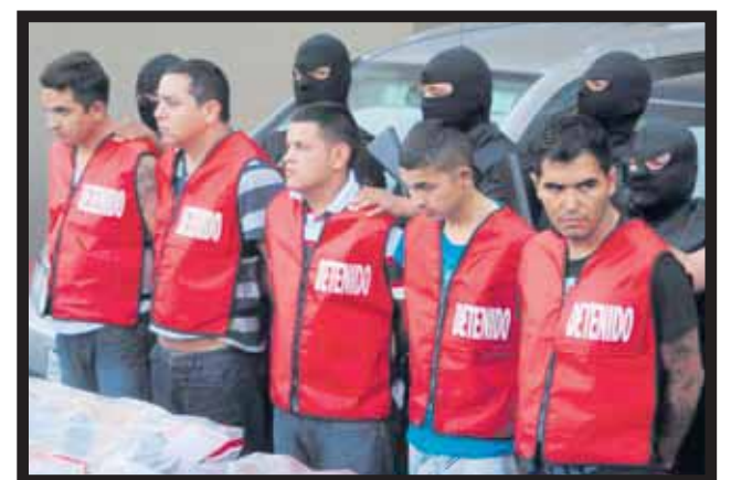
LOS CINCO ZETAS DETENIDOS fueron presentados en Monterrey.