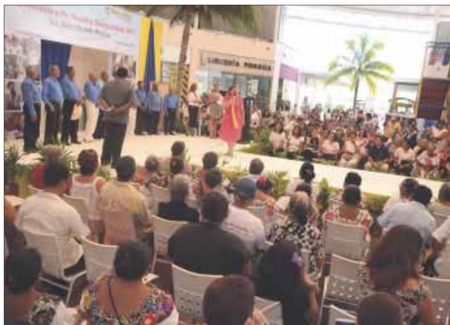
El evento se llevó a cabo en Plazas Outlet, con una asistencia de más de 300 personas.