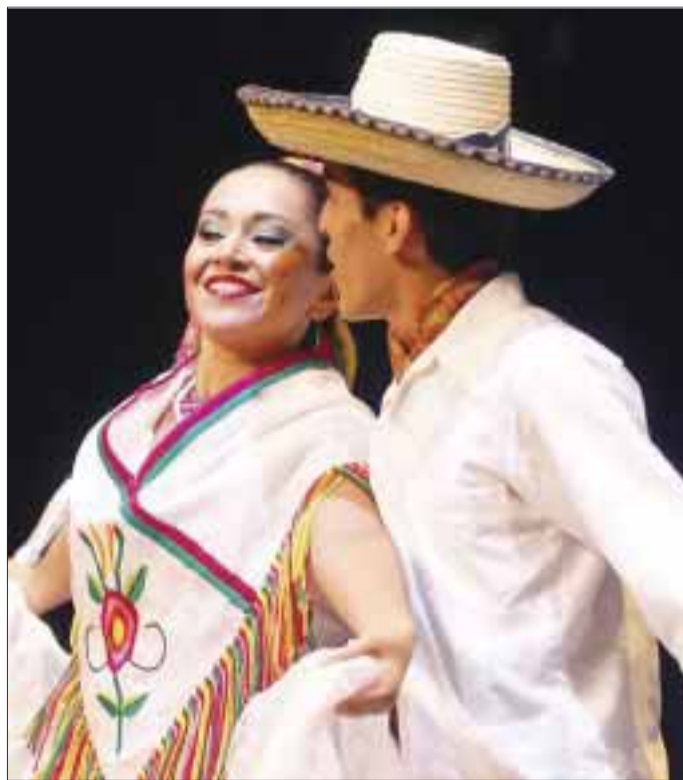
La majestuosidad de nuestro México echa música y baile

Festeja 15 años al rescate de la música ranchera, un género que no puede ni debe desaparecer porque es parte de la cultura nacional.