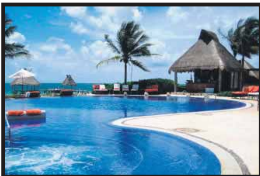
Vista de Zoëtry Paraíso de la Bonita, en Riviera Maya.