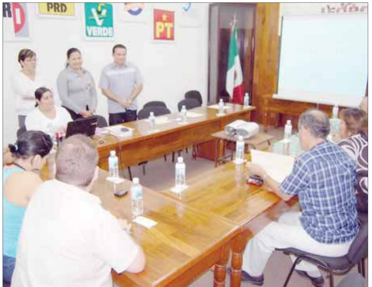
El Instituto Electoral de Quintana Roo impartió el “Curso de fiscalización a partidos políticos”.

cantidad que resulta de multiplicar el 60 por ciento del salario mínimo por el total del padrón electoral de Quintana Roo con corte al 31 de octubre del presente año, de lo cual se obtiene un total de 28 millones 476 mil 175 pesos, que a su vez se reparte un 30 por ciento de manera igualitaria a los 7 partidos registrados ante el Ieqroo, y el 70 por ciento restante, de acuerdo a la votación obtenida.