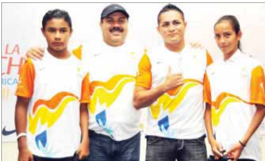
El alcalde de Benito Juárez dijo que van a poner todo el empeño para que la logística del recorrido del fuego panamericano sea todo un éxito.

Destacados deportistas llevarán la antorcha con el fuego panamericano en su recorrido por el bulevar Kukulcán, que iniciará en Playa Delfines el próximo 7 de septiembre a las 7 de la mañana