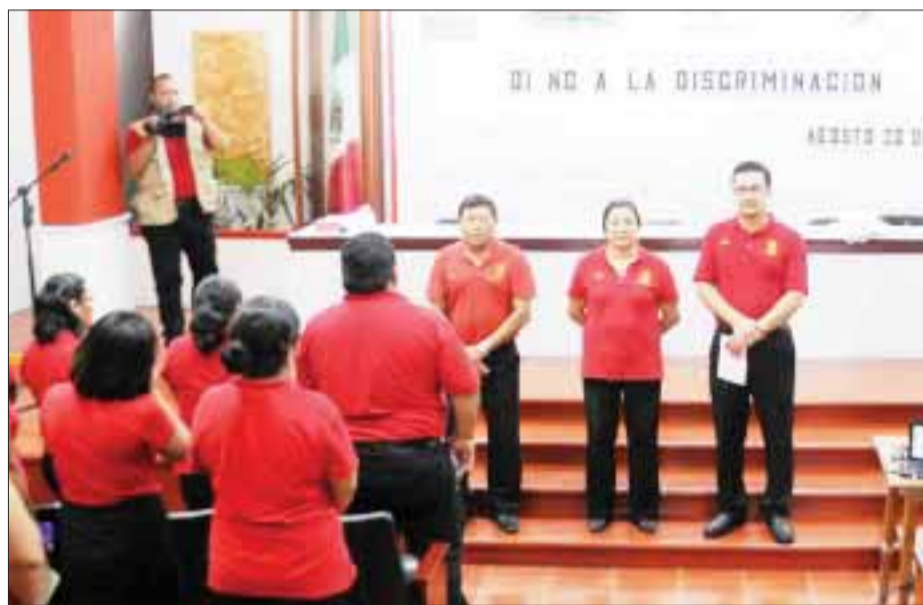
El taller permitirá que los funcionarios públicos puedan ofrecer un mejor servicio a la sociedad.

El taller "Di no a la discriminación", fue organizado por la dirección de Comunicación Social, con el apoyo de la dirección de Trabajo, como parte de las acciones que se requieren para la ratificación del certificado de Modelo de Equidad de Género (MEG: 2003), solicitado por el ayuntamiento a la institución certificadora.