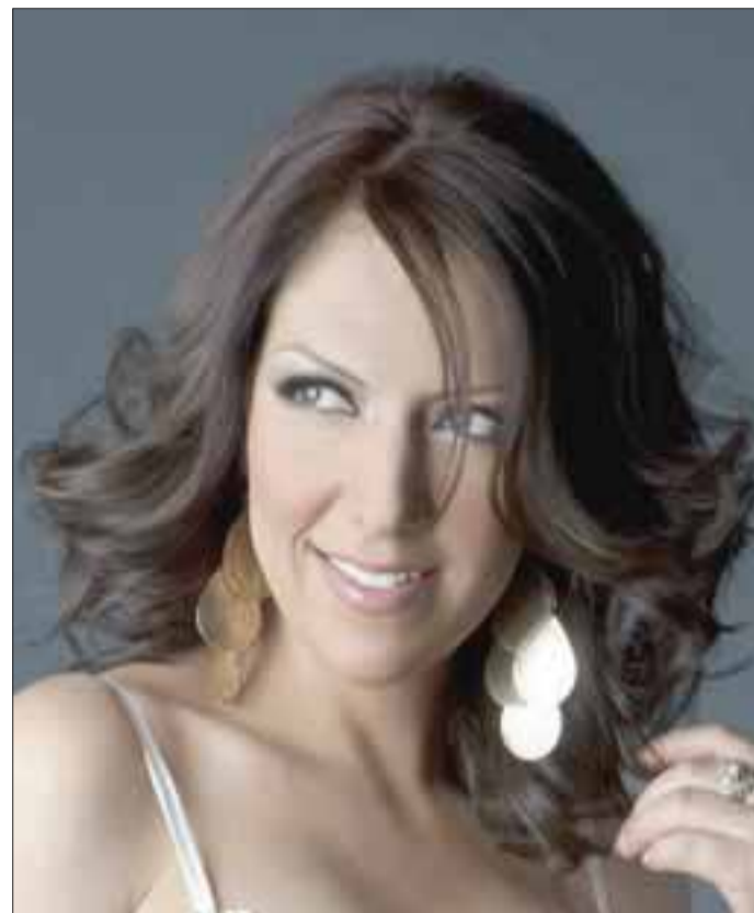
Su sencillo ABRÁZAME es el tema de moda en la zona del Bajío.

Las actividades de dicho encuentro iniciarán el próximo 6 de septiembre en el Teatro Sergio Magaña, con la actuación del Trio Acuitlapulco en punto de la 20:00 horas, posteriormente el Teatro de la Ciudad “Esperanza Iris” también iniciará actividades y el 7 de septiembre tocará el turno a la Compañía Nacional de Danza Fol-