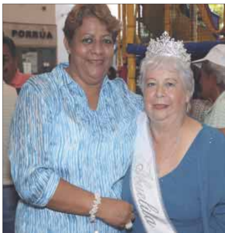
"Miss Abuelita 2011", junto a su hija, posando para DIARIOIMAGEN, después de reñido concurso.