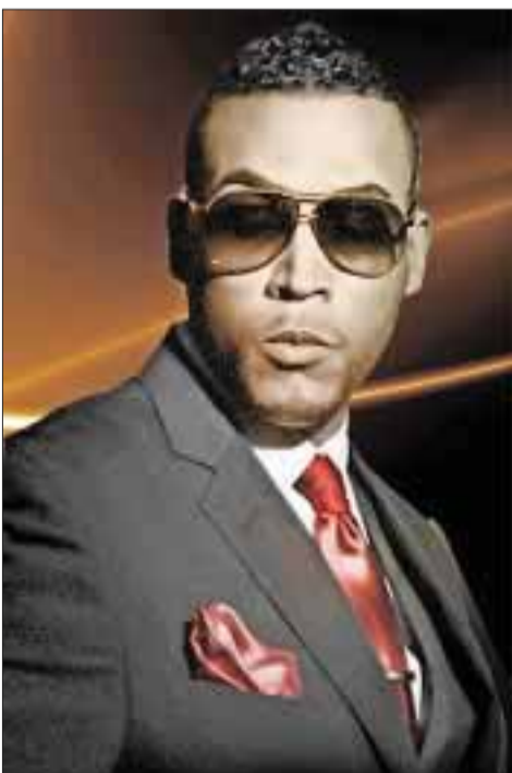
DON OMAR se presentará en Cancún.

Se llevó a cabo la rueda de prensa donde se dio a conocer que el cantante reguetonero Don Omar estará en Cancún y viene con todo el "flow" para poner a bailar con su kuduro a los cancenenses. En la conferencia dieron a conocer a la prensa los pormenores del evento, así como detalles de la