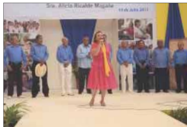
El DIF municipal de Benito Juárez crea eventos para motivar a los abuelitos.