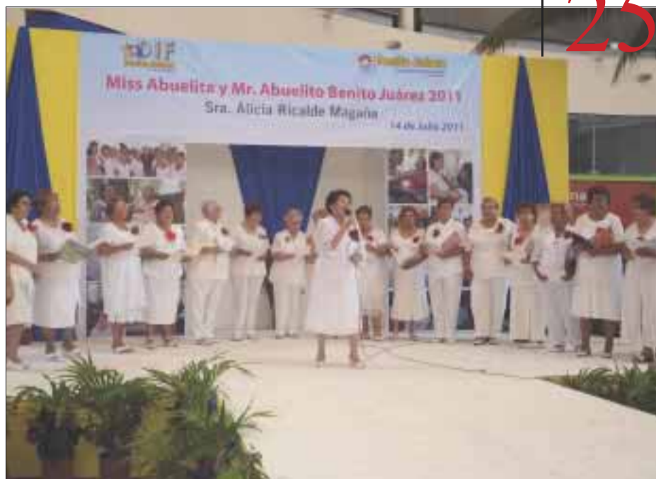
Las abuelitas cantaron una canción para deleitar a los asistentes.