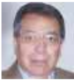
POR ROBERTO VIZCAÍNO

Luego del incendio provocado en el Casino Royale de Monterrey se dispararon los actos de terror en varias ciudades del país: