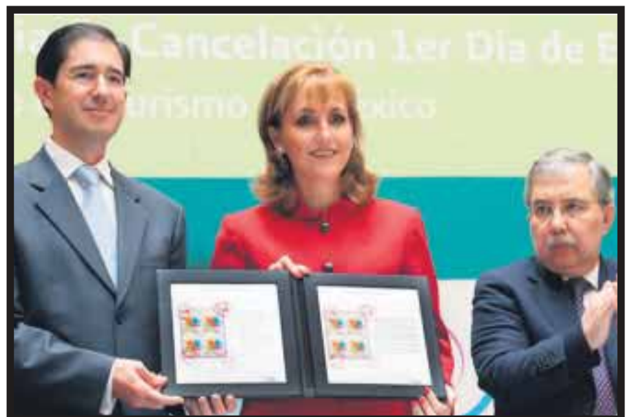
En el lanzamiento de la estampilla postal conmemorativa “2011, Año del Turismo en México”.