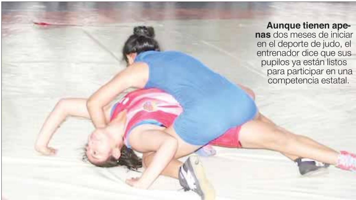
Aunque tienen apenas dos meses de iniciar en el deporte de judo, el entrenador dice que sus pupilos ya están listos para participar en una competencia estatal.