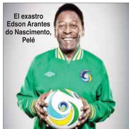
El exastro Edson Arantes do Nascimento, Pelé