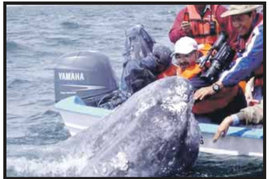
En enero llegará la ballena gris al mar de Cortés.

☆☆☆☆☆ Con la intención de sumarse a la cultura en el marco de la Feria Internacional del Libro, el hotel Carlton Guadalajara, organizó una reunión en la suite presidencial, con motivo de la pre-