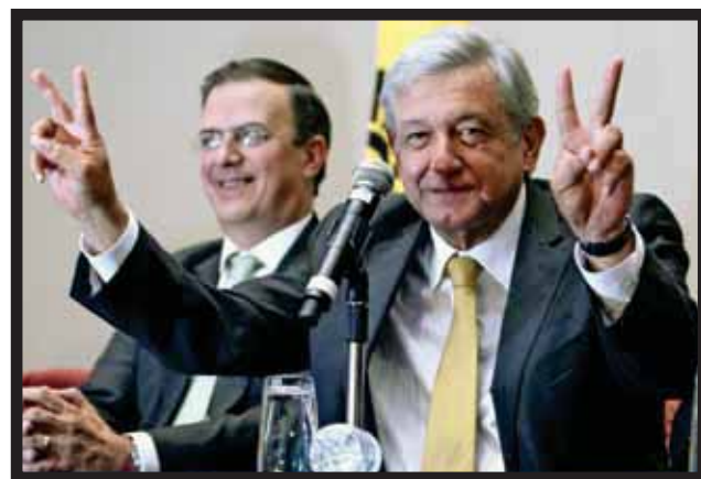
ANDRÉS MANUEL LÓPEZ OBRADOR y Marcelo Ebrard, jefe de gobierno del DF.