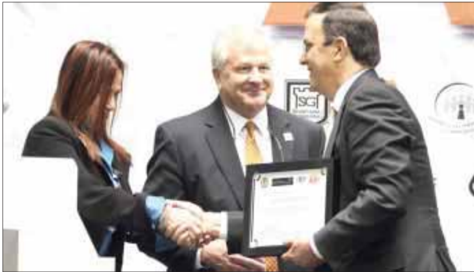
El jefe de gobierno del DF encabezó la presentación de la red social "Alerta Amber", para localizar a menores de edad.

“No sólo es conectar teléfonos y redes de comunicación, sino es organizar el trabajo para efectivamente lograr nuestro objetivo, que es en ese breve lapso poder reaccionar todas las instancias de gobierno y sociedad para ubicar a los menores que nos reportan, ese es el reto, la meta a seguir”. Al encabezar la presentación en el Patio Virreinal del Antiguo Palacio del Ayuntamiento, Ebrard Casaubon exhortó a la ciudadanía a reportar de manera inmediata la desaparición del menor para poder reaccionar en tiempo y