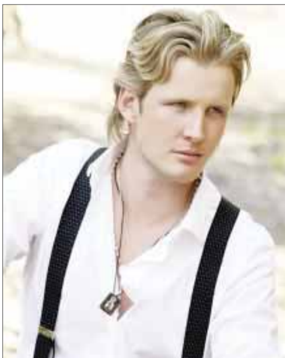
La Vida es... , segundo álbum de Acha, ha despuntado con éxito en México y Sudamérica, alcanzando Disco de Oro.

En entrevista con DIARIO IMAGEN el cantautor compartió su visión acerca de este nuevo trabajo diciendo “fíjense que ya salió la nueva canción llamada Gracias , que es el nuevo sencillo del disco y va muy bien, es un tema alegre, rítmico y movido, con una fusión de ritmos latinoamericanos, además con una letra muy profunda y me po-