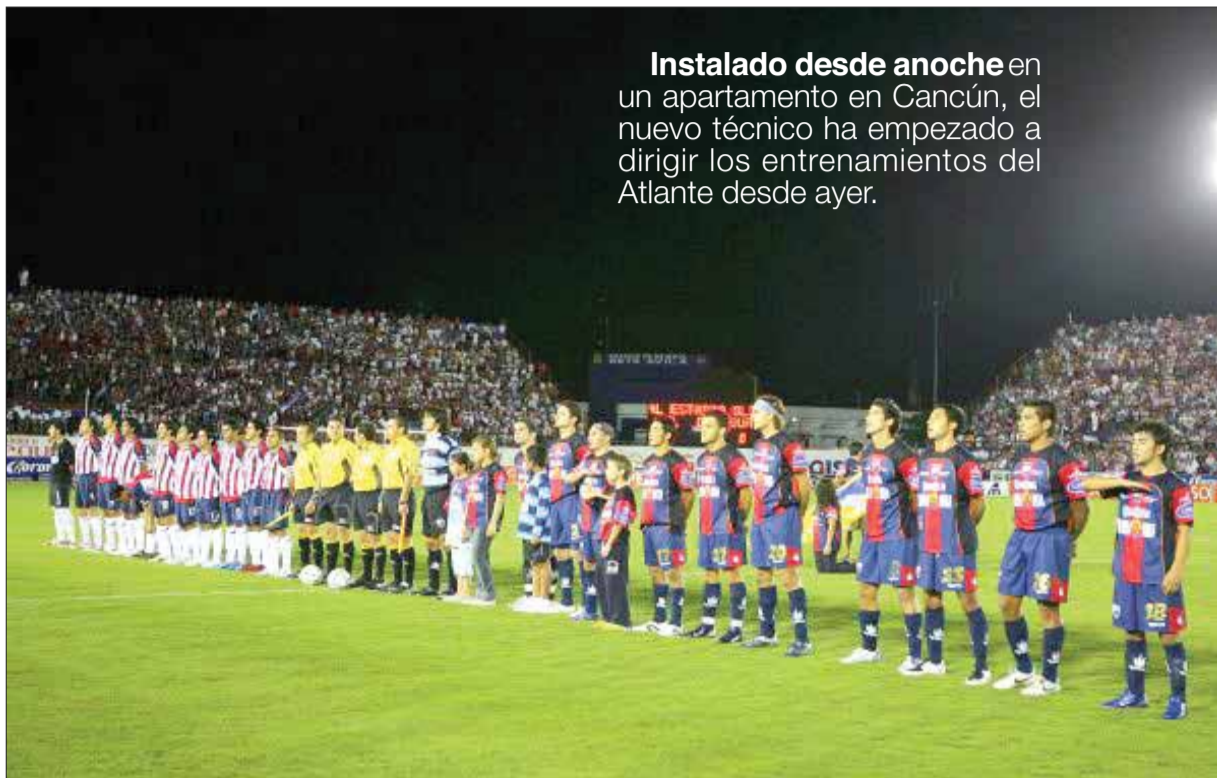
Instalado desde anoche en un apartamento en Cancún, el nuevo técnico ha empezado a dirigir los entrenamientos del Atlante desde ayer.

La premiación que se llevó a cabo en la misma cancha de la región 95, consistió en trofeos de primero, segundo y tercer lugar, además de reconocer el trabajo de los entrenadores y directores técnicos de cada escuadra.