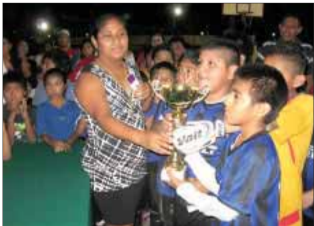
Los padres del equipo perdedor acusaron de favoritismo a los organizadores de la final de fútbol, pero los organizadores dijeron que todo es por el calor del deporte.

"A toda la afición de Altamira, a la directiva y a los jugadores les informo que he sido designado el director técnico del equipo Atlante de Primera División, me llevo una gran enseñanza de mi paso por este gran equipo y un profundo agradecimiento a todos los jugadores que demostraron que no hay barreras que no se puedan vencer con voluntad, sacrificio y hambre de trascender".