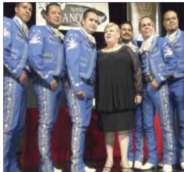
La cantante estará acompañada del Mariachi Agave de Oro.

Celebrará sus 40 años de trayectoria en la Catedral del Teatro de Revista, donde hará un recuento de sus más grandes éxitos.