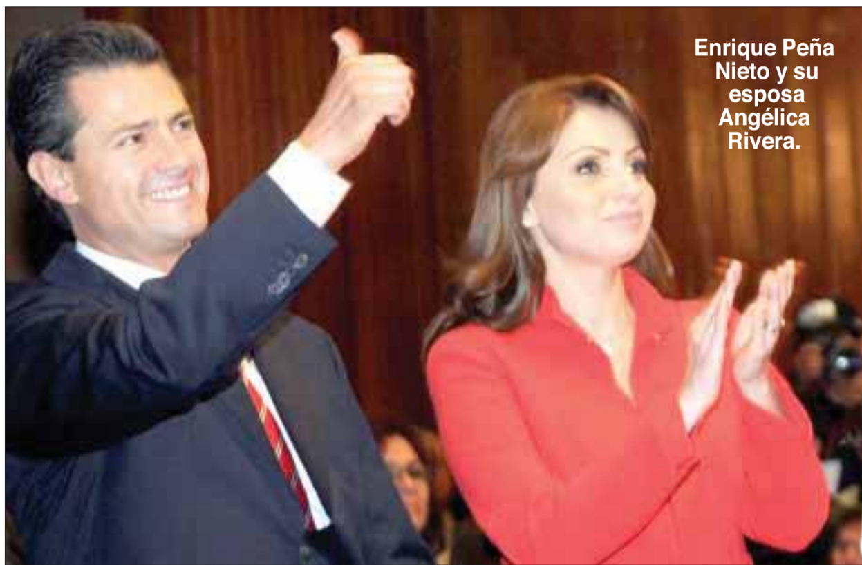
Enrique Peña Nieto y su esposa Angélica Rivera.

“No se puede eludir ni mucho menos se puede pretender inhibir o coartar con denuncias que le impidan o le limiten cumplir con lo que es su responsabilidad”