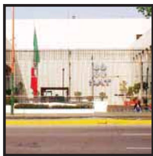
HACIENDA ADVIERTE, sanciones a morosos.