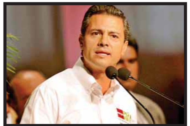
ENRIQUE PEÑA NIETO, candidato presidencial priísta. (Foto: Gustavo Camacho).