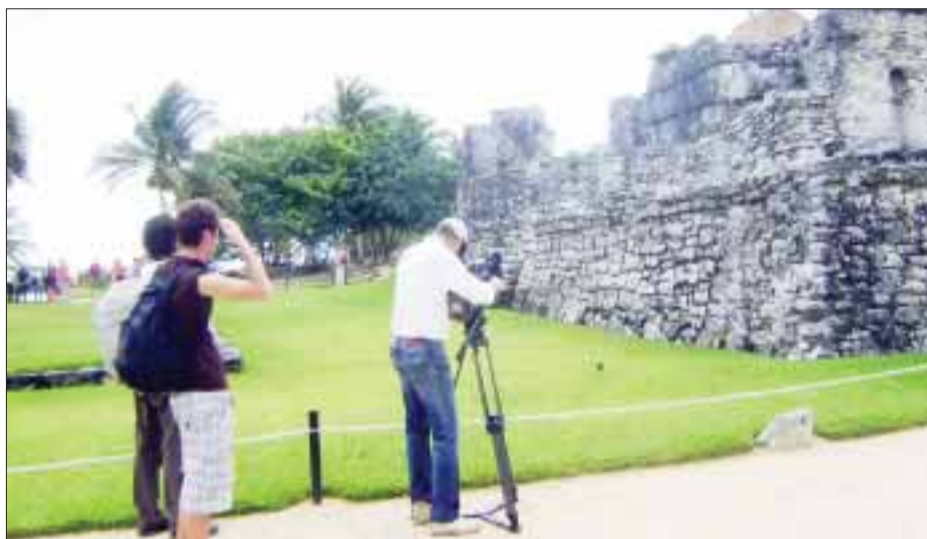
Los periodistas internacionales recorrieron las zonas arqueológicas de Tulum y Cobah.

La Riviera Maya mostró a los reporteros que es un destino multifacético, pues si bien sus inigualables playas la distinguen, también cuenta con una cultura viva y un cúmulo de celebraciones y actividades culturales y artísticas que con el paso de los años se han ido consolidando para dar forma a una ciudad que en pocos años pasó de ser un poblado de pescadores, a convertirse en un polo turístico que cada año atrae a más de 3 millones de turistas.