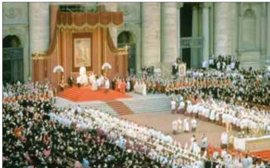
El Concilio será universal o ecuménico (del griego oikoumenē, que significa universal).

Después de condenar las herejías de Eutiques, la asamblea decretó, como verdadera, la enseñanza que en nuestro Señor Jesucristo existen dos