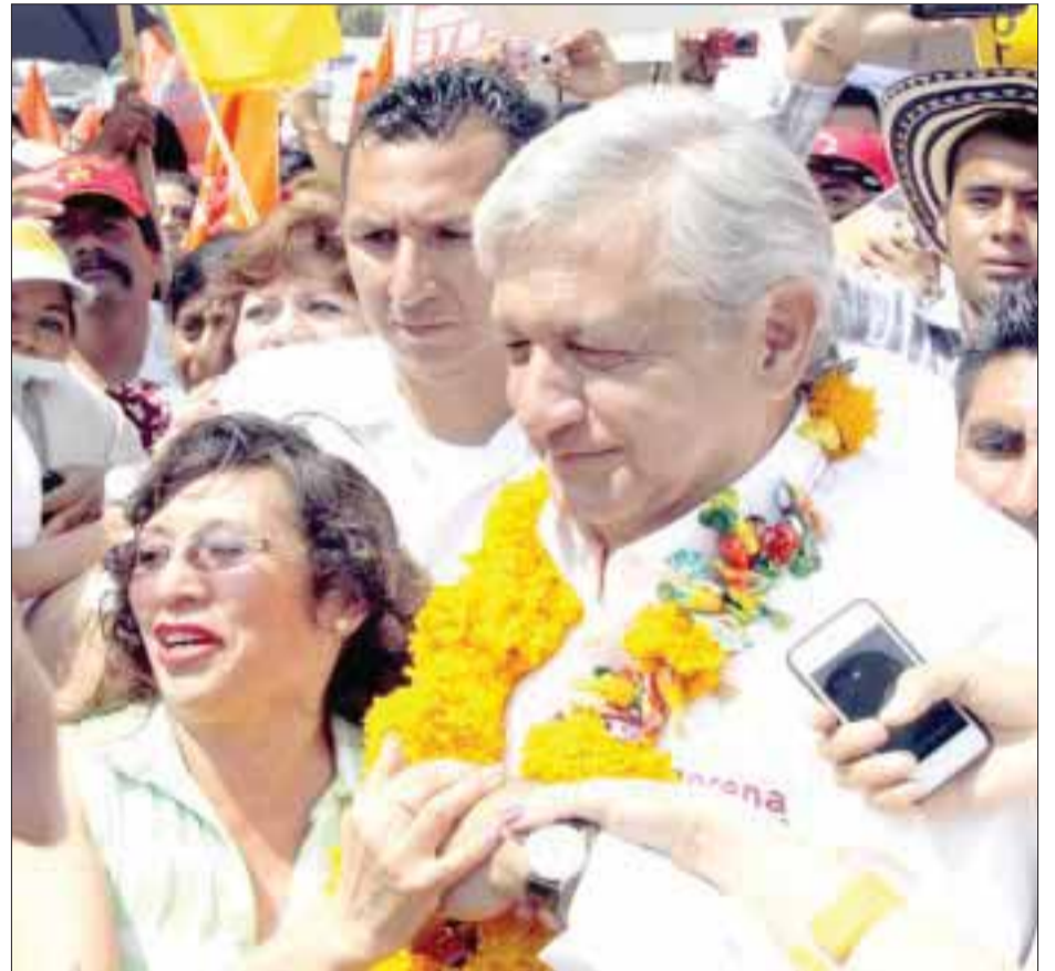
Casi una hora duró hablando el candidato del Movimiento Progresista, Andrés Manuel López Obrador, ante oaxaqueños.

En su mensaje de casi una hora, el tabasqueño desglosó las acciones que realizará en el país en caso de llegar a ser Presidente de la República