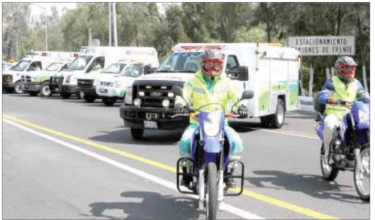
Los Ángeles Verdes ya están en las carreteras para ayudar a los paseantes en este fin de semana largo.

Y lo más importante, si toma, no maneje.