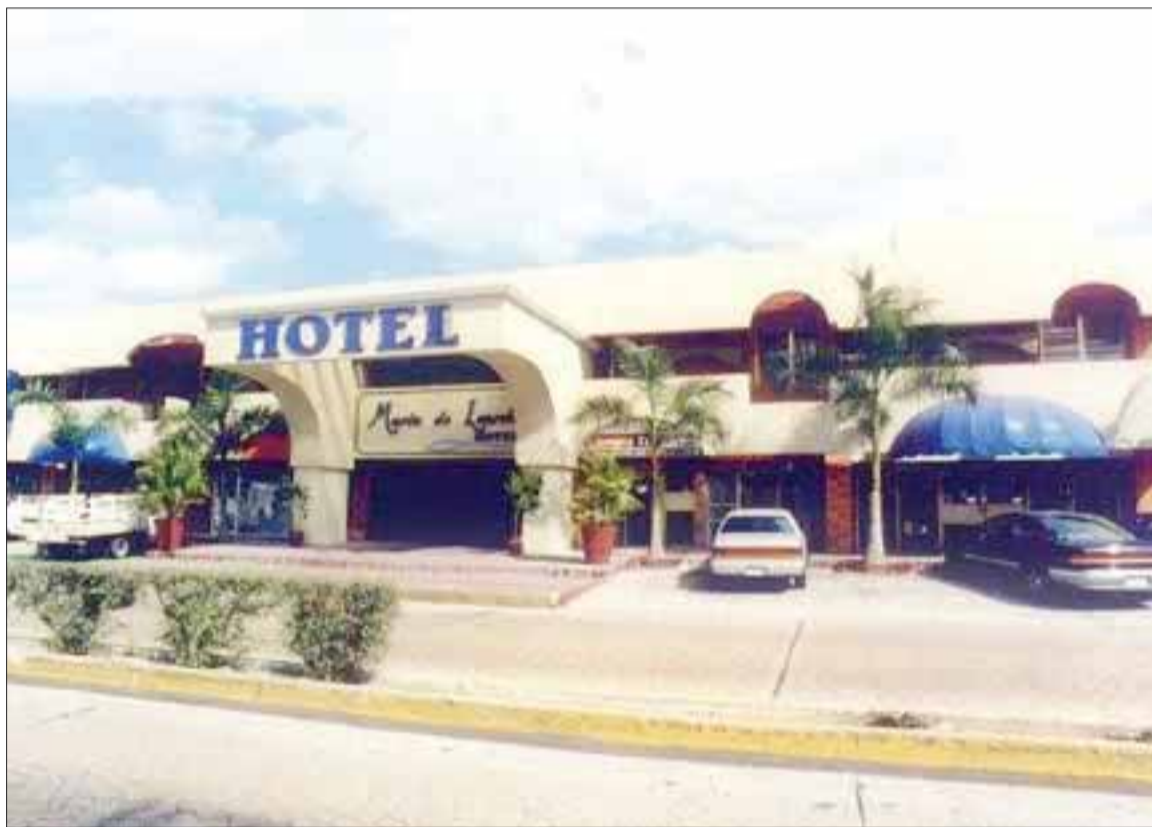
El centro de la ciudad será reactivado por los propios empresarios.

Después del diálogo con los gobiernos estatal y municipal, se habla de una reactivación a largo plazo, donde se refleje un trabajo de conjunto no sólo con las autoridades municipales, sino también con la Secretaría de Seguridad Pública.