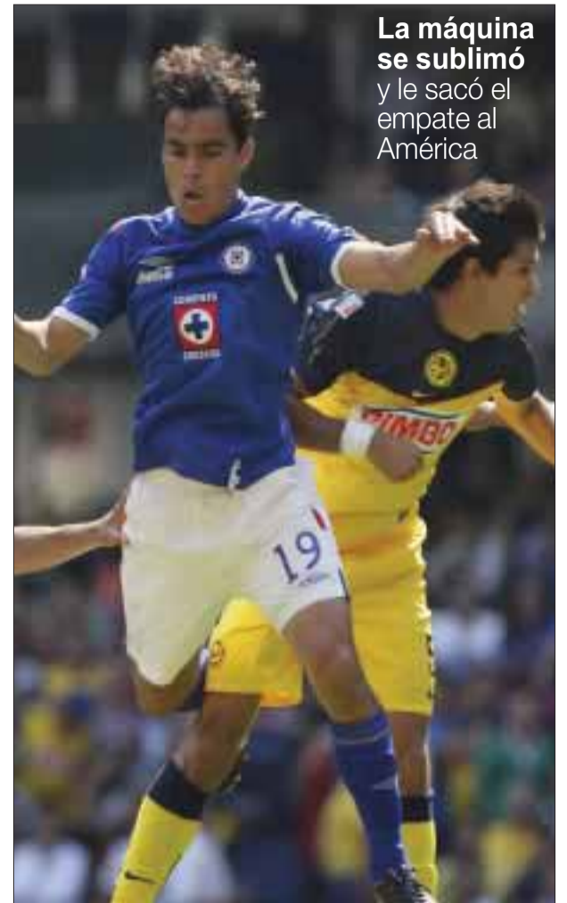
La máquina se sublimó y le sacó el empate al América

Para el conjunto potosino sólo fue la reafirmación de que es uno de los tres peores conjuntos en la campaña, al sufrir la derrota 11 del certamen por tres igualadas y tres victorias, para 12 unidades.