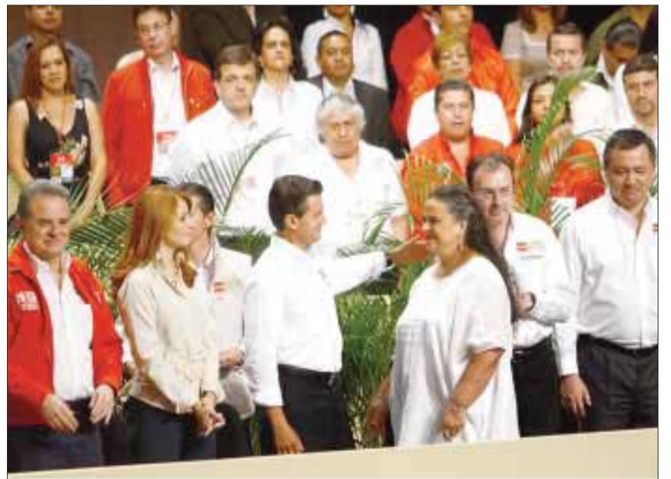
Los candidatos del PRI, a la Presidencia de la República y a la jefatura de gobierno del DF, Enrique Peña Nieto y Beatriz Paredes.

Ante un auditorio lleno y motivado, la tlaxcalteca aseguró que deservirá su principal aliado en la solución de problemas capitalinos estructurales que se han venido postergando