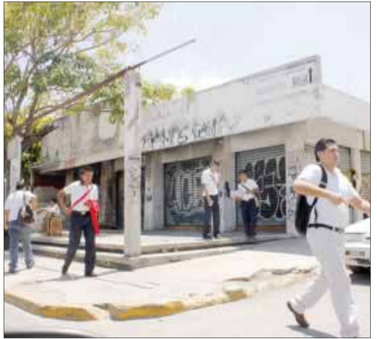
Así lucen los locales abandonados de la avenida Tulum, una de las más transitadas por el turismo.

Indiscutiblemente la mala imagen que dan locales abandonados como los que se encuentran sobre la avenida Tulum, camino obligado a la central de autobuses, por lo que es una de las principales vías que utilizan los turistas par llegar a lugares como Chichén Itzá e Isla Mujeres.