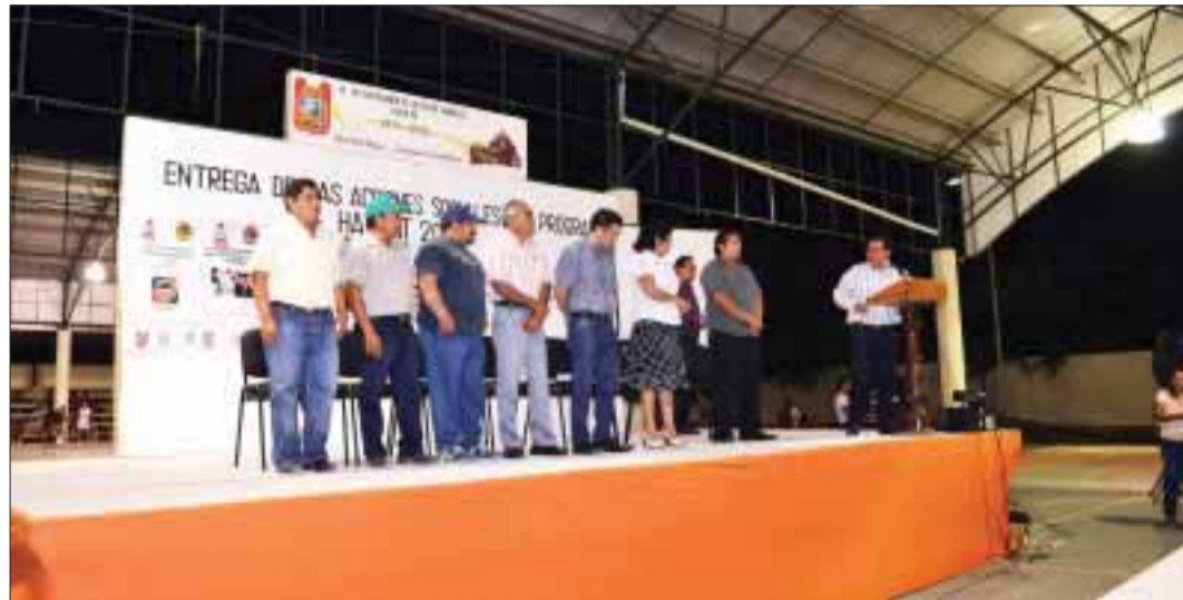
Autoridades entregan reconocimientos en el marco de la clausura de cursos correspondientes a este año.

Señaló que cada uno de los participantes en las obras, acciones y actividades del programa hábitat, juegan un papel importante, al ser coordinadores y actores directos de las acciones mencionadas, "síentense orgullosos porque hoy culmina una de sus obras que por meses iniciaron y ese beneficio fue directamente a la sociedad".