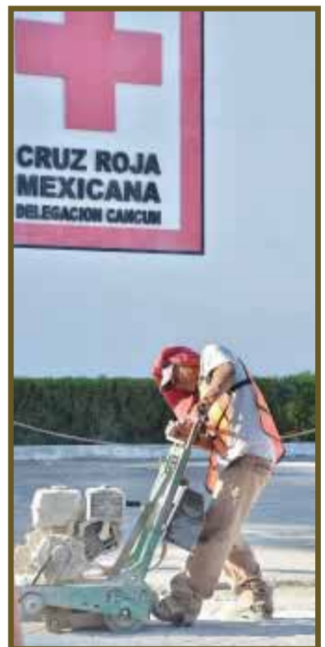
Trabajadores informales sólo reciben atención por accidente en la Cruz Roja y hospitales del gobierno.