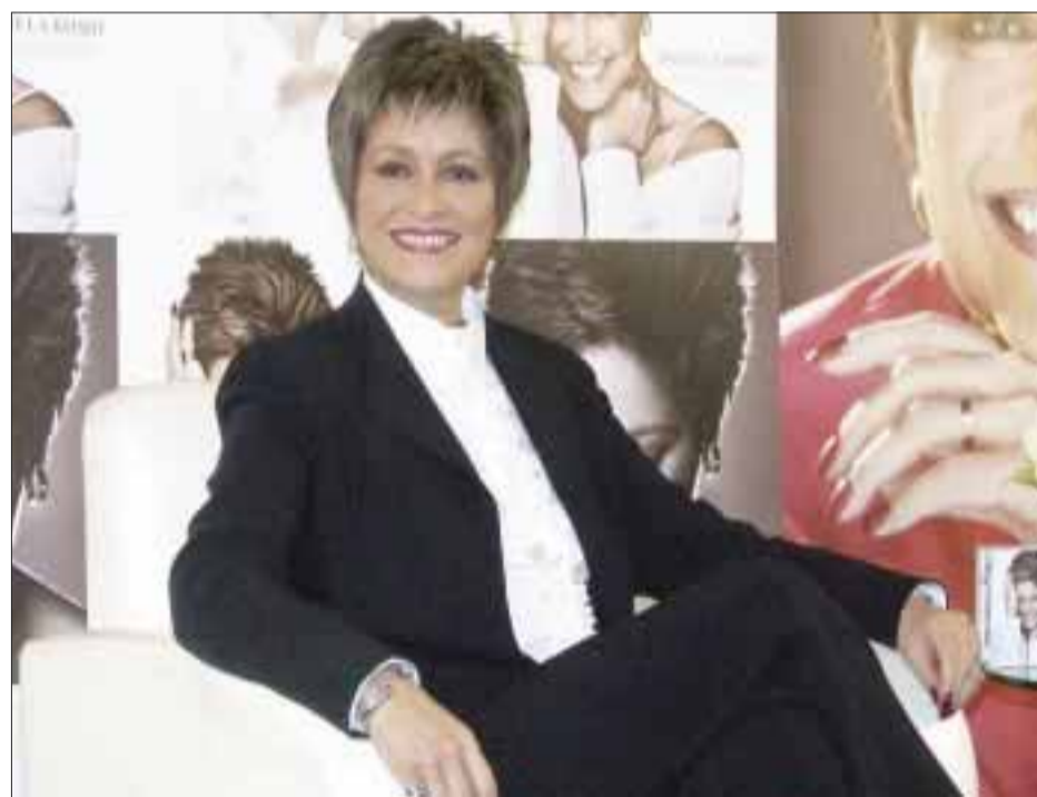
Daniela Romo recordó que "hoy (ayer) hace un año fue cuando me operaron para ponerme un catéter"

*** Después de ganarle la partida al cáncer, la cantante regresa y celebra 40 años de carrera con un nuevo álbum de su nueva casa disquera Sony