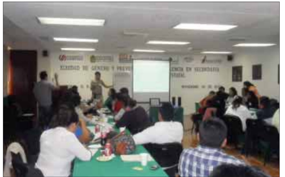
Expertas del programa universitario de equidad y género impartieron un curso a los mentores.

En Quintana Roo, sí es observable la violencia en las escuelas, sabemos que nuestro esfuerzo es una gotita apenas en el océano, pero sin esta gotita, dijo, el océano está incompleto, de lo que se trata es de aminorar la presencia de la violencia en las aulas.