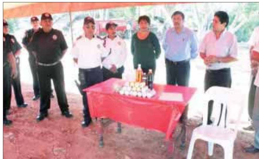
Autoridades arrancaron la implementación del operativo.

Con motivo de las fiestas navideñas y de fin de año se trabajará con varias unidades con elementos a bordo, pues durante este mes tiende a incrementarse el índice de robos a casa habitación, comercios y transeúntes. Estarán vigilantes en la entrada y salida de la cabecera municipal para verificar que las unidades vehiculares lleven su documentación en regla y no sean vehículos robados, además por la presencia de gente foránea que en ocasiones ingresa al municipio para comprar artículos navideños pagando con billetes falsos.