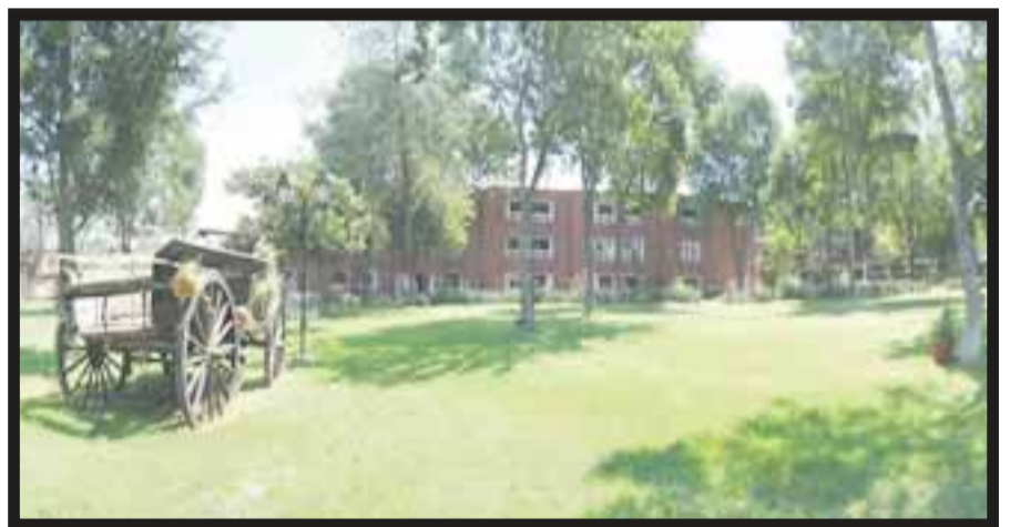
En estos jardines tendrá lugar el Festival del Vino y Gastronomía.

☆☆☆☆☆ La Corporación Financiera Internacional (IFC, por sus siglas en inglés), institución para el sector privado del Grupo del Banco Mundial, entregó el primer certificado Excellence in Design for Greater Efficiencies (EDGE) al hotel City Express Villahermosa. EDGE es un novedoso sistema de certificación de edificios ecológicos para economías emergentes que creó el IFC con el objetivo de incentivar el desarrollo de edificios ecológicos. La importancia de crear edificios con estas características tiene gran valor porque permiten reducir los costos de operación, disminuir la huella de carbono y generar empleos a través de la innova-