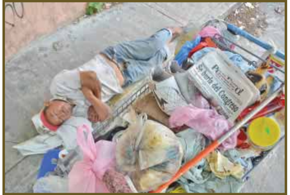
Piden al gobierno poner atención a este sector.

Los vendedores se quejan de los abusos de los patrones o de los encargados de donde laboran, pues no sólo les escatiman su salario, sino que además no son beneficiarios de seguridad social y no reciben aguinaldo.