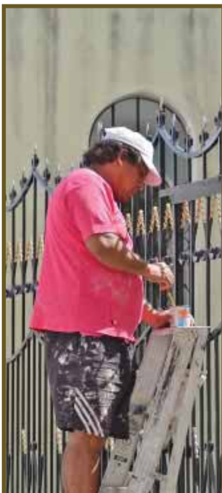
Riesgo en las alturas.