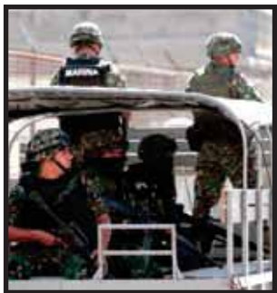
LA GUERRA AL NARCO enluta a México.

En guerra anticrimen murieron 50 marinos