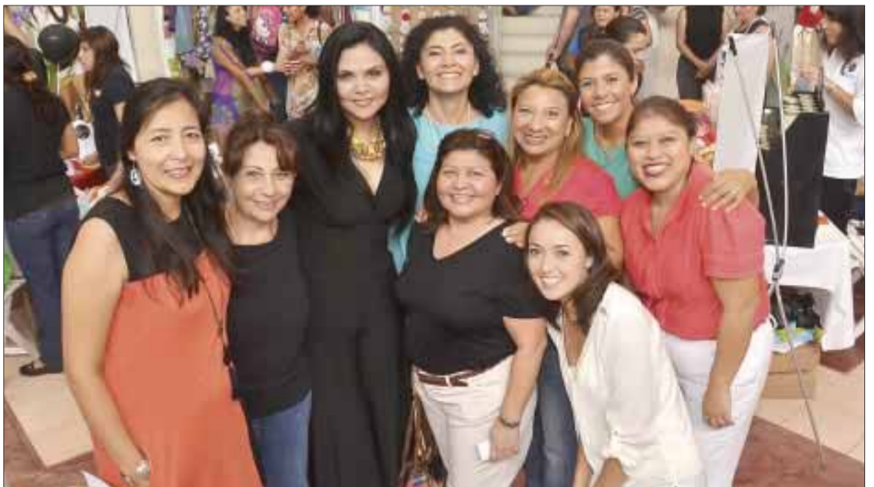
El grupo AMMJE posó para la lente de DIARIOIMAGEN Quintana Roo .