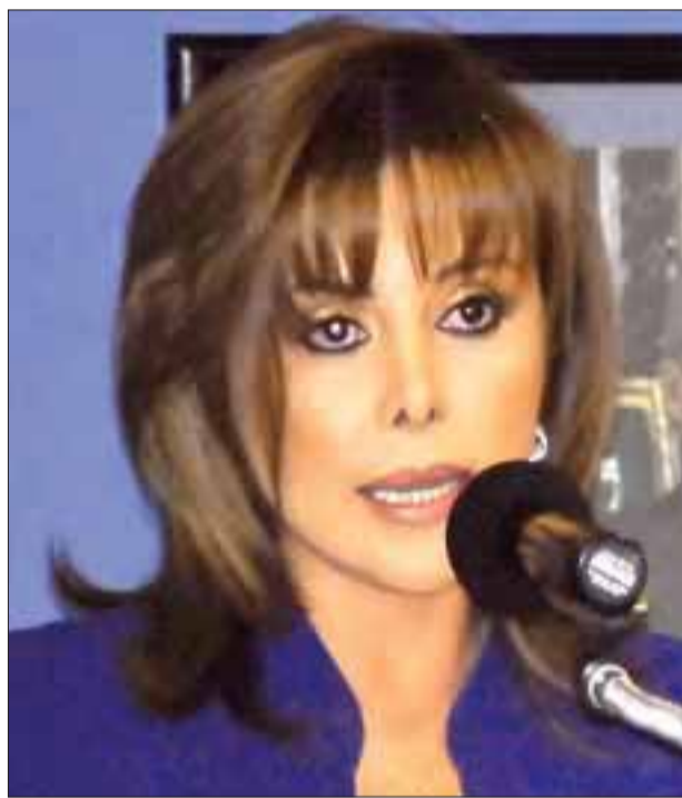
La ex procuradora Marisela Morales deberá contestar la demanda.