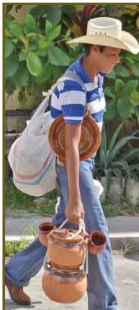
Sufren asaltos de vándalos y delincuentes.