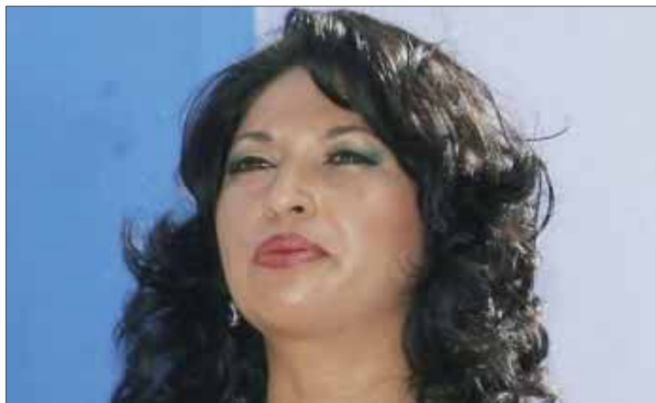
La alcaldesa panista de Lázaro Cárdenas fue acusada de pretender dividir a distintas agrupaciones gremiales de su municipio.

Primero fueron los trabajadores sindicalizados y no sindicalizados del ayuntamiento de Lázaro Cárdenas, siguieron los tradicionales tricicleros.