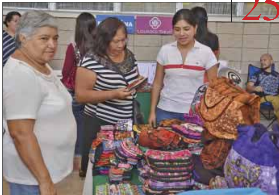
Mercancía hecha en México, bordada a mano.