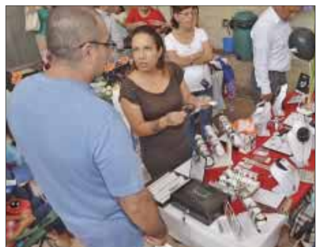
Productos mexicanos que los visitantes llegaron a ver.