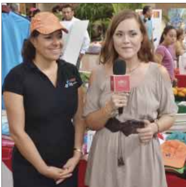
Televisora local entrevista a una vendedora ambulante.