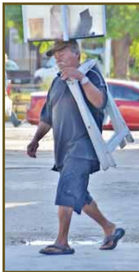
Vendedores ambulantes, desprotegidos.