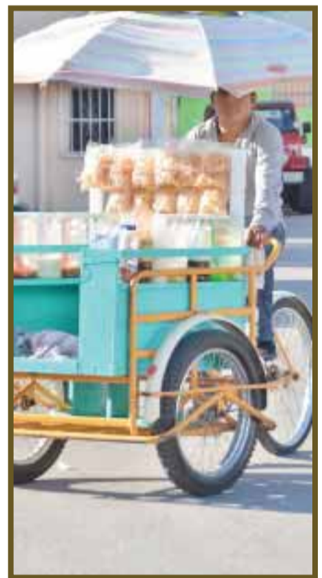
Deben cubrir una cuota en las ventas para percibir su salario.