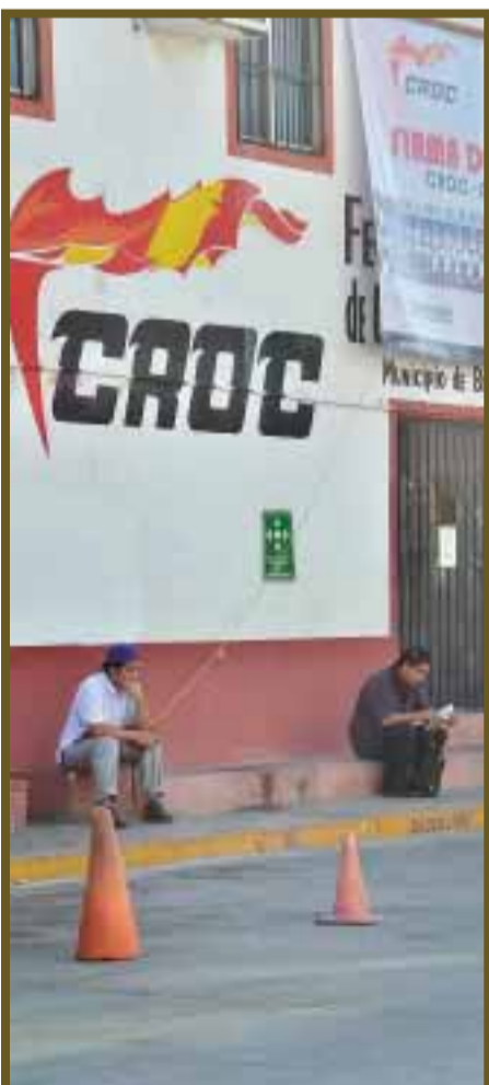
En busca de empleo temporal.