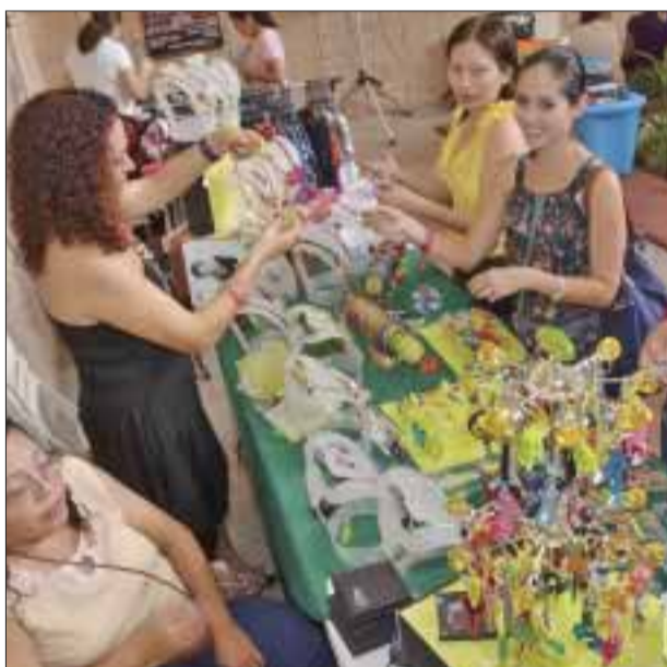
Los productos de bisutería más vistos por las damas.