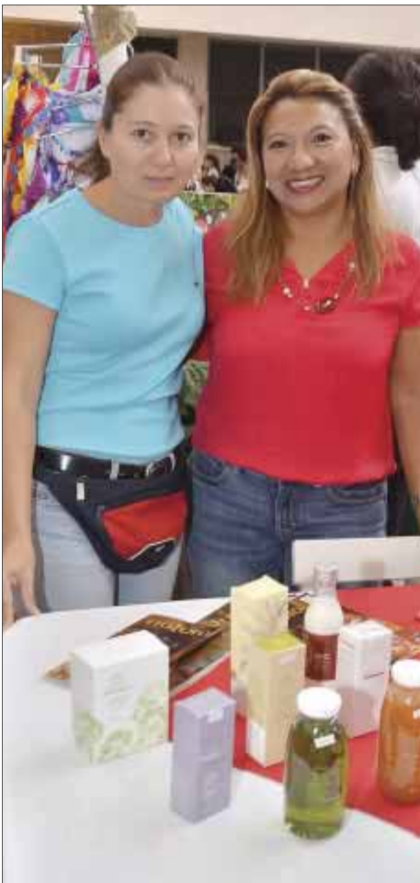
Mujer emprendedora, en compañía de una de las socias.