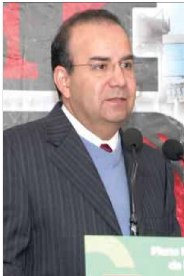
El secretario del Trabajo, Alfonso Navarrete Prida, defendió ley laboral.

El titular de la Secretaría del Trabajo y Previsión Social participó en la inauguración del pleno nacional del STIRT