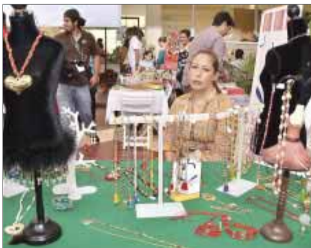
Lo que ofrecieron en esta exposición.