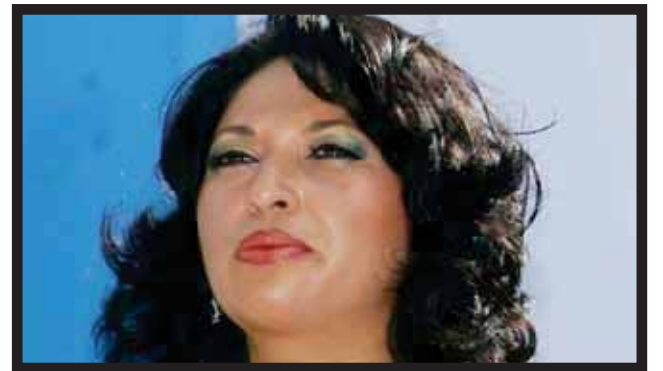
LA PRESIDENTA MUNICIPAL DE LC mantiene dividida a la sociedad.