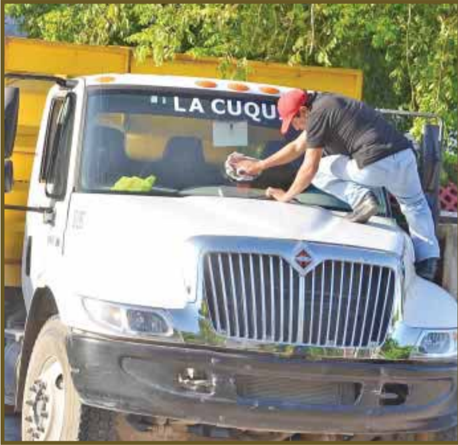
Empleados no tienen seguridad social.