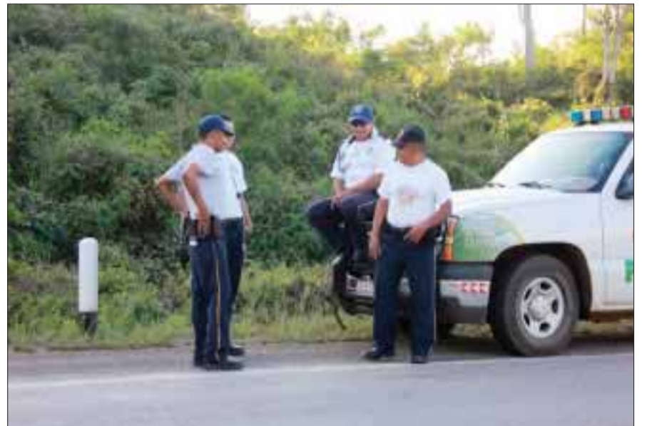
Malhechores, "como Juan por su casa", en Dziuché.

Mencionó que hace algunos años la población de Dziuché era una de las localidades morelenses más tranquilas del municipio. Sin embargo, ahora la impunidad a los delincuentes, la convirtió en zona