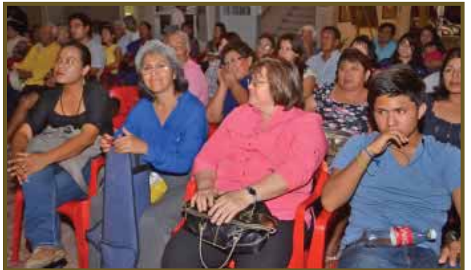
Familiares se deleitaron con una noche inolvidable.