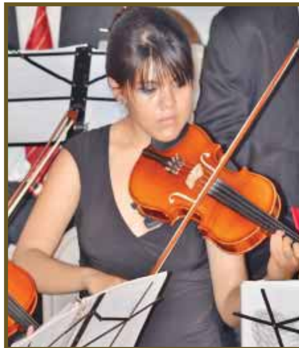
Joven interpreta música sinfónica.