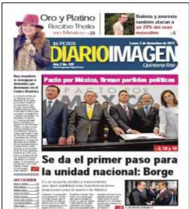
El 1 de diciembre EPN asume la Presidencia de la República, y el día 2 firma el "Pacto por México" con los partidos políticos.