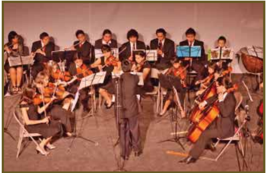
Niños y jóvenes a su corta edad interpretan complicadas melodías.

A su corta edad ya se están preparando estos estudiantes para que lleguen a realizar sus sueños.