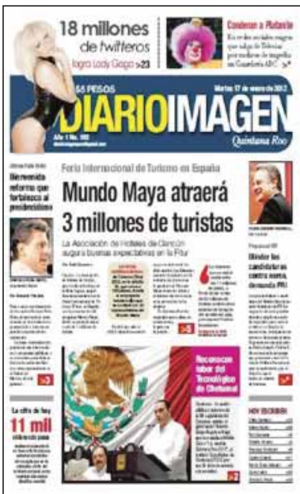
Portada de la edición 193 del día 17 de enero: Llegada de 3 millones de turistas por el Mundo Maya.