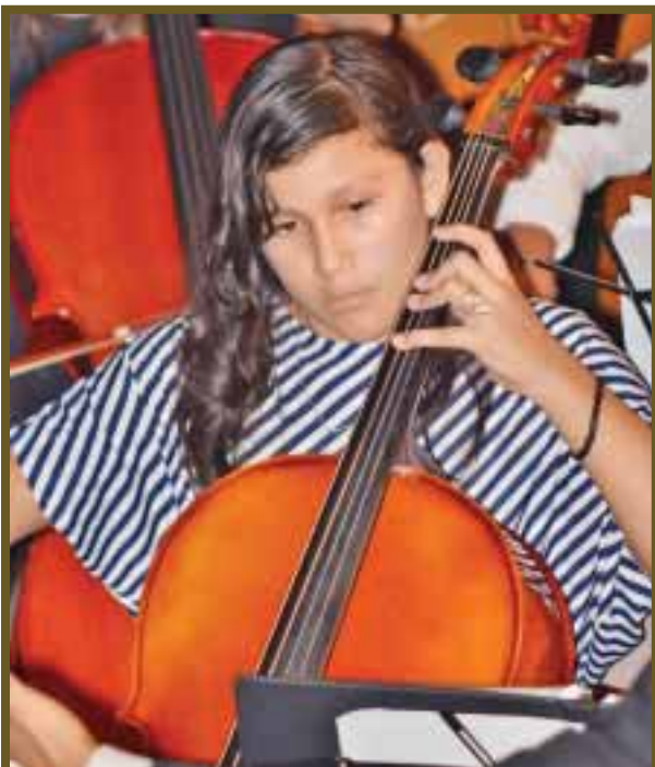
El chelo es uno de los instrumentos muy difíciles de afinar.