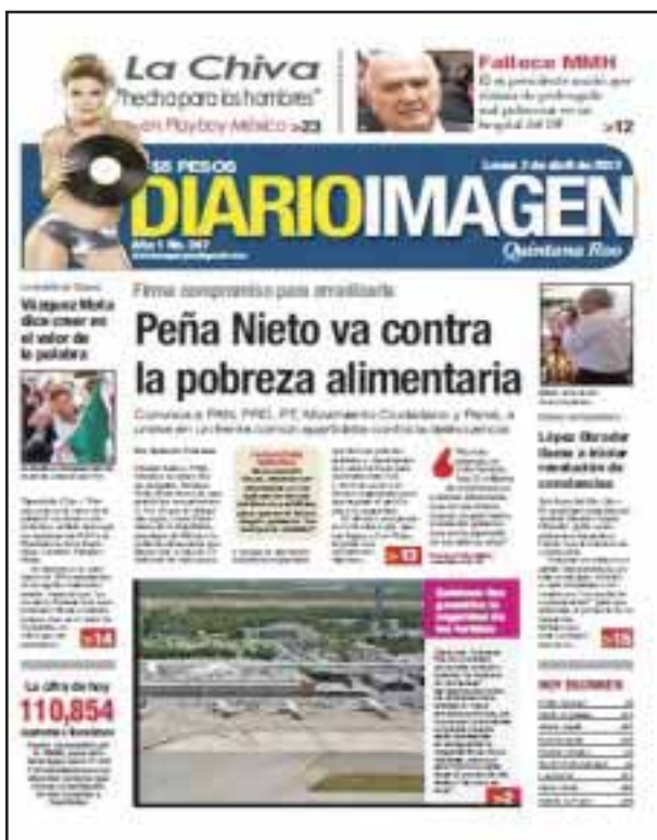
Anunciamos la propuesta del Presidente: "Peña Nieto va contra la pobreza alimentaria"; también el fallecimiento del ex presidente Miguel de la Madrid.