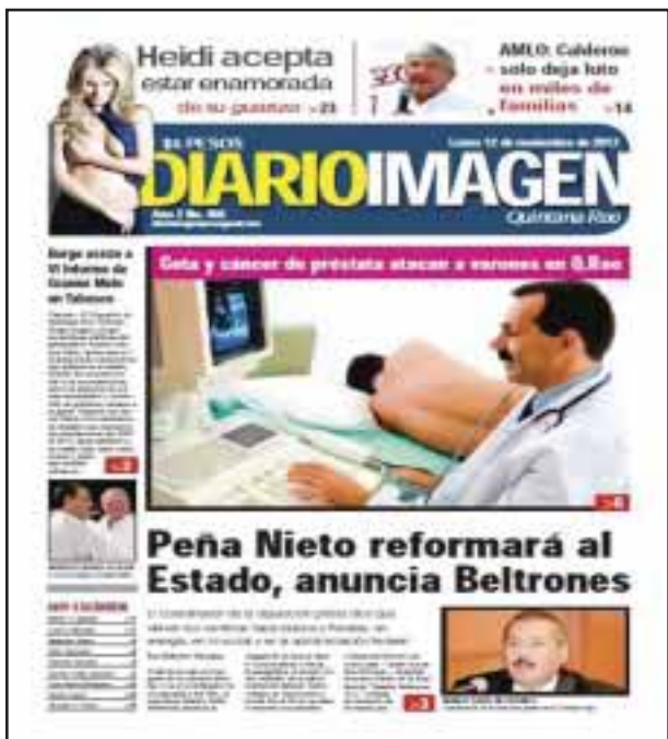
Para el 12 de noviembre publicamos: "Gota y cáncer de próstata atacan a varones en Q. Roo". Rinde Andrés Granier su VI informe de gobierno en Tabasco.