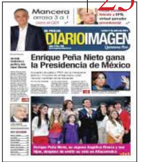
El 2 de julio publicamos a los ganadores de la contienda electoral del 1 de julio en nuestra edición 310.