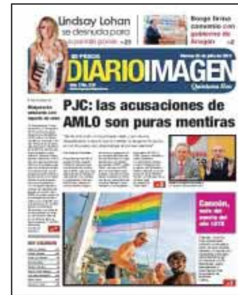
Cancún fue sede del evento anual de la sociedad LGTB el 20 de julio.