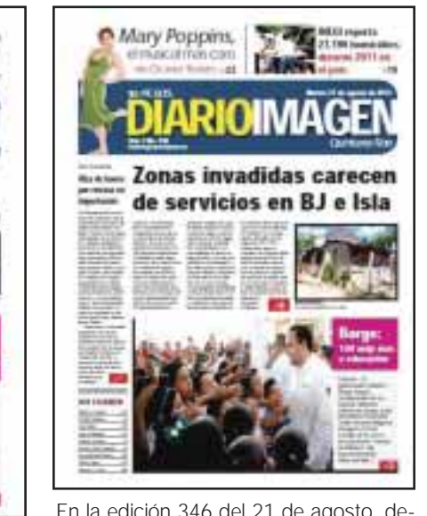
En la edición 346 del 21 de agosto, denunciamos que las "zonas invadidas carecen de servicios en BJ e Isla Mujeres".