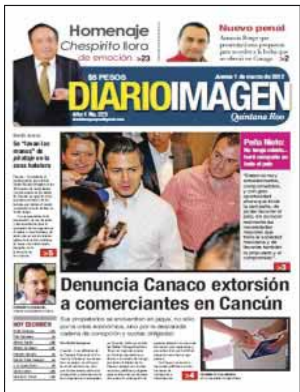
El 1 de marzo, la Canaco denunció extorsión a comerciantes de Cancún. Rinden homenaje a "Chespirito".