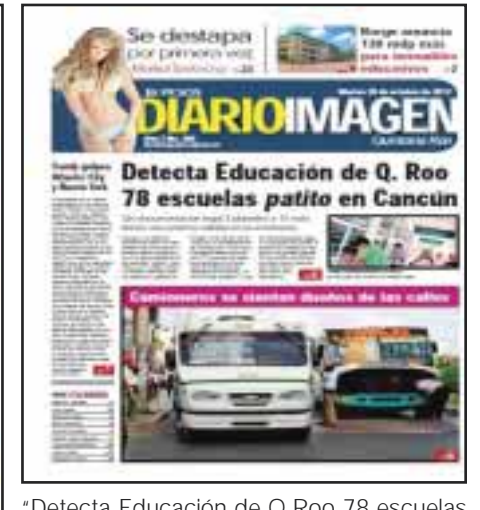
"Detecta Educación de Q. Roo 78 escuelas "patito" en Cancún"; también publicamos el abuso de los transportistas en la edición 396 del 30 de octubre.