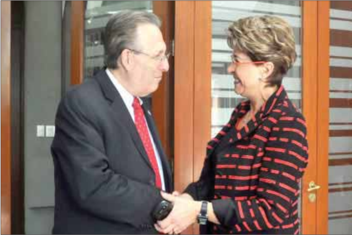
La secretaria de Salud, Mercedes Juan, se reunió con el embajador de Estados Unidos en México, Anthony Wayne, para revisar la agenda sanitaria.