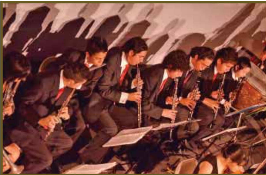
Armonizan flautines el concierto de la Casa de la Cultura.