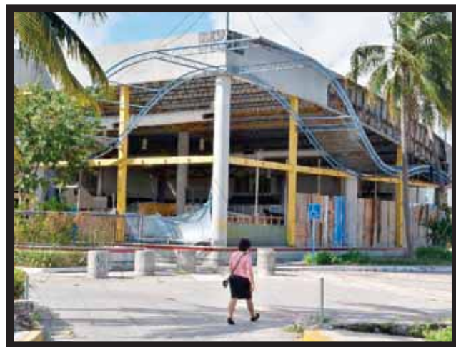
TIENE CANCÚN primer sitio en desempleo.

dores de servicios), coloca al municipio de Benito Juárez, Quintana Roo en un delicado estatus que hace depender a la economía en su conjunto de la demanda de servicios turísticos, apuntan especialistas en urbanismo y economía. >6