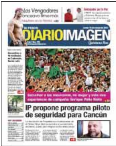
Desde el 14 de mayo la IP propuso programa piloto de seguridad para Cancún.