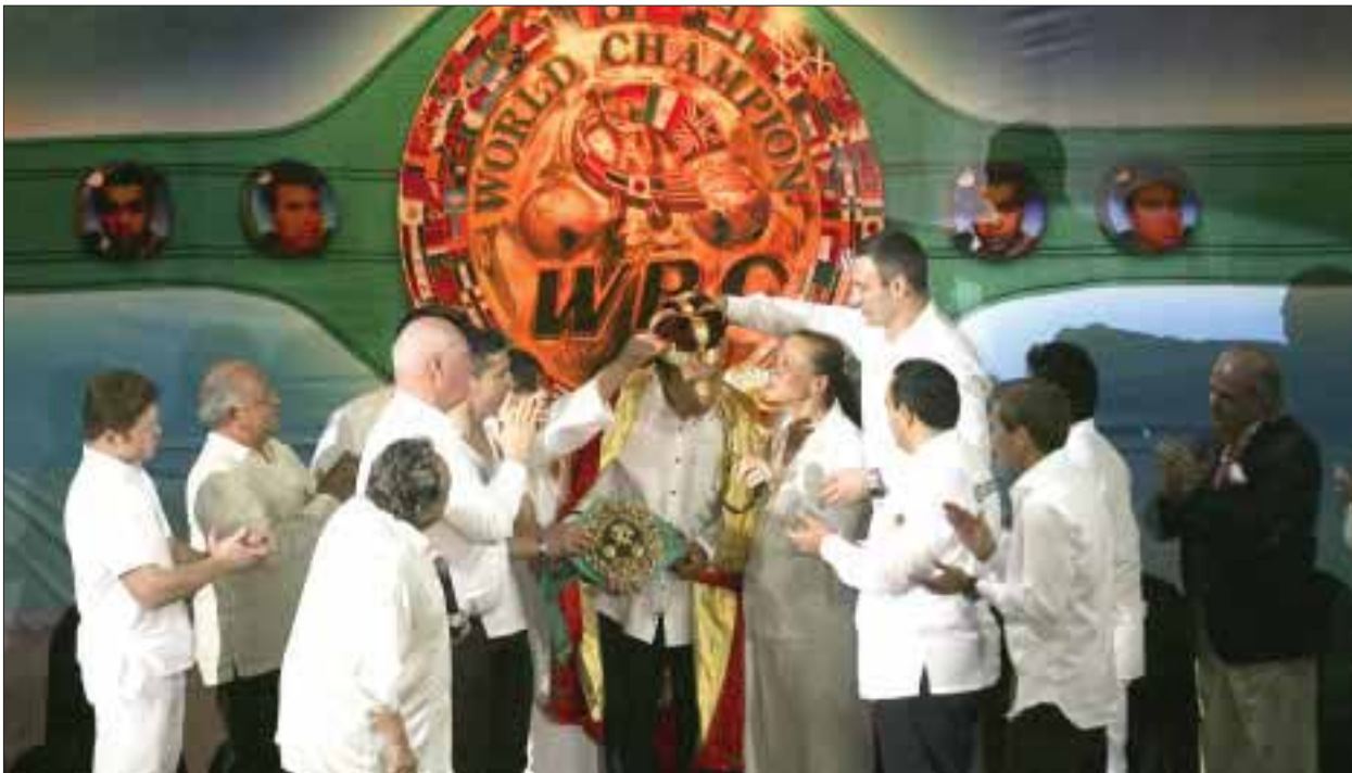
La asamblea anual del CMB coronó "Rey del Box" a Muhammad Ali.