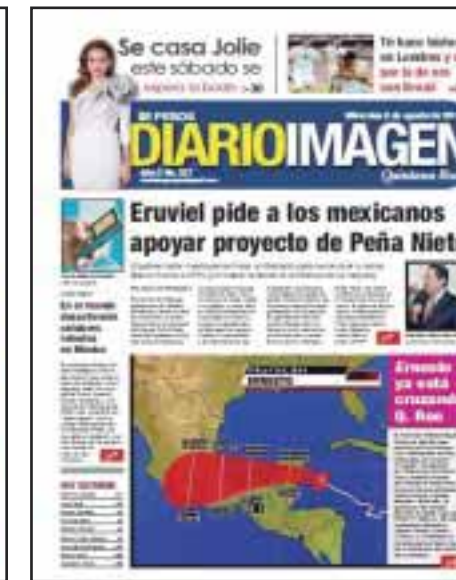
Desde el 7 de agosto, el huracán "Ernesto", categoría 1, impactó el sur del estado.