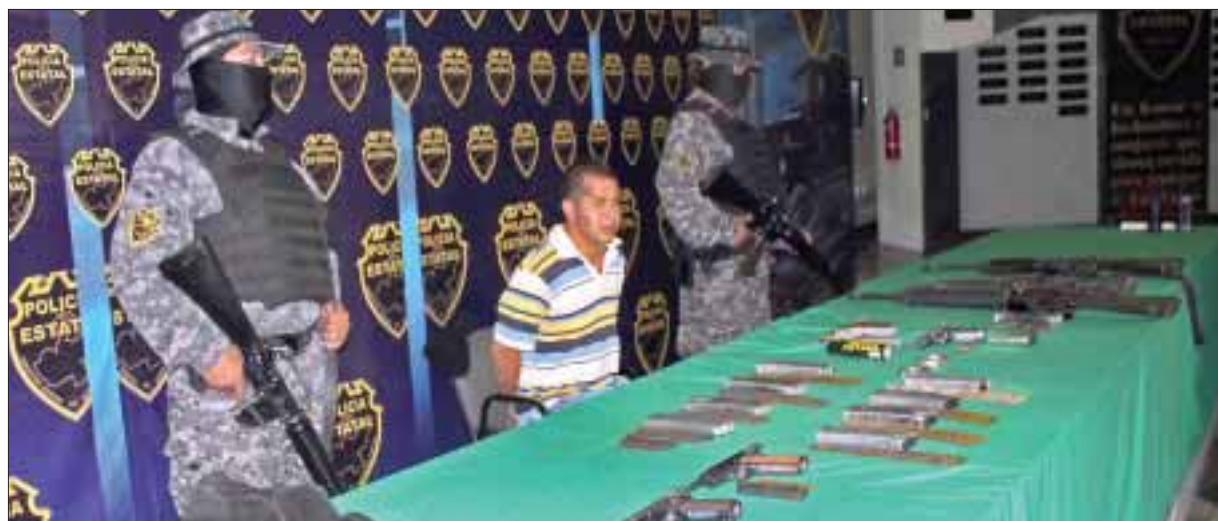
Guadalajara, Jal.- Elementos de la Policía Estatal de Jalisco detuvieron a un presunto integrante del cártel Jalisco Nueva Generación, durante una balacera.

Dijo que durante este año se han incrementado “bastante” los secuestros en esta capital, en los vecinos estados de Morelos y México y en los de Puebla (centro) y Jalisco (occidente), zonas en las que no hay una fuerte presencia de carteles de la droga.