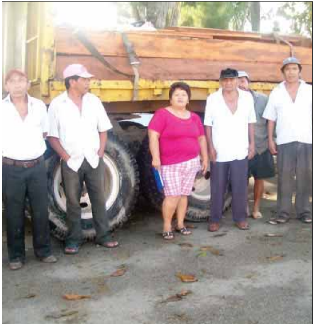
Los ejidatarios de Chunhuhub se oponen a que sigan talando de forma clandestina la selva de la zona maya.

El embarque lo detuvo el comisariado ejidal avalado por la Profepa e inmediatamente se formó una comitiva con los mismos ejidatarios, para que se trasladaran a la capital del estado a verificarlo en esta dependencia federal.