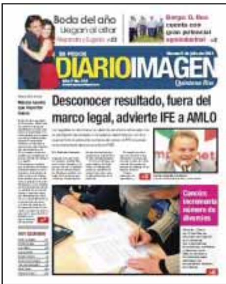
Incrementan los divorcios en Cancún; 5 de cada 10 matrimonios lo padece, dijimos el 6 de julio.