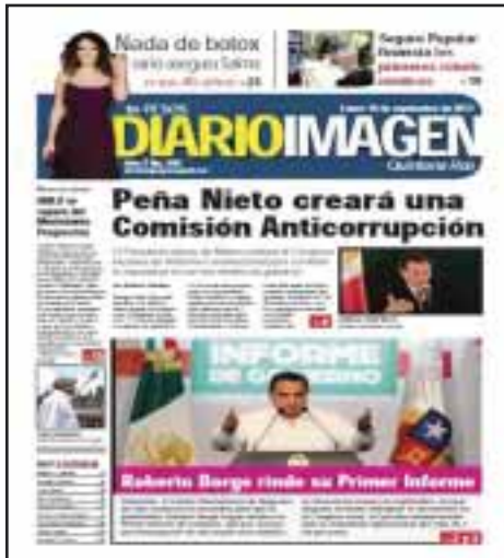
El 7 de septiembre el gobernador Roberto Borge rindió su primer informe de gobierno, publicado en la edición 360.