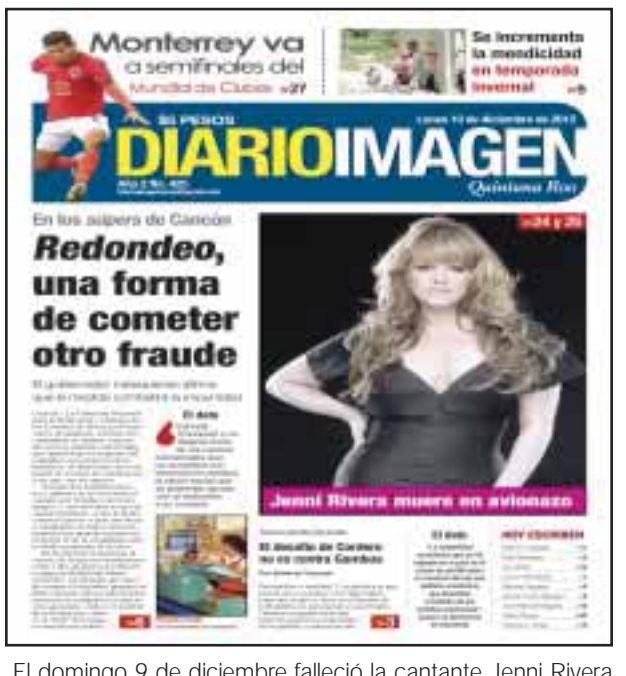
El domingo 9 de diciembre falleció la cantante Jenni Rivera en un avionazo. Redondeo, otra forma de cometer fraude y se incrementa la mendicidad, fueron nuestros temas de la edición 425.