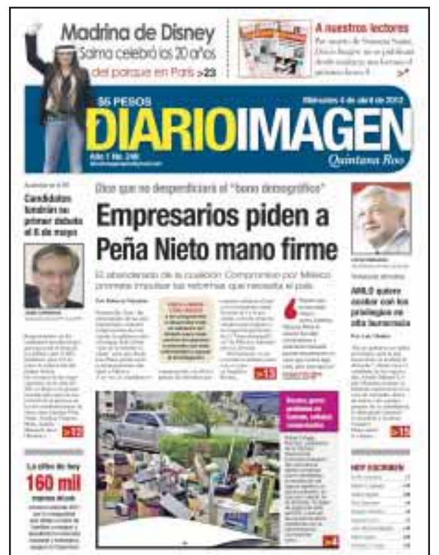
El 6 de abril cumplimos un año en la preferencia de los lectores quintanarroenses.