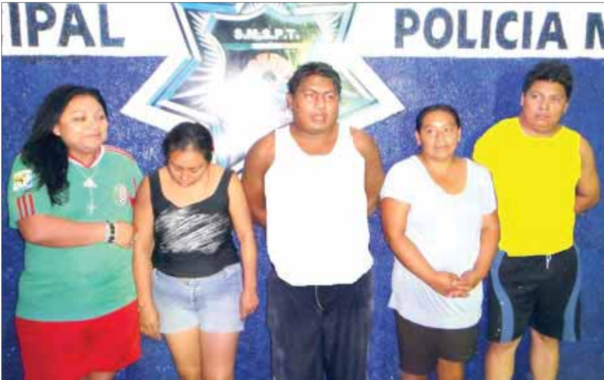
Cinco personas de la región 203, en la colonia irregular Cuna Maya, fueron detenidos por ultrajes a la autoridad.