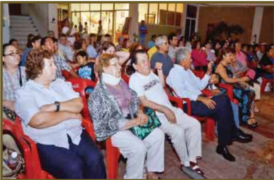
Padres, felices por ver a sus hijos en un escenario.