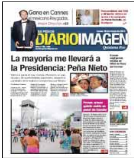
Presos arman el 5o. motin en penal de Cancún, dijimos el lunes 28 de mayo. Denunciaron negligencia médica en el IMSS de Playa del Carmen.