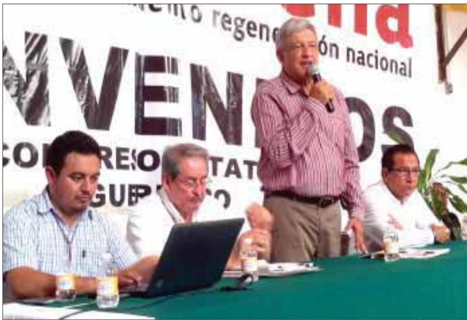
Se realizó el congreso estatal del Movimiento de Regeneración Nacional -Morena- en el estado de Guerrero.

El tabasqueño dice que en caso de ser necesario habrá movilizaciones en toda la República para impedir privatización de Petróleos Mexicanos