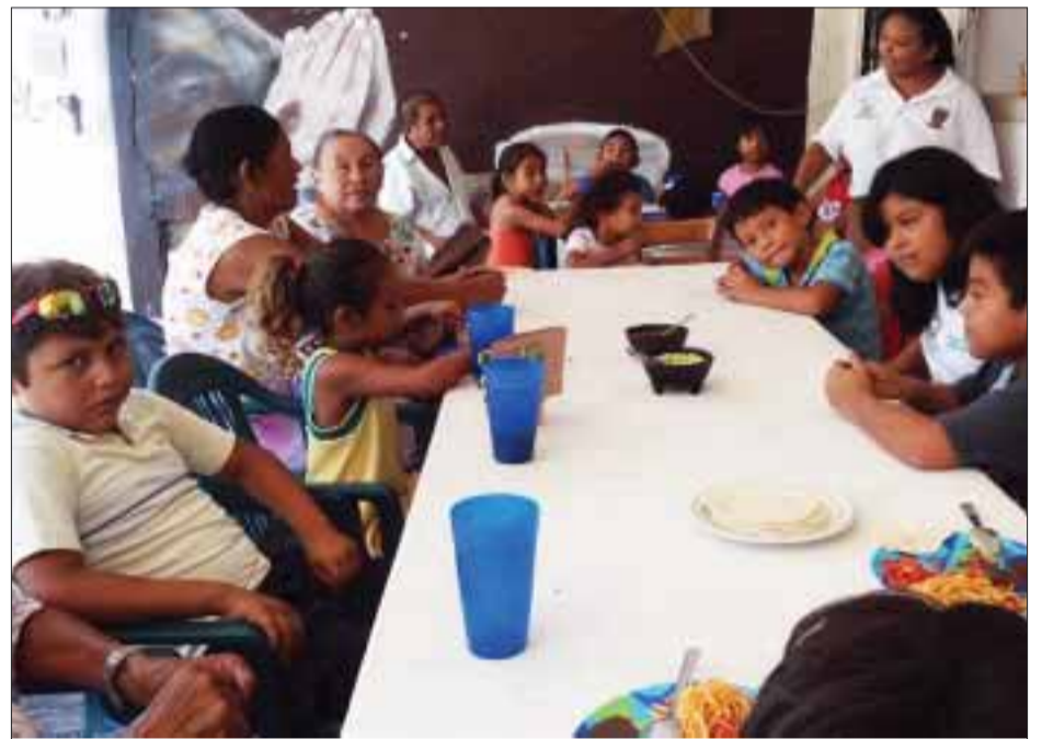
En Cancún, en regiones como la 95, 96 y 99, se canalizaron a 56 niños al comedor de Huellas de Pan, todos con problemas de desnutrición.

En las regiones como la 95, 96 y 99, se canalizaron a 56 niños al comedor de Huellas de Pan, todos con problemas de desnutrición, a través del programa Alimentación para la Educación, reciben la alimentación para incidir en su buena nutrición y en su permanencia y aprovechamiento escolar.