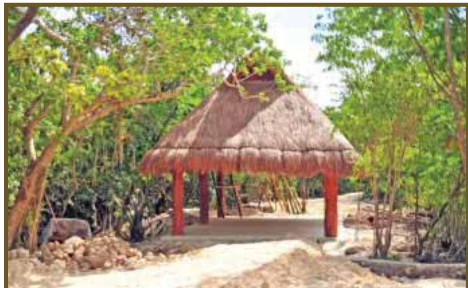
La construcción de palapas se realizó en armonía con el medio ambiente.