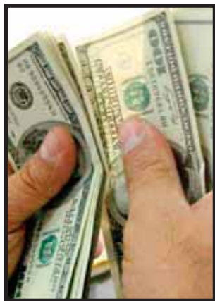
CRECE LAVADO de dinero en México.