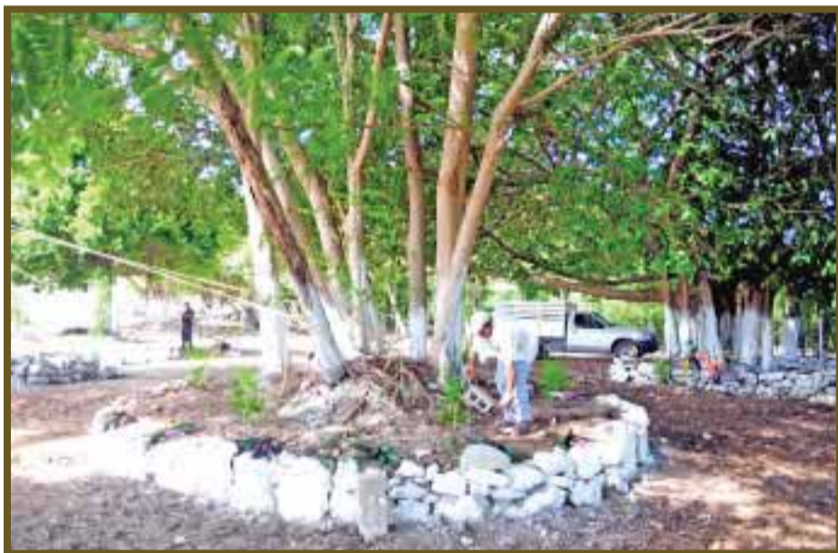
Los árboles endémicos cuentan con protección para su reproducción.