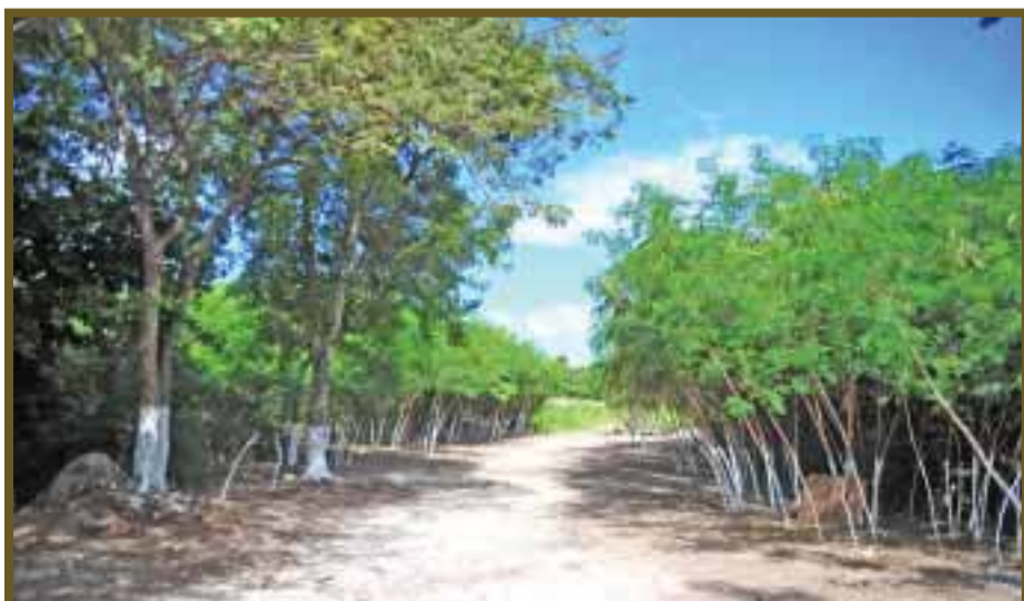
La participación de la sociedad para la reforestación jugó un papel importante.