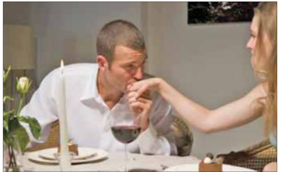
Existe una enorme cantidad de muestras de cortesía que podemos brindarnos unos a otros.

Cómo olvidar aquellas muestras de caballerosidad en los jóvenes y el bello comportamiento de damas en las jo-