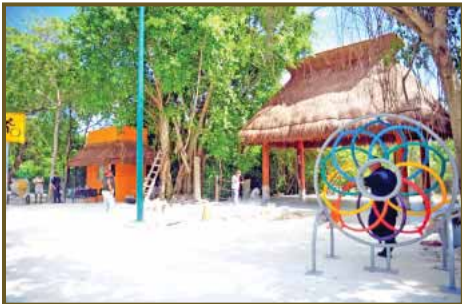
La administración municipal 2011-2013 habilitó espacios para la convivencia familiar.

La acción rápida de la sociedad echó atrás cualquier proyecto y hoy el Ombligo Verde será declarado primera reserva ecológica municipal.