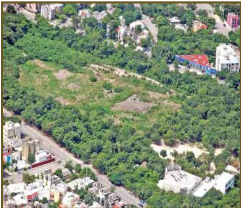
Vista aérea de la reserva ecológica de ocho hectáreas; en la esquina inferior derecha se observa la construcción de la catedral de Cancún.