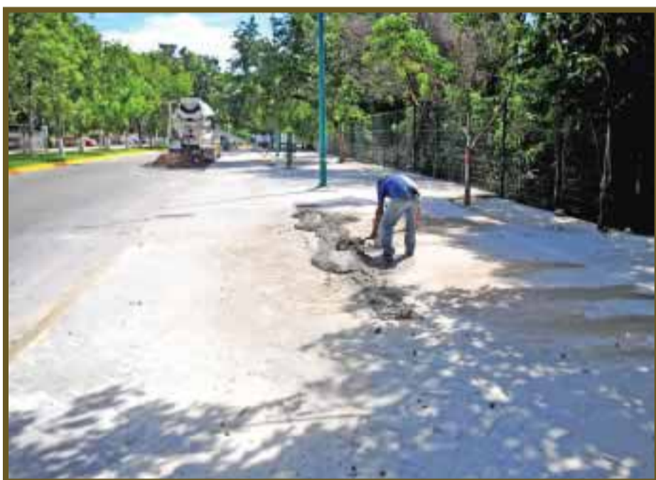
Acondicionamiento de las banquetas alrededor del Ombligo Verde.