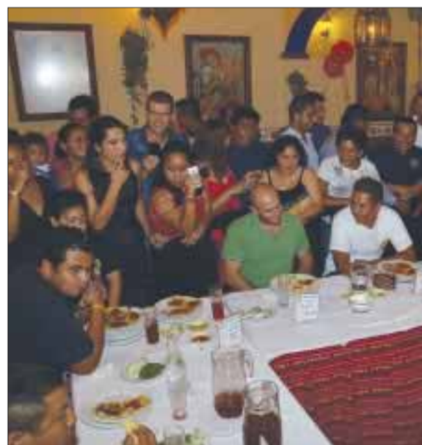
El famoso concurso del taco rompió récord del año pasado.