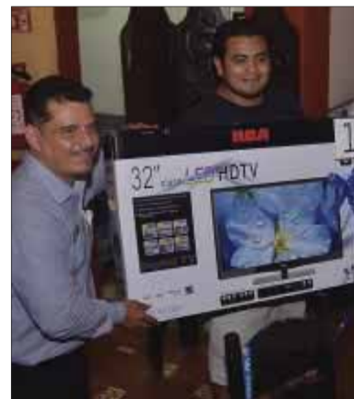
El ganador de la pantalla de plasma de 32 pulgadas se comió 39 tacos en 40 minutos.