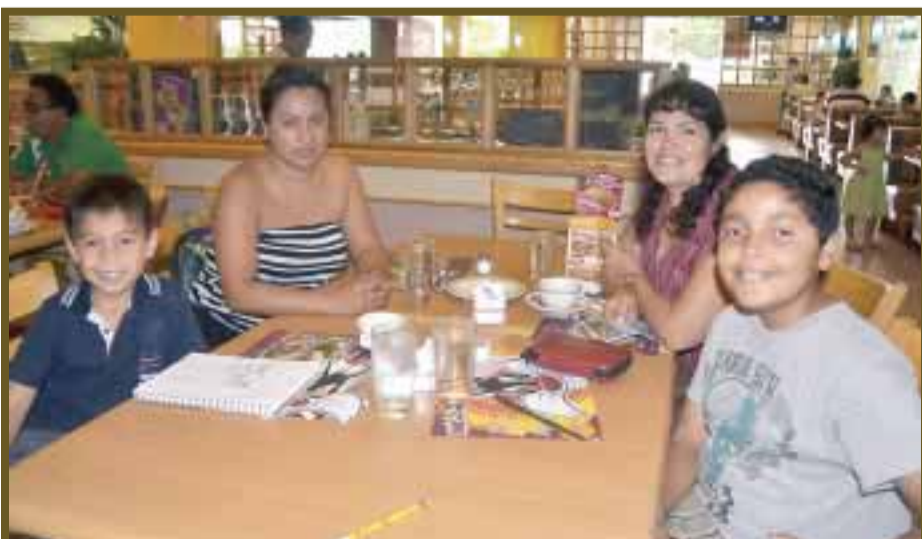
Llenan de felicidad a los hijos unas mamás que los llevaron a desayunar.