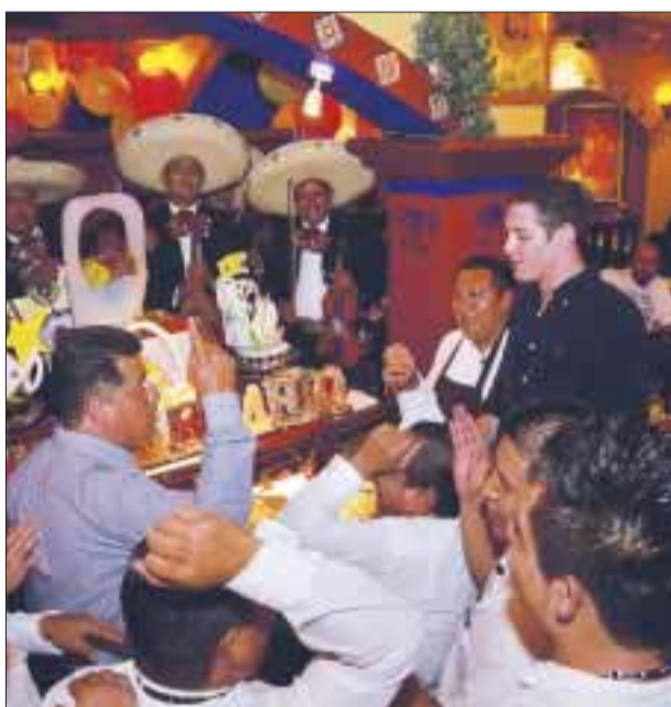
Los empleados dan gracias a Dios por 37 años de servicio.