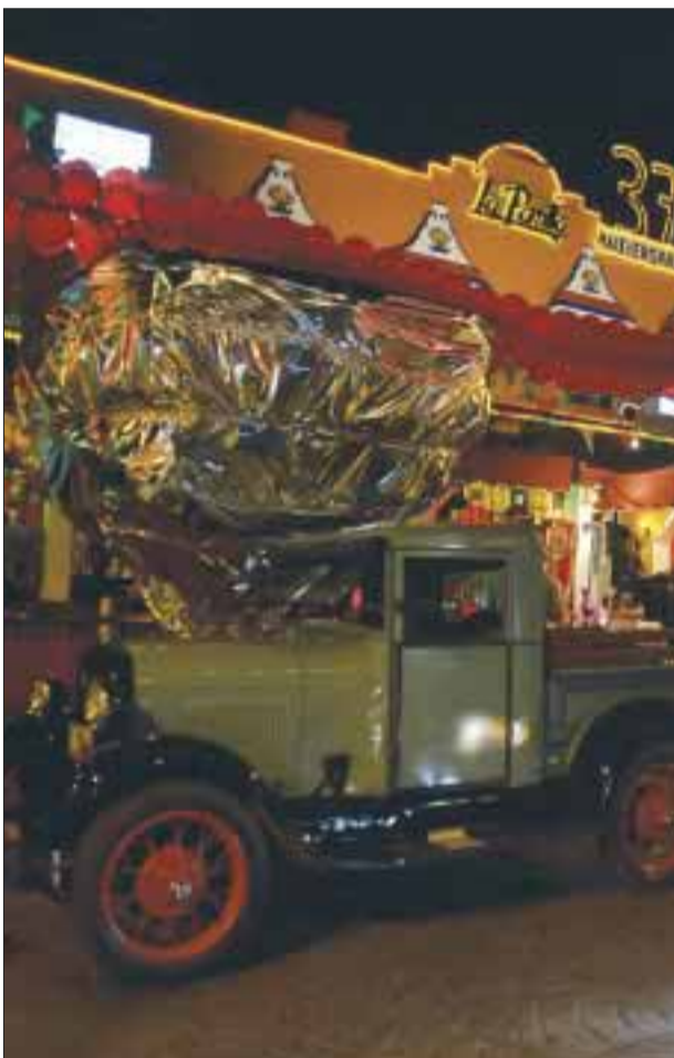
Una camioneta del año 1975 a las afueras del restaurante.

Por Santiago Rodas DIARIO IMAGEN Quintana Roo