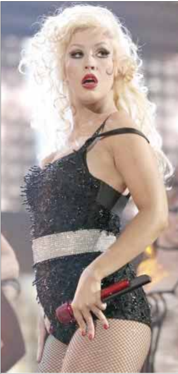
Aún no se sabe si la cantante estadounidense ha aceptado esta seductora oferta gracias a su voluptuoso físico.