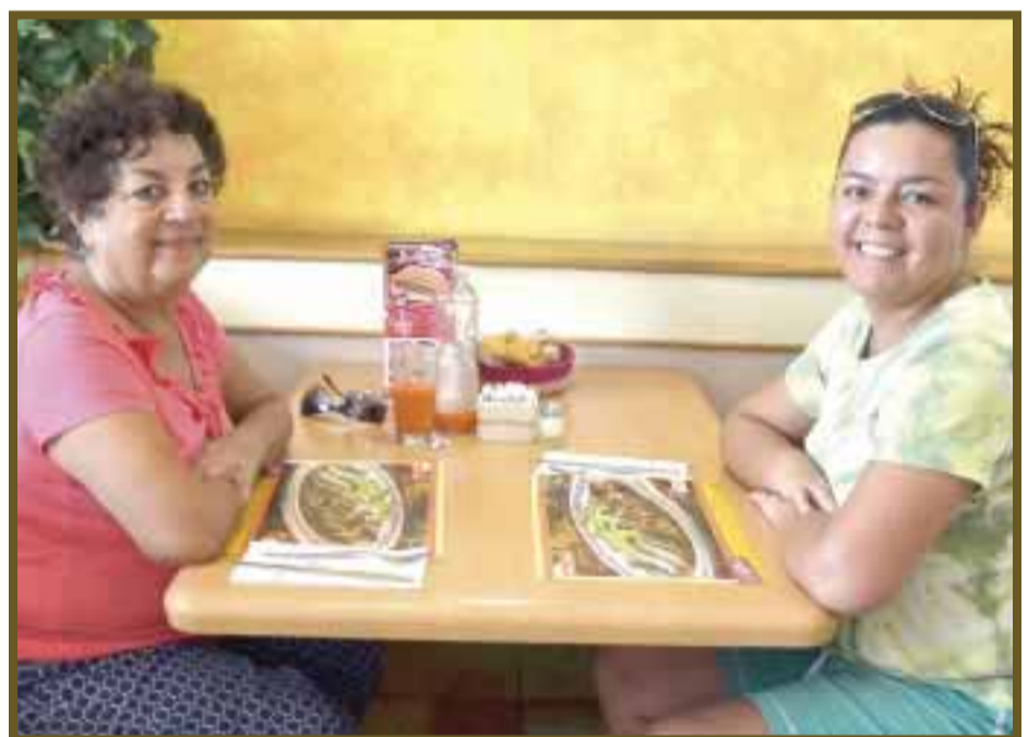
Nos da gusto que después de tantos años de habitar en Benito Juárez haya trabajo.

Nos dijeron que Benito Juárez tiene buena calidad para hacer vida con la derrama económica que el sector hotelero trae, con el turismo y los impuestos que paga el pueblo, la fortaleza de Cancún sigue por sus coloridas aguas y bellos paisajes que el turista busca para relajarse de los problemas que se vive en otros lugares.