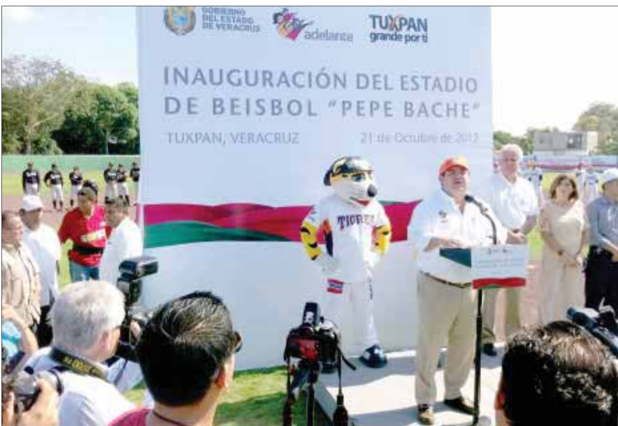
La inauguración de la nueva guarida de la escuadra bengalí estuvo a cargo del gobernador de Veracruz, Javier Duarte.