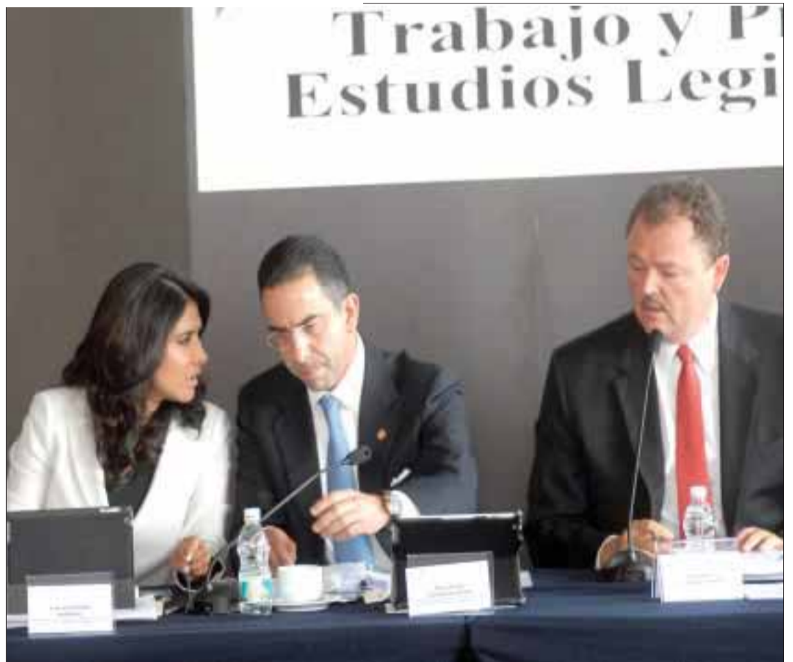
Los senadores Alejandra Barrales, Javier Lozano y Ernesto Gándara, integrantes de la Comisión del Trabajo del Senado.

También senadores del PRD confirmaron la presencia del ex candidato presidencial de las izquierdas, Andrés Manuel López Obrador, quien visitaría en este recinto a los legisladores que conforman el Frente Legislativo de Izquierda (PRD, PT y MC) para exponer sus puntos de vista sobre reforma laboral.