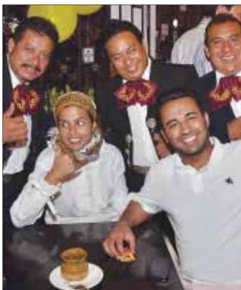
Invitados libaneses festejan con mariachis el aniversario.