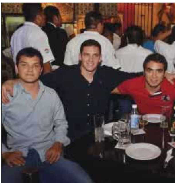
Invitados gozan del ambiente.