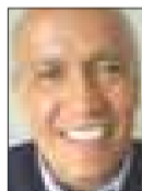
A Sebastián Lerdo de Tejada

Siempre es bueno tener presente esas palabras que Jesús Reyes Heróles expresó siendo presidente del Comité Ejecutivo Nacional del Partido Revolucionario Institucional, allá en la primera mitad de los años setenta: “Respeto para quienes, pensando distinto a nosotros a través de partidos políticos, tratan de disputarnos la confianza del pueblo. Respeto también para aquellos que pensando distinto a nosotros, no han querido o no han podido organizarse en partidos políticos”.