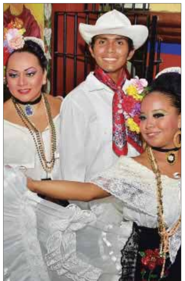
Animando la fiesta con muestras de nuestro folclor.