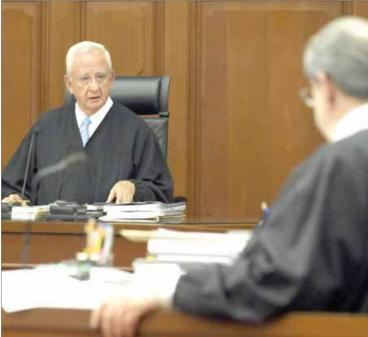
La Sala Superior de la Suprema Corte de Justicia de la Nación emitió un dictamen que valida la intervención de la Cofetel en casos de tarifas de interconexión.