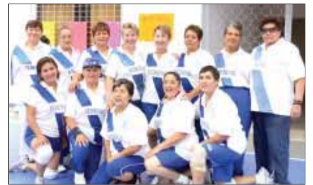
Practicantes de cachibol de 12 estados de la República participarán en la III Copa Quintana Roo de ese deporte.

La inauguración será el próximo 16 de noviembre, a las 20:00 horas, en la Palapa principal del hotel Plaza Caribe.