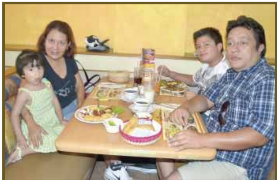
Con un bello y romántico Caribe nos quedamos: la familia Minor.