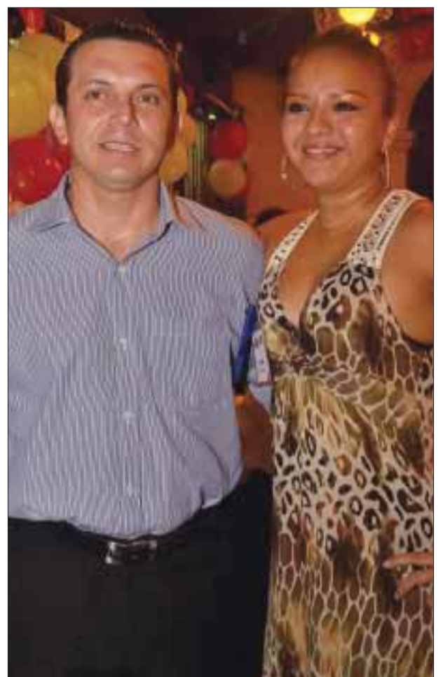
Trabajadores de La Parrilla, en el festejo.

Todos ellos recibieron la cortesía de la casa y de recuerdo una camiseta con el logotipo del restaurant La Parrilla.