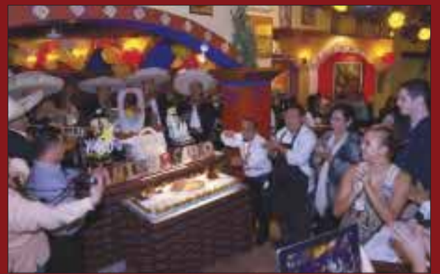
Cantaron "Las mañanitas" por el aniversario 37 de La Parrilla.