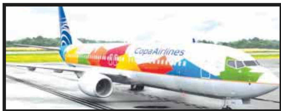
Un Boeing 737-800 Next Generation despliega un diseño alusivo al Biomuseo.