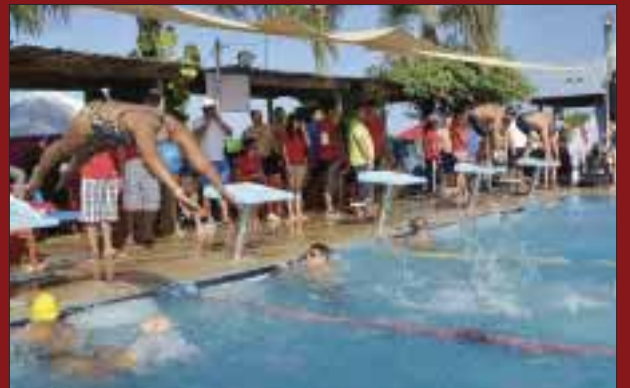
Una de las salidas.