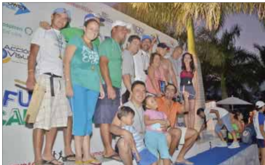
Casablanca, campeones de natación de la categoría master.