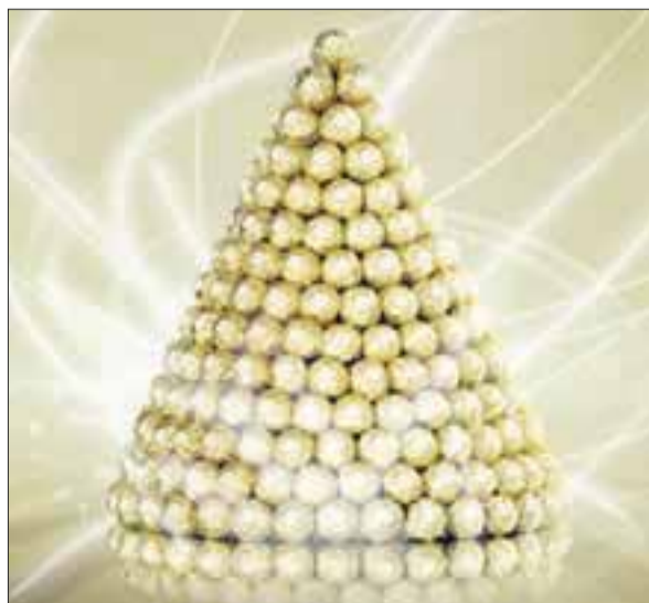
El árbol será un pino de 12.5 metros de alto que pretende proyectar los valores que sostiene la casa "Ferrero Rocher".

La jalisciense precisó que anotará en su respectivo listón tener a su familia cerca, como ha sido hasta ahora, pues considera que a lo largo de toda su vida siempre ha representado lo más importante para ella y regresar a lo que tú eres, a tus valores, a tu familia, a la gente que siempre está contigo "y ese será mi deseo", dijo la ex Miss Universo.