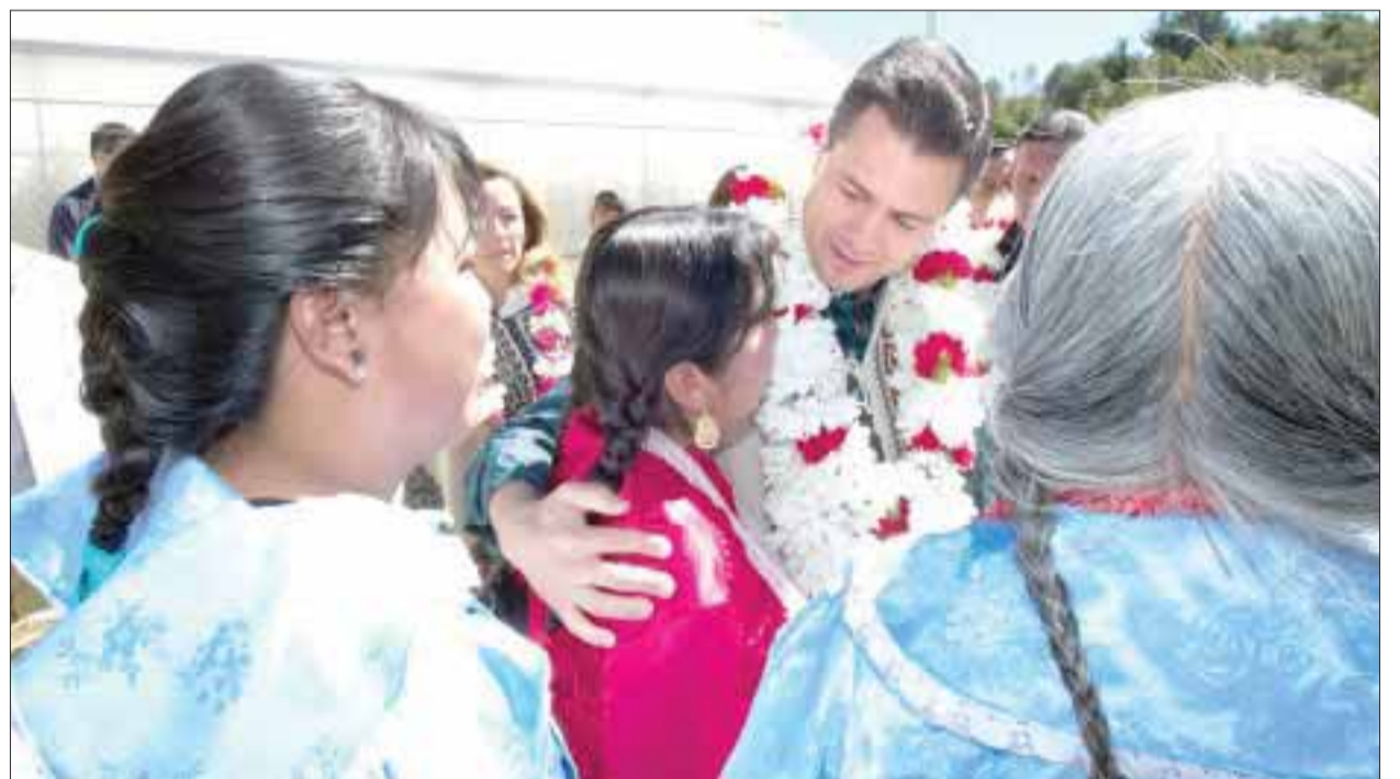
El presidente electo de México, Enrique Peña Nieto, visitó ayer la región mazahua de San Felipe del Progreso, donde reiteró que demostrará con resultados su amor por las etnias.

“No se trata que las decisiones de gobierno se tomen detrás del escritorio, hay que