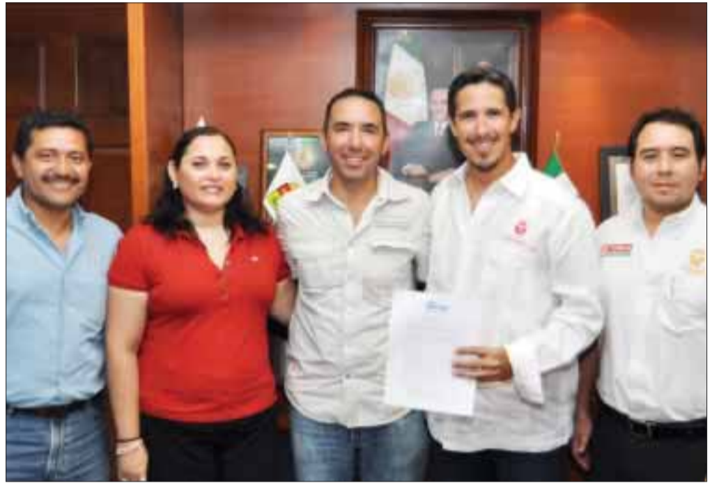
El ayuntamiento atenderá las solicitudes de los organizadores para garantizar un espectáculo de primer nivel.

El alcalde destacó que por parte de su administración, dará seguimiento a las solicitudes de los organizadores del Ford Iron Man 2012, que de nueva cuenta generará una importante afluencia de visitantes, que se estima en 12 mil, lo cual se traducirá en beneficio de los diferentes sectores de la economía local, sobre todo porque esta competencia se realiza al final de la llamada temporada baja.