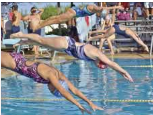
Mujeres que brillaron la competencia.