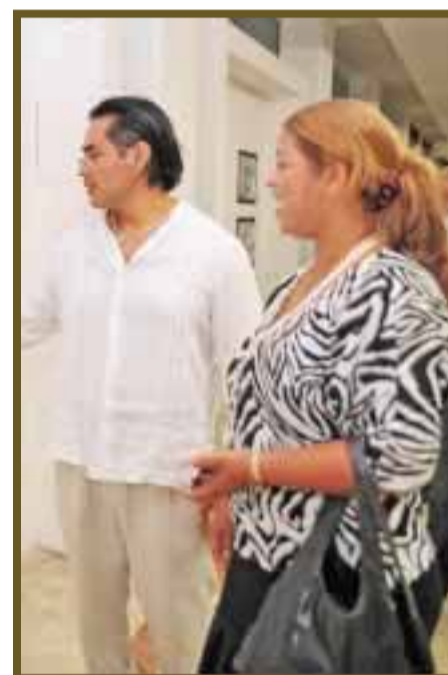
Nutrida asistencia a la exposición.