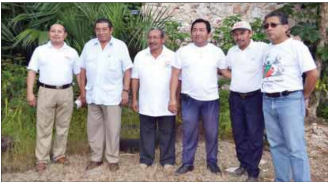
Autoridades, durante la entrega de útiles escolares.

El compromiso que tiene la Comisión para el Desarrollo de los Pueblos Indígenas (CDI) con los jóvenes es mayúsculo.