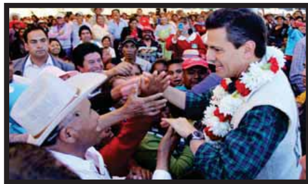
ENRIQUE PEÑA NIETO, con las etnias mazahuas en Edomex.