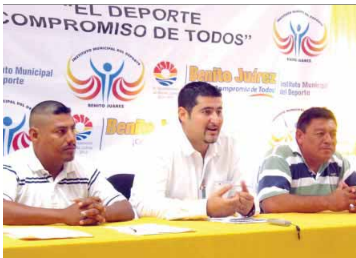
Arranca con mucha fuerza la primera escuela de softbol en el campo “El Torito” Valenzuela.