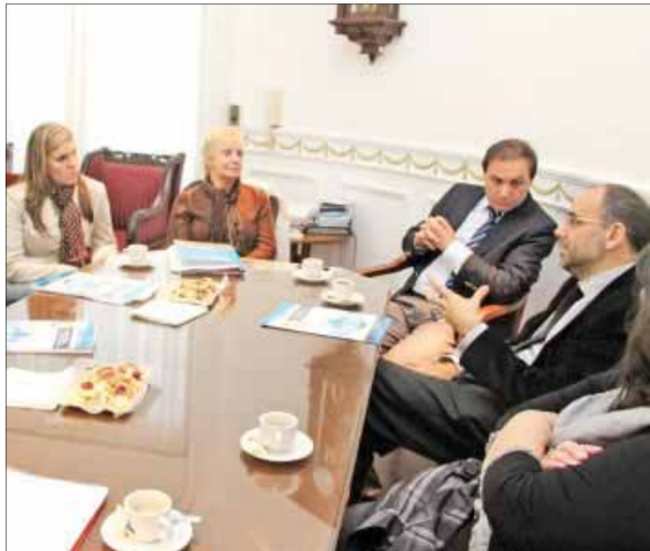
Todos los valores son igualmente importantes

Realicémosnos un análisis personal y veamos cuán firmes están en nosotros o determinemos en cuáles podemos estar fallando. Todos los valores son igualmente importantes y para conocerlos más a fondo, ire-