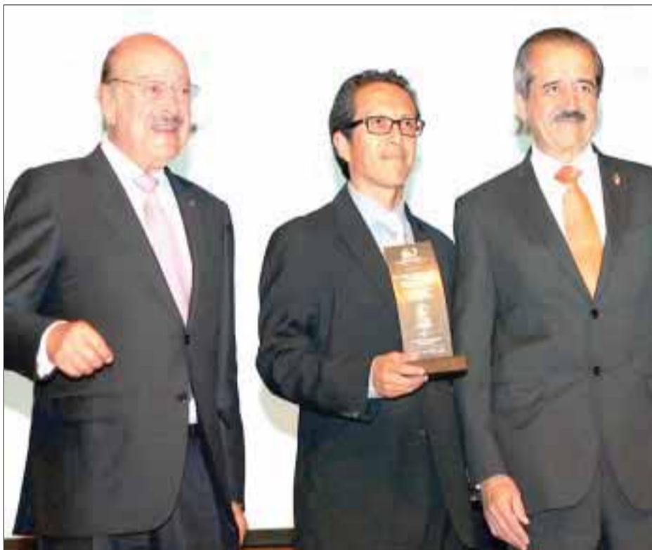
El secretario de Educación, José Ángel Córdova Villalobos, informó que avanzan las negociaciones con normalistas michoacanos, problema que no heredará a su sucesor.

El titular de la SEP afirma que ya se negocia con los estudiantes, por lo que hay confianza en pronta solución