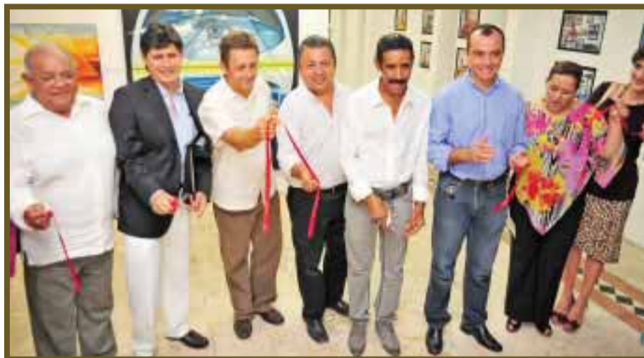
La muestra pictórica abundó sobre la vida de los cubanos en el municipio de Benito Juárez.