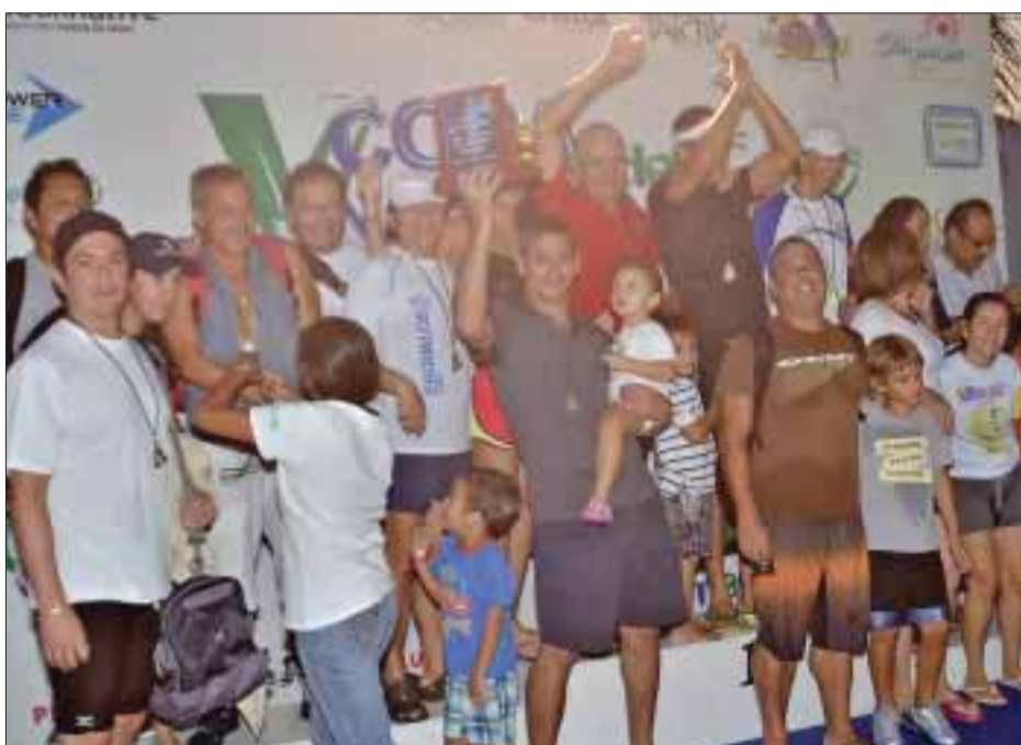
El equipo del segundo lugar, Esqualos St. John's.