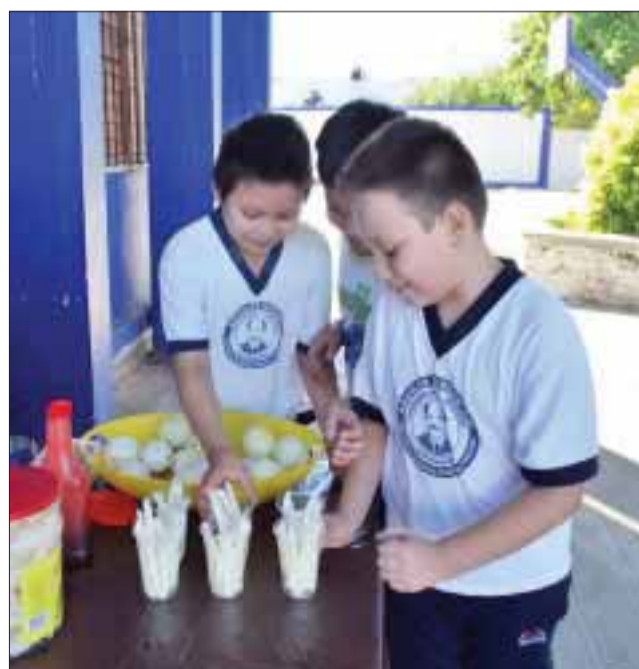
Advierte Cofepris que podría haber amonestaciones y hasta suspensión.