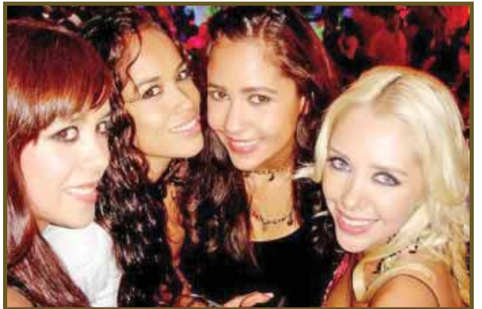
Chicas guapas posaron para la lente.