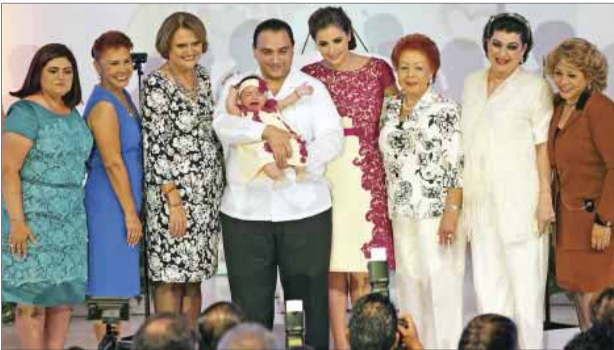
Las ex presidentas del DIF acompañaron a la familia Borge-Zorrilla.

En esta primera etapa, he puesto lo mejor de mí, guiada por un deseo de servir. Hoy, frente a ustedes, reconozco con gran emoción, que estar al frente del DIF-Quintana Roo, ha calado hondo en mi corazón y ha profundizado el amor por mi estado, por lo nuestro, por esta bella y generosa tierra quintanarroense.