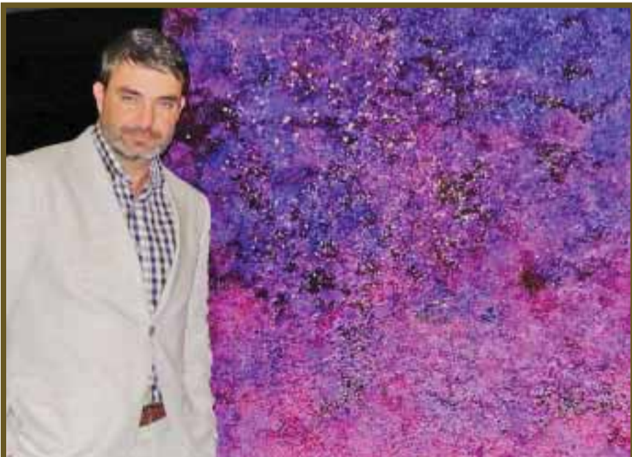
El actor Mauricio Isla, posando con una de las pinturas del artista.