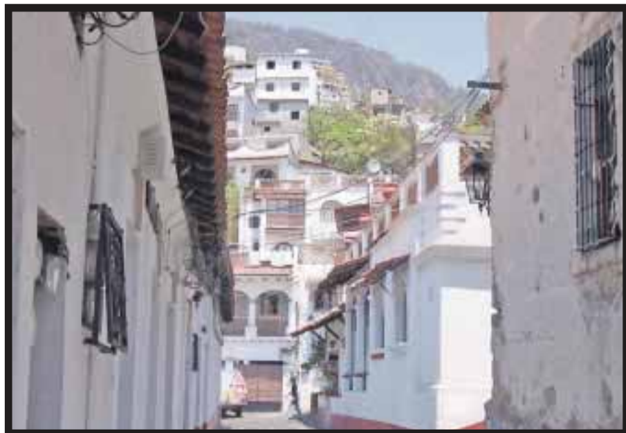
Taxco, sede del Down Hill 2012 .

nacionales e internacionales, y será un espectáculo sin precedentes en México, además que tendrá una bolsa de más de 10 mil dólares en premios. El primer lugar de la competencia obtendrá 4 mil 500 dólares; el segundo, 3 mil 500 dólares; tercer lugar, mil 500 dólares; cuarto lugar, 800 dólares, y quinto lugar, 400 dólares. Asimismo, se premiará a los competidores mexicanos con una bolsa de 15 mil pesos en premios, del tal manera que al primer lugar se le entregarán 7 mil pesos; al segundo, 5 mil pesos, y al tercero, 3 mil pesos. En el Down Hill Taxco 2012 se espera la participación de 40 atletas, entre hombres y mujeres de todo el mundo, entre los que destacan, Alemania, Estados Unidos, Canadá, Chile, Brasil, Perú, Venezuela y España. Los organizadores calculan podrían llegar 13 mil espectadores, tanto de la República mexicana como del extranjero, quienes disfrutarán del evento a lo largo de la pista de ciclismo extremo. El recorrido iniciará en El Cristo Rey y después los competidores pasarán por los sitios más representativos de la ciudad, teniendo