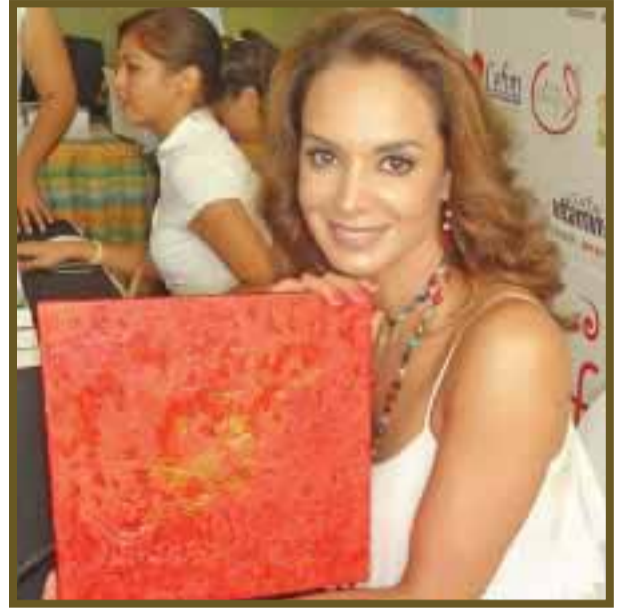
El talento y el arte hacen de esta pintura un recuerdo.