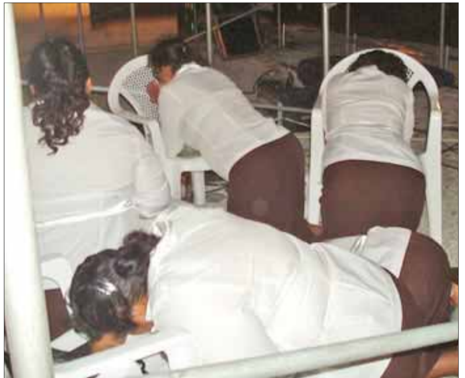
Confesaos vuestras ofensas unos a otros y orad unos por otros, para que seáis sanados.

Una vez que abrían una brecha en el muro, la conquista era mucho más fácil, cuando esto sucedía, inmediatamente se buscaba la forma de tapar