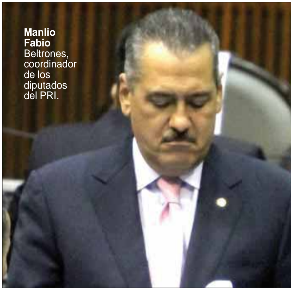
Manlio Fabio Beltrones, coordinador de los diputados del PRI.

“Revisaremos con responsabilidad y cuidado la minuta enviada por los senadores, para evitar que se pierdan los logros alcanzados, mantener el objetivo de fomentar la creación de empleos formales y resguardar los derechos de los trabajadores”, precisó