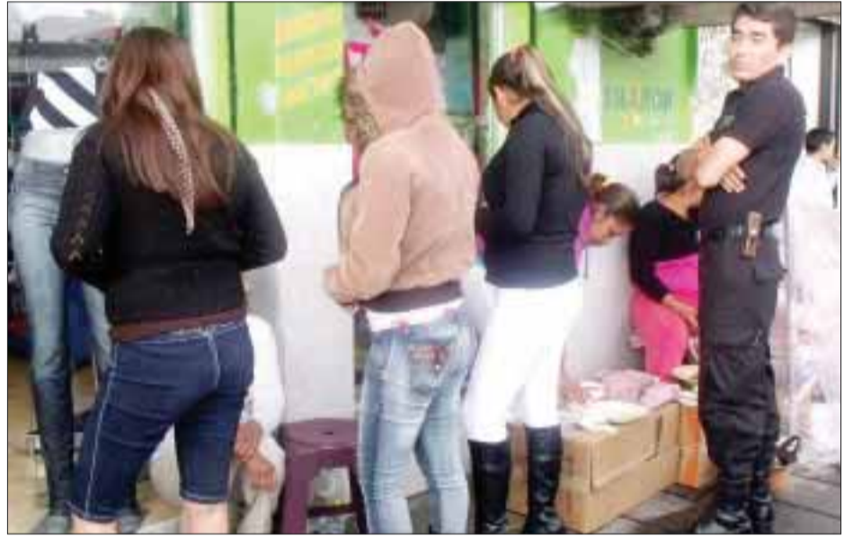
La pérdida de identidad para las mujeres indígenas, es uno de los altos costos que tienen que pagar y son víctimas de trata.

Otros factores determinantes que lleva a las menores y jóvenes estudiantes en las garras de la Red de Trata de Personas, son los embarazos tempranos, la falta de orientación, la deserción, que las desmoraliza y hunde en depresión.