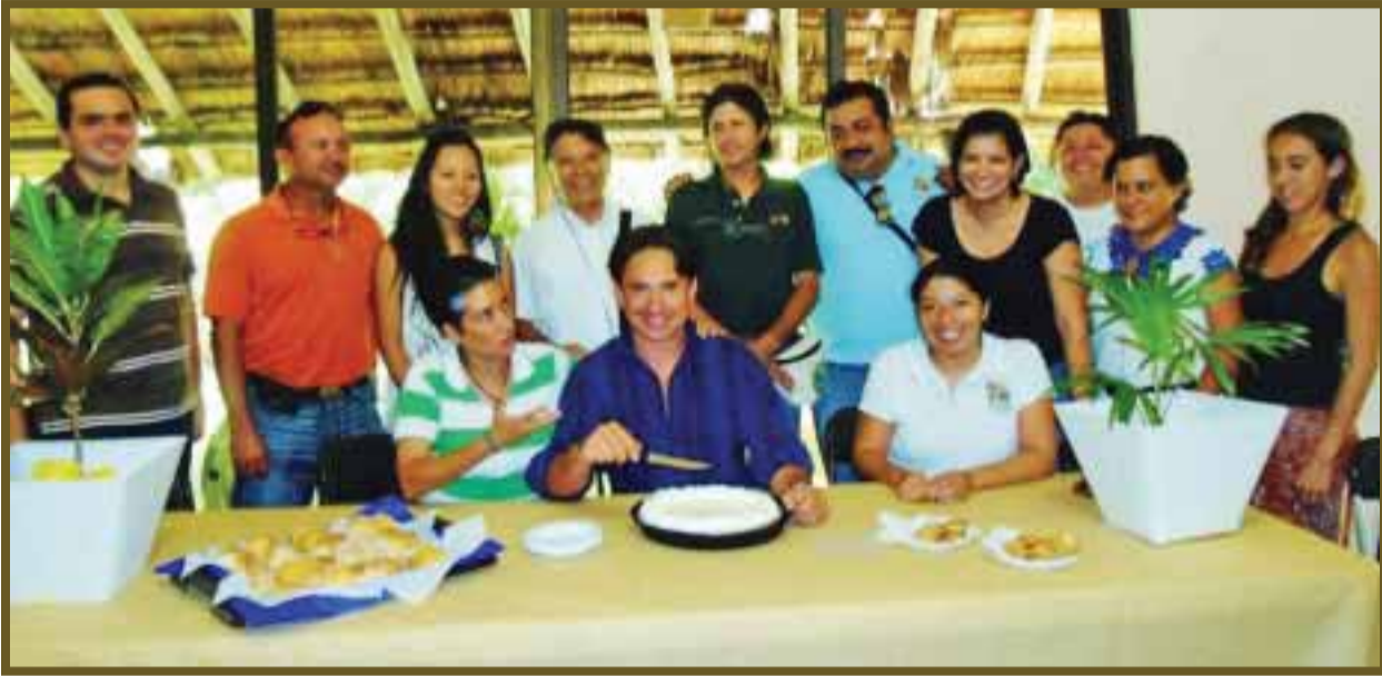
Festejando con amigos.