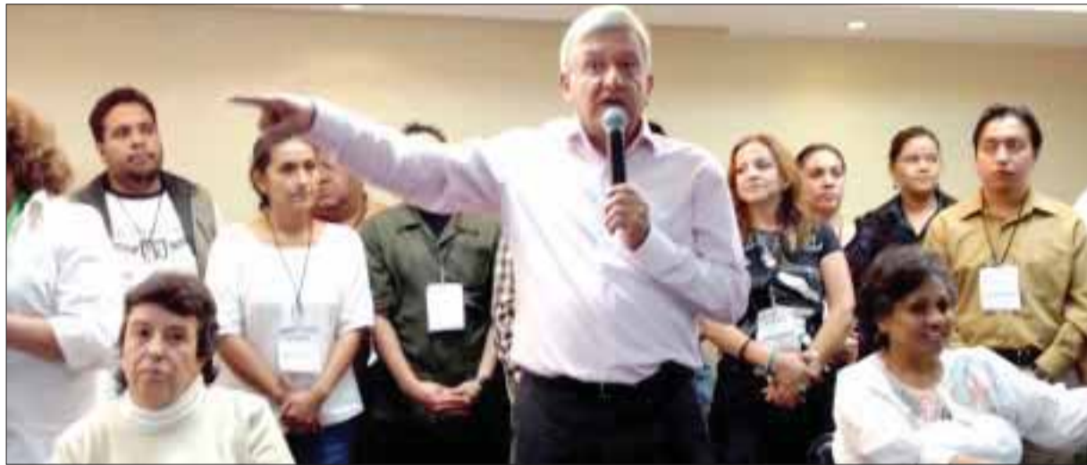
El ex candidato presidencial, Andrés Manuel López Obrador, insistió ayer que el PAN y el PRI subirán el IVA a 22 por ciento.