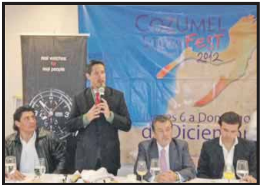
En la presentación del Scuba Fest , en Cozumel.

documentales, safari, conciertos, recorridos, por tercera ocasión el concurso Photo Shoot Out , Muestra gastronómica, con la participación de 13 restaurantes y se buscará romper un Récord Guinness : 12 buzos voluntarios con capacidades diferentes realizarán 15 inmersiones antes de lograr la meta que es de 120 metros de profundidad. Al hacer uso de la palabra, el presidente municipal destacó que San Miguel de Cozumel, nombre oficial de la isla, celebrará el próximo 21 de noviembre 163 años de su fundación y habrá una gran celebración que se extenderá al Festival Scuba , que inicia el 6 de diciembre. “Cozumel es meca del buceo, lugar más seguro y con el arrecife más grande del mundo y el primero en América Latina, además de ser área natural protegida”, el alcalde. Por su parte, el presidente de la Coparmex Cozumel, indicó que con el festival se pretende incrementar en un 15% los niveles de ocupación hotelera y “alcanzar los 2 mil visitantes, con una estadía mínima de tres noches, objetivo que no es sencillo”. Explicó que dentro de la estrategia para reposicionar al destino, después de perder conectividad