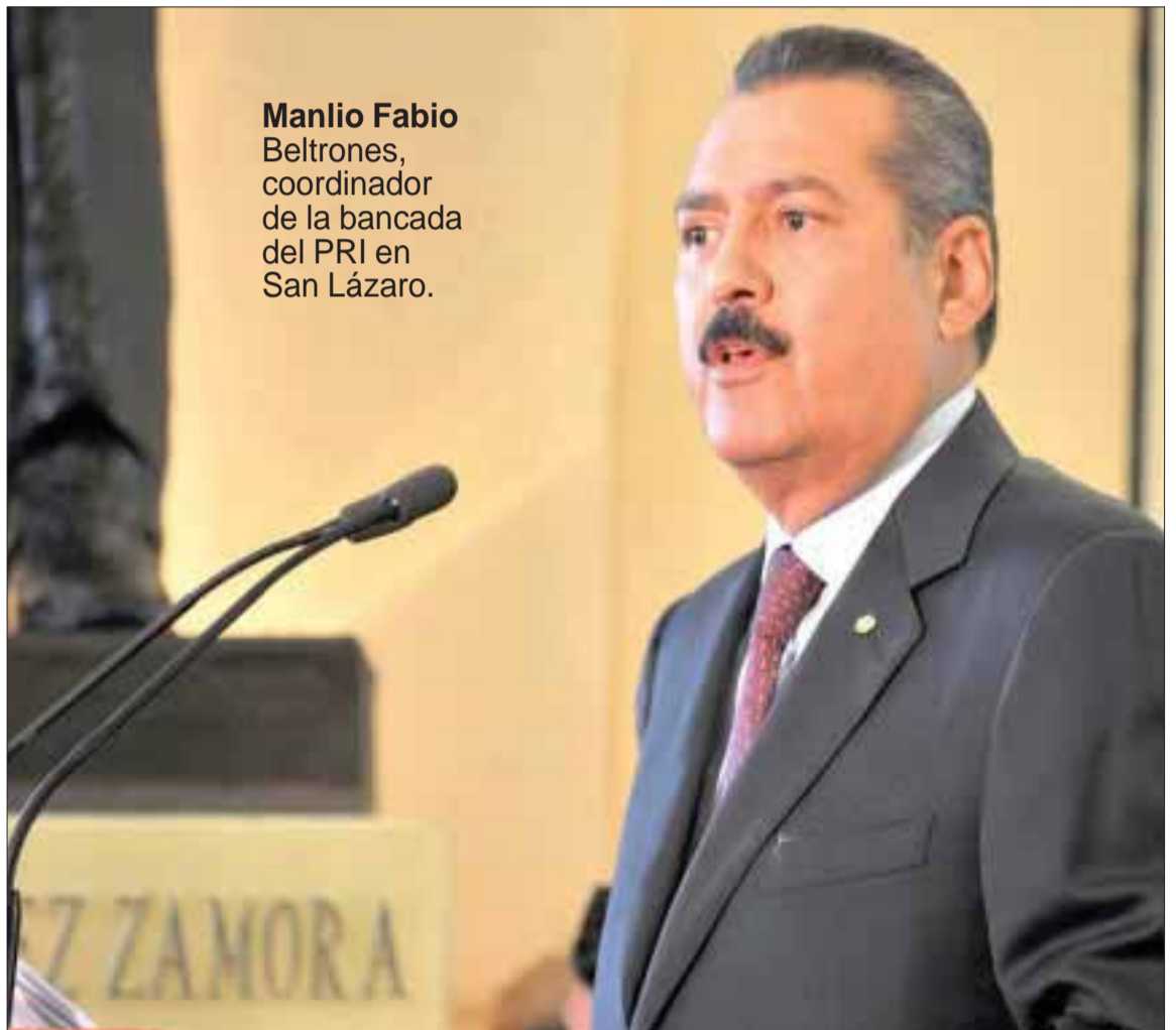
Manlio Fabio Beltrones, coordinador de la bancada del PRI en San Lázaro.

Interrogado sobre la eventual conformación del frente PAN-PRD en el ámbito legislativo, el diputado reviró: "El PRI y el Verde también lo tienen. Nosotros nos reunimos de forma cotidiana, un servidor con el diputado Beltrones, dirigencias nacionales, con el equipo de transición, es muy respetable. Nosotros tenemos 241 votos y esos 241 votos en trabajo y en colaboración con el equipo de transición y, a partir de diciembre, con el presidente Enrique Peña Nieto".