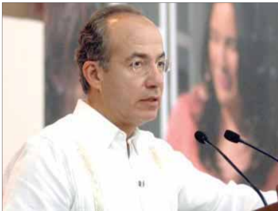
El presidente Felipe Calderón consideró que las adicciones son la esclavitud del siglo XXI y llamó a combatirlas.

Al participar en el Primer Encuentro Nacional de Centros Nueva Vida, dijo que "en nuestro siglo, en particular las drogas han sido la causa de millones de vidas segadas tempranamente, así como de múltiples tragedias familiares e historias de dolor en general"