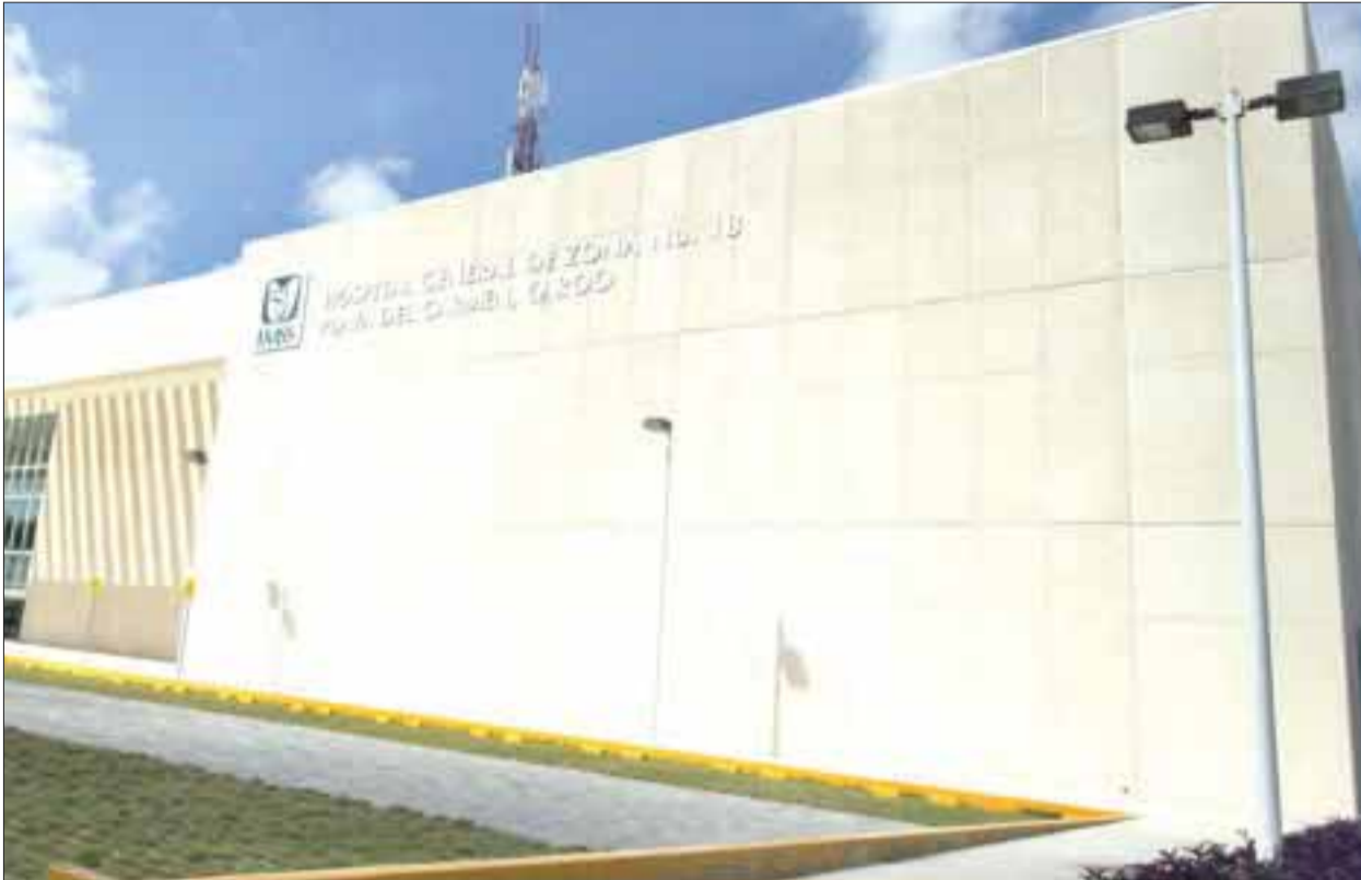
Este es el nosocomio del Seguro Social de Playa del Carmen, donde trabajaba la víctima de violación.