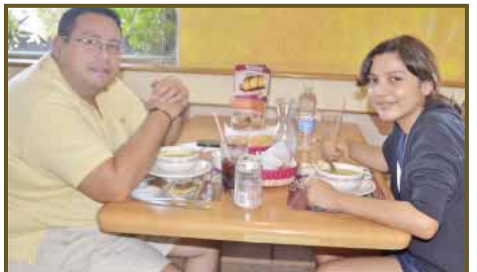
Conviviendo con su hija el señor González.