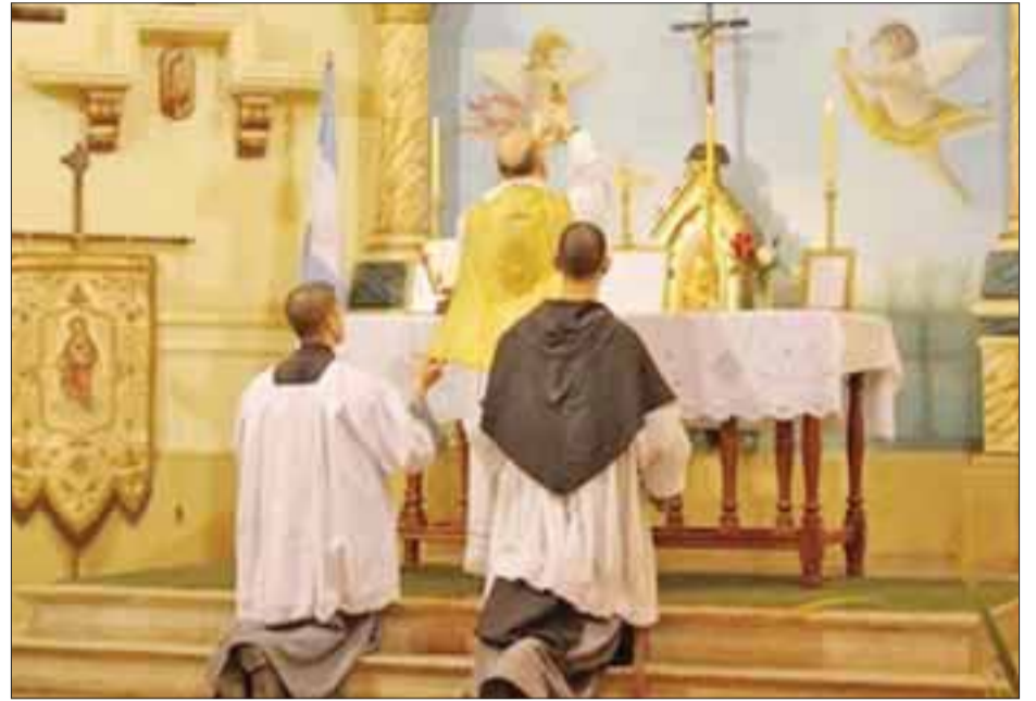
La base bíblica para el ministerio de intercesión del creyente es nuestro llamado como sacerdotes de Dios.

Otros, quienes sienten un llamado especial de Dios sobre sus vidas para interceder, se sienten confundidos y preguntan: “¿Cuál es mi lugar en el cuerpo si no existe el don de la intercesión? ¿Cuál de los dos tiene razón? Ambos la tienen. Desde el punto de vista del ministerio todos debemos orar e interceder como Jesús, quien es nuestro ejemplo. Pero desde el punto de vista de los dones, un gran número de personas también recibe un llamado específico a ser intercesores.