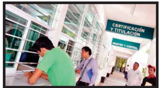
PROLIFERAN EN BENITO JUÁREZ las escuelas que carecen de validez oficial.