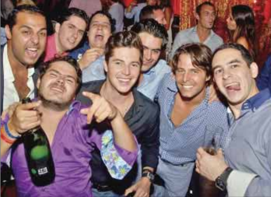
Los que acompañaron el festejado en su cumpleaños.