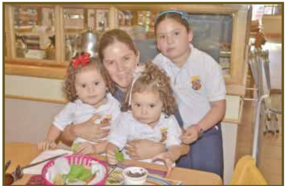
Familia Enriquez se deleita con un postre después de los alimentos.