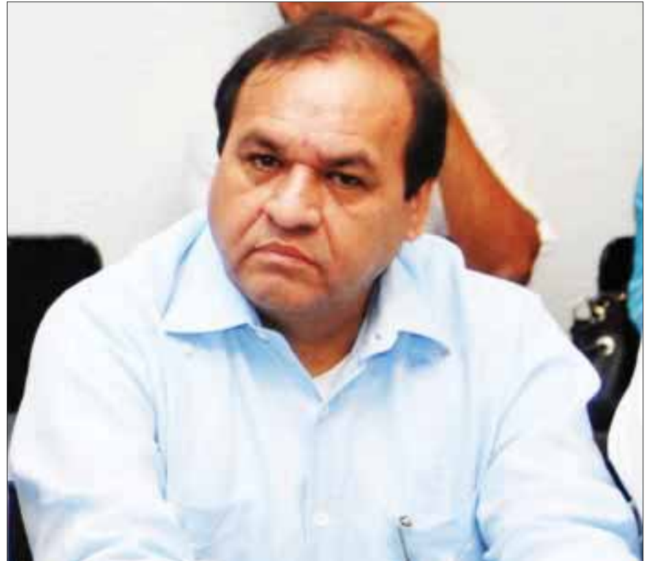
Sergio Arredondo Olvera, secretario general del Comité Directivo Nacional de la Federación Nacional de Municipios de México.

Dicha reducción es una diferencia en comparación al 2011 y ha provocado incluso la cancelación de proyectos y otros postergables, en materia de seguridad pública y obras de beneficio social.