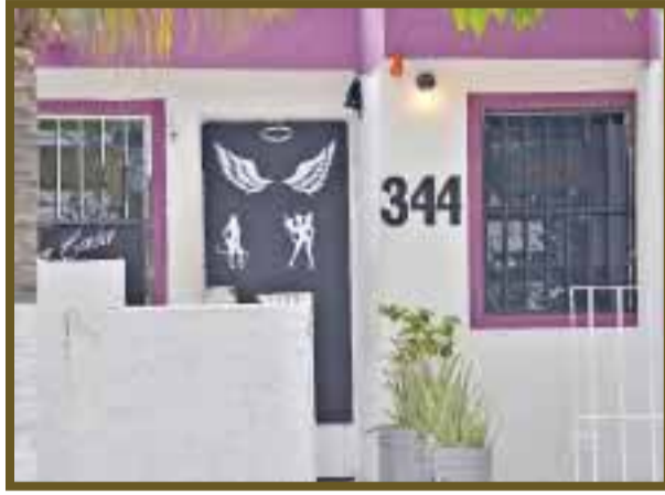
El letrero y las figuras en la puerta es señal que se ejerce la prostitución.