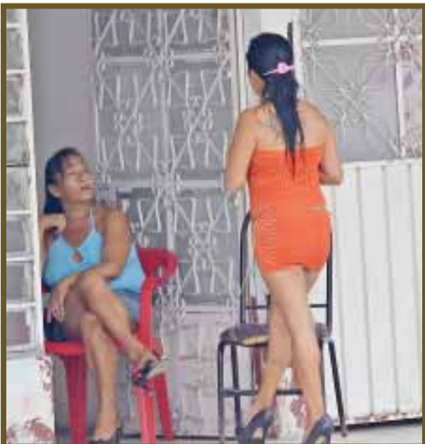
No importa la edad, lo que se busca es obtener unos pesos.