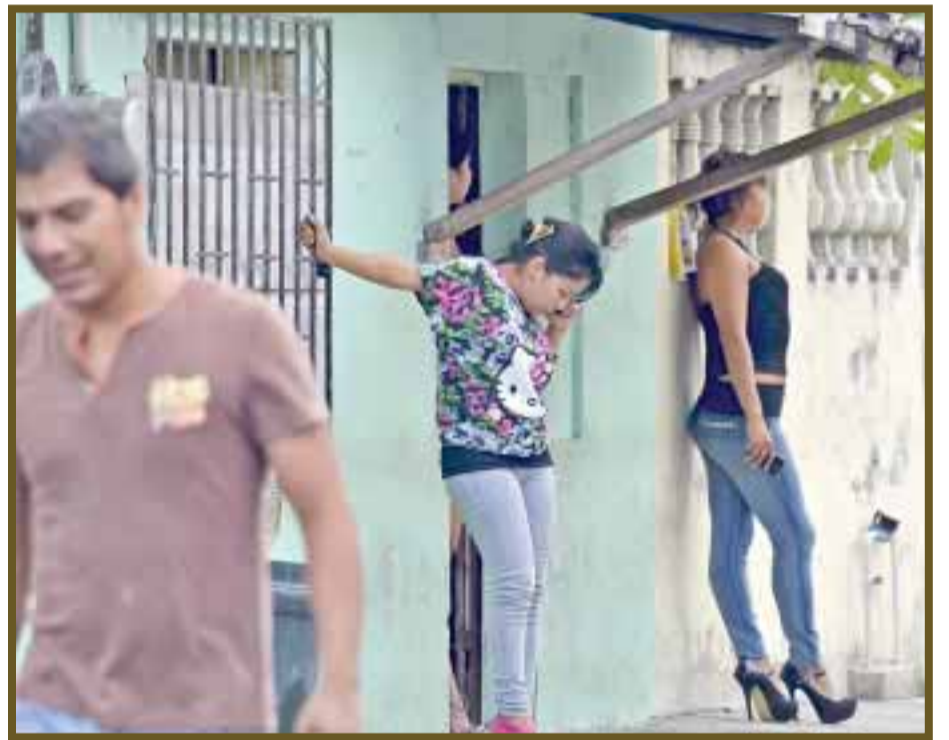
Detrás de Coppel, de la Tulum, existen varias casas de citas.

Urge que las autoridades regulen este tipo de negocio por seguridad de los turistas y la salud de la población.