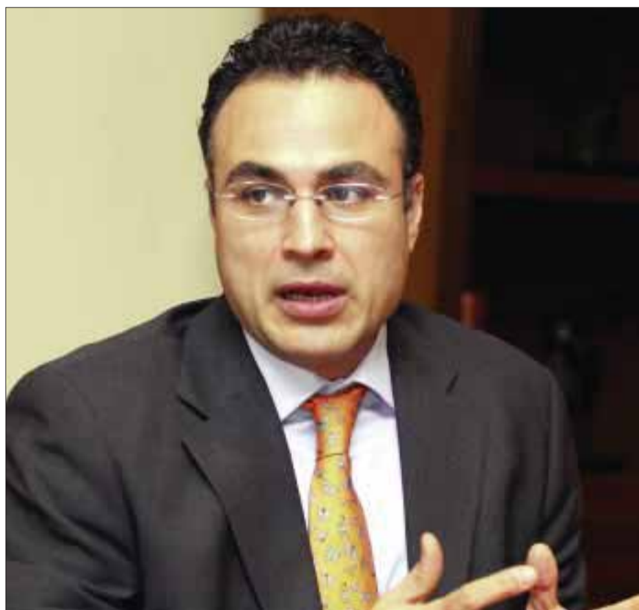
El subsecretario de Hacienda, Gerardo Rodríguez Regordosa, dijo ayer que habrá presupuesto a tiempo.

Insistió en que el panorama externo se ve sumamente complicado, pues si bien las acciones de la Reserva Federal (Fed) de Estados Unidos y del Banco Central Europeo han dado un respiro importante, éste es temporal y debe ser acompañado por acciones adicionales de los gobiernos.