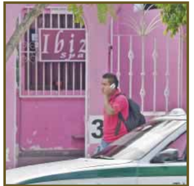
Vecinos de la 94 ya han denunciado este Spa, sin que la autoridad haga algo.