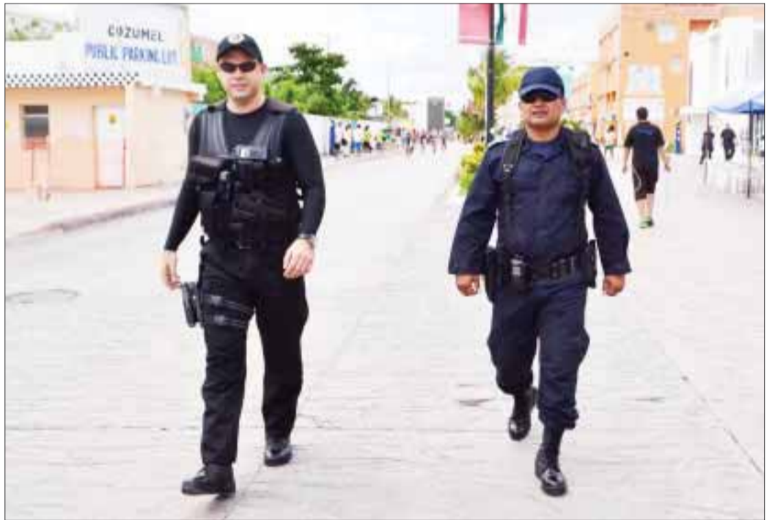
El director y subdirector de Seguridad Pública realizaron un recorrido por la ruta del Ironman 70.3.

Participaron elementos de Seguridad Pública, Tránsito, Protección Civil, Guardavidas, Bomberos, 60 personas de seguridad del Ironman