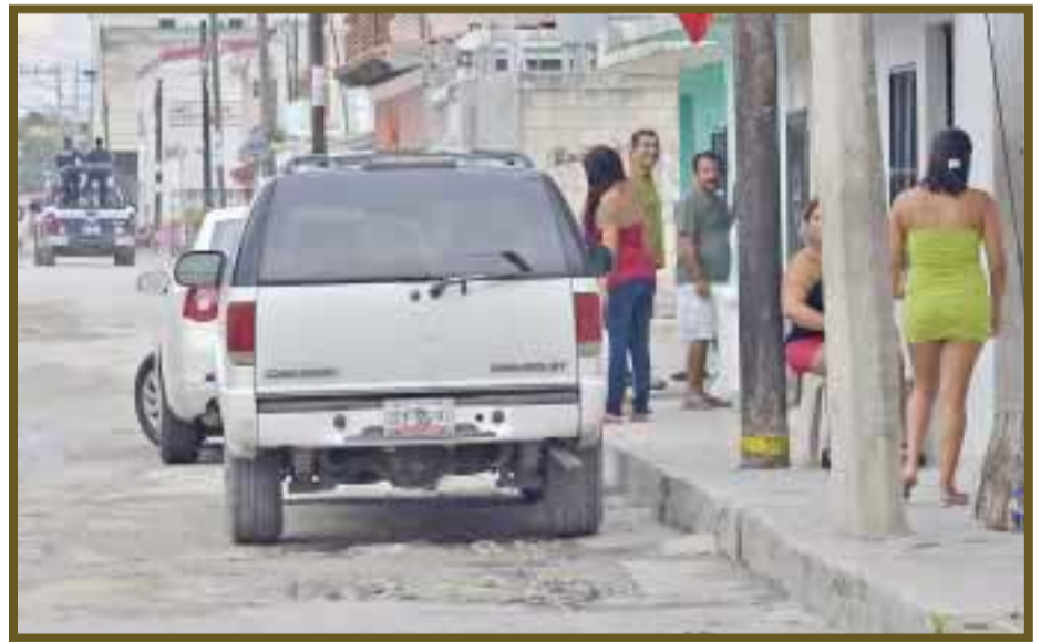
Se trabaja las 24 horas, en tres turnos, protegidas por los “patrones”.