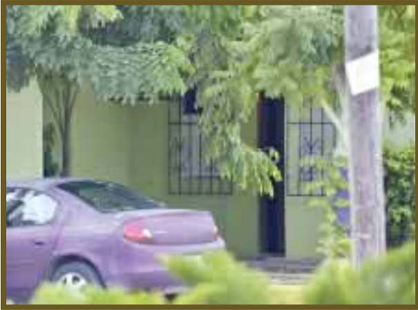
Esta casa es recomendada por los taxistas; la entrada está por calle La Costa.