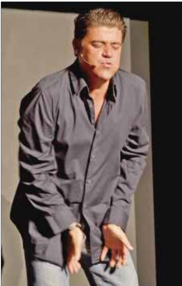
"El Burro" Van Rankin.