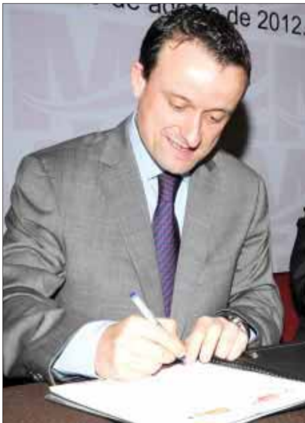
El director de la Cofepris, Mikel Arriola, presentó los avances del sistema de regulación sanitaria implementado.

Mikel Arriola, titular de la dependencia, destaca las acciones para modernizar la regulación en prevención de riesgos sanitarios en materia de medicamentos