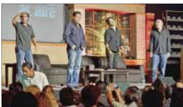
El show de "Miembros al aire".