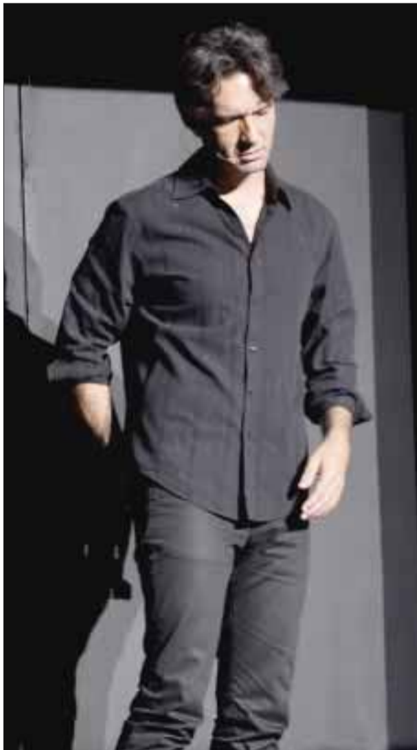
Leonardo de Lozanne.

Por otra parte, el show es familiar, pues se guarda el respeto debido a las mujeres y con sus comentarios consideran que no agreden ni ofenden a quienes van a verlos.