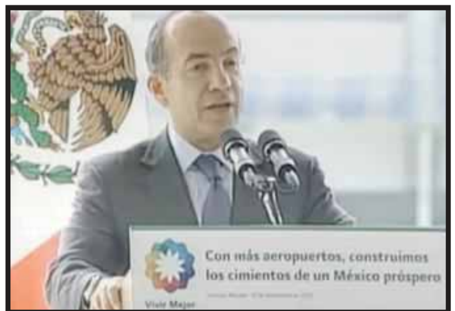
Felipe Calderón, presidente de México.

Reserva ahora y disfruta durante todo el mes de septiembre