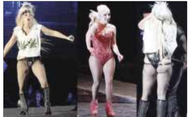
La intérprete de Born This Way echa la culpa a su padre; ya no le queda el vestuario de su gira por lo que le mandaron a hacer otros diseños.

“CADA VEZ QUE VOY AL RESTAURANTE DE MI PADRE ENGORDO DOS KILOS”