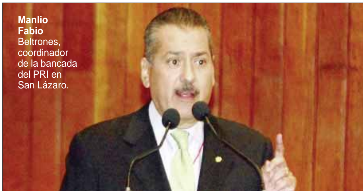
Manlio Fabio Beltrones, coordinador de la bancada del PRI en San Lázaro.