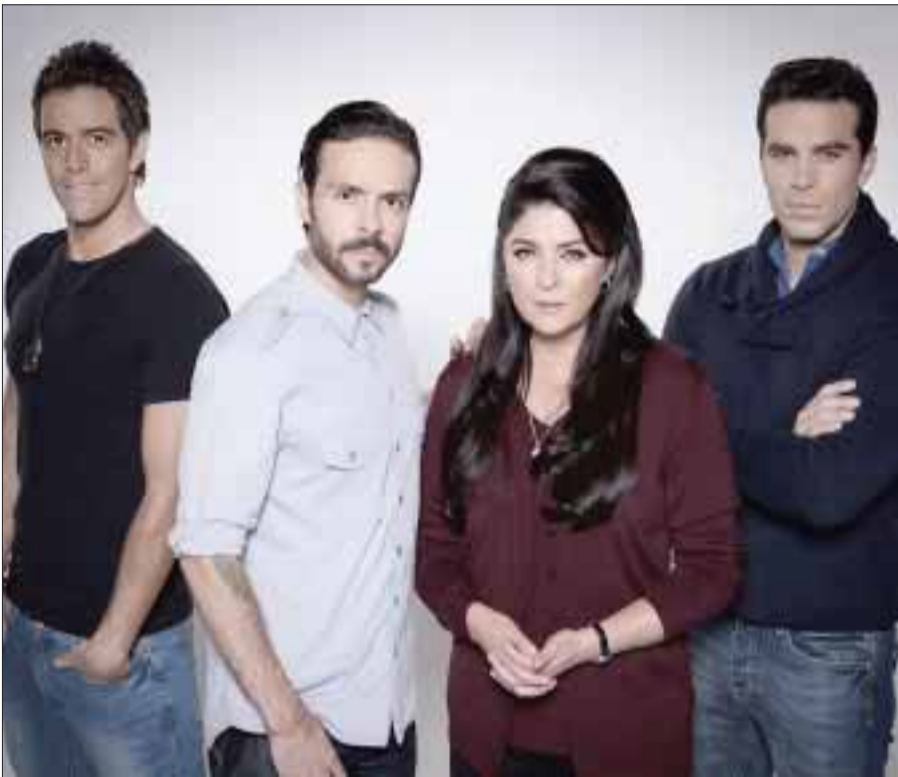
Corona de lágrimas que es un homenaje a las madres de México y América Latina, se estrenará este lunes 24 de septiembre, a las 16:15 horas por el canal 2.