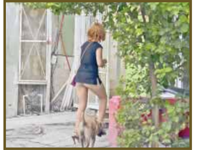
Hora de trabajar; entrando a una casa en la ruta 5.