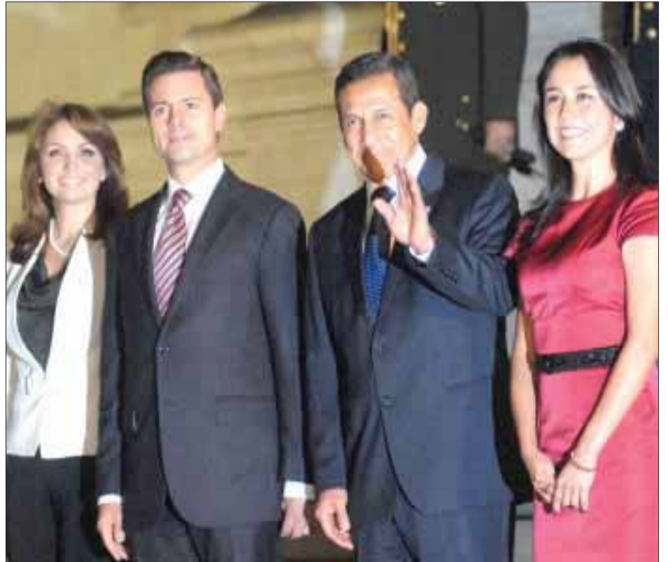
Enrique Peña Nieto y su esposa, Angélica Rivera, con el presidente peruano Ollanta Humala, y su cónyuge, Nadine Heredia.

“Soy optimista en una relación de hermandad y que pueda fortalecerse, ensancharse, estoy aquí en ese interés de hacer patente mi compromiso y voluntad política”, indicó el próximo mandatario mexicano, tras reunirse con el presidente de Perú, Ollanta Humala