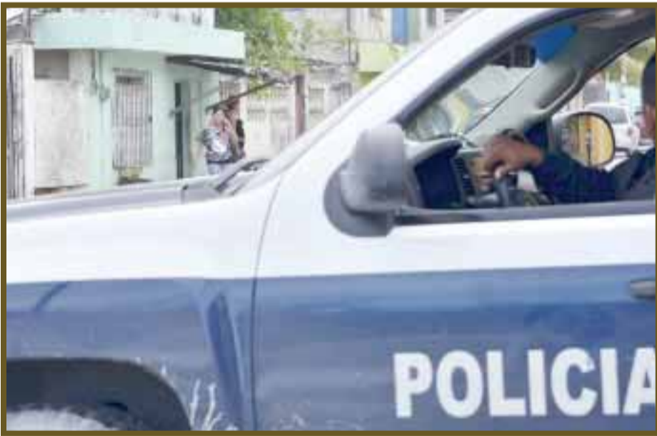
La policía, pendiente que no molesten a sus “clientes”.