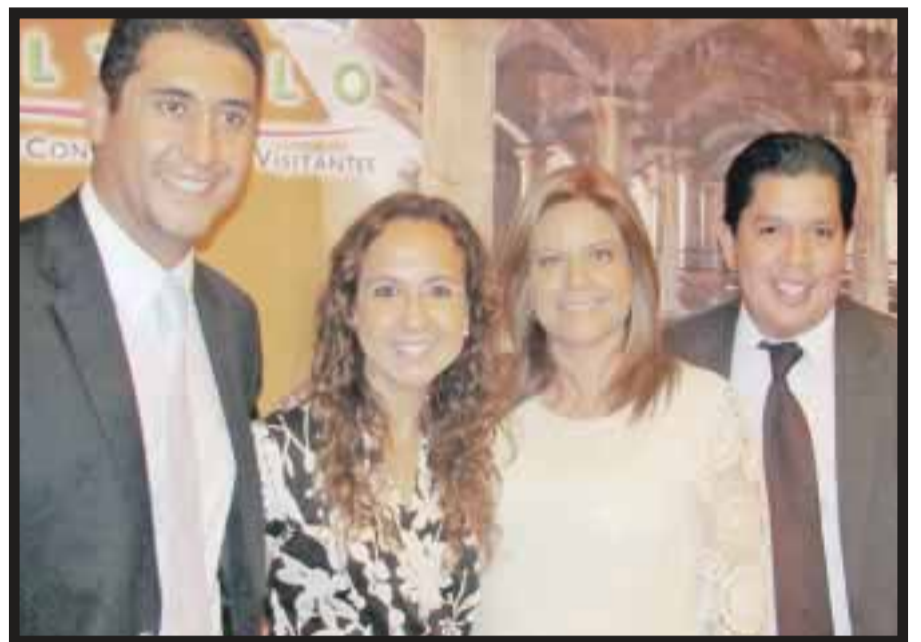
Durante la presentación: "Sorpréndete es Saltillo".

semiseco, es un destino digno de conocerse, pues ofrece una gran variedad de atractivos turísticos. Así se refirió al Centro Histórico de la ciudad, lugar preferido de los que visitan la capital coahuilense por contar con un conjunto de edificios históricos, la Plaza de Armas se convierte en un punto de partida para recorrer el centro que se engalana con el tradicional folclor mexicano y la elegante cultura saltillense. También dijo que alrededor de la Plaza de Armas se ubican edificios que datan del virreinato, museos y centros culturales como el Casino de Saltillo, edificio de cantera inaugurado en 1900. Los museos del Sarape y Trajes Mexicanos, donde se pueden apreciar distintos tipos de sarapes confeccionados hace siglos. El museo de la Batalla de la Angostura. El centro cultural "Teatro García Carrillo", monumento de estilo ecléctico, destinado a la expresión artística local. El Museo del Palacio de Saltillo, con un amplio panorama sobre sus orígenes, con diferentes exposiciones de las etapas históricas del país y para los más pequeños una variedad de módulos interactivos, donde se puede jugar mientras aprenden los sucesos pasados y contemporáneos de Coahuila. El Mu-