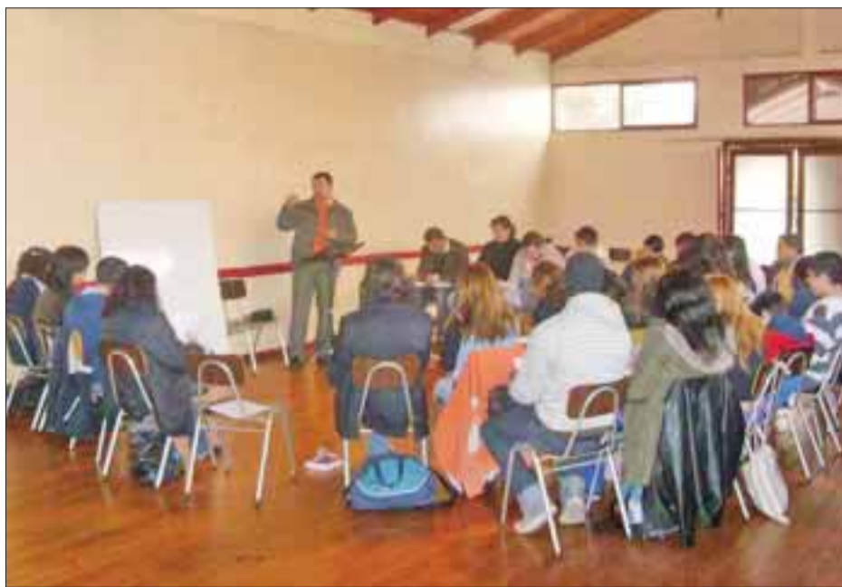
Cuando todos aprendemos que el Señorío de Cristo debe estar reinando en nuestras vidas, podemos exclamar "Abba Padre".

mogénito, muchos a veces juzgamos a otros por su forma de vestir, de hablar y hasta por lo que comen, hay que entender que Dios no quiere el cuerpo del hombre, quiere su corazón para vivir en él y salvar su alma, nosotros juzgamos según lo que vemos, sólo la apariencia exterior, es por eso que debemos buscar más de Dios y aprender a no juzgar a nadie por nada y en nada, si no dejando que Dios nos ayude y nos revele como es la persona. Dios no mira la apariencia del hombre, no se deja llevar por chismes, ni por murmuraciones, Dios mira el corazón, y si deseamos juzgar algo, juzguemos nuestro propio corazón como está delante de Dios, como estamos viviendo para honrar su nombre en todo lugar, a toda hora