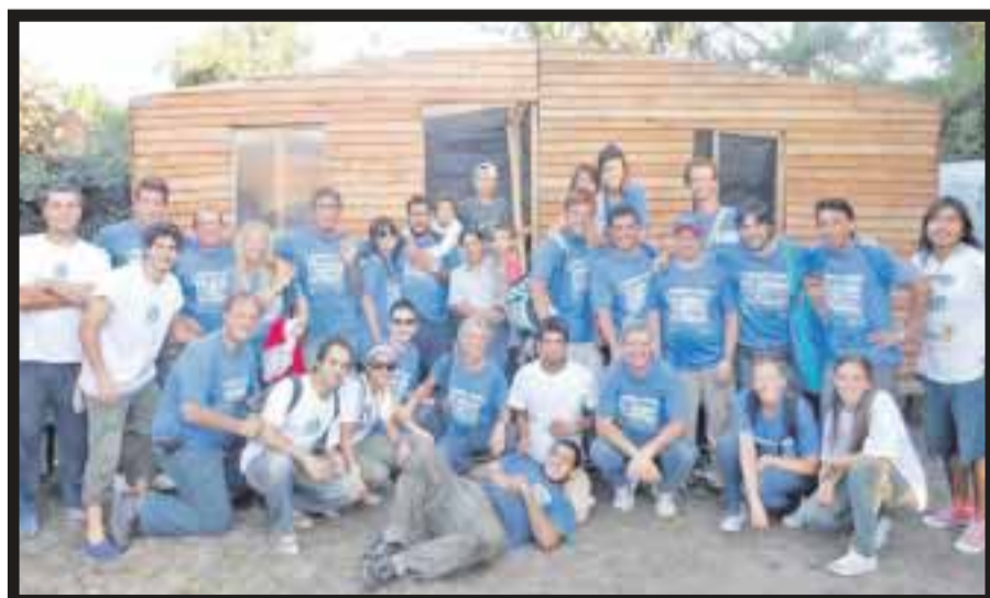
"Voluntad Versus Pobreza" en la que Assist-Card donará a TECHO 50 centavos de dólar por cada tarjeta vendida.

romano, y que a su vez son el elemento ideal para la aromaterapia generada por los vapores de las aguas termales. En el ejido Rincón Colorado está el Valle de los Dinosaurios en el municipio de General Cepeda. La región cuenta con una gran riqueza de restos fósiles en su mayoría de la era cretácica (70 millones de años atrás). En este lugar fue descubierto el esqueleto de isauria, primer dinosaurio colectado y reconstruido en México, que pertenece a la familia de los hadrosaurios "picos de pato". Cuenta con un museo de sitio y un área considerada como reserva paleontológica. Además del hadrosaurio se descubrieron en esta región fósiles del tiranosaurio rex. Saltillo tiene una amplia oferta hotelera para todos los niveles y gustos, con las instalaciones y servicios necesarios que demanda el turismo de reuniones, con 2 mil 693 habitaciones y un total de 22 mil 378 m 2 en superficie para éstos. El aeropuerto Plan de Guadalupe, localizado en el municipio de Ramos Arizpe, a 12 km de la ciudad de México y un vuelo internacional a Houston. La cercanía de Saltillo con