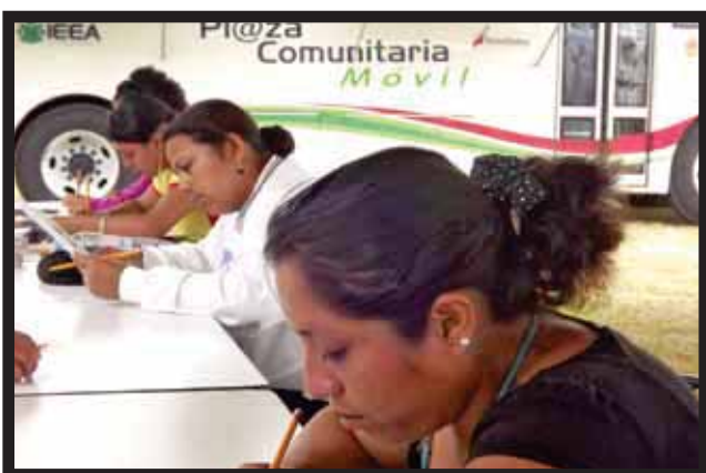
EL REZAGO EDUCATIVO lo atiende el IEEA.