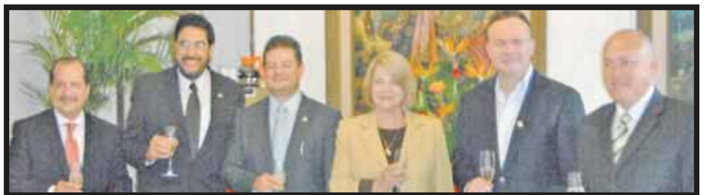
Durante la firma del contrato que abrirá nuevo hotel en Zacatecas.