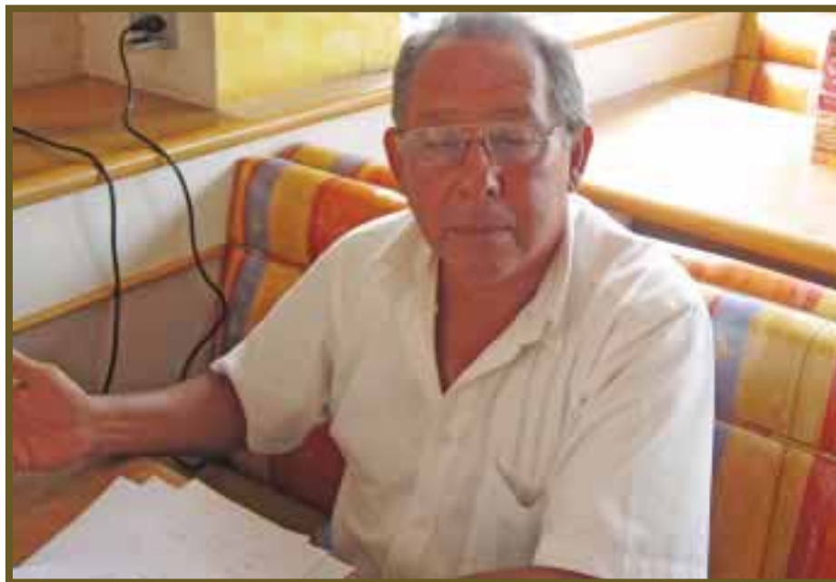
Rubén Zaleta comentó que Peña Nieto cumplirá sus compromisos.