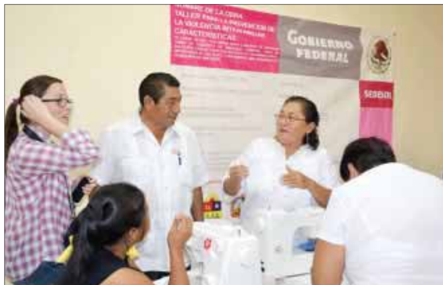
El proyecto "Contribución de la superación de la pobreza de la colonia Cecilio Chi", será reconocido a nivel nacional.

material audiovisual que será entregado en la Sedesol en la ciudad de México, en donde queda plasmada la evidencia que las obras y acciones que se han realizado en tiempo y forma. La administración que encabeza Sebastián Uc Yam, llega a la obtención de este reconocimiento, luego de concursar con más de 100 municipios del país, en donde al final disputó hasta el último momento con el municipio de Irapuato, Guanajuato el primer lugar, mismo que será entregado en la ciudad de México a Sebastián Uc Yam, de manos del presidente de la República Felipe Calderón Hinojosa.