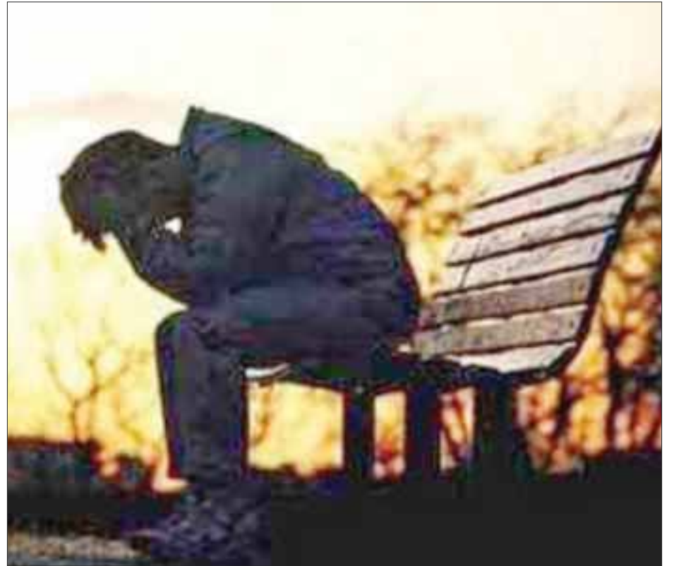
Existen momentos en los que no quisiéramos seguir a Dios.

Hay un personaje en la Biblia que ayudaba al apóstol Pablo en su labor misionera, es mencionado solo 3 veces en la Biblia y las 3 veces se refiere a actos misioneros, pero llegó un momento, donde este personaje llamado Demas tomó la decisión de dejar solo a Pablo porque amó más las cosas del mundo, la Biblia lo narra de la siguiente manera: "Demas me ha abandonado y se ha ido a la ciudad de Tesalónica, pues