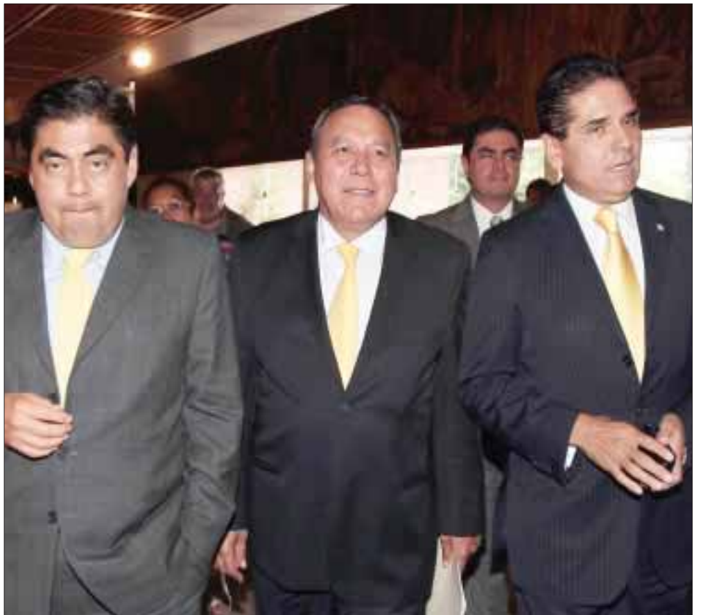
Miguel Barbosa, Jesús Zambrano y Silvano Aureoles seguirán el camino de la controversia constitucional ante la Corte y no en el pleno.

El coordinador legislativo refirió que hasta ahora la Comisión de Trabajo y Previsión Social sólo se ha reunido en dos ocasiones, y que esta tarde se volverá a reunir por lo que esperan conocer en qué sentido vendrá el predictamen.