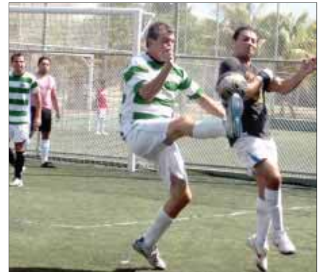
La mala suerte estuvo siempre del lado de los Veteranos, pues el partido inició con 4 jugadores por parte de Sr. Frog's.

Ya para la segunda parte, los anfibios abrieron el contador al minuto 35 del tiempo corrido, mientras que Veteranos respondió el agravio al 37, pero bastaron sólo 2 minutos, para que Sr. Frog's buscar la igualdad al 39, y de esta manera terminar el encuentro 5 a 5.