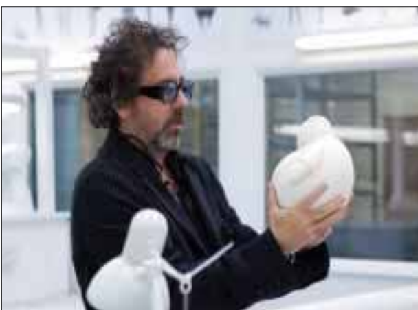
Frankenweenie es la primera producción que el creador de El Cadáver de la Novia realiza para los Estudios Disney y está basada en un cortometraje realizado por el propio Burton en el año 1984.

*** El largometraje en 3D se realizó con la técnica stop-motion y fue filmada en blanco y negro