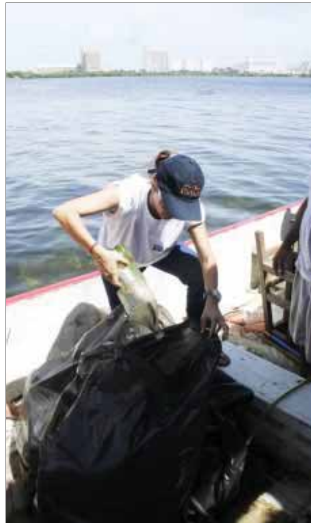
En el 2011, en la limpieza internacional participaron 16 mil voluntarios, acopiándose 109 mil 726 kilogramos de basura y recorrieron 438.90 kilómetros.

Con la limpieza de las playas se realiza un trabajo conjunto entre la iniciativa privada, autoridades ambientales y sociedad civil, que el 2011 lograron la participación en México de 16 mil voluntarios que captaron 109 mil 726 kilogramos de basura y recorrieron 438.90 kilómetros.