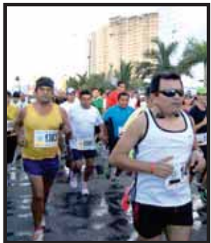
EL 27 DE SEPTIEMBRE, Día del Turismo.