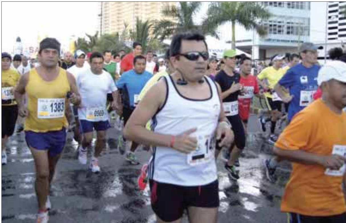
Los participantes del Maratón por el Día Internacional del Turismo saldrán a la altura del restaurante "Table".