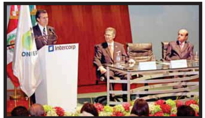
ENRIQUE PEÑA NIETO, con empresarios y líderes peruanos.

que se presenta para América Latina y espero que estemos en oportunidad de aprovechar este potencial para lograr una sociedad más justa e igualitaria", dijo el mandatario... >15