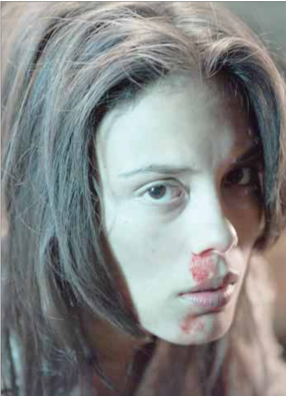
La película está basada en investigaciones reales sobre los experimentos secretos que realizaban los nazis durante la segunda guerra mundial.