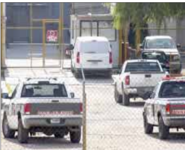
El Cereso de Torreón fue reestructurado en su operación interna.