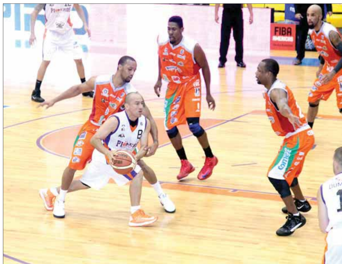
Pioneros de Quintana Roo no aprovechó su semana completa como local.