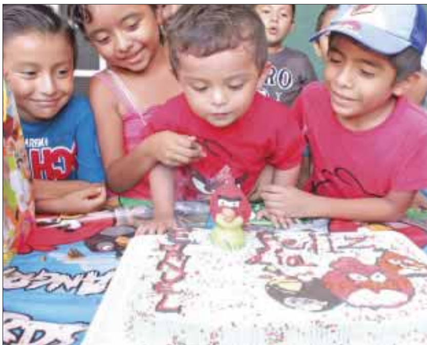
El cumpleaños pide un deseo al soplar su pastel.