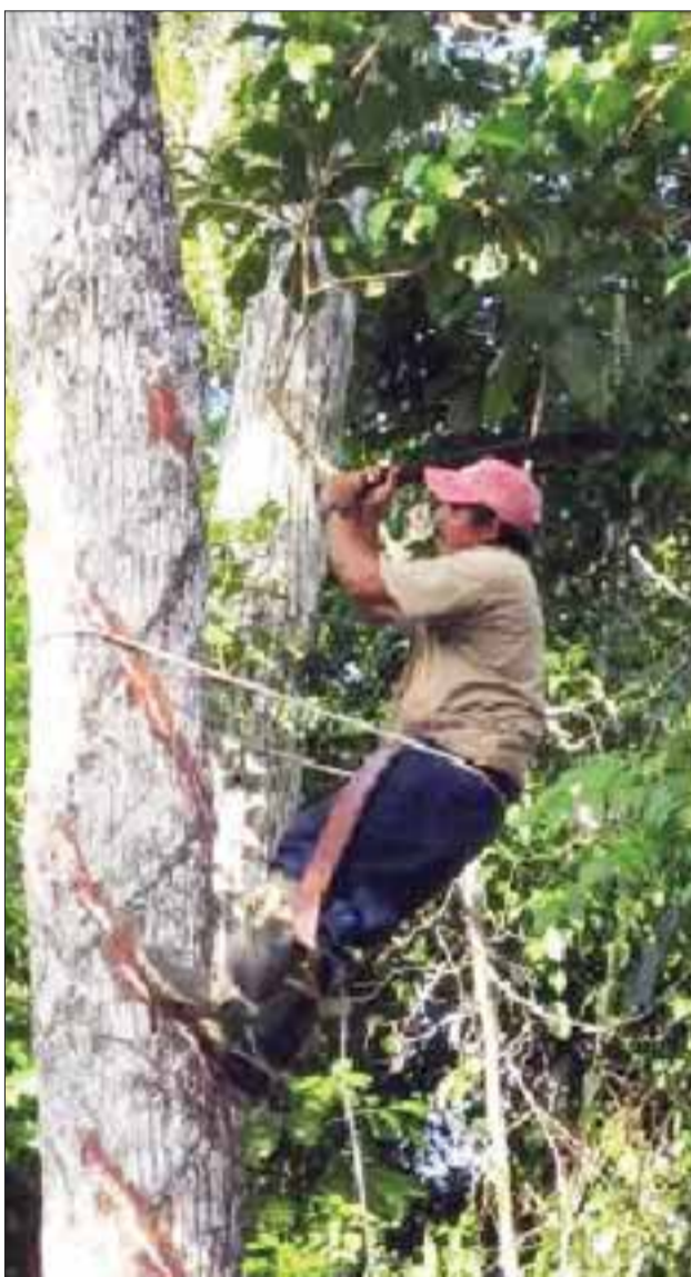
El cultivo del chicle en la zona maya de Quintana Roo es una tradición que viene desde la época de la Conquista.

El mercado de materia prima, es decir el chicle natural por maquetas se localiza principalmente en Japón, Corea y Singapur.