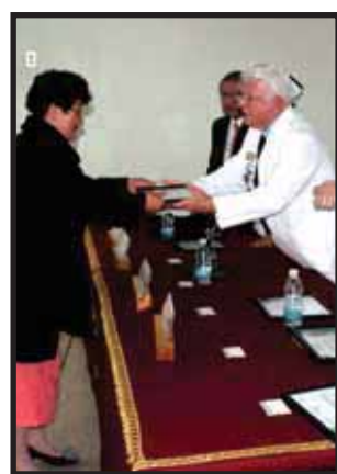
RECONOCE SSA a donadores de órganos.