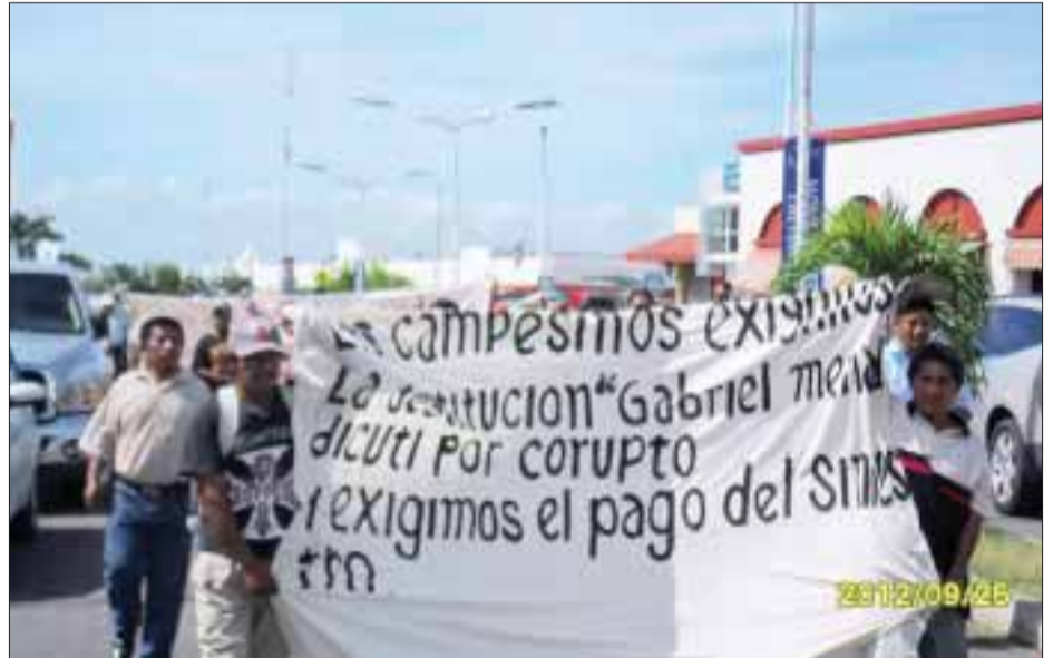
Decenas de campesinos decidieron lanzarse a una manifestación marchando con pancartas y gritos por avenida Héroes.

Del gobierno ayer mismo hicieron saber que le iban a pasar la nota de nuestra presencia en los bajos de gobierno. Parece que no les pasaron el escrito a los funcionarios. Ante eso, decidimos manifestarnos en la calle. Y vamos a llegar a otras consecuencias. Vamos a cerrar el acceso carretero que conduce a la ciudad de Chetumal, desde nuestros ejidos. Nosotros no nos vamos a esperar, vamos a caminar todo Chetumal, si es posible.