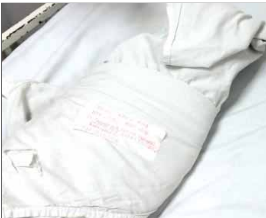
Por la muerte del menor de 5 meses, no hay ningún detenido.