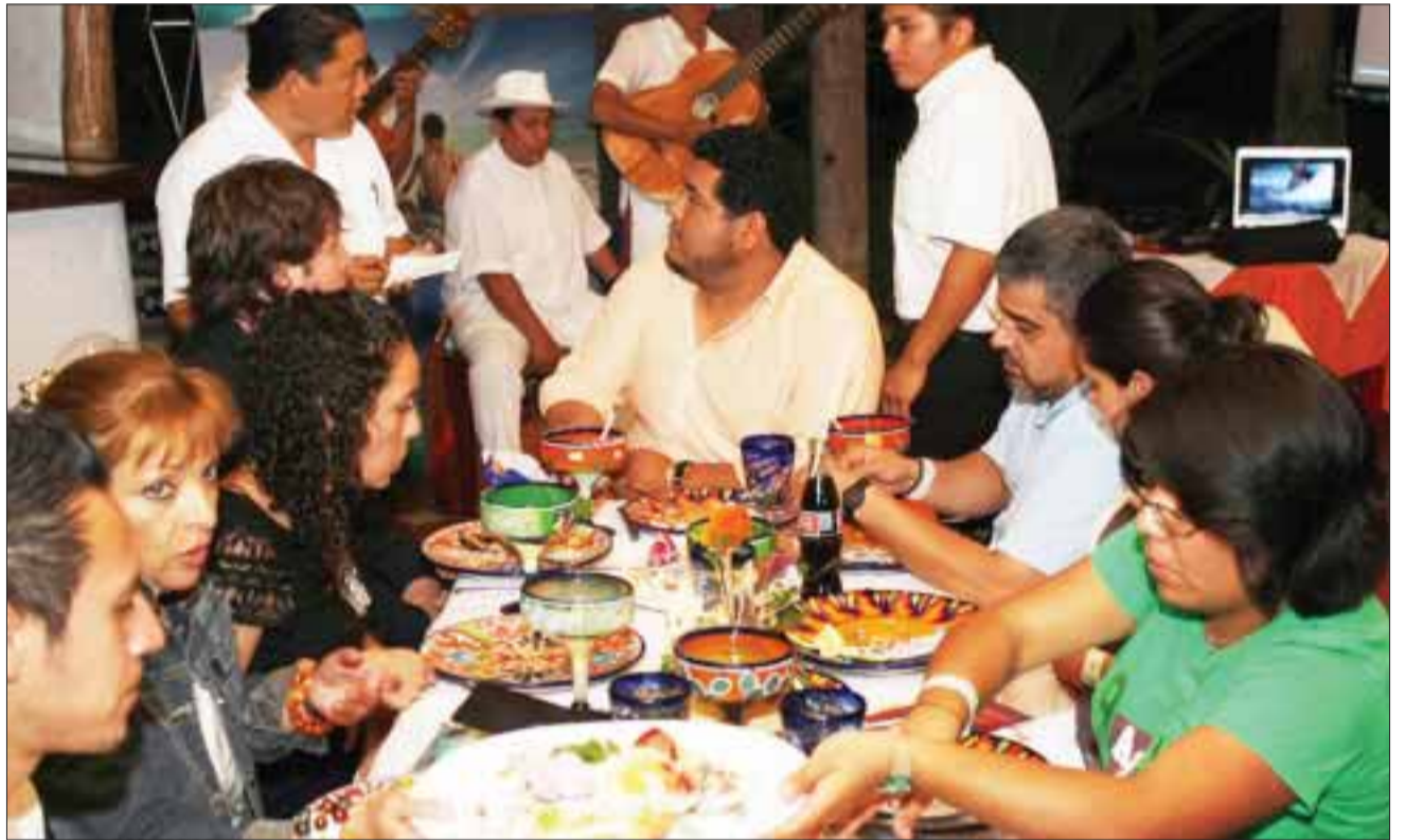
La capacitación tiene como objetivo proporcionar mejores conocimientos para el manejo adecuado de los alimentos.

Por último dijo que esta capacitación tiene un precio de 4 mil 638 pesos, pero gracias a las gestiones realizadas, los 3 cursos tendrán un costo de 180 pesos, para apoyar en adiestramiento, así como en la economía del sector.