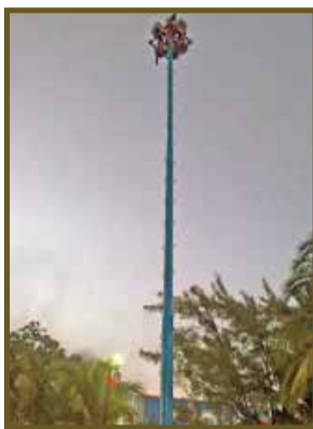
Ya en las alturas realizan la ceremonia de petición de agua al ritmo del tambor y la flauta.

La tranquilidad que se respira paseando por esta calle está en consonancia con la calma del mar a escasos 50 metros.