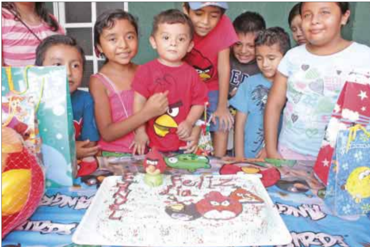
Familiares y amigos cantando "Las mañanitas".