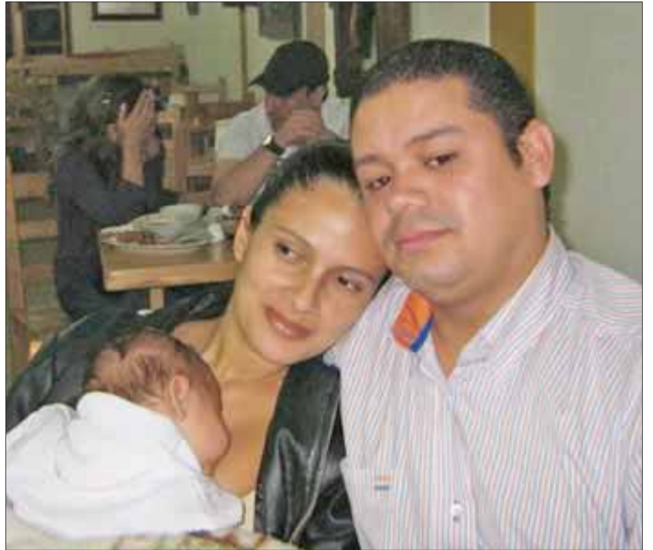
Tener una familia también es una bendición de Dios, y disfrutarla depende de nuestra capacidad.

Pero yo me pregunto, ¿Quién se inventó eso?, tu puedes ser pobre, de clase media, rico o millonario y eso no tiene nada que ver en ser o no bende-