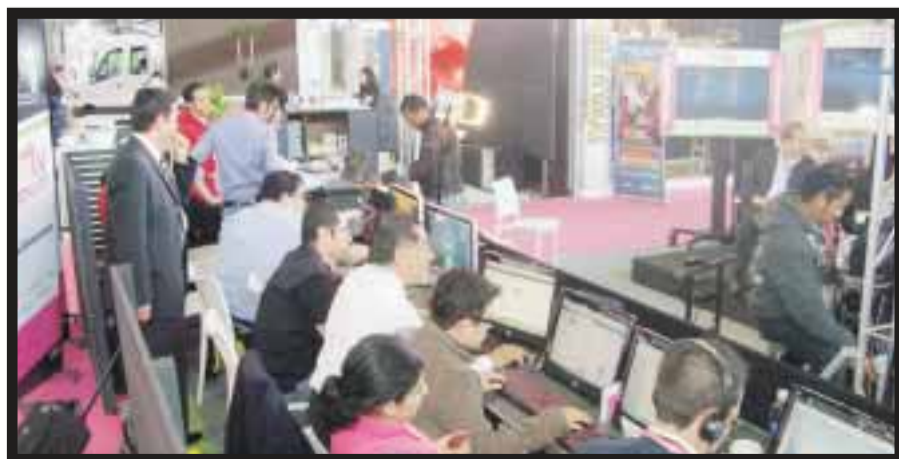
Se lanzó el primer canal cien por ciento para el sector turístico: FITA-TV,

☆☆☆☆☆ El hotel más grande del mundo será inaugurado antes de concluir este año y pertenece a la cadena de hoteles Starwood . Tendrá casi 4 mil habitaciones, es el más grande de la cartera mundial de Starwood y el hotel más grande a abrirse en Macao, China. Estará en dos elegantes torres con vista al Cotai Strip , y alberga el Sheraton Club Lounge más grande del mundo, un salón de baile con el tamaño de más de 11 canchas de basquetbol, más de 160 mil pies cuadrados de espacio para reuniones, tres restaurantes de renombre y tres albercas al aire libre con cafés junto a la alberca. La apertura del hotel coincide con el 75 aniversario de la marca Sheraton y amplía el liderazgo de la marca en la región Asia Pacífico, donde se mantiene como el operador más grande de hoteles de cuatro y cinco estrellas. El Macao moderno emerge rápidamente como uno de los destinos de entretenimiento y vacaciones más emocionante de Asia. El hotel ofrecerá una variedad de instalaciones recreativas diseñadas para familias con niños, incluyendo suites familiares equipadas con camas para niños, zona de juegos, libros y juegos para niños. El Kids Club