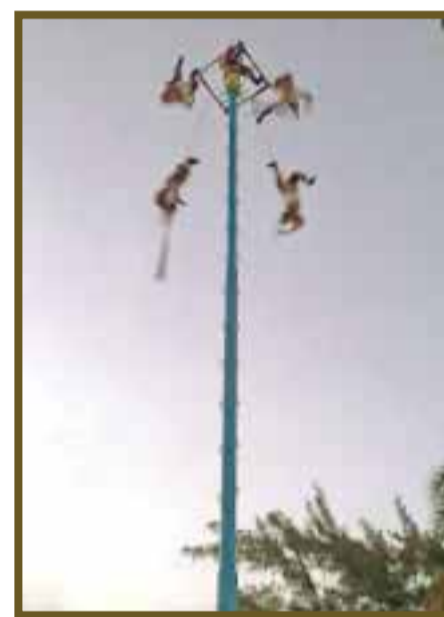
El espectáculo se realiza a la caída del sol, aprovechando la llegada del ferri.