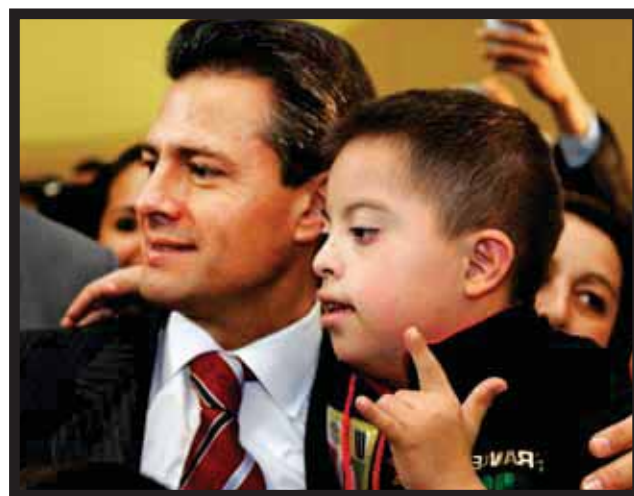
ENRIQUE PEÑA NIETO, por un México incluyente.

vida productiva del país. También les informó que ya dio instrucciones a su equipo económico, para que incluya en el Presupuesto de Egresos de 2013 todos los programas de apoyo destinados a los discapacitados, como el de... >15