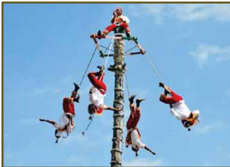
Hora de volar, sostenido solamente por una cuerda.