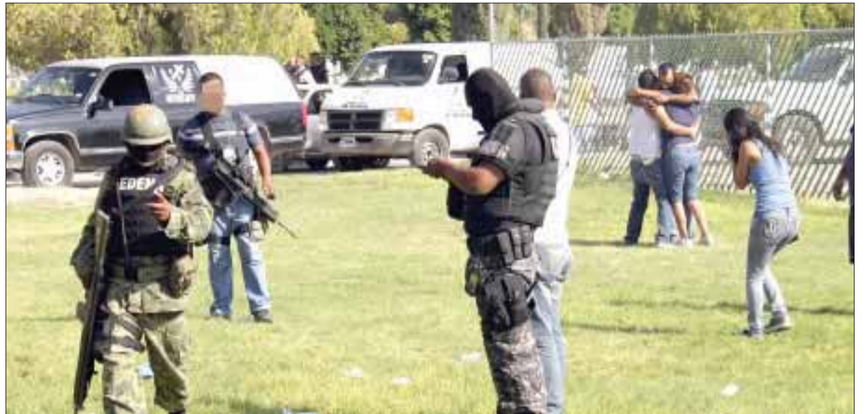
El ataque de sicarios a los deudos de una persona asesinada subió a 9 muertos y 21 heridos; de los primeros hay dos menores de edad.

Las autoridades estadounidenses acusan a Félix Félix de encabezar una red de distribución de narcóticos y lavado de dinero desde Guadalajara y la ciudad de México.