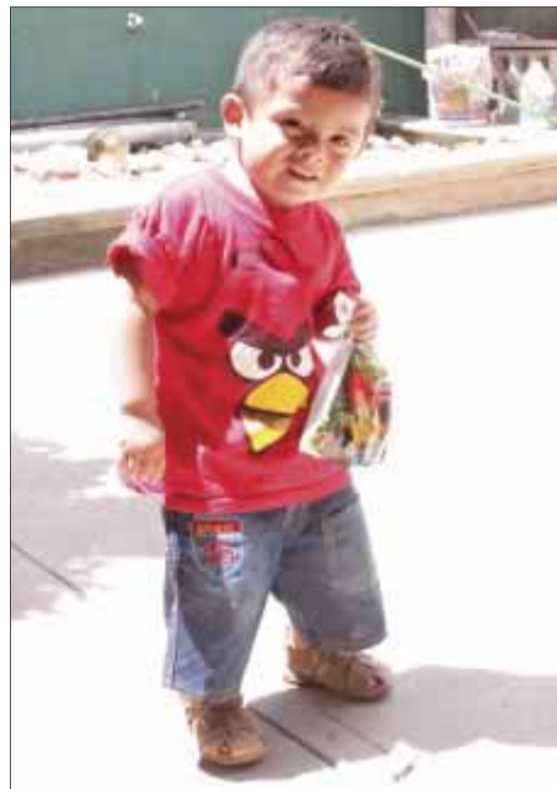
Con su bolsita de dulces, la cual tiene el tema de la fiesta.