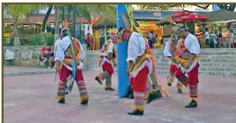
Dan gracias a los dioses por haber descendido con bien.