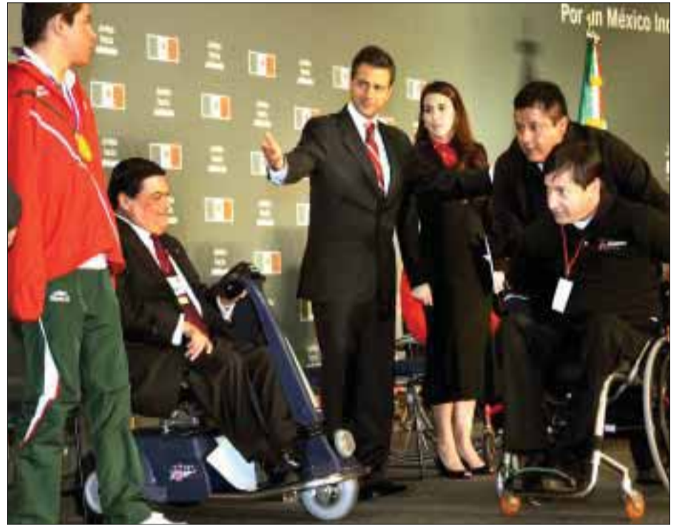
Enrique Peña Nieto, presidente electo de México, se reunió ayer con la Coalición México por los Derechos de las Personas con Discapacidad, a quienes les planteó la no discriminación como política pública de su administración.

“No se trata sólo de definir políticas de manera unilateral o con el apoyo de ustedes, sino también hacer o lograr que estas políticas y acciones, que en su momento estemos