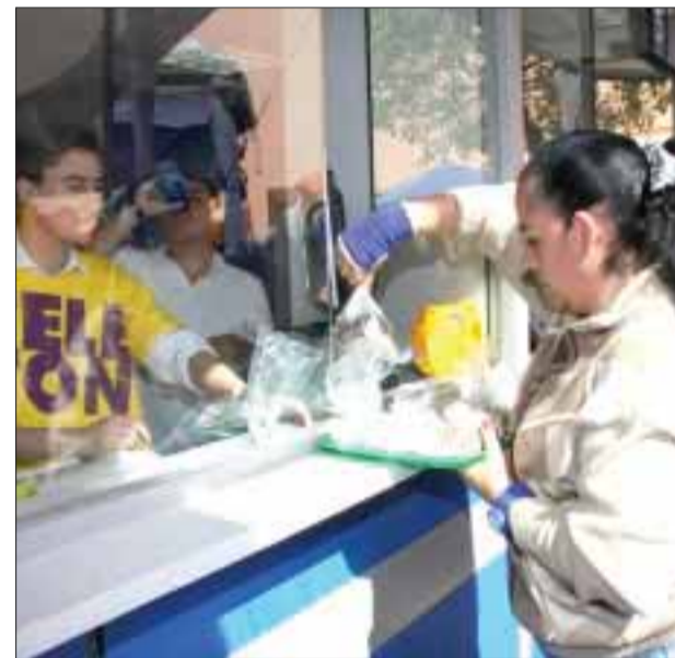
El hotel Ritz Carlton y la Universidad Tec Milenio dieron a conocer las bases de lo que será la primera carrera denominada "Por ellos".