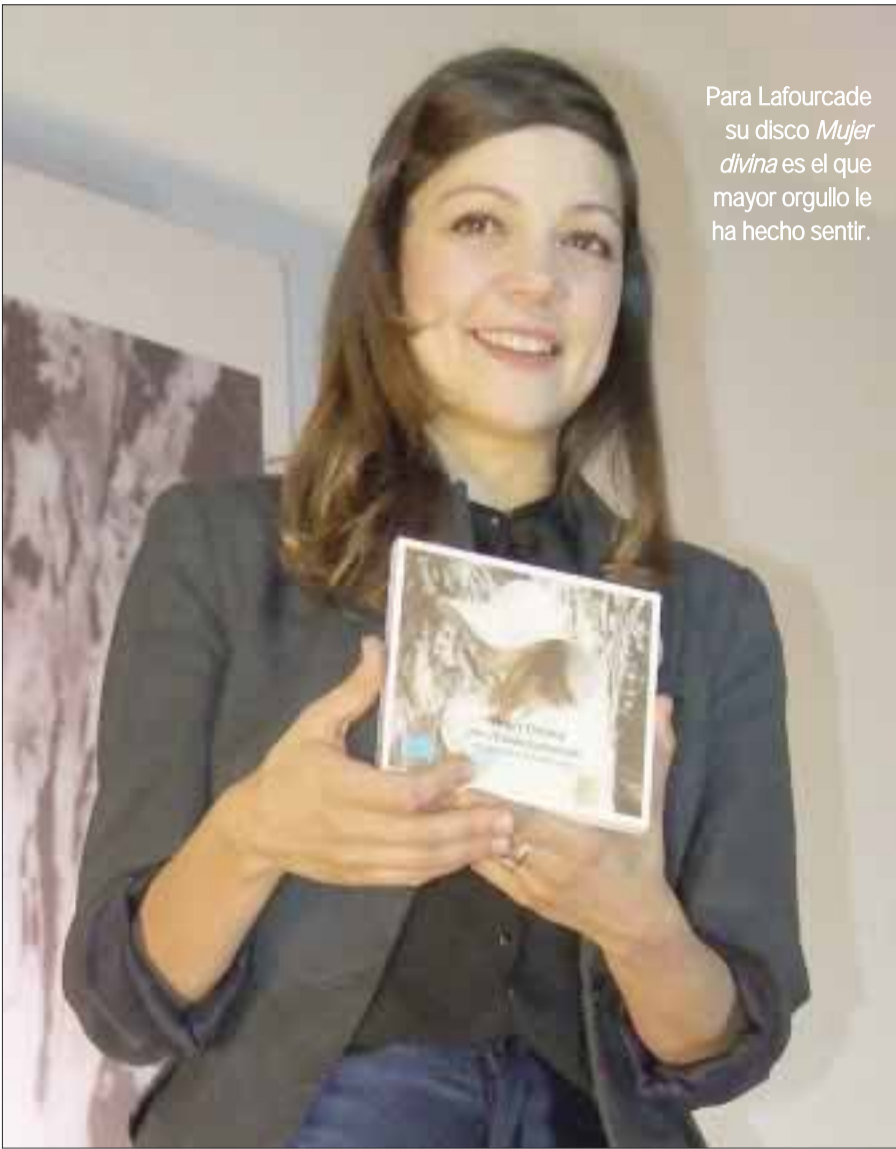
Para Lafourcade su disco Mujer divina es el que mayor orgullo le ha hecho sentir.