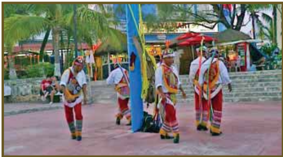
Antes de subir, los cinco hombres castos realizan una danza alrededor del tronco.