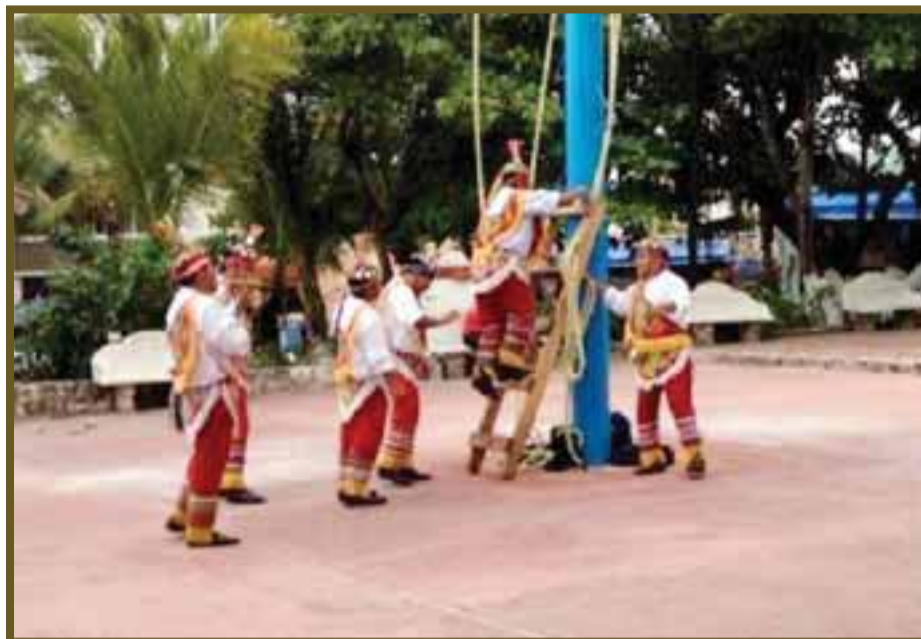
Uno a uno va tomando su lugar, mientras un sexto hombre toca el flautín hecho de carrizo.