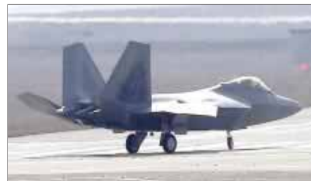
Aviones estadounidenses realizan maniobras en la base aérea de Osan en Corea del Sur.

El régimen de Kim Jong-un ha aumentado sus amenazas contra Corea del Sur y EU desde que la ONU le impuso el pasado 7 de marzo nuevas sanciones por su última prueba nuclear de febrero.