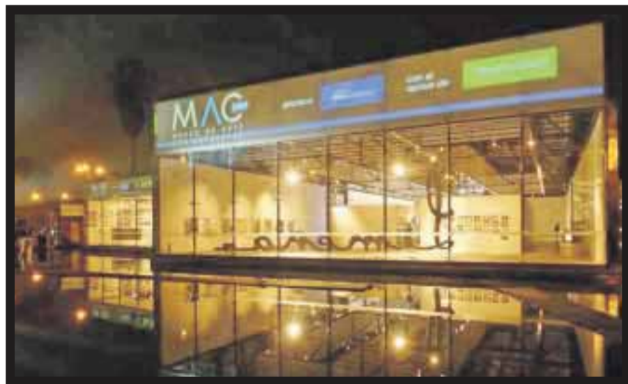
El Museo de Arte Contemporáneo de Lima.