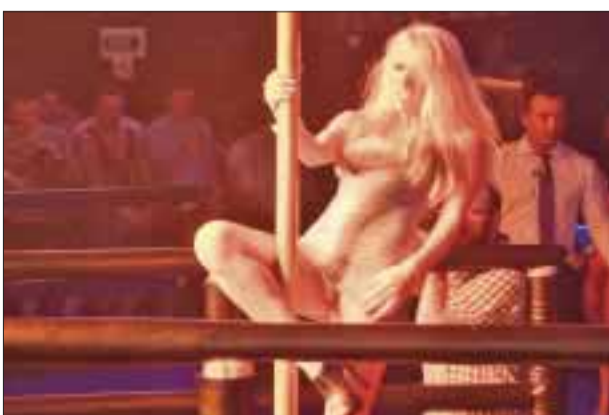
Chica de Estados Unidos también participó.