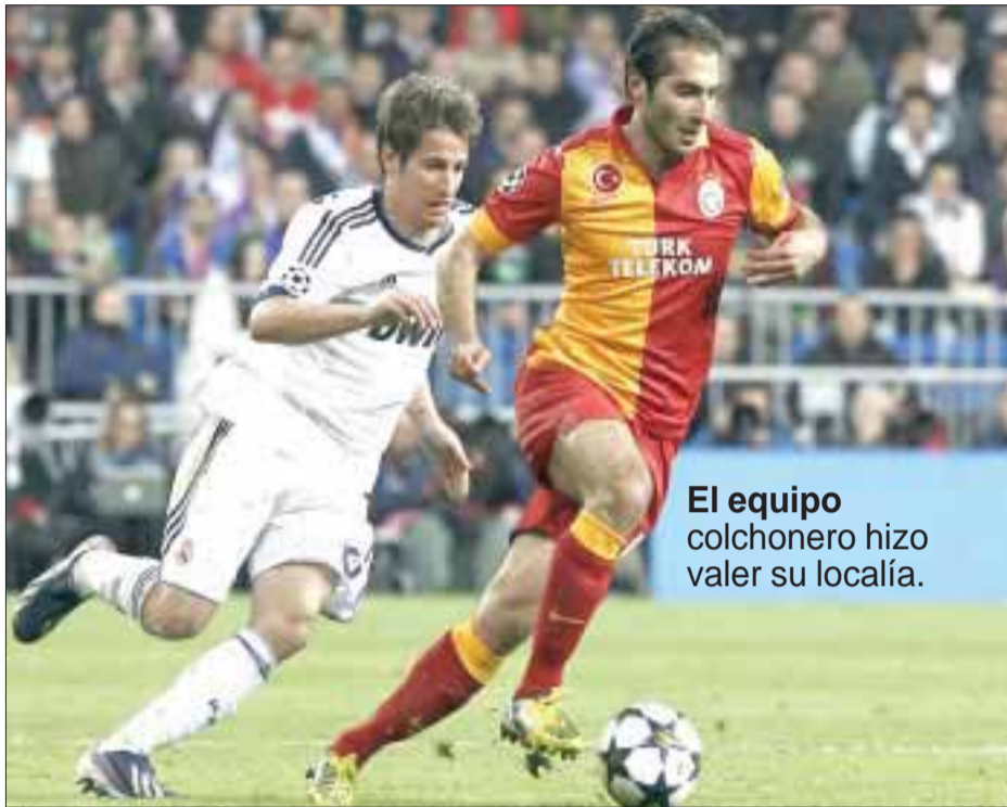
El equipo colchonero hizo valer su localía.

Madrid, España.- Real Madrid dio un paso importante rumbo a las semifinales de la Liga de Campeones tras vencer con autoridad al Galatasaray, con un rotundo 3-0 en el duelo de ida, disputado en el Santiago Bernabéu.