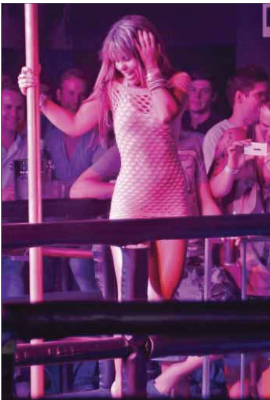
Joven brasileña, en la pista.