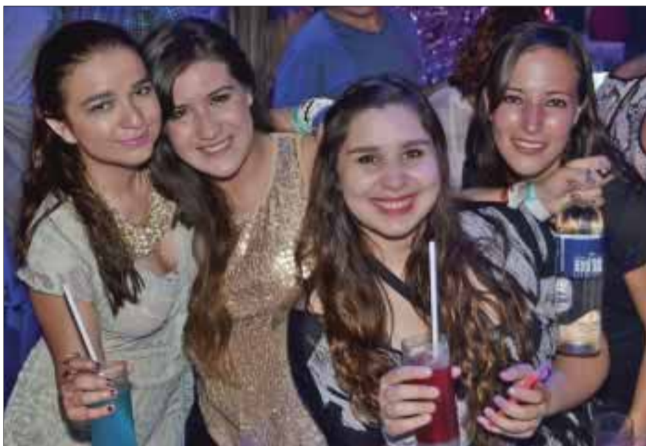
Divertidas estaban unas visitantes de Perú.