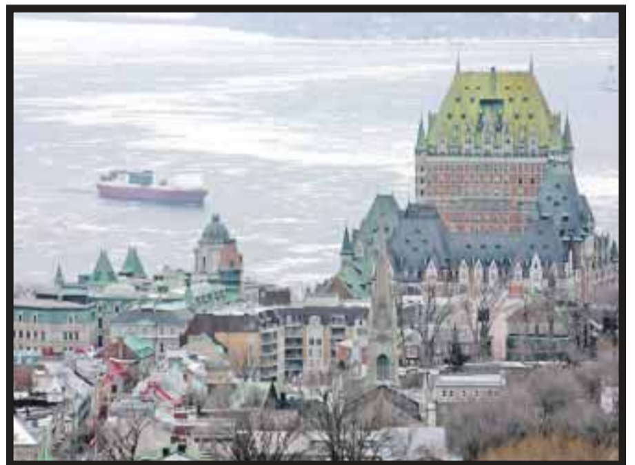
La provincia de Quebec estrena marca.