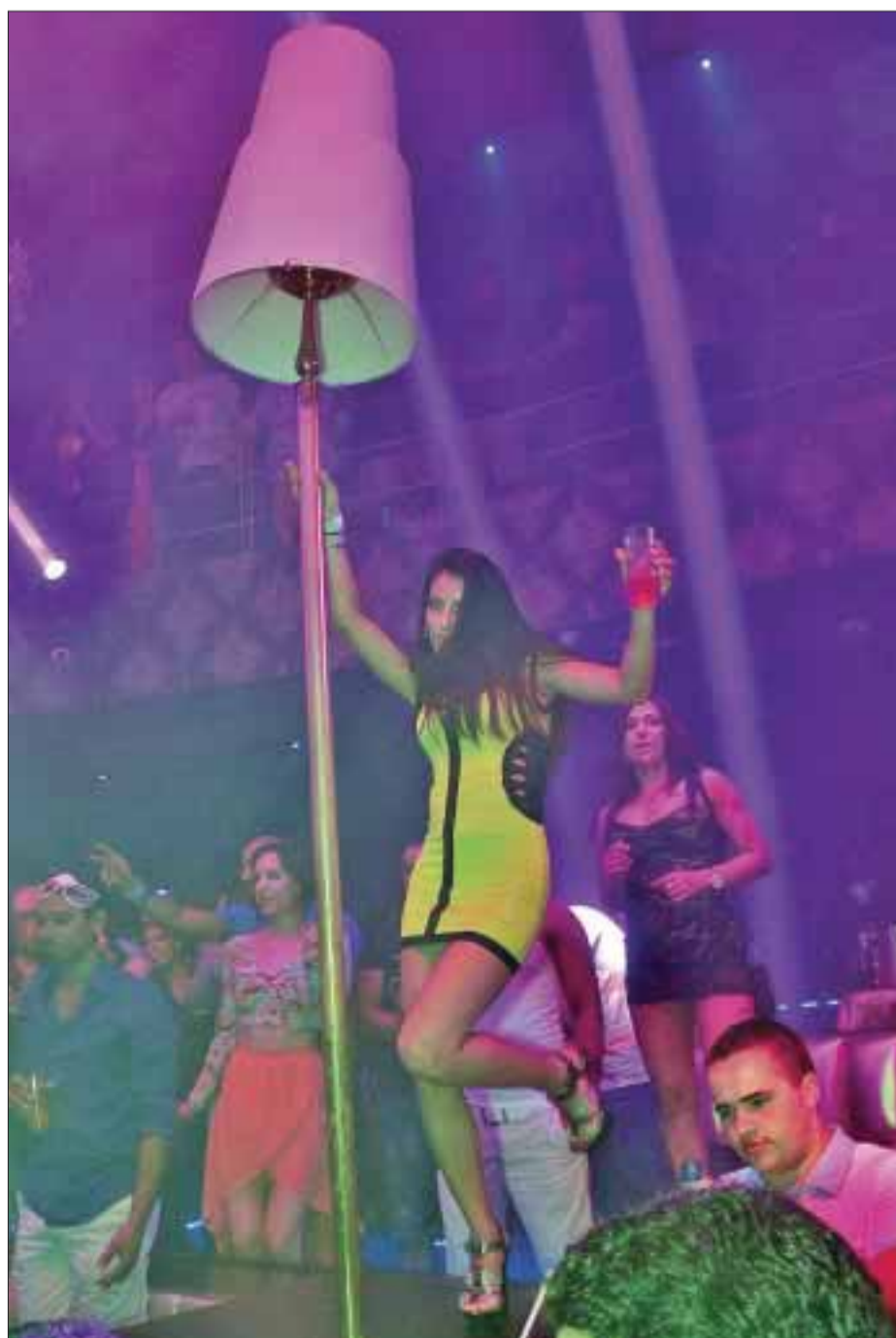
Así vivió la música esta invitada.