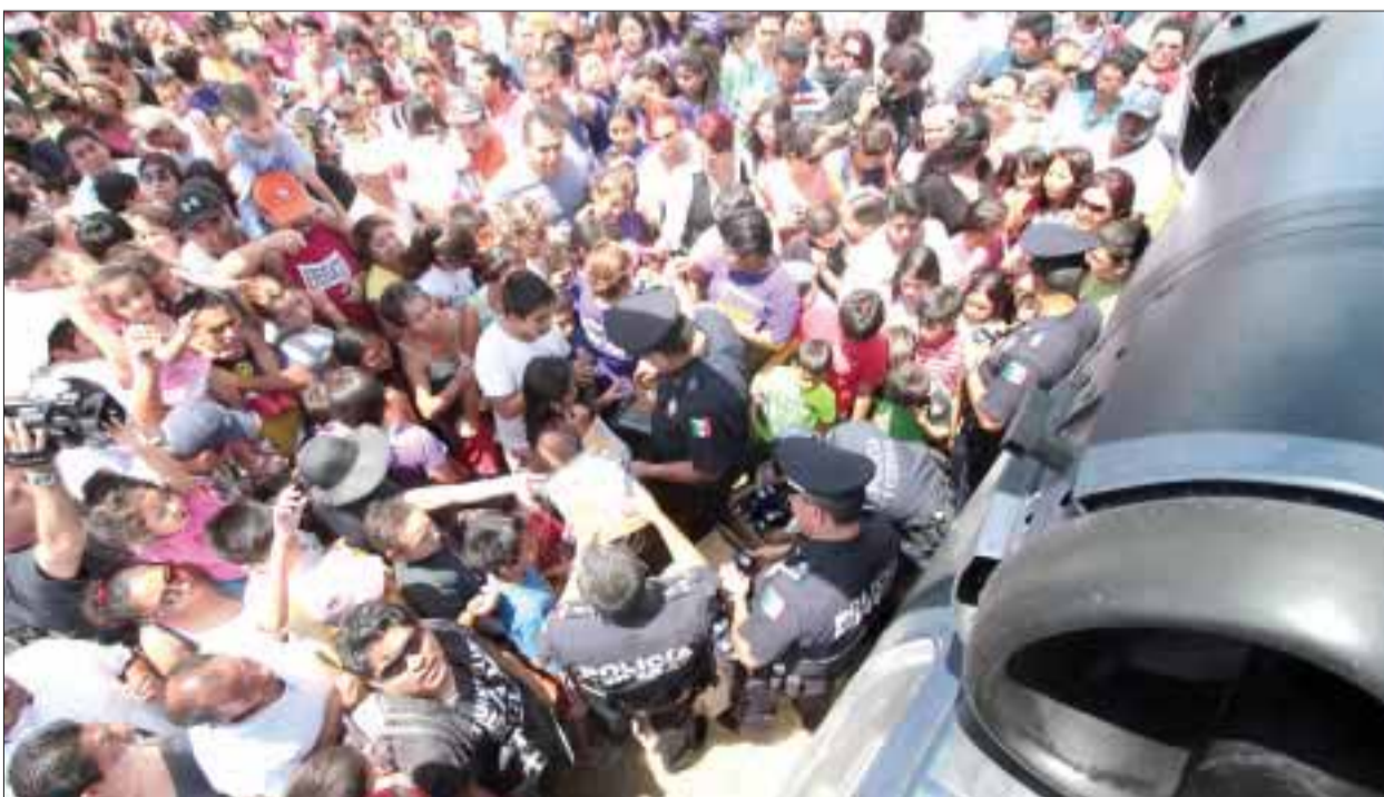
Los espectadores reciben material didáctico y pequeños carros de plástico pintados como patrullas.