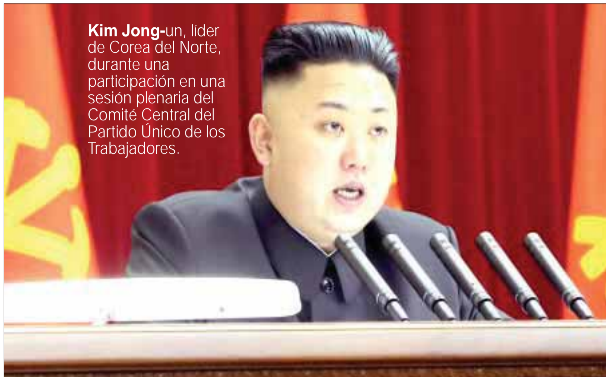
Kim Jong-un , líder de Corea del Norte, durante una participación en una sesión plenaria del Comité Central del Partido Único de los Trabajadores.