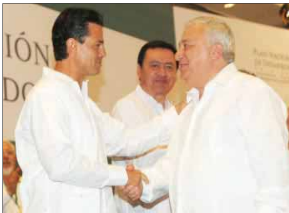
El presidente Enrique Peña Nieto felicita al secretario de Educación, Emilio Chuayffet, tras su discurso en Boca del Río.

decisiones conjuntas para mejorar el proceso educativo en cada plantel. Significa darle autonomía de gestión al espacio donde se imparte educación, a la escuela”.