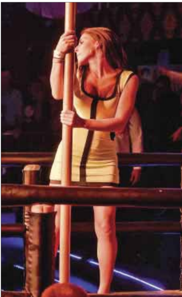
Hermosa colombiana realiza su mejor esfuerzo.