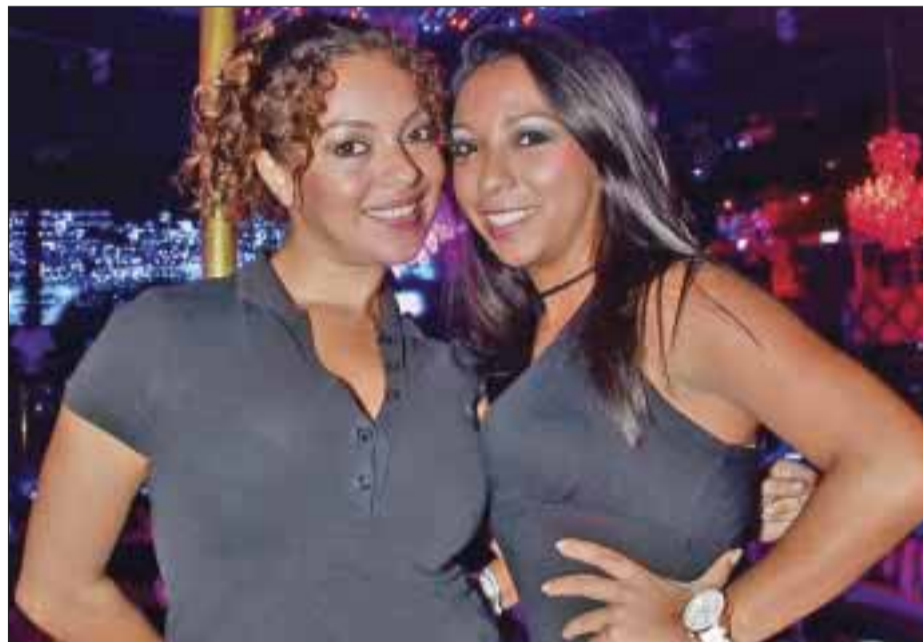
Visitantes en Quintana Roo.