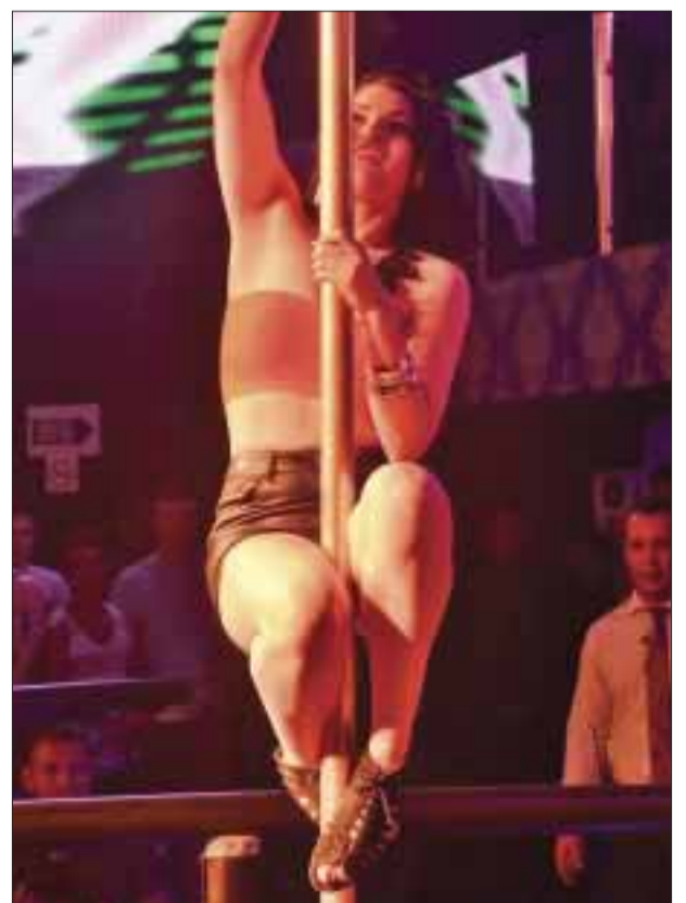
Venezolana baila en el tubo.