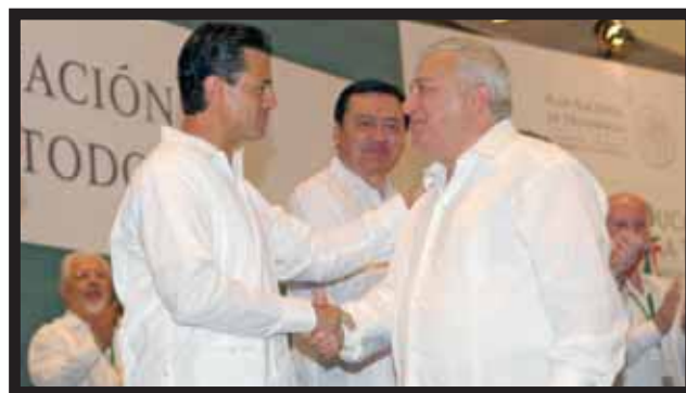
EL PRESIDENTE PEÑA NIETO y el secretario de Educación, Emilio Chuayffert.