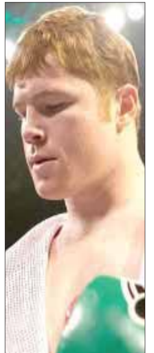
"Canelo" sigue entrenando en EU.