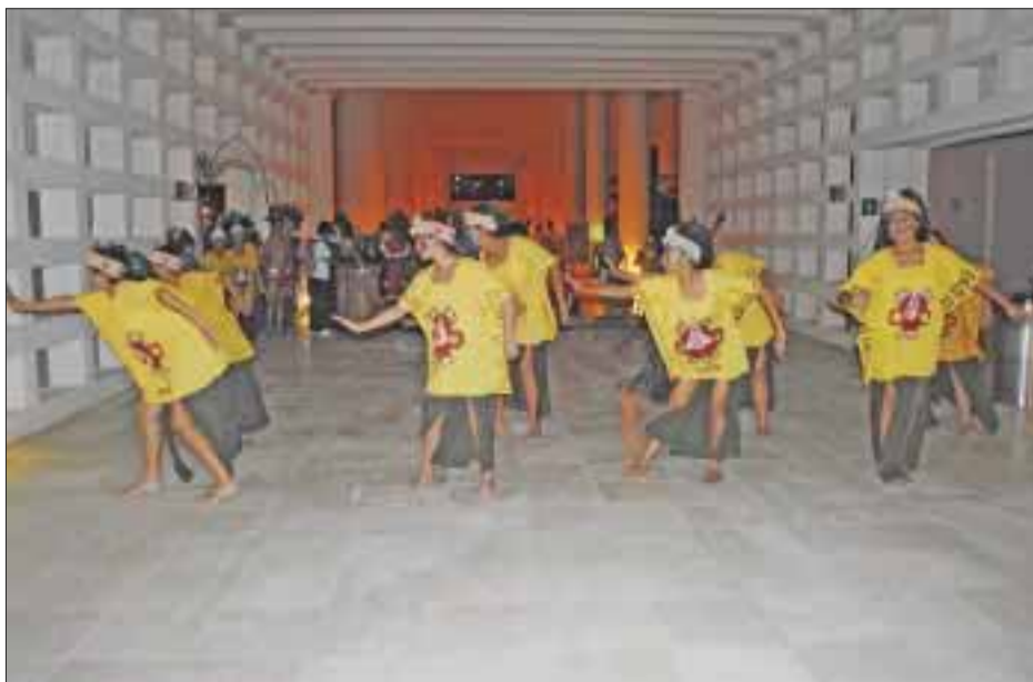
Danza prehispánica de bienvenida.