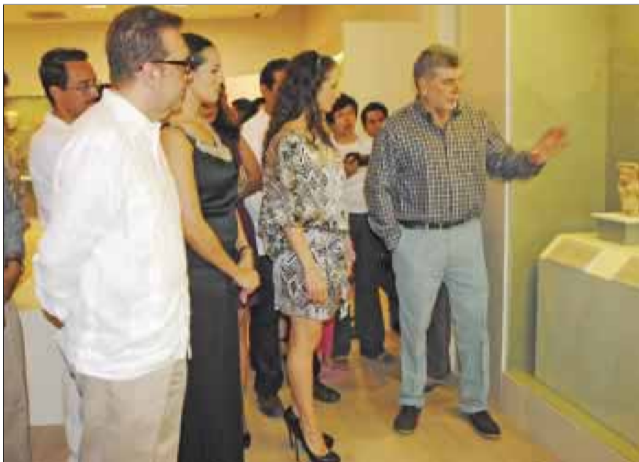
Durante el recorrido.