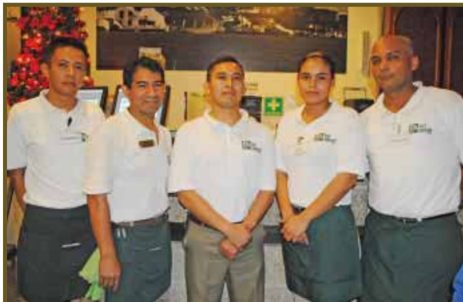
Personal posa para DIARIO IMAGEN.