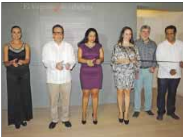
Durante el corte de listón.