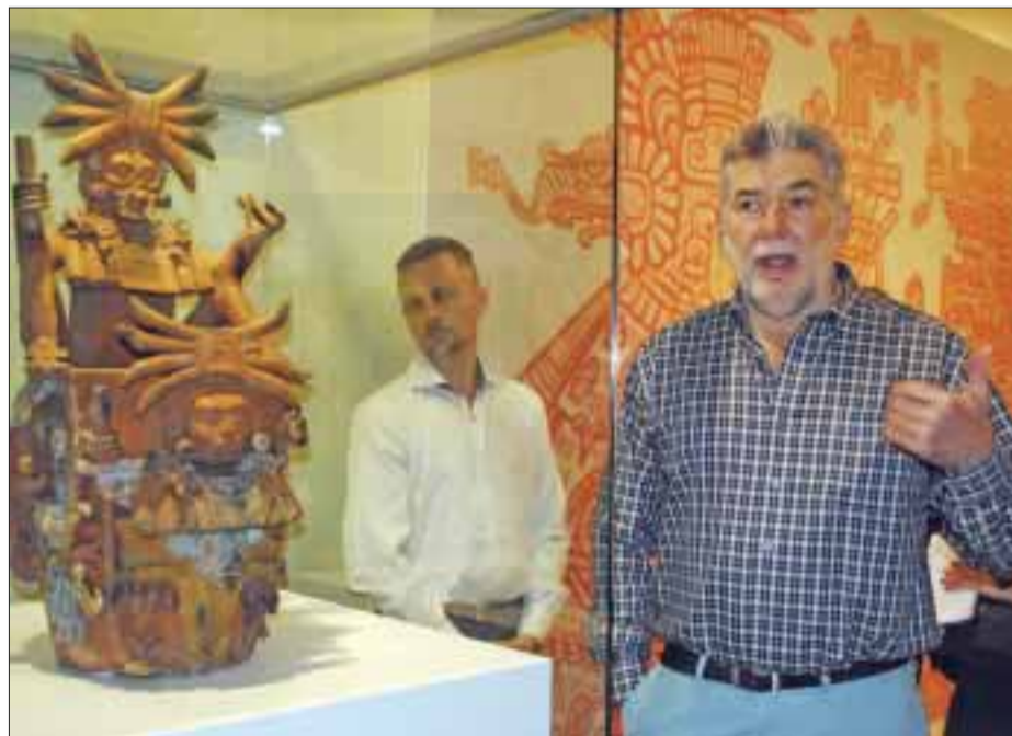
Explicando a los asistentes cada una de las piezas.