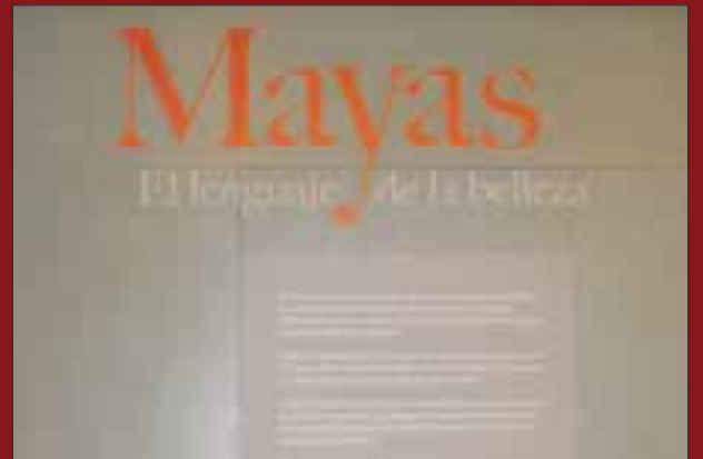
Entrada a la galería.