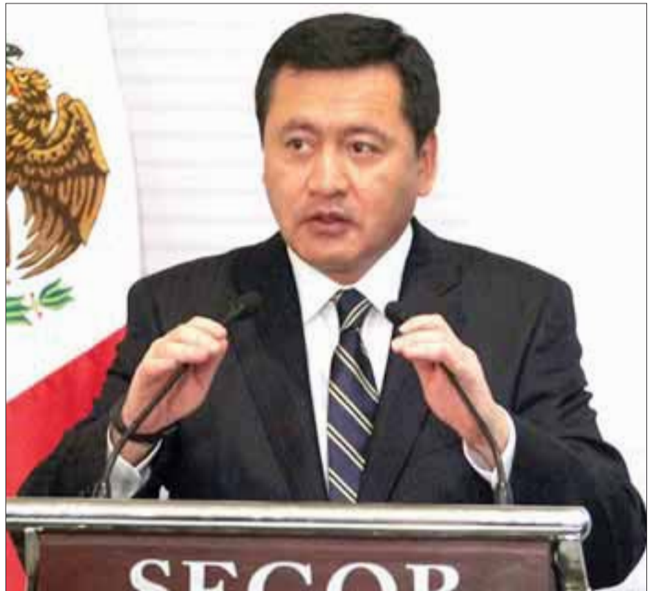
Miguel Ángel Osorio Chong, titular de la Secretaría de Gobernación, atestigüó la firma de la Declaratoria Ciudadana.

Sobre la reforma energética, criticó a quienes llaman al "encono y al enfrentamiento" y viven "anclados en el pasado", al asegurar que se venderá el país a empresas trasnacionales, cuando "nunca abandonaremos lo que nos pertenece", que es la rectoría del Estado sobre el petróleo y los recursos naturales