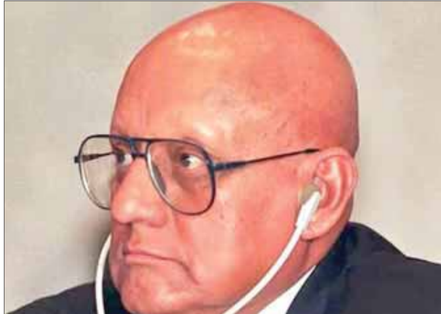
Imagen de archivo del general Jesús Gutiérrez Rebollo, quien fue zar antidrogas mexicano.

Los detenidos y los objetos incautados fueron trasladados ante el Ministerio Público de la Procuraduría General de Justicia del Estado de México (PGJEM), por los delitos de portación de arma de fuego y lo que resulte, con la finalidad de que se defina su situación jurídica.