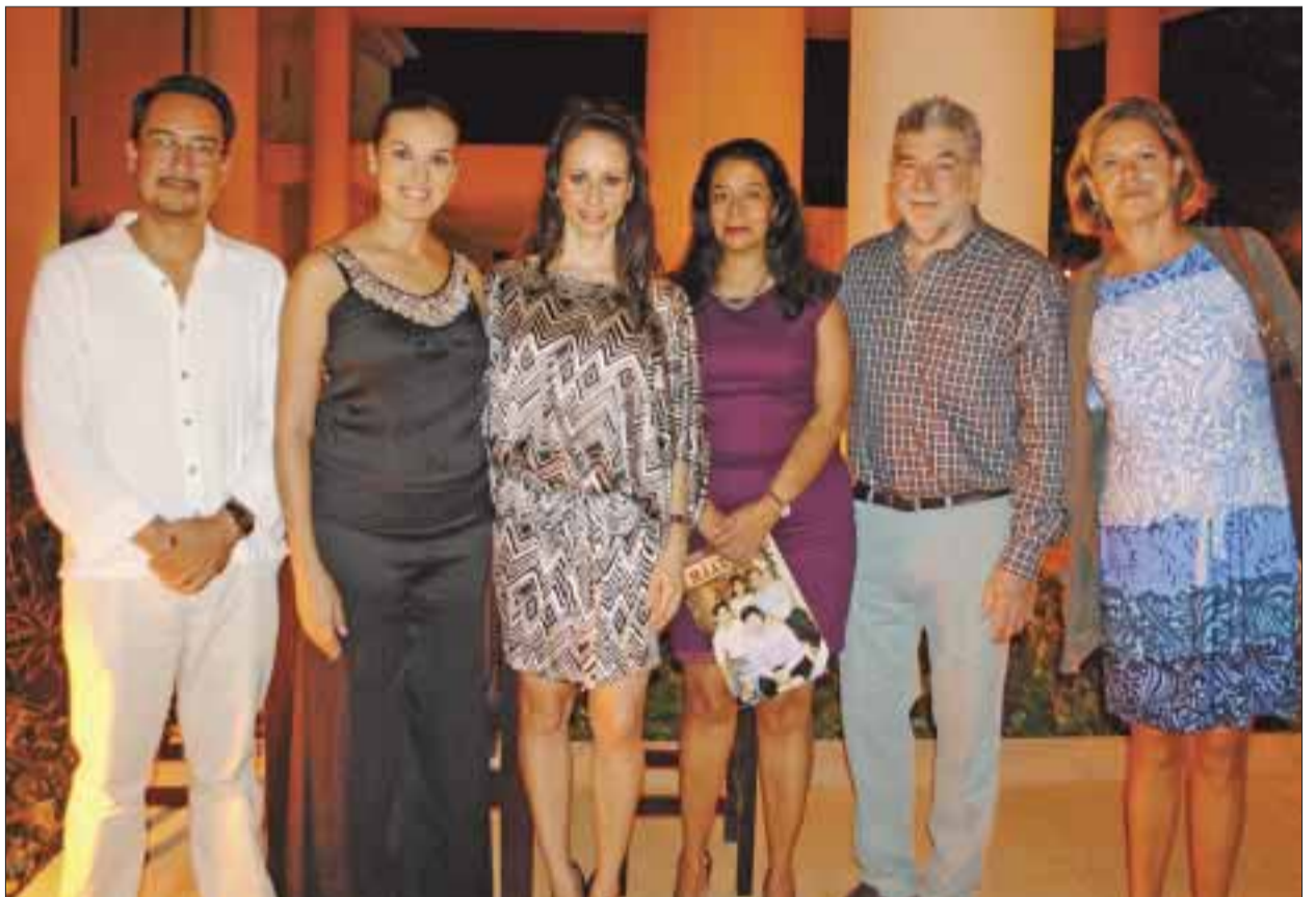
Posan para DIARIOIMAGEN.

Estimado, lector si tiene algún acontecimiento social, cultural, deportivo, etc. Envíenos un correo y DIARIO IMAGEN con gusto lo cubrirá y publicará. diarioimagenqroo@gmail.com