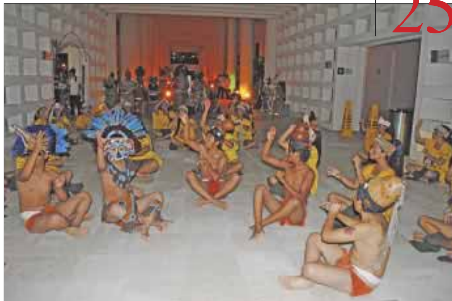
Jóvenes realizaron gran interpretación.