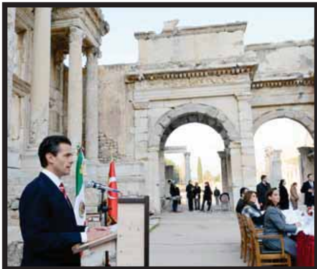
EL PRESIDENTE DE MÉXICO, en Éfeso.