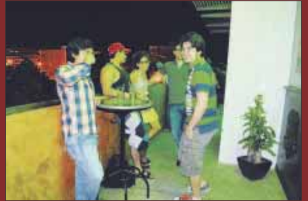
Los chicos disfrutan de la terraza.