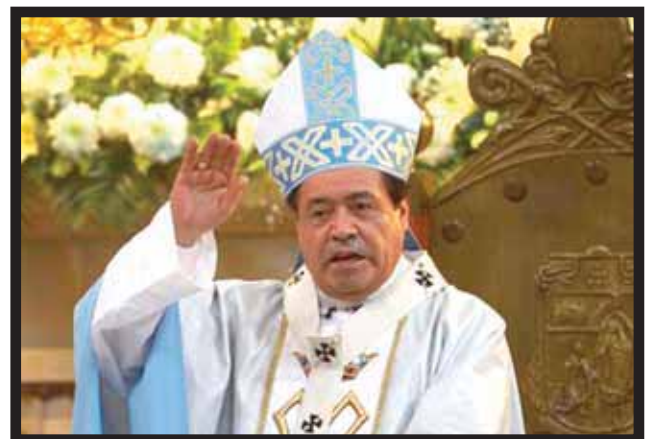
EL CARDENAL reitera su rechazo al aborto