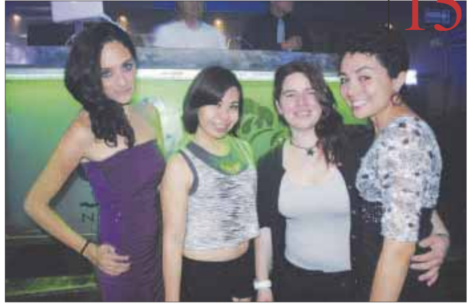
Una noche de baile y tragos.