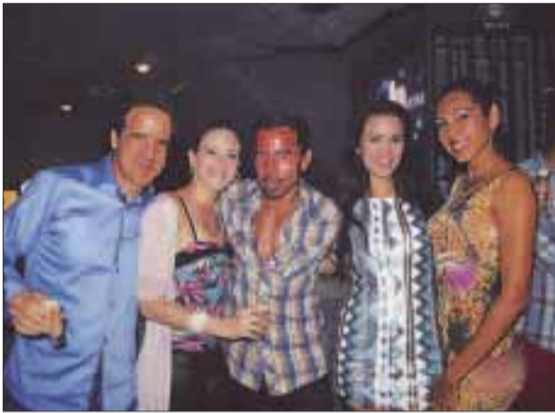
Diversión y glamour están presentes.