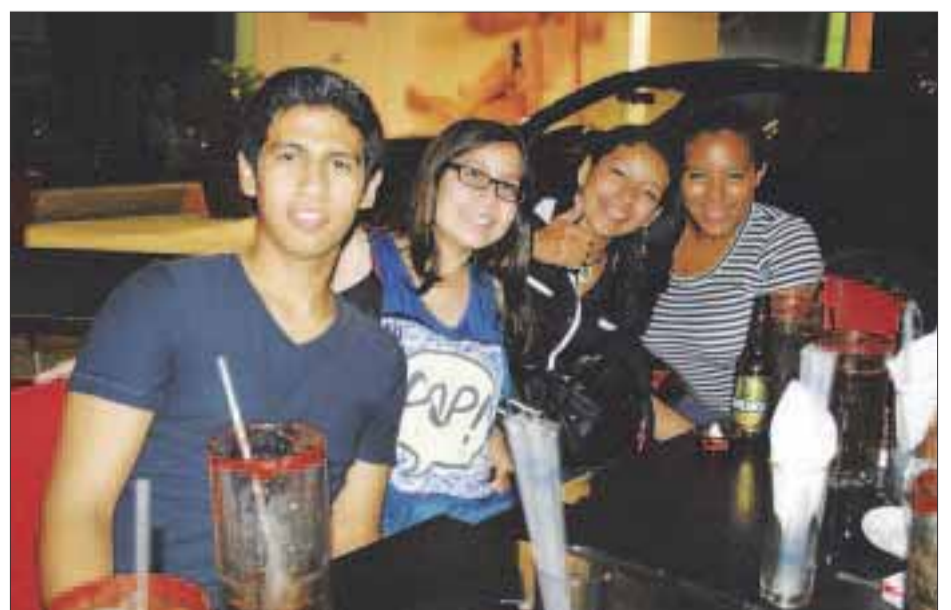
Después de un día de trabajo, los jóvenes salen a gozar.