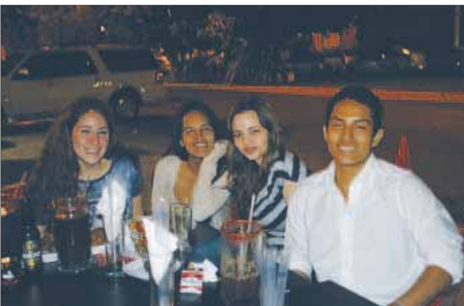
Conviviendo en la noche.