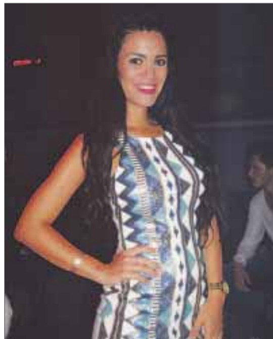
Glamour y sensualidad.