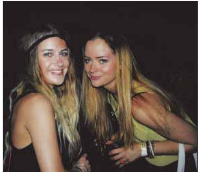
Las extranjeras también se divierten.