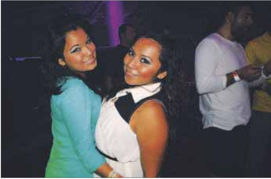
Lindas chicas divirtiéndose en el antro.