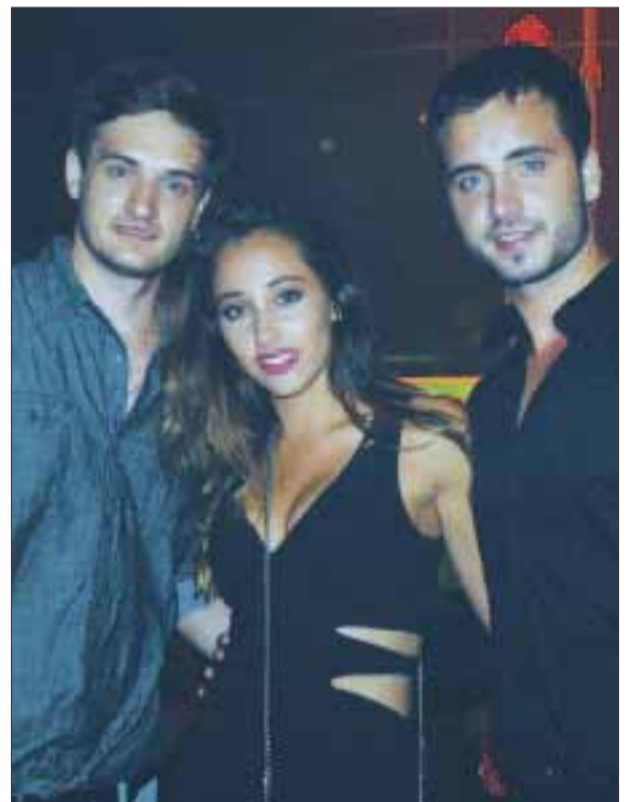
Los guapos salen a la conquista por la noche.