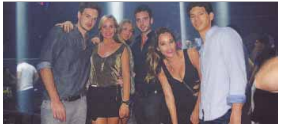
Los guapos y guapas sobre la pista.