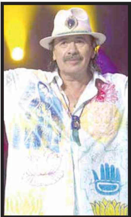
A sus 66 años Santana dio un concierto de casi tres horas.