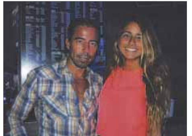
Todos salen a divertirse.