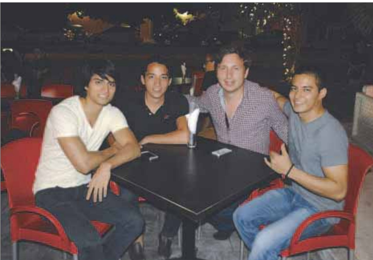
Chavos comparten una noche de bar.