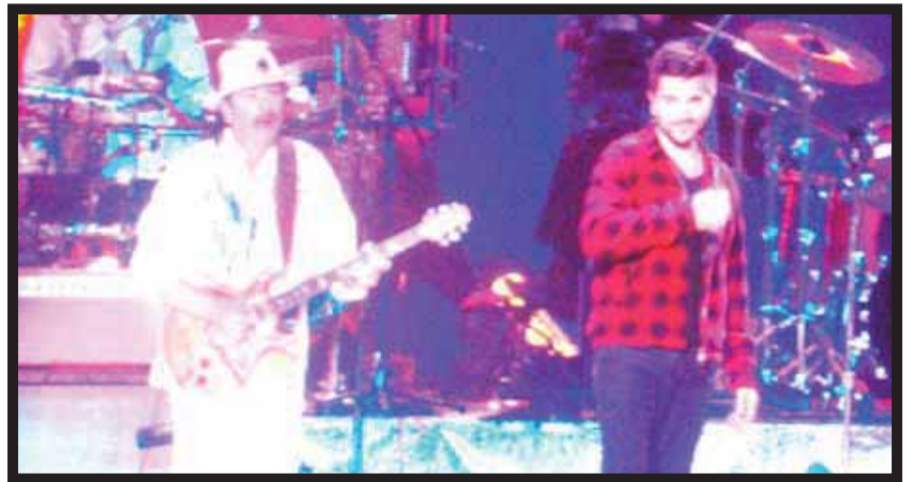
Carlos Santana y Juanes

Con un pantalón blanco y una camisa en la que destacaba la imagen de la Guadalupeana, Santana interpretó con los singulares sonidos de su guitarra muchos de sus éxitos: "Oye Como Va", "Europa", "Black Magic Woman", "Samba pa ti".