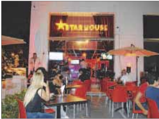
Los bares ofrecen gran diversidad de entretenimiento.