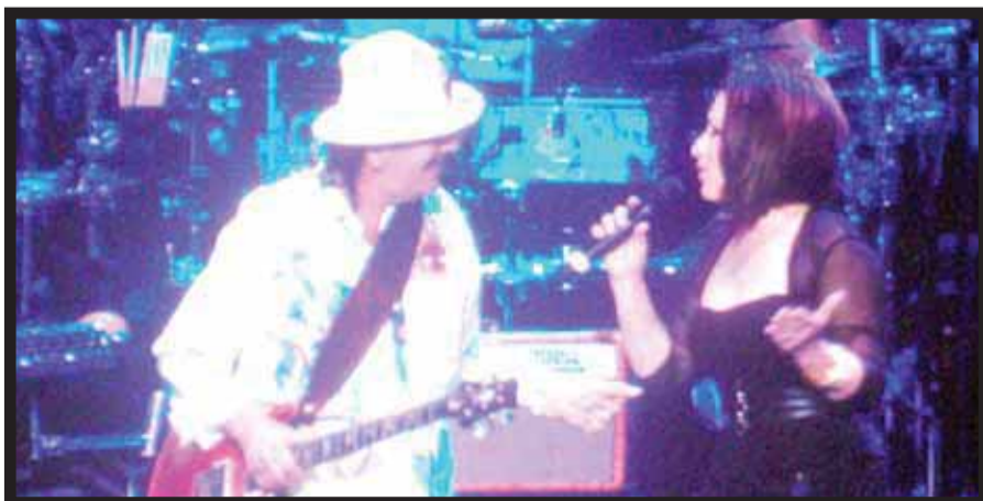
El guitarrista con Gloria Stefan.