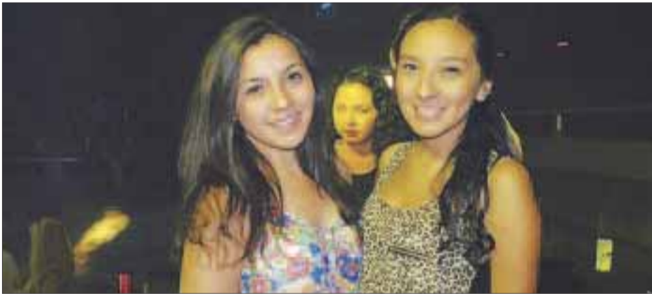
Las chicas disfrutan de una linda noche.