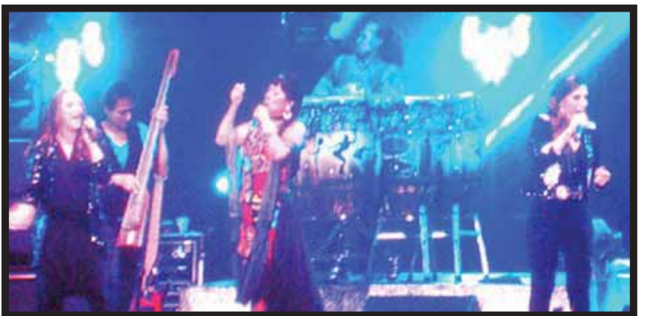
Niña Pastori, Lila Downs y Soledad.