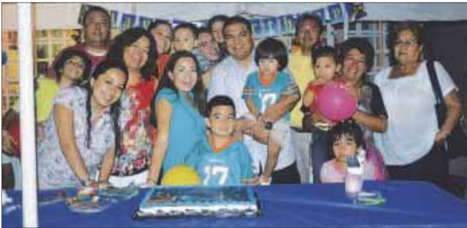
La feliz familia posa para DIARIOIMAGEN.