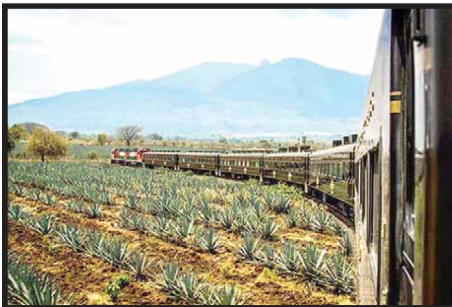
El tren pasa por hermosos paisajes de agave azul.