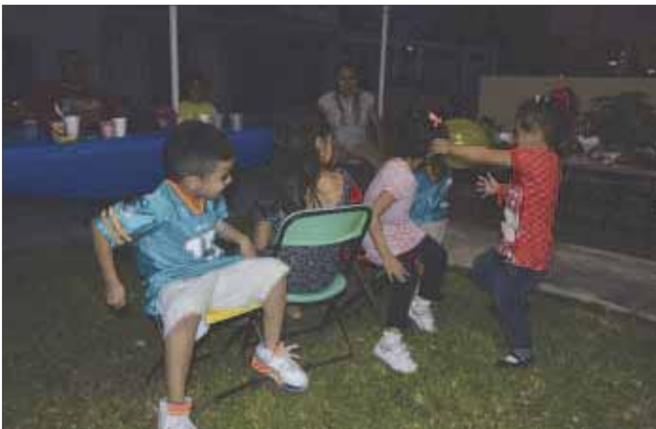
En el juego de las sillas.