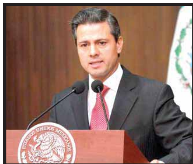
EL PRESIDENTE ENRIQUE PEÑA NIETO envió su mensaje de Año Nuevo.