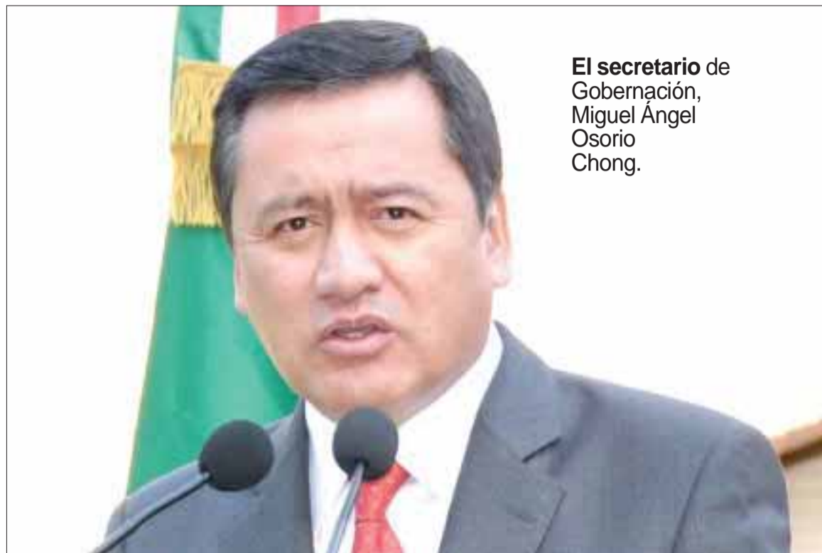
El secretario de Gobernación, Miguel Ángel Osorio Chong.