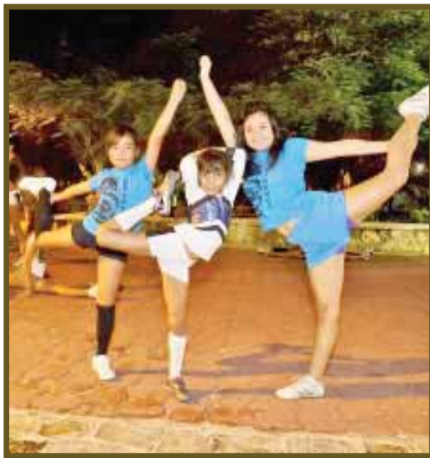
El deporte es para todas las edades, sin distinción de sexo.