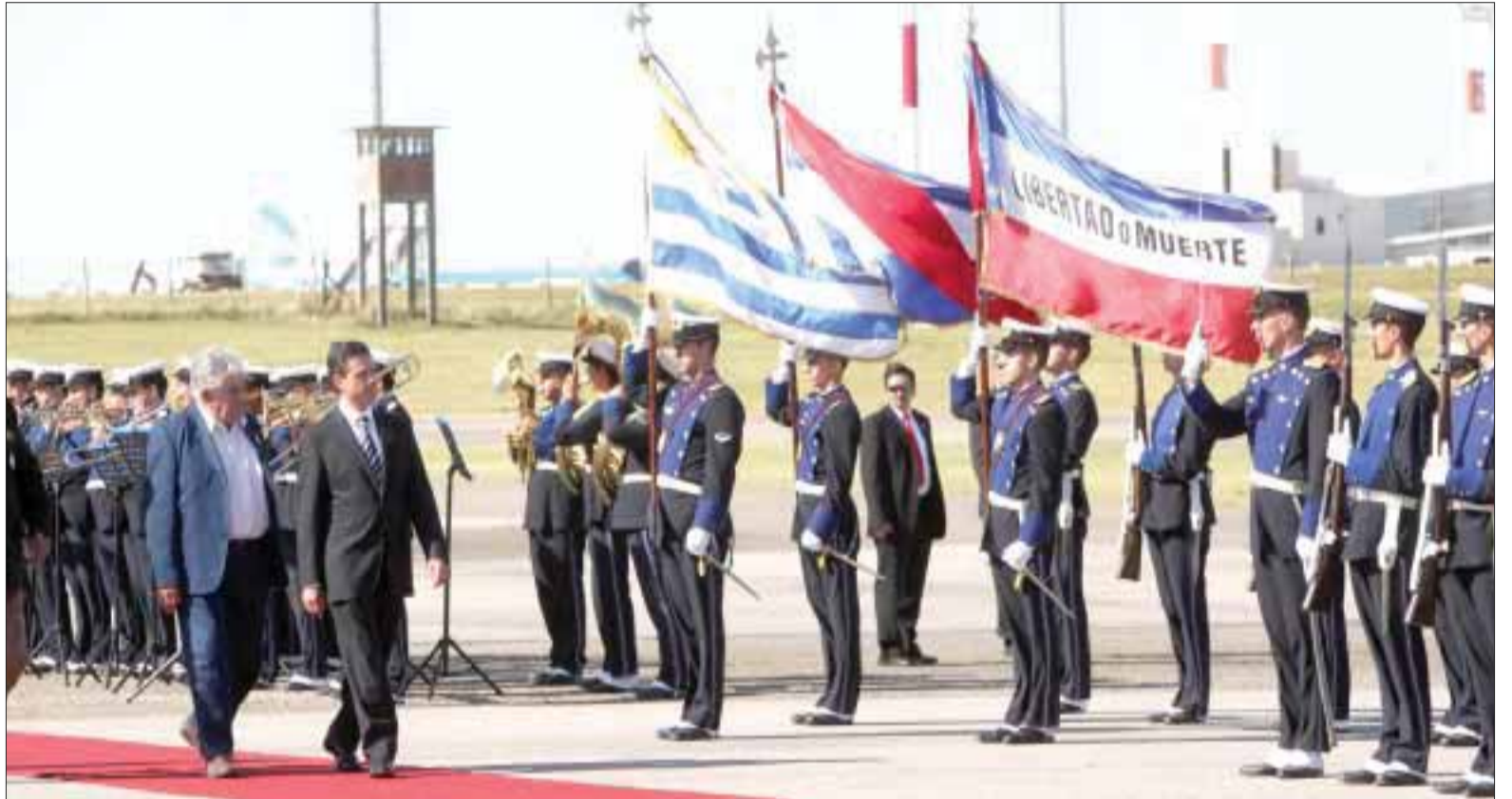
El presidente Enrique Peña Nieto pasa revista a la Guardia Nacional de Uruguay, al llegar a ese país, acompañado por su homólogo de esa nación, José Mújica.

Peña Nieto admitió que el mundo ha dejado de ser bipolar y ahora es multipolar, "no sólo hay países emergentes, si-