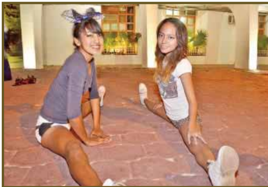
El compás es uno de los calentamientos durante sus prácticas.