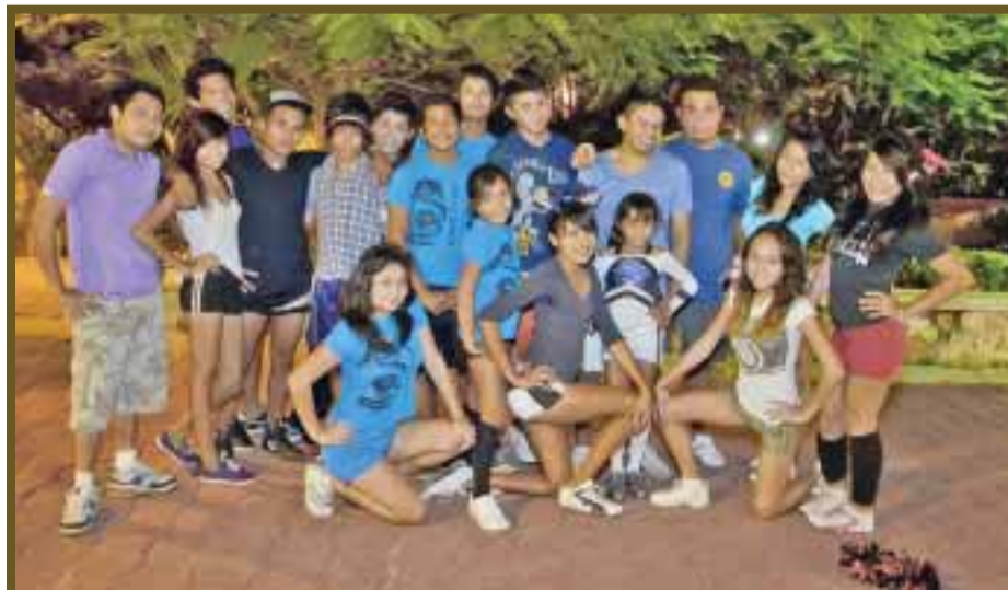
Grupos de niñas, jovencitas y varones se preparan a diario.