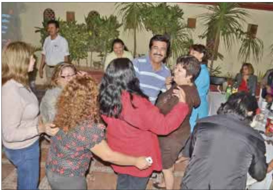
Los participantes en el festejo y le dieron su agasajo a la homenajead.