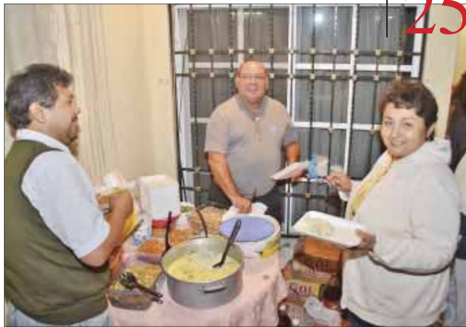
Los maestros disfrutaron de los platillos que ellos mismo prepararon.