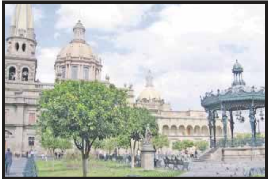
Guadalajara, sede de la 3ª. Annual International LGBT Business Expo.

las compañías se toman la molestia de entender y satisfacer las necesidades de sus clientes LGBT, lo que pueden esperar a cambio es una gran lealtad de marca y un buen aumento en las ventas. Se trata de un auténtico ganar-ganar. Sandoval dijo que el estudio LGBT2020 considera que el 6% de la población adulta de Guadalajara que se dice es LGBT es un número muy bajo, y que seguramente es mayor. "En realidad, Guadalajara es un centro de atracción, no sólo para sus residentes, sino también para los muchos miles de personas LGBT que llegan a la ciudad provenientes de otras poblaciones más conservadoras del norte del país. Esto hace que el impacto de la población LGBT en la ciudad sea aún más relevante para el gobierno y las organizaciones de todo tipo. La comunidad LGBT es un grupo muy extenso y significativo de los habitantes de Guadalajara". En la ciudad se encuentran muchos de los clubes LGBT más populares, así como muchos importantes centros comerciales que atraen grandes números de personas LGBT de otras ciudades durante todo el año. Los estimados de población y gasto de la zona metropolitana de Guadalajara se basan en los siguientes cálculos: Población mayor a 16 años al 2010: 3.2 millones. 2.6% de esta población mayor