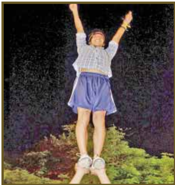
Medir el peligro para estos adolescentes es un entretenimiento.