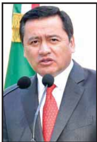
>14 Miguel Ángel Osorio Chong, secretario de Gobernación.

El dato En la coordinación es como vamos a lograr mejores resultados, mejores circunstancias, por eso buscamos responder de acuerdo a los requerimientos de cada estado