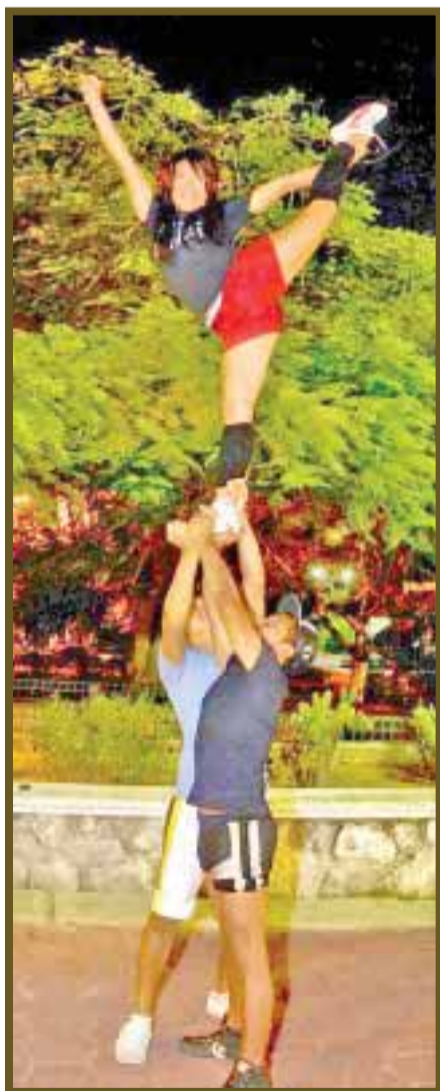
Personas de ambos sexos realizan piruetas en el aire.