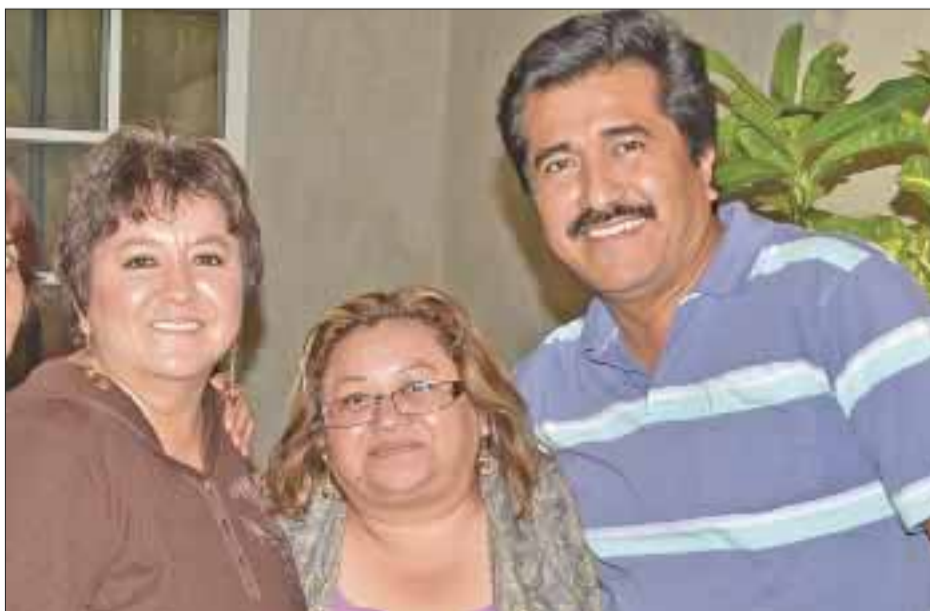
La festejada, en compañía de sus amistades.