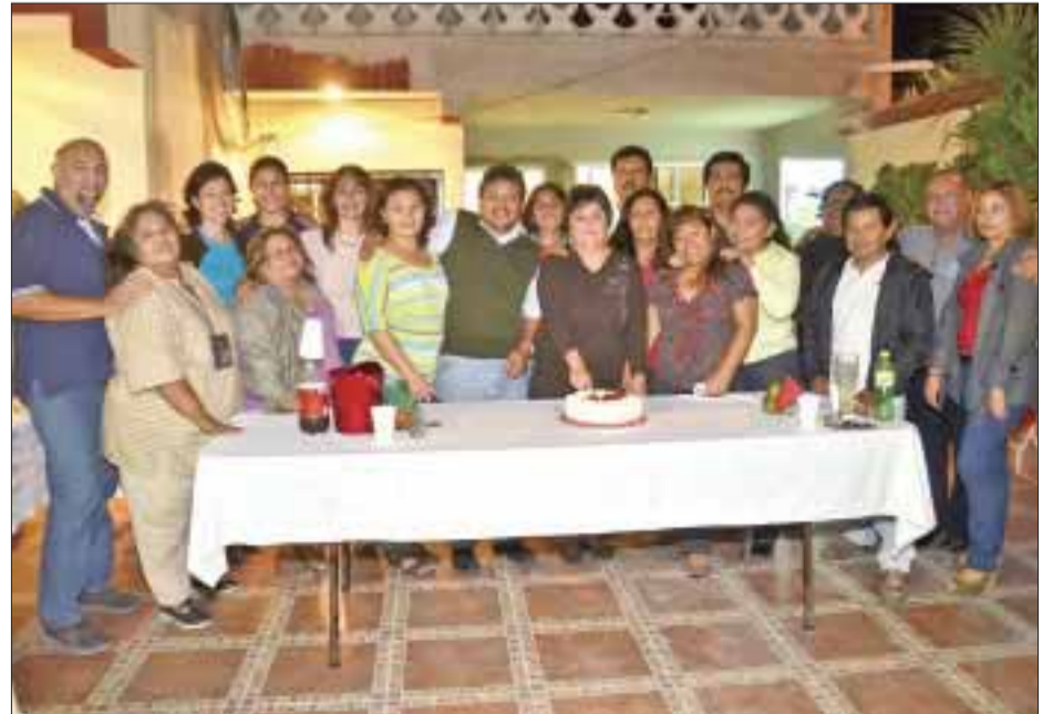
Familiares, maestros y amigos, junto a la festejada.