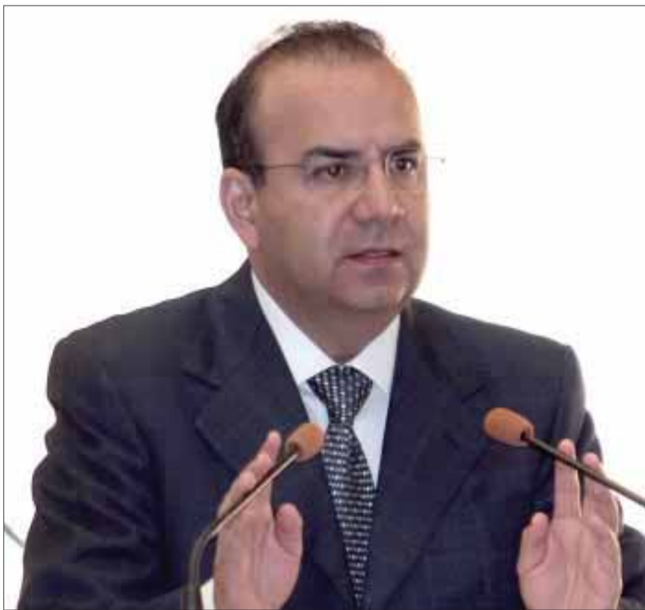
El secretario del Trabajo, Alfonso Navarrete Prida, habló del caso de los trabajadores de Mexicana de Aviación.

Alfonso Navarrete Prida señala que la solución del caso debe contemplar la recontractación de empleados y deslindar responsabilidades jurídicas