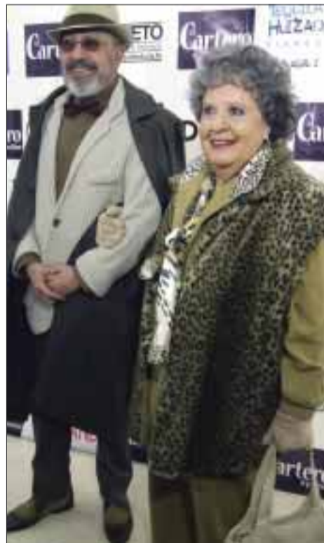
Por la alfombra roja desfiló Evita Muñoz Chachita .