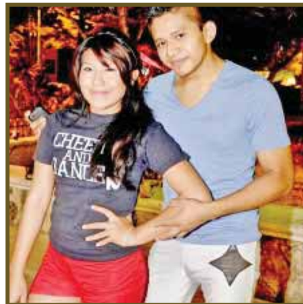
El maestro que prepara a jovencitas que desean sobresalir como porristas.