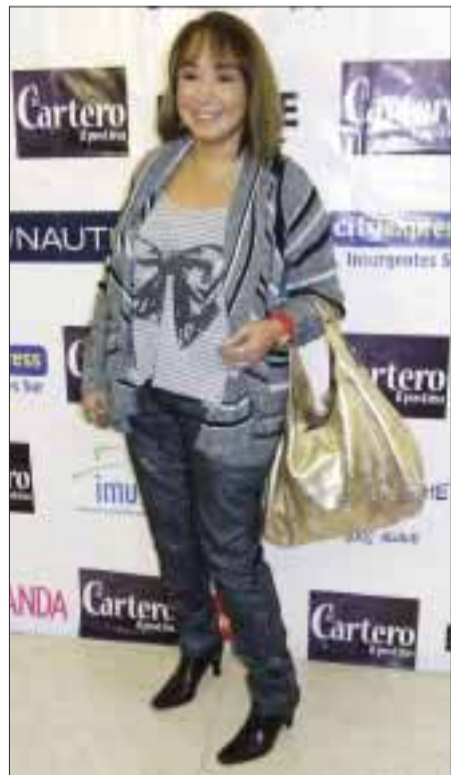
María Antonieta de las Nieves, La Chilindrina , ovacionó a Ignacio López Tarso.

“Es un niño muy trabajador, me encanta por eso, es un hombre al que admiro y creo que respetar y admirar a la persona con la que estás es muy lindo. Él respeta también mucho mi trabajo y hemos tratado de acoplar los tiempos”, declaró Sherlyn.