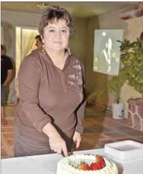
Momentos en los que Addy parte el pastel.