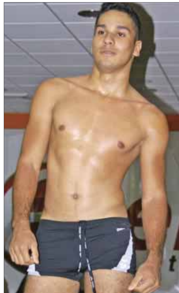
Modelo luce traje de baño tipo bóxer.