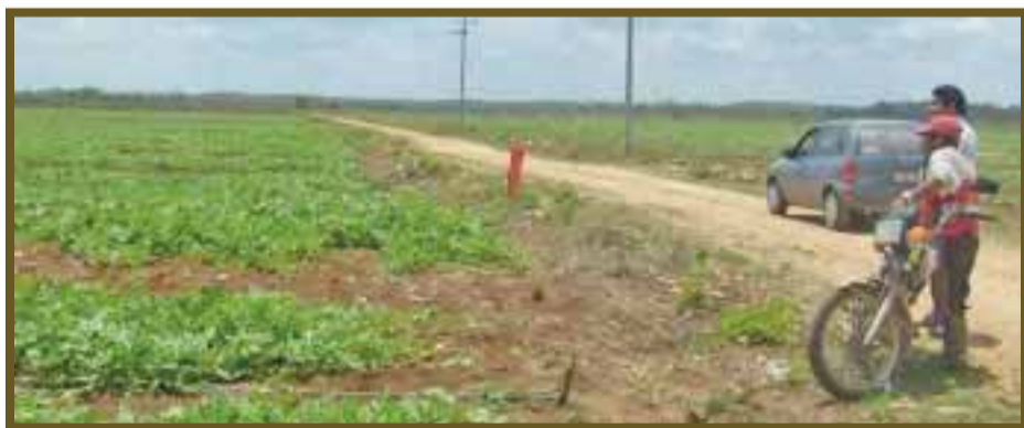
No respetan el uso del suelo en la Reserva de la Biosfera de Balam Kaax.