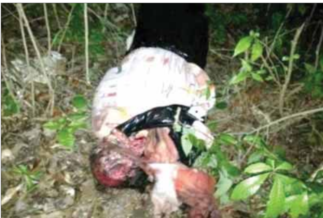
El ahora occiso estaba llevando un caso de regularización de tierras en la Notaría 75 de Isla Mujeres.

Cancún. -Una joven de 23 años denunció a Eladio Loaiza Chiquete, de 59 años de edad, quien la había violado al interior de su casa, cuando éste la contrató como empleada doméstica. El tipo fue detenido en base a la Averiguación Previa 45/1/2013.