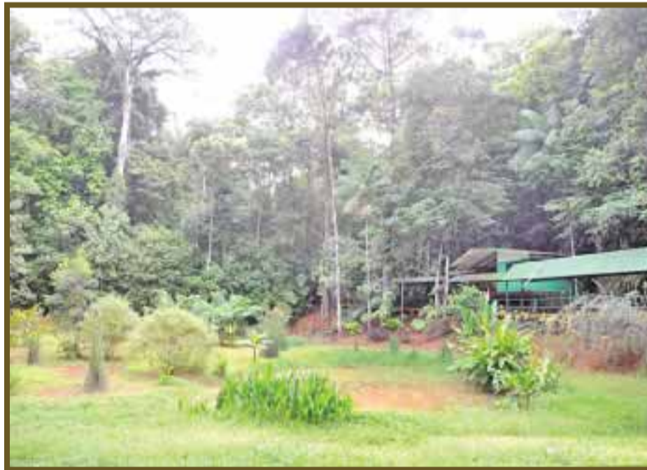
Ya son varios grupos de menonitas que se han apoderado de grandes extensiones de tierras.