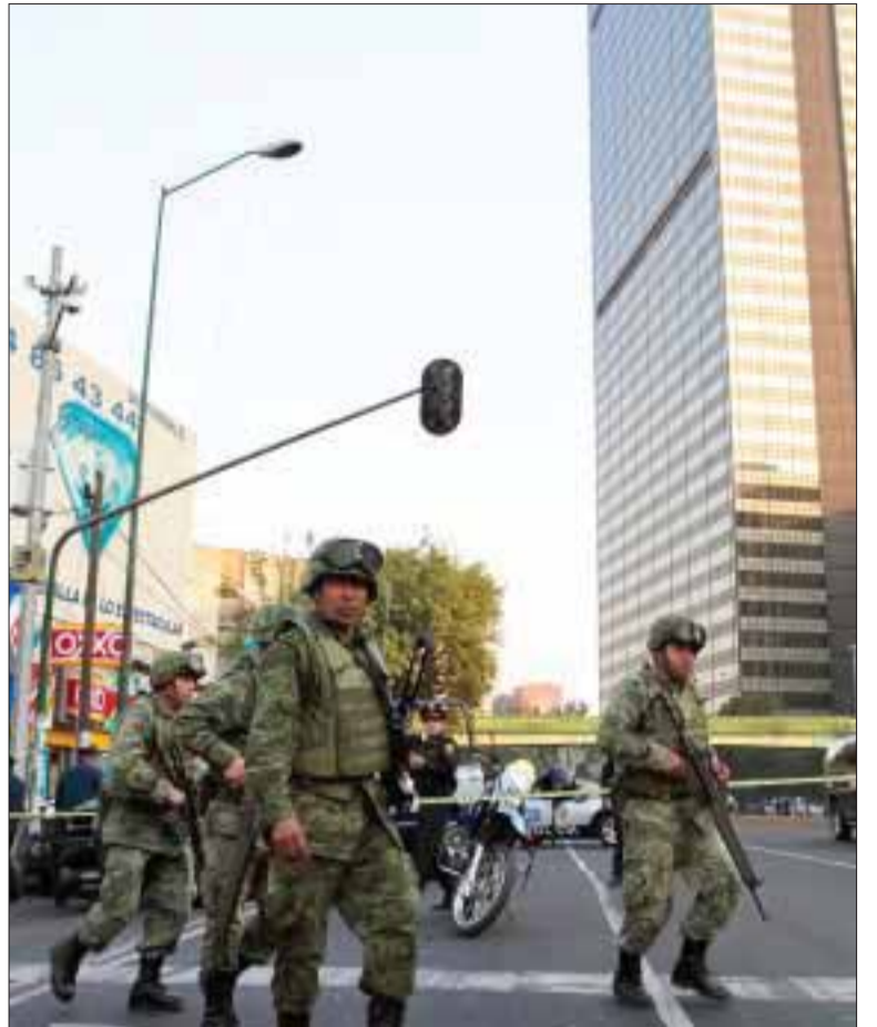
Elementos del Ejército mexicano desplegaron el Plan DN-III en las inmediaciones de la paraestatal.

Peña Nieto acude a supervisar labores de rescate