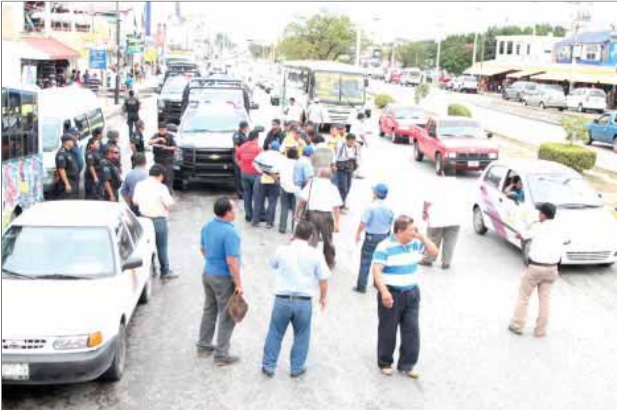
La avenida López Portillo estuvo cerrada por casi 2 horas, afectando a más de 15 mil automovilistas.