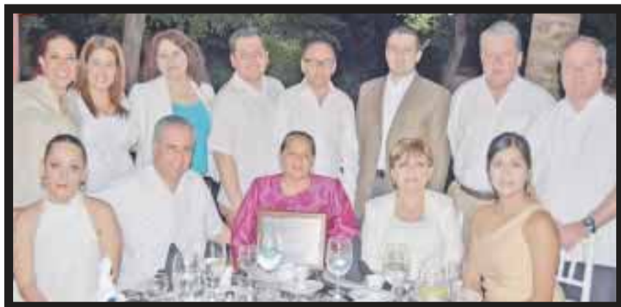
En la Convención Nacional de Hoteles Misión.

☆☆☆☆☆ Las fiestas de Moros y Cristianos son las más importantes de Alcoy, en Valencia, España. Están dedicadas a San Jorge y a su alrededor existe una gran tradición. Se celebran desde el siglo XVI y recuerdan una batalla ocurrida en 1276. En aquella época, la ciudad se encontraba en la zona fronteriza con el territorio dominado por los musulmanes en la península. Las escaramuzas eran frecuentes y el 23 de abril de ese año, las tropas árabes de Al-Azraq intentaron asaltar la villa. Cuenta la leyenda que, en el transcurso del enfrentamiento, apareció San Jorge y gracias a su intervención, el ejército cristiano ganó la batalla, provocando la retirada definitiva de los musulmanes. Como reconocimiento, los habitantes de Alcoy le nombraron patrón de la localidad y prometieron celebrar una fiesta en su honor cada 23 de abril. De este modo, todos los años, la ciudad se engalana como si fuera la Edad Media para vivir su fiesta mayor. Los actos que conmemoran los hechos históricos se suelen celebrar tradicionalmente los días 22, 23 y 24 de abril. El primer día se produce el espectacular desfile de los bandos moro y cristiano: los miembros