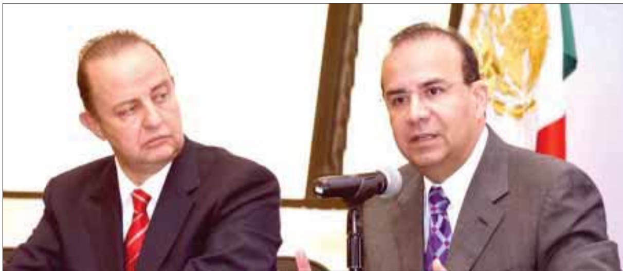
Alfonso Navarrete Prida , titular de la STPS, durante la firma del convenio de la revisión salarial de la CIIRT.