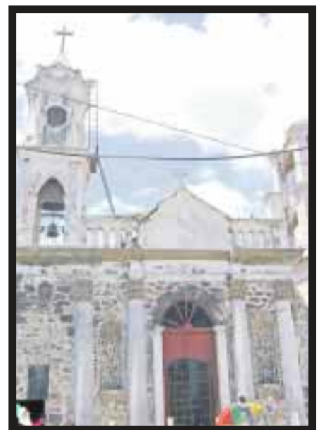
San Blas, en Nayarit, estará de fiesta.