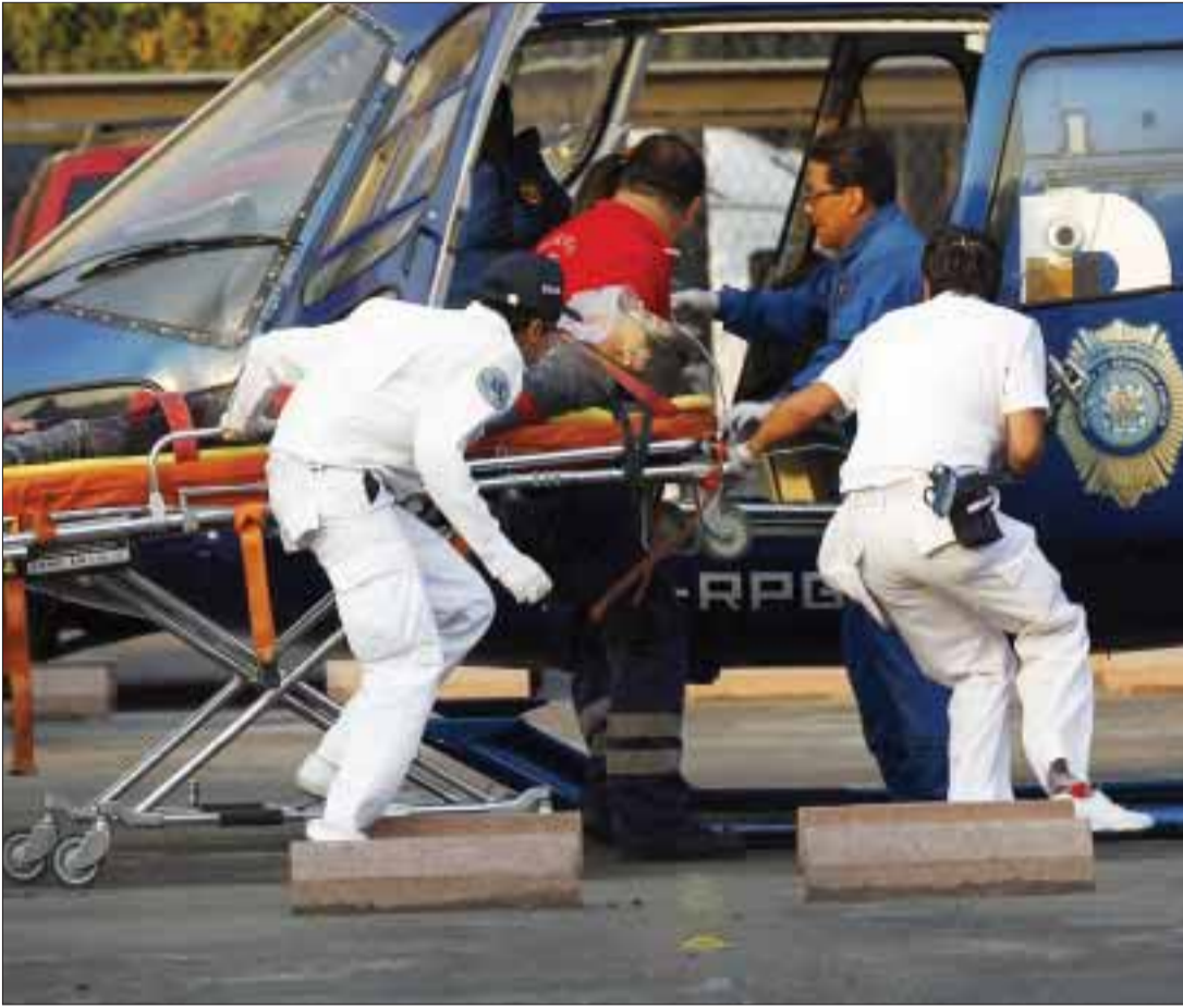
Momento en que los paramédicos del helicóptero trasladan a uno de los heridos en la explosión E-B-2 de la Torre de Pemex.