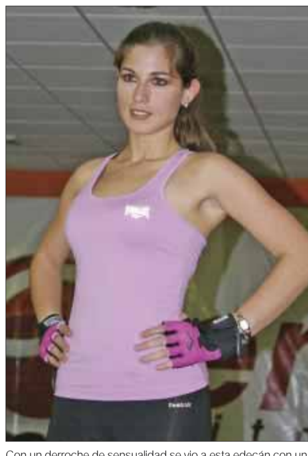
Con un derroche de sensualidad se vio a esta edecán con una prenda de dos piezas.