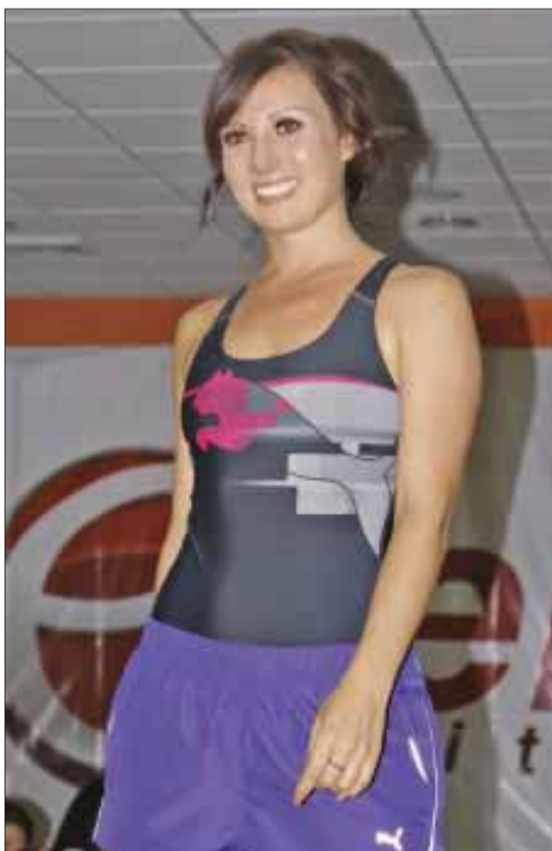
Guapa chica desfila y presenta un short y leotardo..