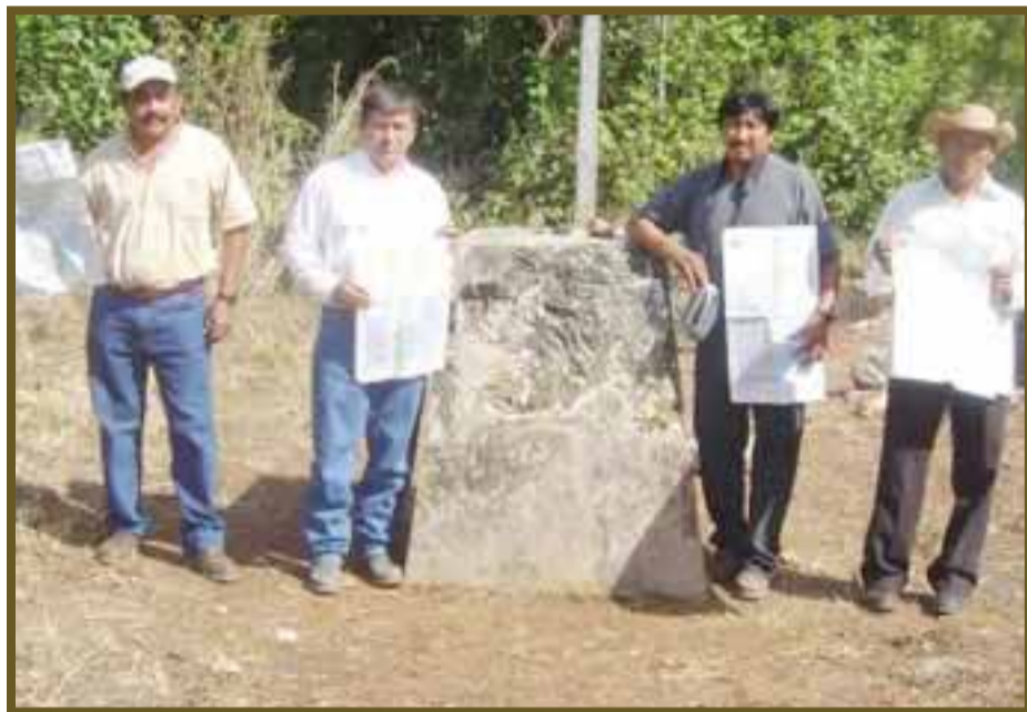
Este es el punto donde convergen los límites territoriales de Quintana Roo, Campeche y Yucatán.

El ambientalista consideró detrás de las invasiones se puede apreciar la intervención de personas o grupos que sólo tienen intención de especular con la tierra y es que son miles de hectáreas las que pretenden acaparar.