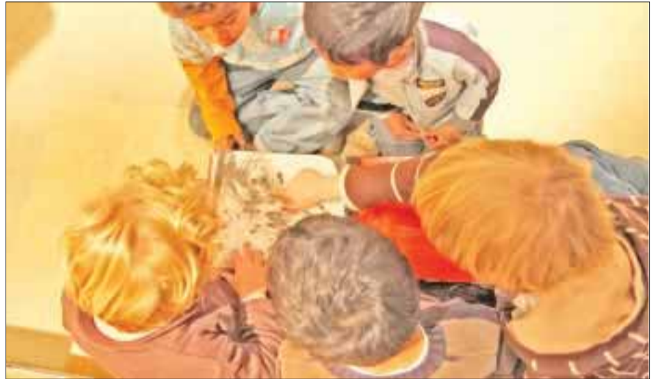
En ocasiones podemos encontrar padres irresponsables, que procuran dejar hasta lo más tarde posible a sus hijos.

Llegar o entrar sin saludar y sin presentarse. Entrar corriendo o aventando a las personas o cosas que traigan o estén a su paso. Gritar dentro de la casa, hotel, restaurante o el lugar donde se encuentren. Ser groseros o utilizar palabras o frases ofensivas o de falta de respeto. Interrumpir cuando dos personas estén hablando. En-