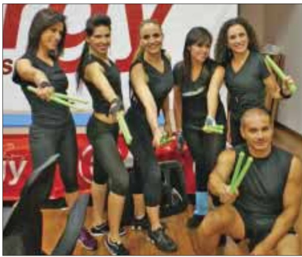
Instructores de "punch" en Energy.