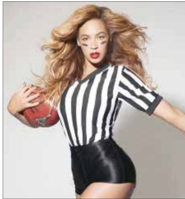
La cantante cautivó en el medio tiempo del Super Bowl.

La cantante Beyoncé se presentó e en la conferencia de prensa del medio tiempo del Super Bowl, en Nueva Orleans, donde interpretó una vez más, el Himno Nacional estadounidense, demostrando que puede cantarlo en vivo.