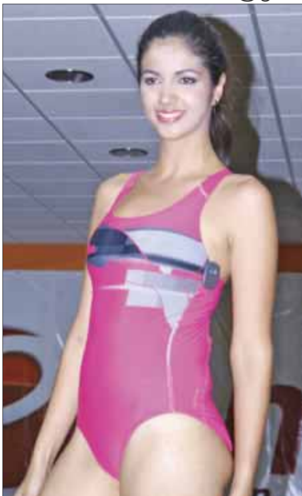
Traje color rosa con estampado lució la modelo.

La pasarela inició con ropa y accesorios de las mejores marcas de la tienda Gran Chapur, mostrando la última tendencia en shorts, playeras, pants, faldas, tenis, trajes de baño y todo lo necesario para realizar tu deporte preferido, finalizando con un coctel, donde convivieron los asistentes.