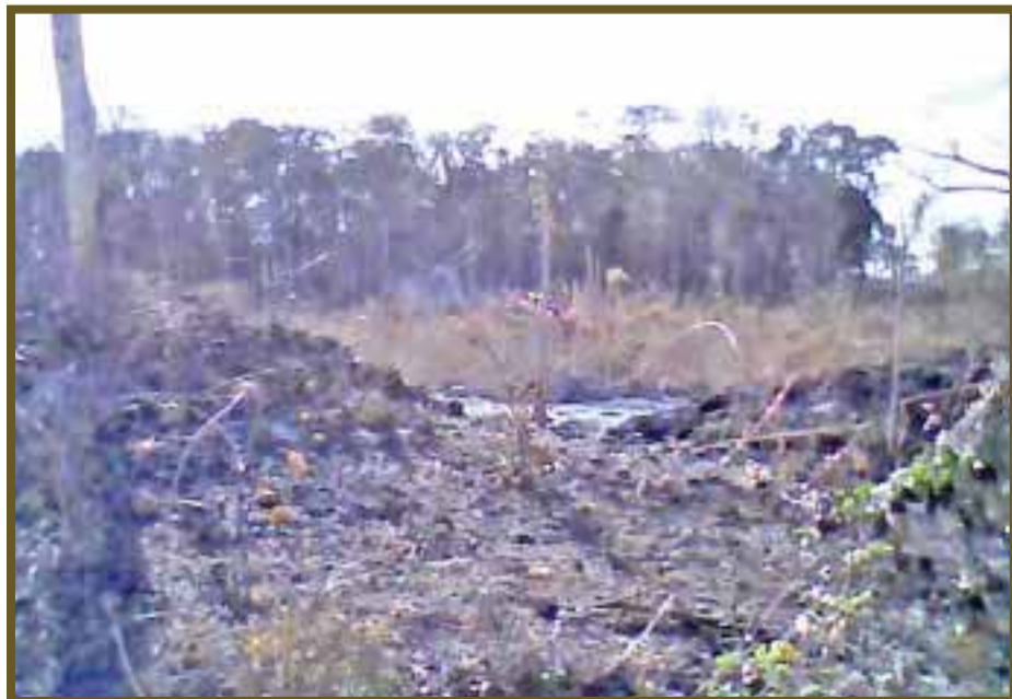
El año pasado, los menonitas fueron denunciados por provocar incendios.