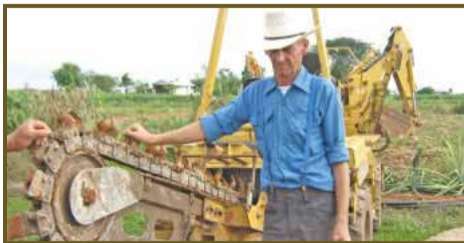
Invasores han causado diversos daños al medio ambiente.