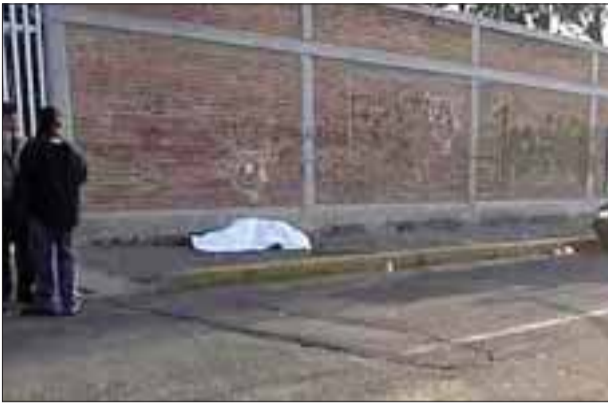
Así dejaron un cadáver en la colonia Agua Azul de Nezahualcóyotl.