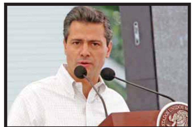
ENRIQUE PEÑA NIETO se solidariza con víctimas del estallido.