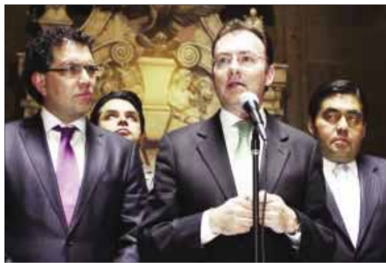
El secretario de Hacienda, Luis Videgaray Caso, se reunió con los senadores del PRD para analizar endeudamiento de estados y municipios.

tamos trabajando sobre el crédito para abaratar su costo para la Pequeña y Mediana Empresa y hacer más accesible el costo del financiamiento", expresó. El funcionario federal aseguró que fue un honor haber recibido a los senadores del PRD en Palacio Nacional, con quienes dijo que sostendrá muchos otros encuentros.