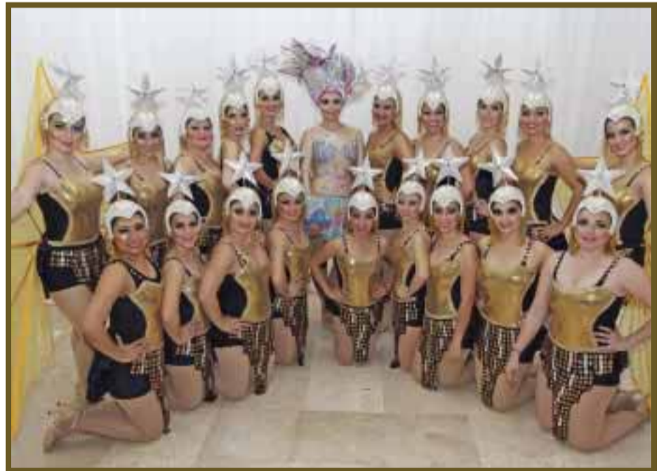
El concepto de comparsa titulada "Chinga-eras-mayas" se llevó el primer lugar.