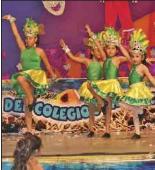
Niñas de la escuela Juan Escutia realizan baile folklórico.