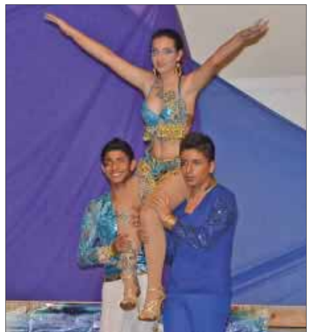
Compañeros alzaron a la reina del colegio.