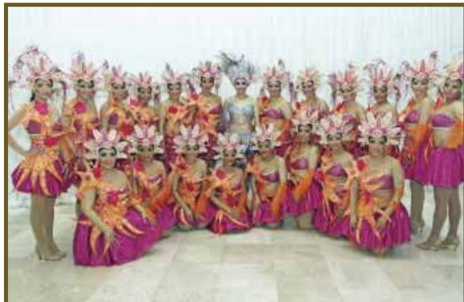
Segundo lugar para "Mágiko Caribe".