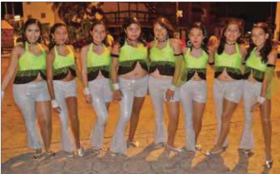
Destello Tropical participó en Las Palapas.