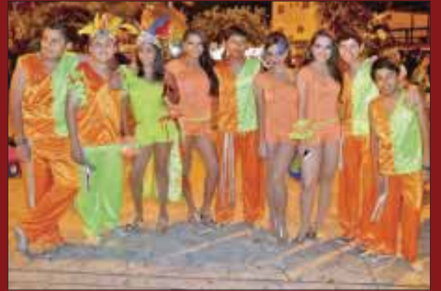
Alumnos del Juan Escutia participaron en el carnaval 2013.