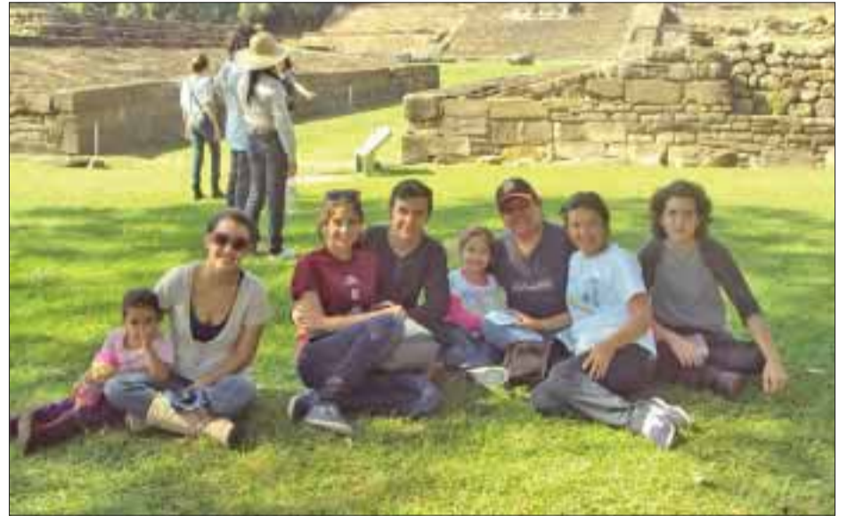
Las familias prósperas en Dios siempre tendrán el sentido de unidad y felicidad.

1ª Corintios 12:4-6 dice: "Ahora bien, hay diversidad de dones, pero el espíritu es el