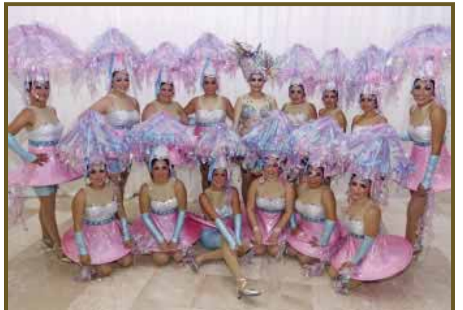
Tercer lugar para las integrantes de la comparsa "Chubasco Cubano".