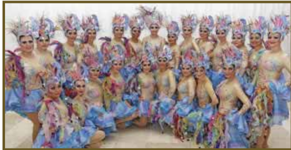
La comparsa "Akuagirls" fue la ganadora del primer lugar.