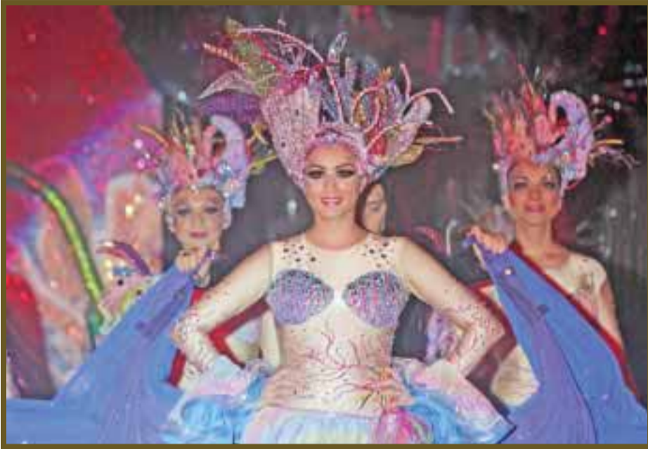
El primer lugar en categoría individual fue para "La Diosa del Caribe".