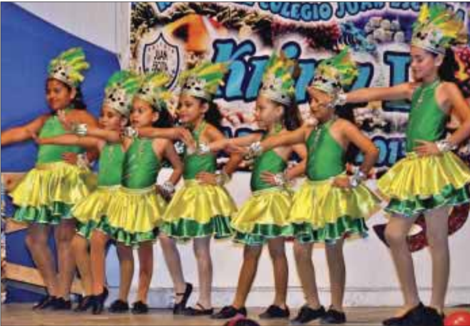
Bellas princesitas dieron su mejor concierto.