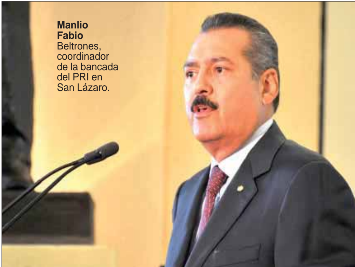
Manlio Fabio Beltrones, coordinador de la bancada del PRI en San Lázaro.