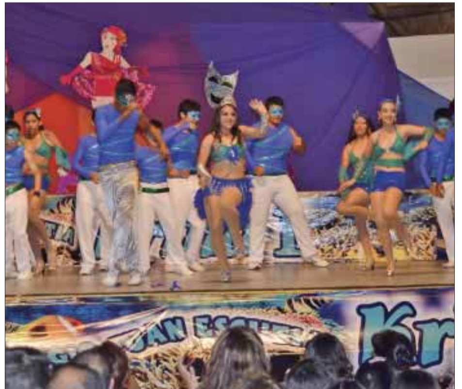
Grupo Pasión Caribeña, quien se ganó al público por su actuación.