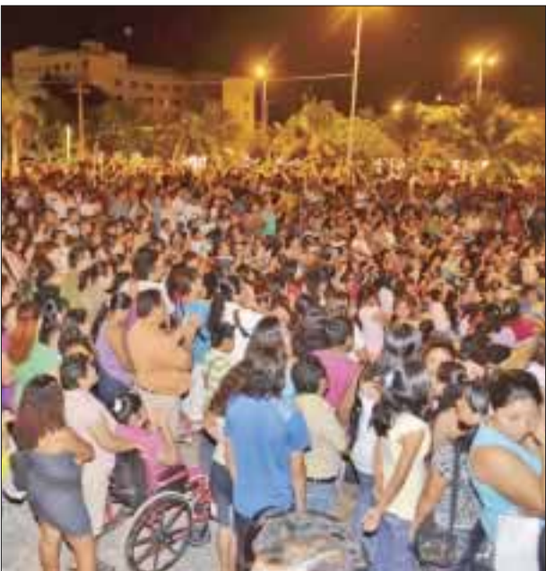
Decenas de padres que llegaron desde temprano a ver participar a sus hijos.