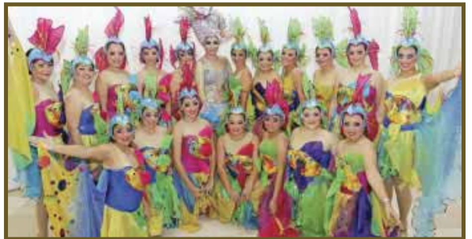
Coloridos trajes de "Las Wasowski".