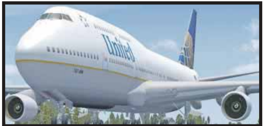
United Airlines rebasó las metas de puntualidad.

vado en su totalidad, ofreciendo más y mejores espacios e instalaciones. Camino Real Polanco, Acapulco, Guadalajara y Sumiya Cuernavaca, están ya en el proceso de finalizar sus renovaciones. En marzo de 2012 se lanzó al mercado la marca Business Class de GRT, Hoteles Real Inn, cerrando el año con ocho propiedades. 2013 será el año del gran despegue de esta nueva marca, ya que se contemplan ocho aperturas más entre ellas, Morelia, Puebla y Monterrey. La mayoría de las nuevas aperturas refuerzan la presencia de Grupo Real Turismo en la plaza o representa un nuevo destino. En cuanto al tema gastronómico, éste ha sido tan significativo para GRT como el de hospedaje e instalaciones, es por ello que el año pasado se llevaron a cabo renovaciones en restaurantes de Hoteles Camino Real, tanto en diseño como en las cartas y 2013 no será la excepción. Ya se trabaja en el nuevo concepto de China Grill , ubicado en Camino Real Polanco y en el lanzamiento de un nuevo restaurante de renombre dentro de Quinta Real Guadalajara, ambos listos para mayo próximo. Y en la continua búsqueda por ofrecer valores agregados y alianzas que sumen a las marcas, Mundo Cuervo y el Hotel Camino Real Guadalajara, crean una alianza y ofrecen el paquete de fin de semana "VCR Weekend José Cuervo Express", en él que los viajeros vivirán la experiencia de un paseo en el tren hacia la región de Tequila. Como una original atracción para