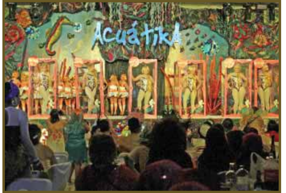
Para el disfraz grupal se le otorgó el segundo lugar a las "Barbie Fantasia".