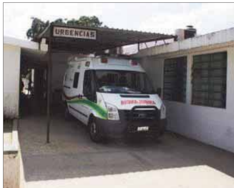
Este es el Hospital General de José María Morelos.

La familia desconsolada no recibió un reporte sobre la causa del fallecimiento de la joven parturienta