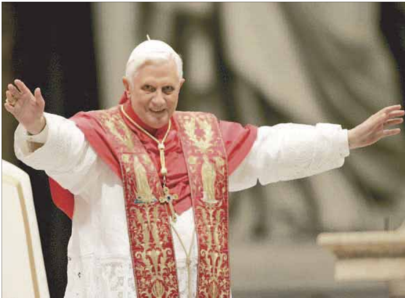
Poco después de ser elegido el Papa 265 de la historia, Joseph Ratzinger reveló que durante la votación rogaba a Dios no salir electo, pero permaneció ocho años en el papado y el día de ayer anunció que renunciaría, lo que provocó la incertidumbre de propios y extraños.

Pero lo anterior no fueron todos los escándalos, ya que desde el 19 de abril de 2005 cuando el cardenal alemán Joseph Ratzinger fue elegido sucesor del Papa Juan Pablo II como líder de la Iglesia católica, siete meses después, justo el 29 de noviembre, Benedicto XVI, quien es el Papa 265 de la historia, se enfrentó a las primeras inconformidades cuando el Vaticano impuso restricciones para evitar que los homosexuales se convirtieran en sacerdotes. Un año después, el 14 de septiembre de 2006, en un discurso en su ciudad natal Bavaria, desató protestas en el mundo musulmán al citar a un emperador bizantino del siglo XIV, que dijo que el Islam sólo había traído maldad al mundo y que ésta se había diseminado mediante la espada. El 24 de enero de 2009, el Papa provocó grandes molestias al levantarle la excomunión a cuatro obispos ultratradicionalistas, incluyendo a uno que negó el Holocausto. El 6 de noviembre de 2010 provocó enojo cuando en España atacó el aborto y el matrimonio entre homosexuales, que recientemente había sido legalizado en la madre patria; ese año, el 2010, el quinto del pontificado, fue considerado uno de los más delicados y difícil del papado, ya que los casos de curas pederastas pusieron en la picota a las iglesias de Irlanda, Estados