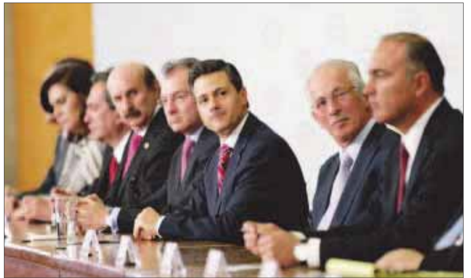
El presidente Enrique Peña Nieto arrancó su Programa Nacional de Vivienda en Los Pinos, con la creación de una Comisión Intersecretarial, bajo la coordinación de la SEDATU.

De todas estas acciones, más de 500 mil corresponderán a nuevas construcciones al tiempo que se buscará reforzar el papel de la banca privada en el otorgamien-