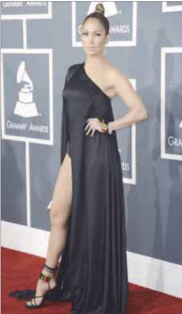
Expertos en moda aseguran que J.Lo fue la más sexy durante la entrega de la 55 edición de los Grammy.