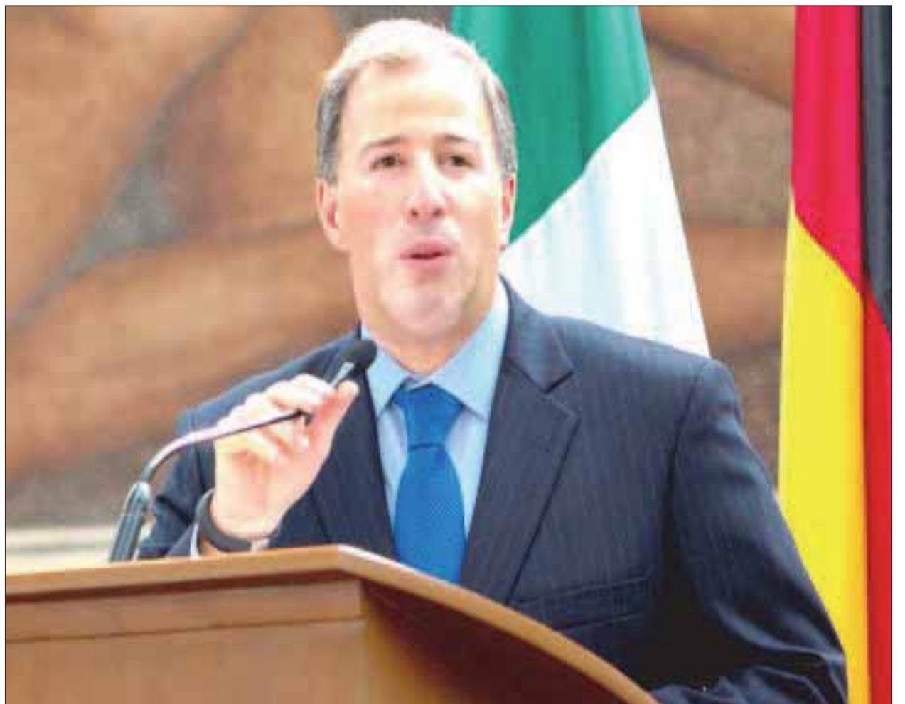
El secretario de Relaciones Exteriores, José Antonio Meade Kuribeña, se reunió con los representantes en México de los organismos multilaterales.