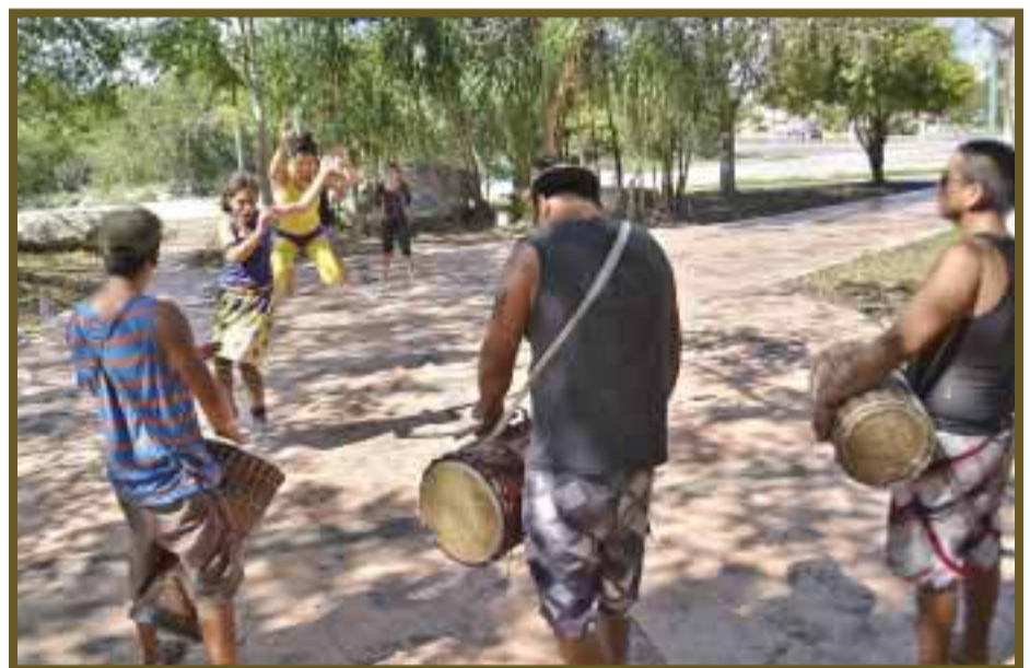
Grupo de tamborileros que interpretan ritmos africanos.

Los instrumentos que utilizan los jóvenes son el jimbo, zaimban, kenke y el dundubá, pues con éstos componen, arman el ritmo al estilo africano y después presentan su show en la escuela de arte "Mario Villanueva Madrid", del municipio de Solidaridad.