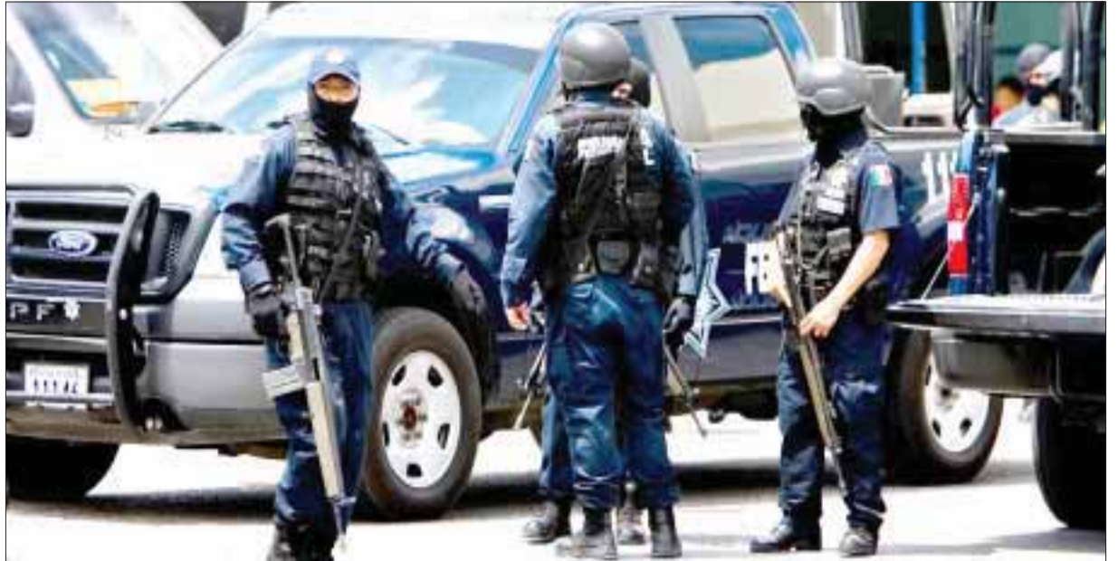
Como en esta gráfica de archivo, agentes federales enfrentaron a un grupo delictivo en Reynosa, Tamaulipas.

Además, las autoridades aseguraron un arma larga .223 y una pistola 9 milímetros, así como 150 cartuchos útiles y equipo de radiocomunicación y celulares.