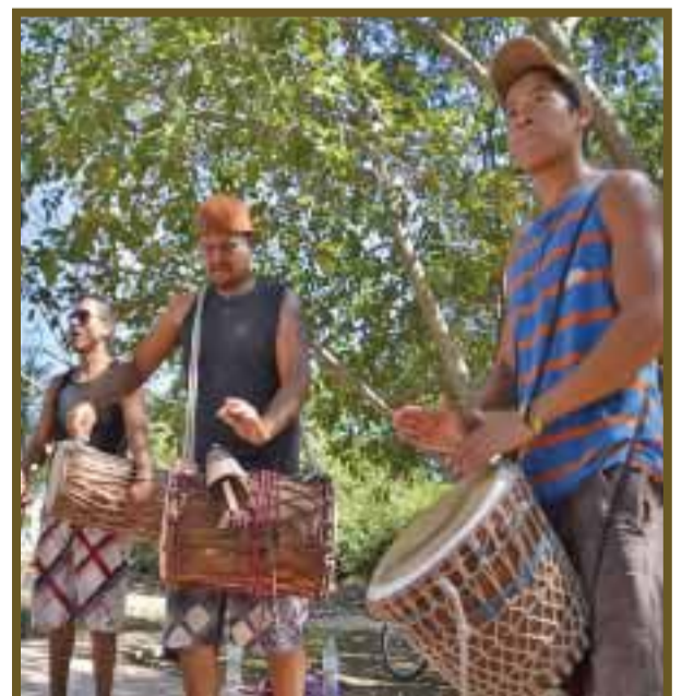
Instrumentos que son utilizados por estos jóvenes.