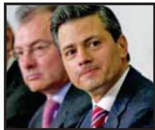
ANUNCIA EL PRESIDENTE 9 millones de viviendas.

El presidente Enrique Peña Nieto presentó ayer su Política Nacional de Vivienda, con la cual se inicia un ambicioso programa para dotar de habitación propia al menos 9 millones de familias --especialmente de policías federales, estatales y municipales y de soldados y marinos--, y a la vez crear un nuevo modelo de construcción enfocado a un desarrollo urbano y rural ordenado y sustentable. Esta política prevé además iniciar de inmediato un programa de mejoramiento... >14