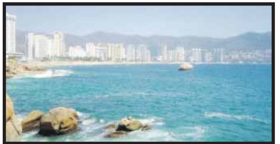
Acapulco será la meta de la Carrera del Golfo al Pacífico 2013.

cia Adonde/Kinich Koyol, siendo gerente y director. En 2007 fundó Quality Mayorista Incoming , fungió como copropietario y director de producto hasta 2010 y al mismo tiempo formó parte de Desing Travel Network como copropietario y director comercial. Desde 2011 a la fecha es propietario y director general de Vakaciona Congresos y Convenciones ; también es propietario y director general de VK Congresos y Convenciones de Occidente ; Voyageur , copropietario y director general; Tips Travel de Occidente, copropietario y director general. En 2009 decidió incursionar también en el mundo de los restaurantes e inició con La Parrilla Argentina, como copropietario y director comercial. Director comercial, mismo cargo que ocupa también en El Chef Restaurante. Dentro de la AMAV-DF ha ocupado la vicepresidencia de Operaciones Mayoristas. De 2008 a 2010 fue asesor para el Desarrollo Turístico en el estado de Morelos y de 2010 a 2011 coordinador turístico para la Feria Internacional de Turismo (FITA).