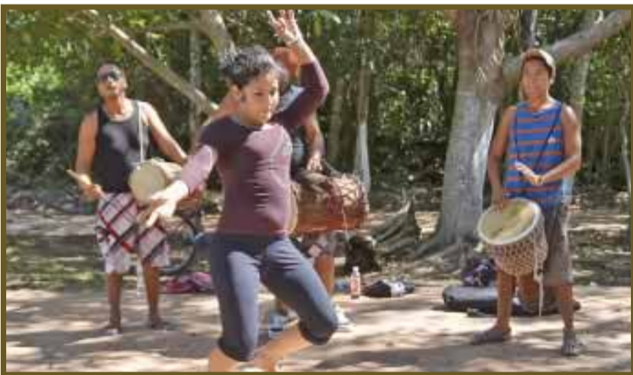
Una de las danzas que realiza esta chica.