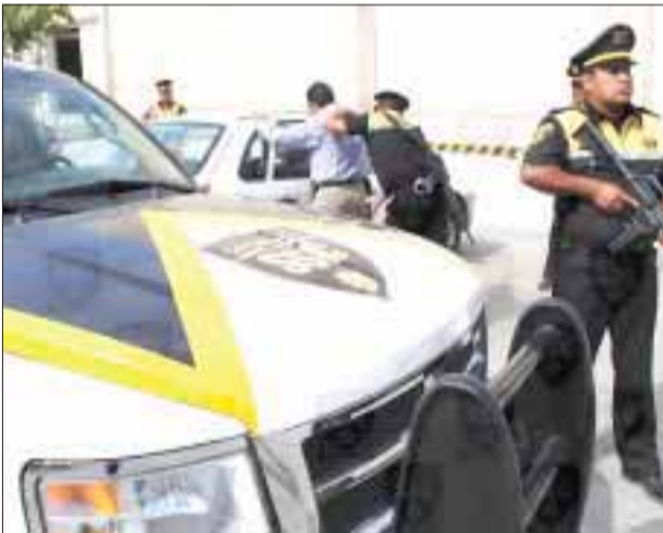
Elementos de la Secretaría de Seguridad Ciudadana se enfrentaron a delincuentes en Ecatepec de Morelos.

El portal Valor por Tamaulipas reportó que no había bajas entre los agentes federales.