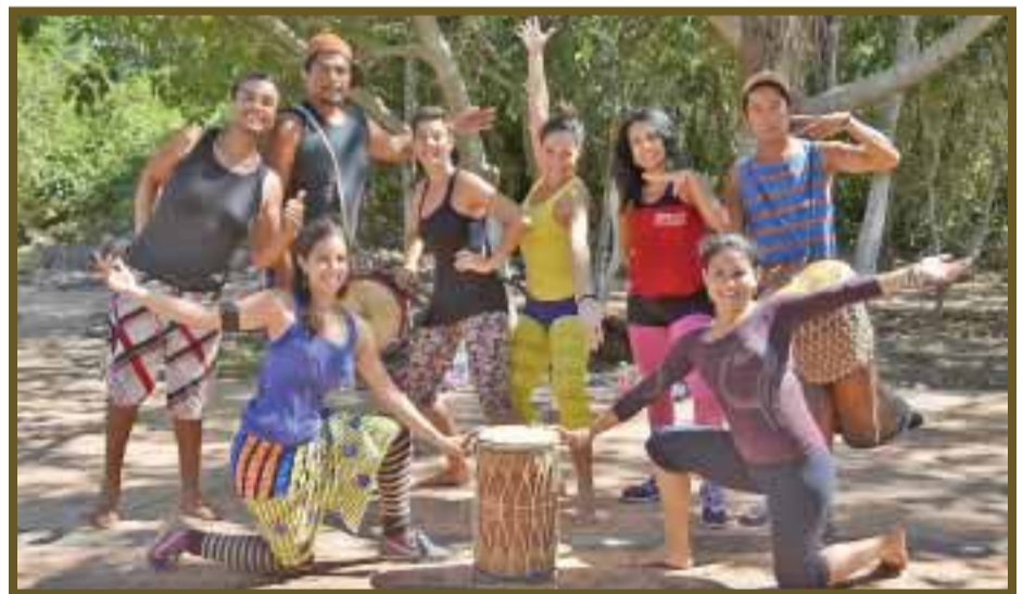
Para el recuerdo posaron para la lente de DIARIO IMAGEN.