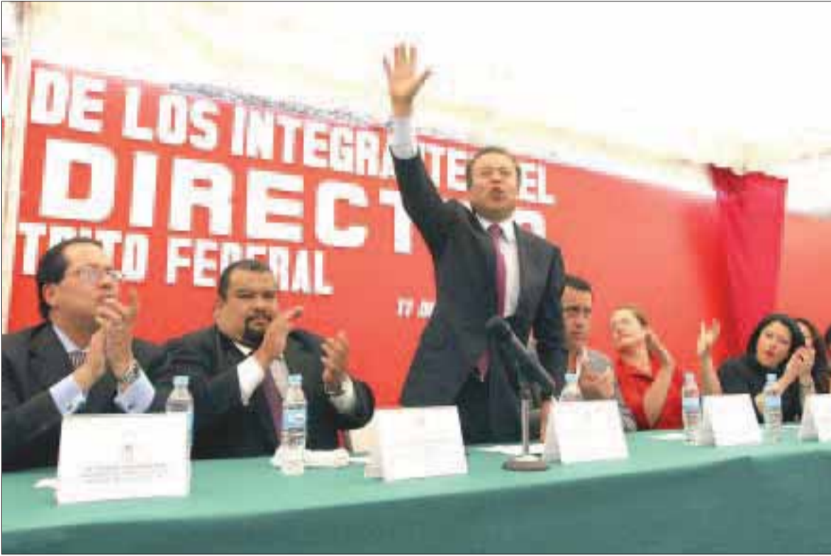
El dirigente nacional del PRI, César Camacho Quiroz, tomó protesta a los nuevos integrantes del Comité Directivo de su partido en el DF.