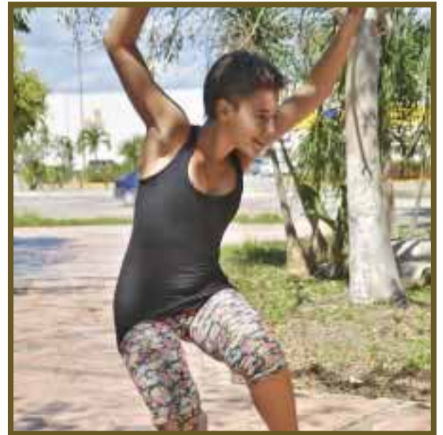
Joven argentina estudia este tipo de ritual para expresar sus sentimientos.