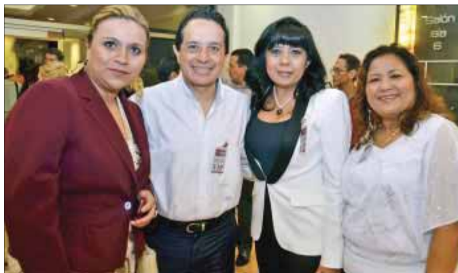
Guapas damas llegaron al evento de la zona hotelera.