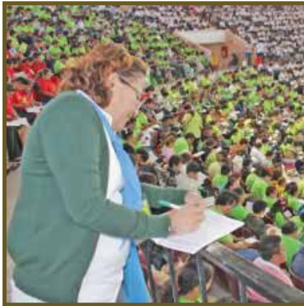
Fieles se preparan para el próximo encuentro, que tendrá lugar en Yucatán.