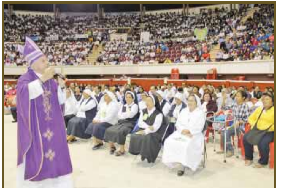
Los temas fueron impartidos por los obispos de la provincia: "Jesús me ama, me elige y me llama".