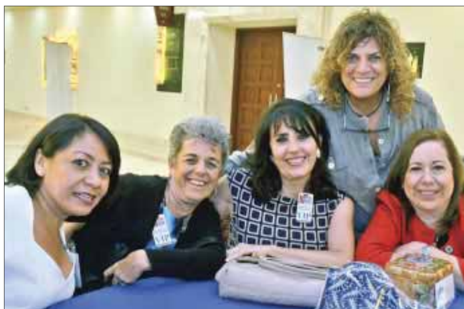
La cantante Denisse de Kalafe y un grupo de amigas del ramo restauranero.