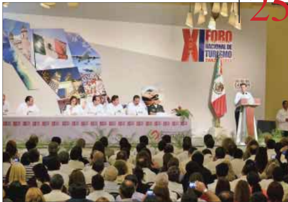
El mensaje del Ejecutivo federal fue dirigido a todos aquellos que desean unir y comprometerse con México.