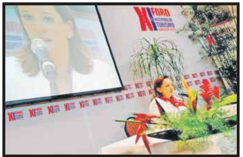
Claudia Ruiz Massieu, titular de Turismo.

del PIB mundial y la proyección será de mil 400 millones de turistas para 2020 y países como Australia incrementaron sus ingresos por divisas en un 243% durante 2000-2012. Ese país recibe menos turistas, pero generan mayor derrama. En México, durante ese periodo hemos generado volumen, ahora queremos más entrada de divisas. Señaló también que otros países incrementaron su entrada de divisas más del 100%, mientras que México creció sólo 54%. Los ingresos que puede tener un país son altos, por eso, debemos enfocar esfuerzos en países que pueden pagar más...". De igual forma, recordó que hace unos días en Nayarit, el presidente Enrique Peña Nieto , al dar a conocer la Política Nacional Turística, reconoció que la actividad será estratégica para la administración y permitirá impulsar el desarrollo de esta actividad en nuestro país. "El turismo es una actividad prioritaria en el gobierno del Presidente, por lo que el gabinete turístico trabajará en coordinación con todos los actores de la industria para convertir a México en un destino de clase mundial. Recordó también que el primer mandatario reconoció al turismo como una actividad estratégica y prioritaria para su gobierno. Destacó que la actividad turística impulsa el crecimiento económico a través de la generación de divisas y la creación de fuentes de trabajo que promuevan el desarrollo regional comunitario por me-