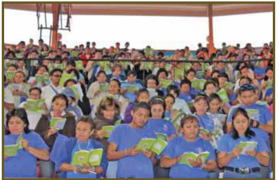
Participantes realizan el acto de entronización de las Sagradas Escrituras.

Pero el momento más emotivo fue cuando reiteró que la valiosa labor de los catequistas es importante para la transmisión de la fe, por lo que, en ejercicio dinámico y de interacción, "los catequistas son los consentidos de los obispos", por esta labor tan valiosa para la Iglesia.