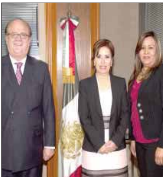
La secretaria de Desarrollo Social, Rosario Robles, y el gobernador de Morelos, Graco Ramírez.