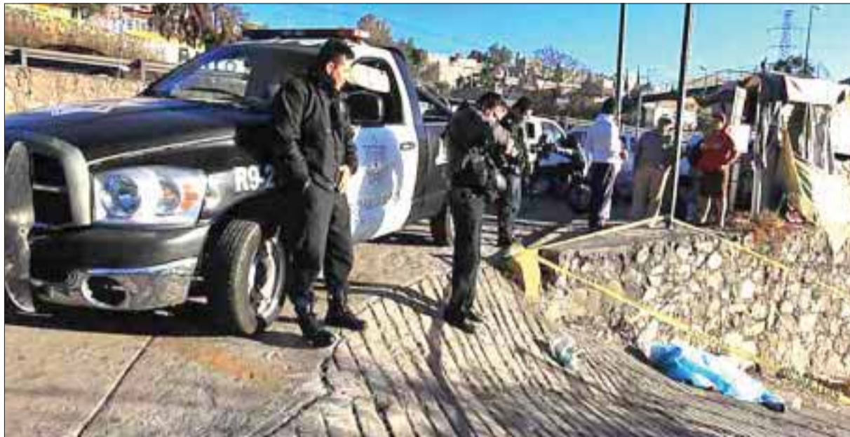
El corredor poniente del Edomex otra vez fue el sitio donde fueron abandonados cadáveres ajusticiados en otros rumbos.

Comentó que "el detenido de ayer por la madrugada, fue por tripular una moto robada y no hay certeza de que tenga que ver con los hechos".