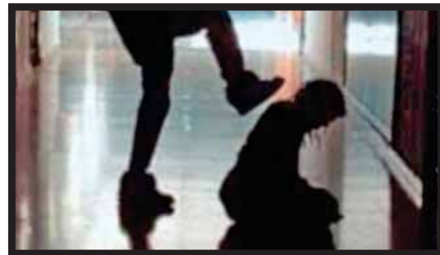
COBRA MÁS VÍCTIMAS el bullying en planteles de Q. Roo.