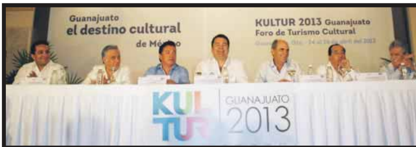
En la presentación de Kultur 2013.

y promoción, y sustentabilidad y beneficio social. Además, para convertir a México en un destino de clase mundial, se reflejan de manera destacada los temas de sustentabilidad, competitividad y calidad en el servicio. "Nuestro país cuenta con un gran potencial en materia turística, por lo que se debe trabajar de manera coordinada para aprovechar sus ventajas comparativas, entre ellas la ubicación geográfica, la conectividad y la disponibilidad de productos turísticos en diferentes segmentos como sol y playa, turismo cultural, de naturaleza, de salud y de negocios, entre otros.