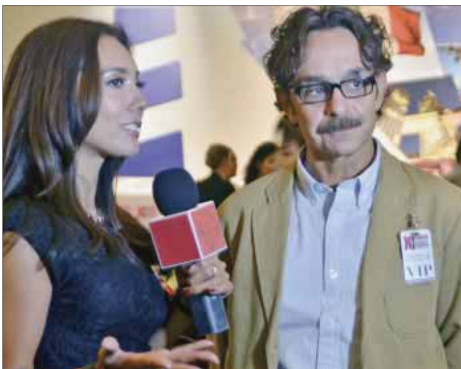
El ex candidato presidencial, Gabriel Quadri, en el XI Foro Nacional de Turismo.