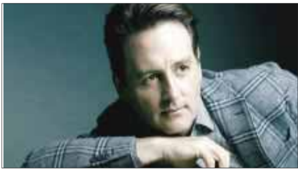
Además del álbum El amor no es solo un papel , del cual se desprende el sencillo del mismo nombre, Francisco Xavier prepara el lanzamiento de un disco más que contará con importantes invitados.

Los días 29, 30 y 31 de marzo, su hermano Lupillo Rivera le rendirá un tributo en el Teatro Blanquita.