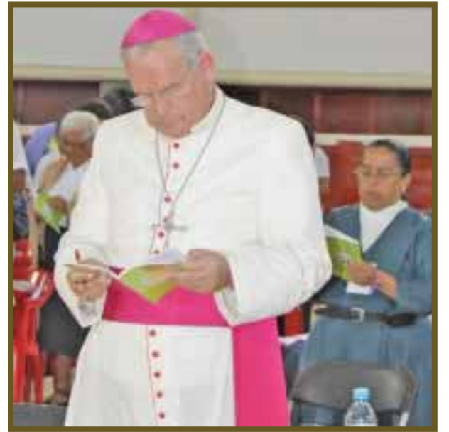
El obispo de Cancún-Chetumal, concentrado en la lectura litúrgica.