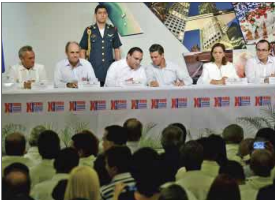
El mandatario Roberto Borge con el presidente Enrique Peña Nieto.