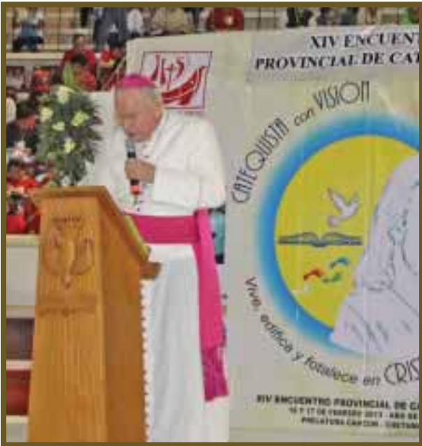
El logotipo y la manta del XIV encuentro de catequistas.