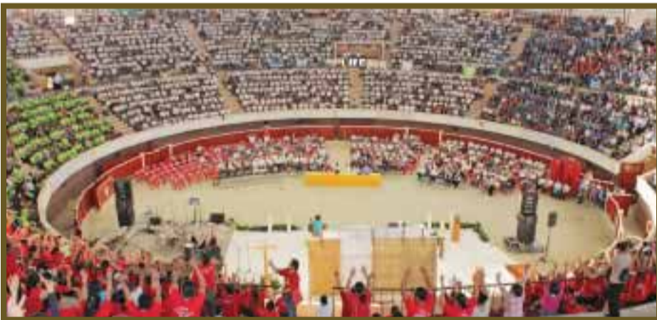
La plaza de toros de Cancún vibró ante el canto de más de 4 mil 500 catequistas.