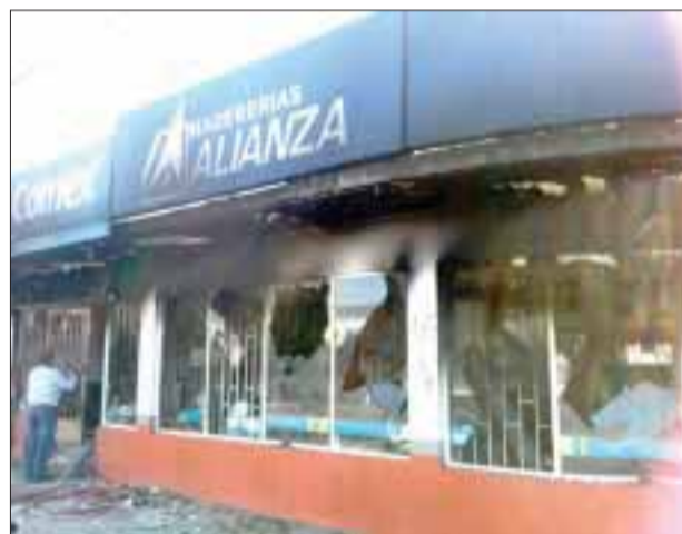
Los grupos delictivos comenzaron a cumplir sus amenazas y quemaron cuatro negocios.

De inmediato, elementos del Cuerpo de Bomberos y la Unidad de Protección Civil de Torreón se trasladaron al lugar.