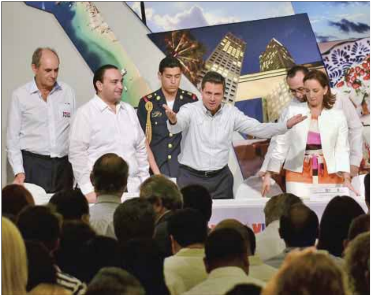
El presidente Enrique Peña Nieto saluda a los asistentes por la cordial invitación a Quintana Roo.

El Ejecutivo del estado dijo que el compromiso de Quintana Roo con el sector turístico es permanente y formuló un reconocimiento a la decisión de brindar apoyo por parte del presidente Enrique Peña Nieto.