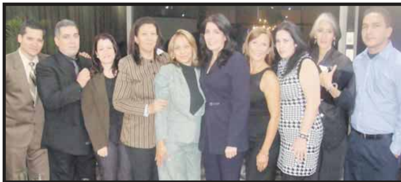
Los integrantes de la "Caravana Turística Auténtica Cuba".

se llega por una carretera construida sobre una base de rocas depositada sobre el fondo marino. Con una longitud de 48 km desde las cercanías del pueblo de Caibarién hasta Cayo Santa María y 46 puentes diseñados para mantener el flujo normal de las aguas y fauna marina y no provocar daños a los ecosistemas marinos y terrestre, esta carretera es una obra de ingeniería significativa (mereció el Premio Puente de Alcántara a la Mejor Obra Civil Iberoamericana) y el paso a través de ella se convierte en una agradable experiencia. Ahí están los Cayos: Las Brujas, Ensenachos y Santa María, cada uno de ellos representa una experiencia diferente en función de sus propias características. Sin embargo, Cayo Santa María, alineado en la carretera que cruza sobre las aguas de Bahía Buenavista, conocido también como "La Rosa Blanca de los Jardines del Rey" es el más grande, alrededor de 18 km 2 de superficie y, en sus costas se alinean 10 km de playas de la mejor calidad entre las que destacan Perla Blanca, Las Caletas, Cañón y Cuatro Punta, con farallones de telón de fondo que realzan su belleza. Los Cayos son un destino que está en plena expansión y ya se cuenta con excelentes opciones hoteleras de categorías 3, 4 y 5 estrellas, incluidos tres de los mejores hoteles del