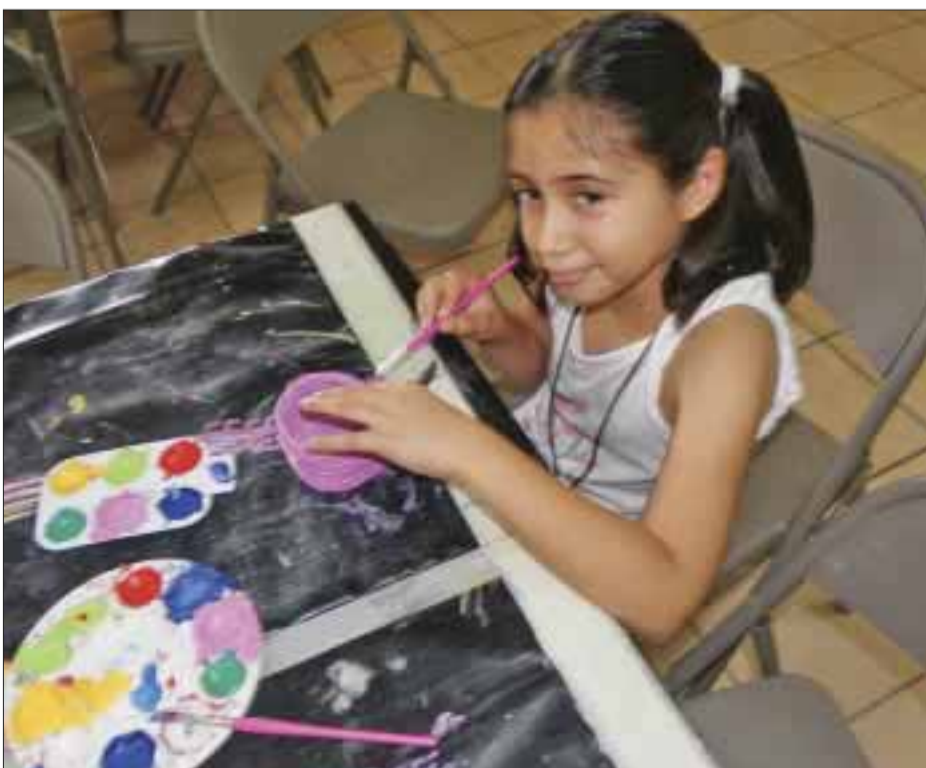
Muestran su arte.