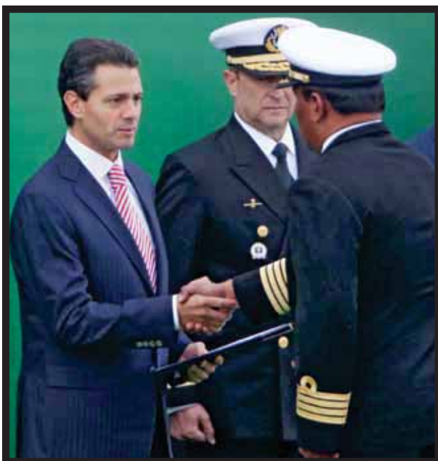
ENRIQUE PEÑA NIETO, PRESIDENTE DE MÉXICO, al entregar menciones honoríficas a las Fuerzas Armadas.

La temporada vacacional de verano superó por mucho las expectativas del sector turístico, al registrar las agencias de viajes reservaciones y gran presencia al Caribe mexicano de turismo brasileño, además del nacional que durante su estancia dejó una derrama económica aceptable. >9