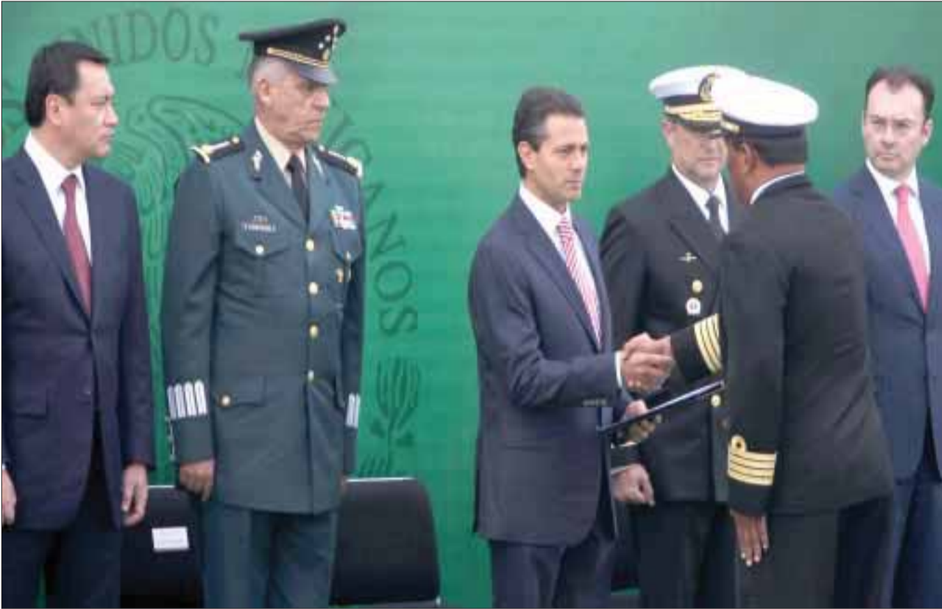
El presidente Enrique Peña Nieto entregó menciones honoríficas a personal de la Armada y el Ejército, donde llamó a alinear todas las políticas públicas y sociales.

Se privilegia por encima del uso de la fuerza