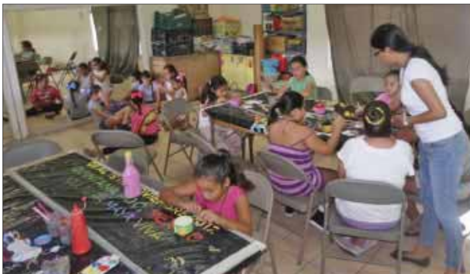
En el curso las niñas son unas artistas.