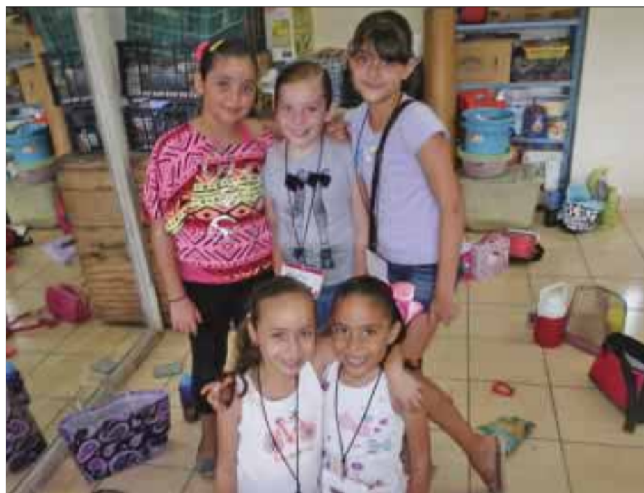
Las cinco mejores amigas de este curso de verano.