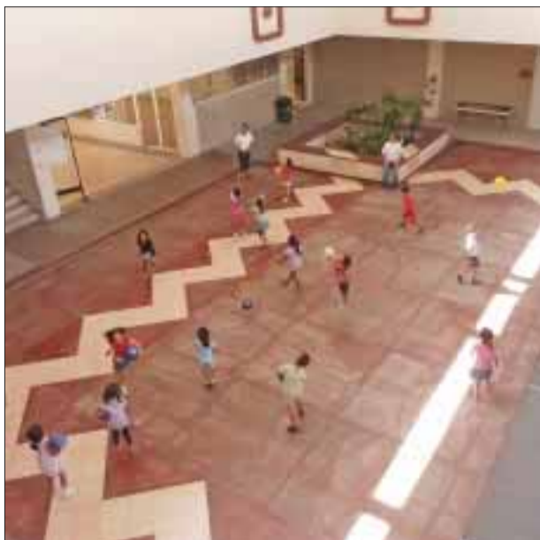
La Casa de la Cultura, un ambiente armónico para las niñas.