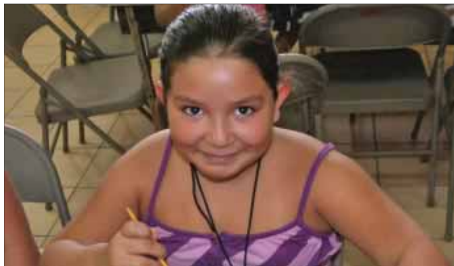
La ganadora de DIARIOIMAGEN a la mejor sonrisa.