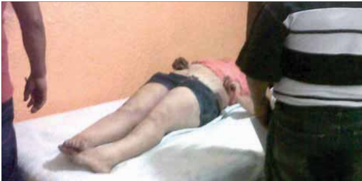
Con la muerte violenta de esta joven de 26 años, suman 13 mujeres asesinadas de forma violenta en lo que va del año en este centro vacacional