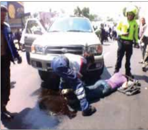
En Río de la Loza y Niños Héroes una mujer esquivó a un auto que se pasó la luz roja, pero se llevó a seis peatones.

Las víctimas fueron trasladadas a los hospitales de La Villa, Rubén Leñero, Cruz Roja y Primero de Octubre.