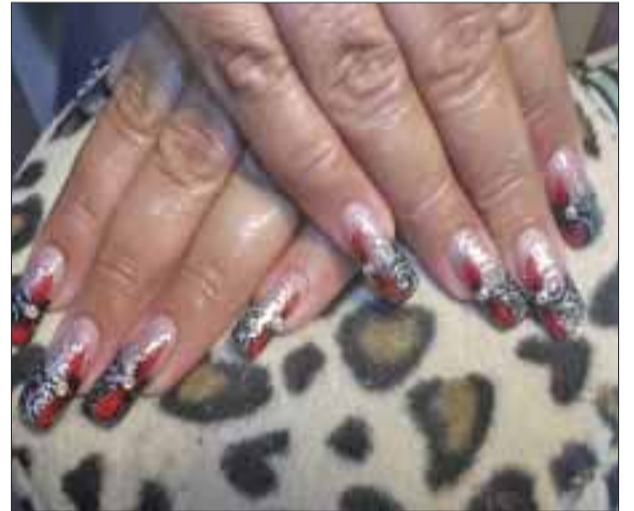
Uñas para todo tipo de personalidades, son las creaciones de Paulina Nery.