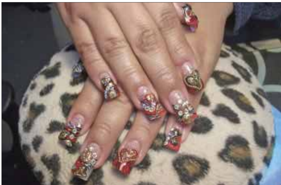
Esta es una aplicación de pit, la cual es una extensión de plástico que se adhieren con resina a la uña.