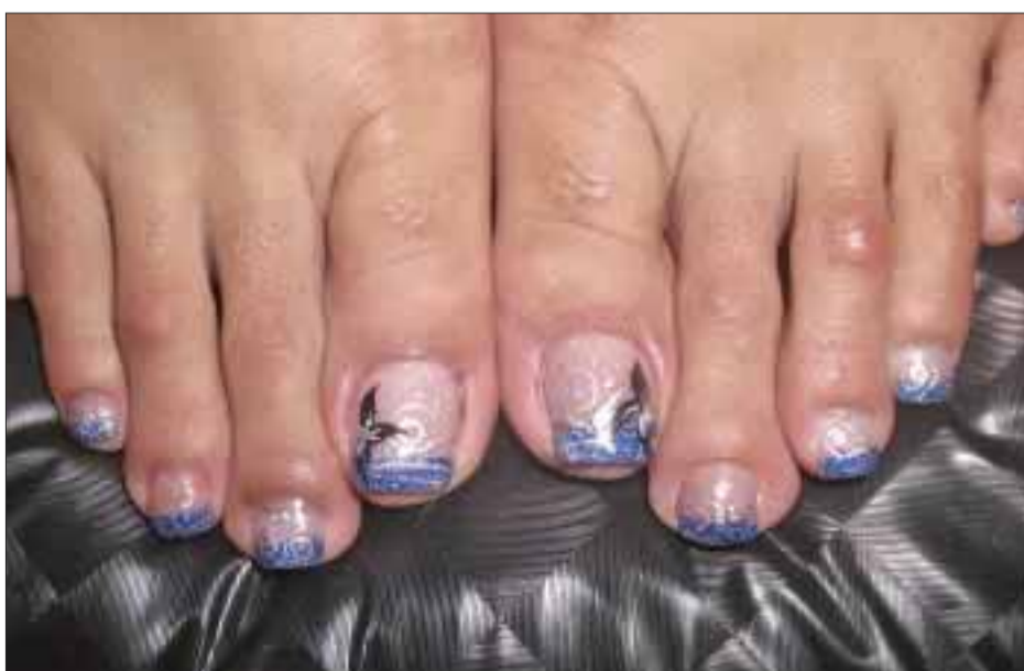
Los pies también deben lucir bien cuidados y adornados.