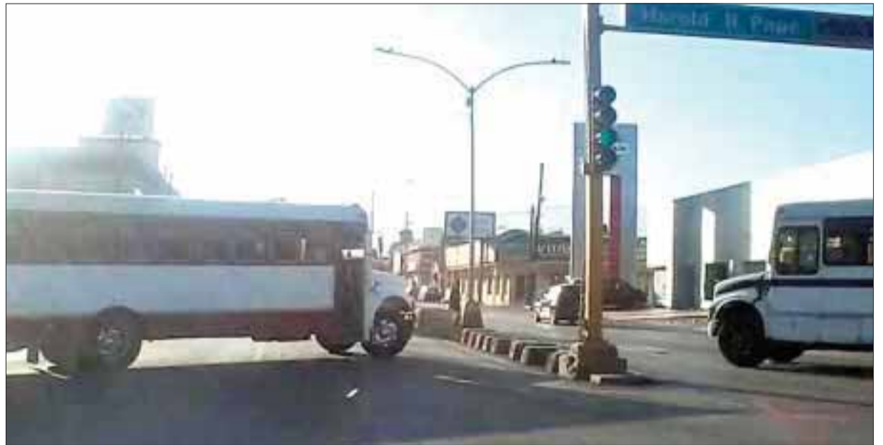
En Monclova, Coahuila, amaneció ayer lloviendo, pero balas, al enfrentarse los sicarios con la policía en fuego cruzado.

“Gracias a un testigo que nos proporciona las características de la camioneta X-Trail que utilizaban los ladrones y los números, nos permite hacer el trabajo de inteligencia y pedir a Setravi las características de los vehículos en el Distrito Federal que tuvieran esas características, y nos da 61 camionetas con estas posibles placas.