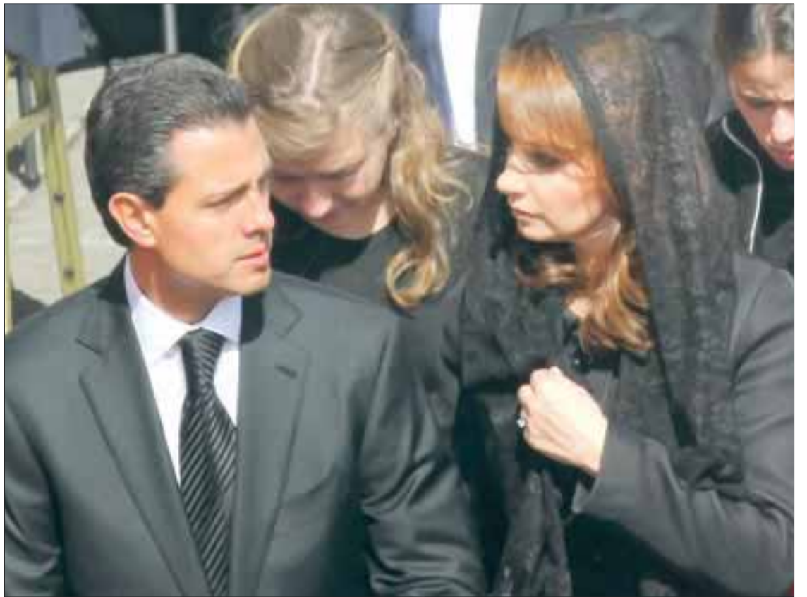
El presidente Enrique Peña Nieto, y su esposa, Angélica Rivera, durante la primera misa oficial con la cual inició la gestión del Papa Francisco.

Durante su encuentro con los periodistas que le acompañan en este viaje, el presidente Peña Nieto indicó que a este evento acudió acompañado por su esposa Angélica Rivera y por sus dos hijas más pequeñas, así como el secretario de Relaciones Exte-