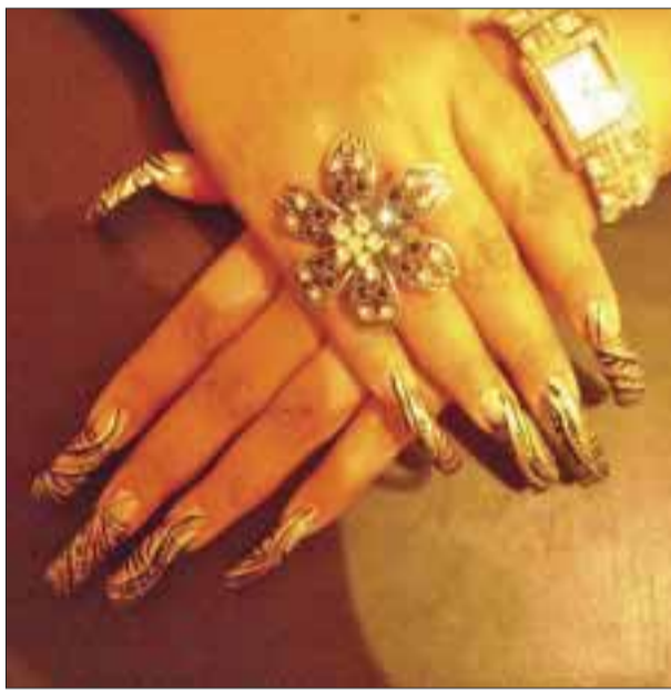
El decorado de las uñas es único y puede ser desde 5 centímetros en adelante.

Dio un consejo: “no envíen la belleza de nadie, todas las mujeres somos hermosas” y que la persona que desee ver el trabajo, puede visitar su página en la red https://www.facebook.com/CreacionesPaulinaNery .