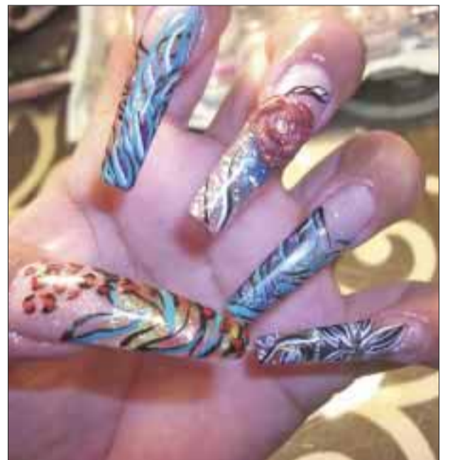
Cada uña tiene un diseño original, nunca repetido.