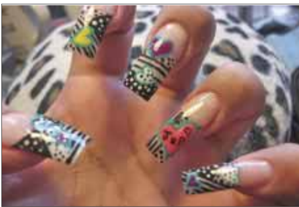
Diseños frescos y juveniles tienen un precio de 200 pesos en adelante.