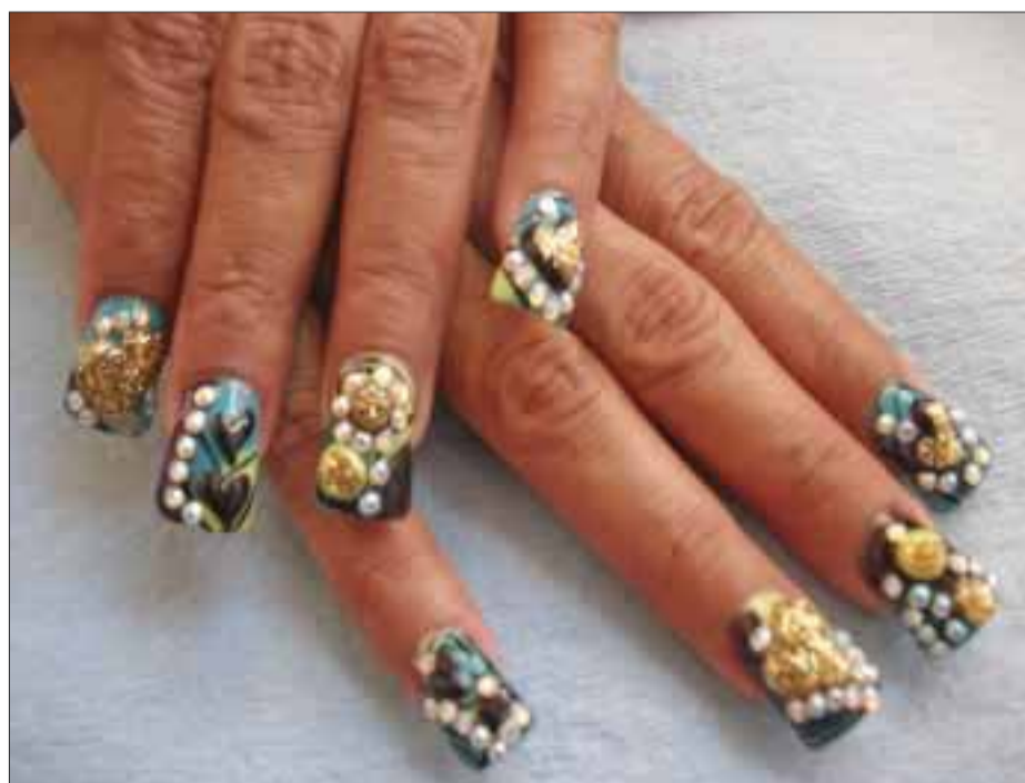
Piedras, son las más solicitadas por las personas que desean lucir extensiones.