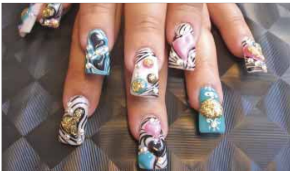
"Estamos viviendo la etapa moderna; la belleza abarca todo".