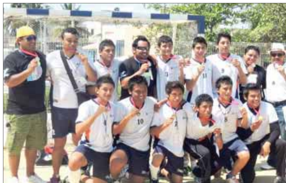
El municipio de Isla Mujeres buscará hacer historia y conseguir una medalla de oro en las Olimpiadas.