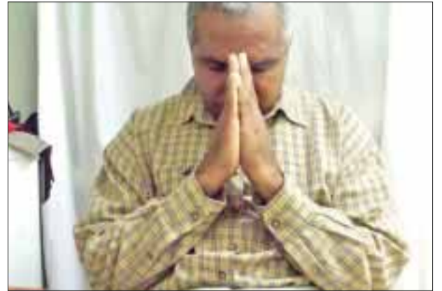
Hoy quiero invitarte a dejar a un lado aquel orgullo que no te permite reconocer que has cambiado.

Dios siempre quiere obrar en tu vida, pero para ello debe haber un reconocimiento de tu necesidad de Él. Hoy es un buen día para reconocer esa enorme necesidad espiritual que hay en ti, hoy es un buen día para pedirle perdón a Dios