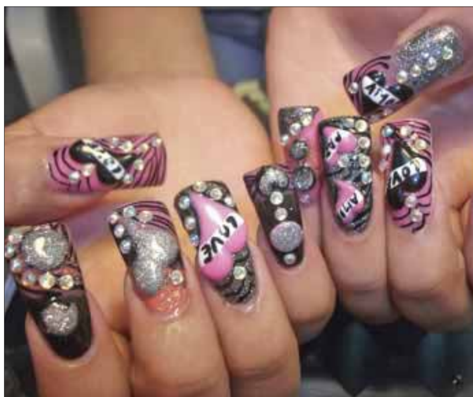
Colores rosado y plata, perfecta combinación para aplicar en estas extensiones.