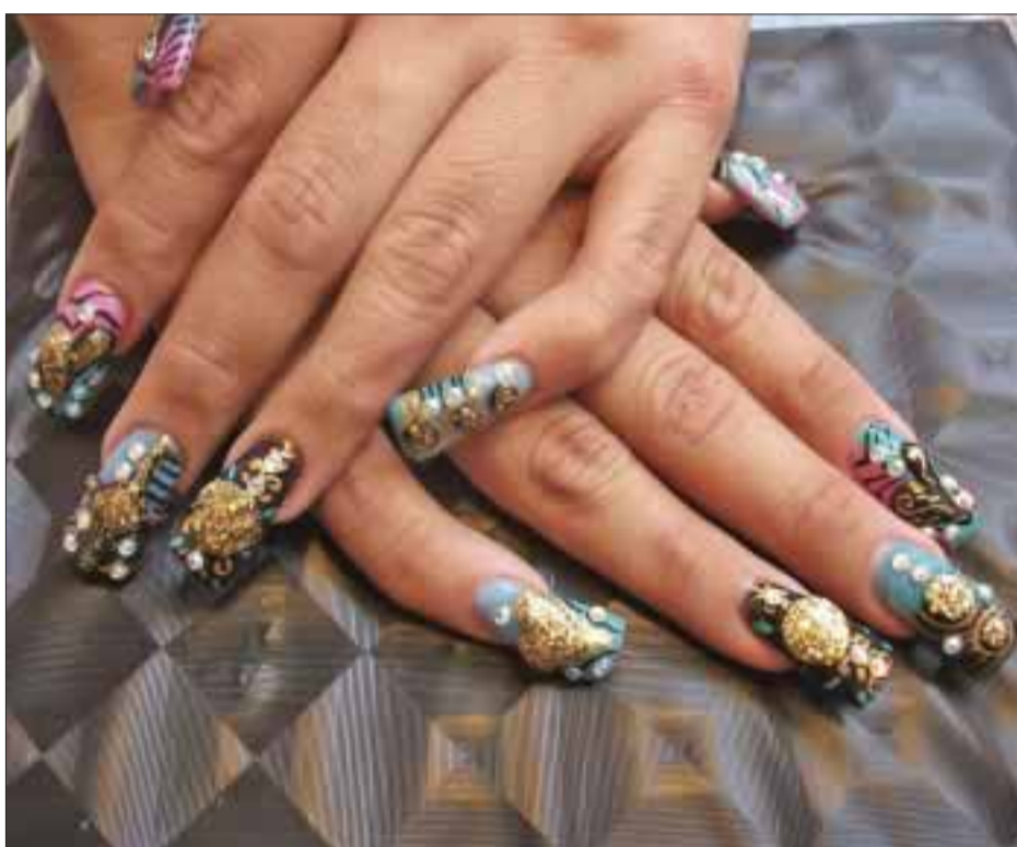
Corazones, círculos, rectángulos, son algunas de las figuras utilizadas por la artista.