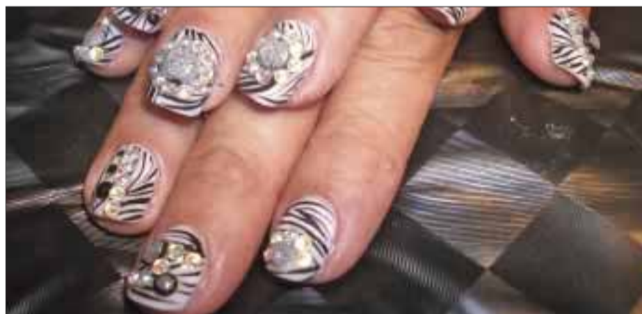
Sin extensiones, las uñas también pueden ser decoradas.