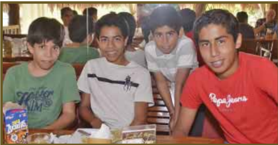
Entre amigos platican de futbol y de sus equipos favoritos.