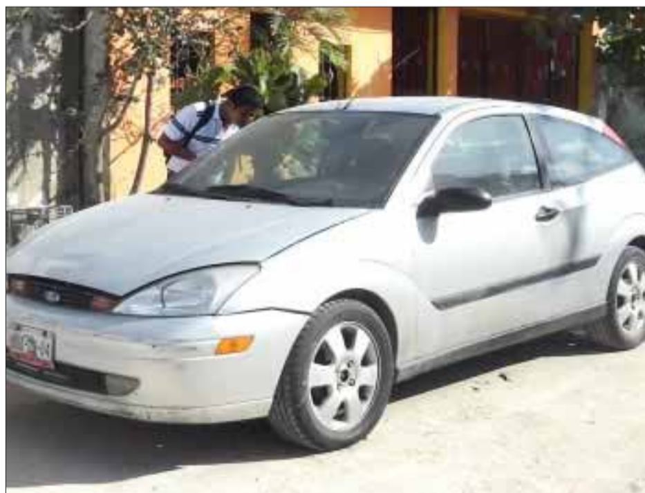
El automóvil tipo Ford Focus gris con placas del estado de Quintana Roo, tenía en su interior dos balas útiles.

José María Morelos.- Un lesionado y cuantiosos daños materiales fue el saldo de un aparatoso accidente vehicular suscitado sobre la carretera estatal, tramo José María Morelos-Naranjal; las causas nuevamente salen a relucir por la falta de precaución y exceso de velocidad.