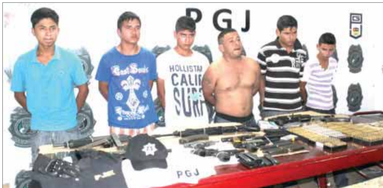
Los seis sicarios detenidos en Tulum obtenían los uniformes de la Policía Judicial para cometer sus ilícitos.