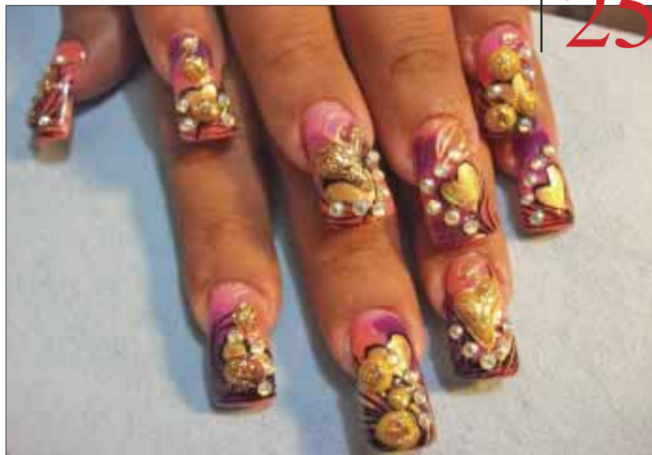
Los diseños originales hacen sentir que cada mujer es única.