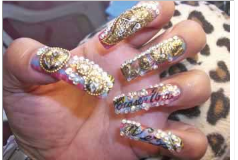
En esta técnica se utilizó piedra swarovski, chapa de oro, piedra rectangular y resina.