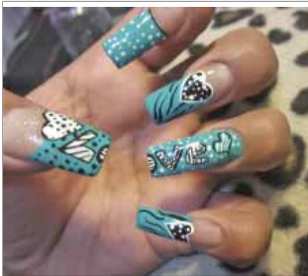
La creatividad se hace presente con la palabra “love”.