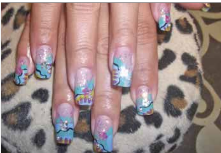
Dependiendo del cuidado, el diseño puede durar semanas.