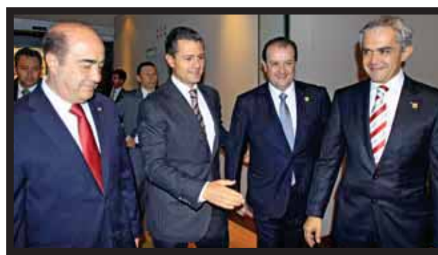
ENRIQUE PEÑA NIETO, A SU LLEGADA a la reunión de procuradores de Justicia.