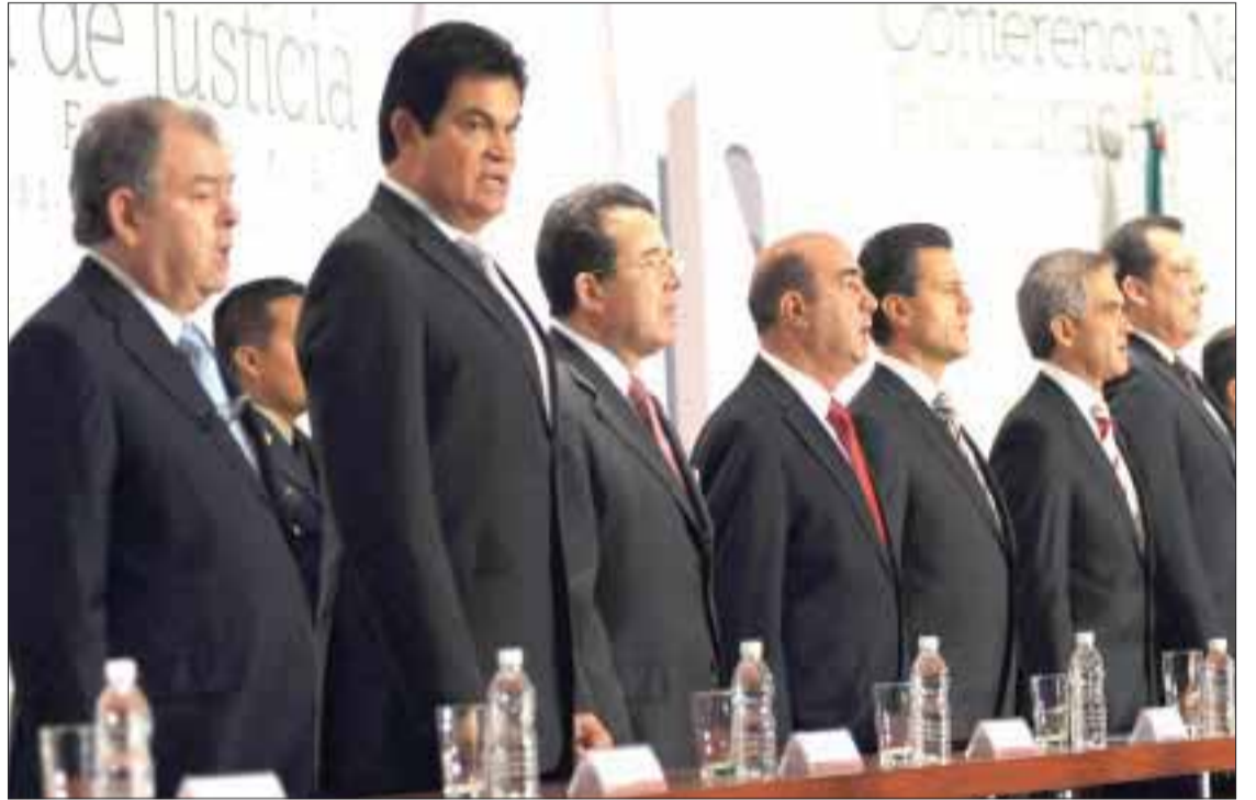
El presidente Enrique Peña Nieto encabezó la Conferencia Nacional de Procuración de Justicia.

También es necesaria, dijo, una visión compartida para que “podamos generar una sinergia ganadora y eficaz en