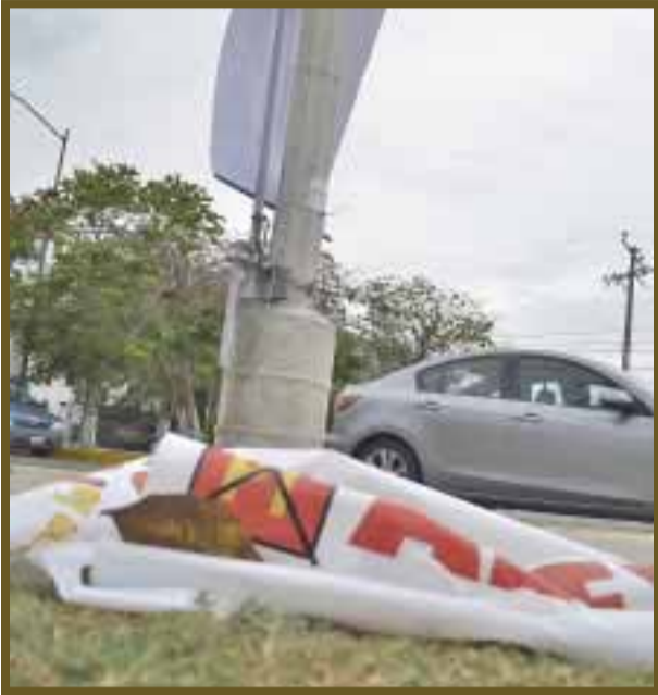
En la calle Yaxchilán esquina Xpujil se puede apreciar la publicidad en el piso.