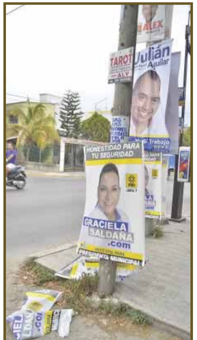
No hay respeto para la vista de los benitojuarenses, pues los políticos saturan los postes.