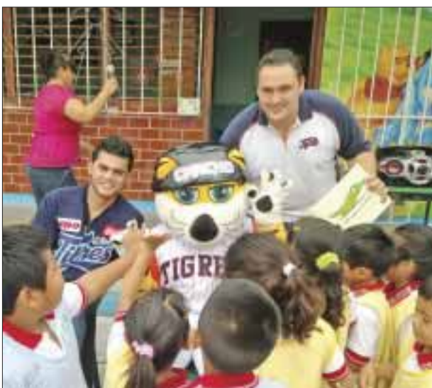
La mascota número uno de la LMB, "El Tigre Chacho", saludando a los niños.