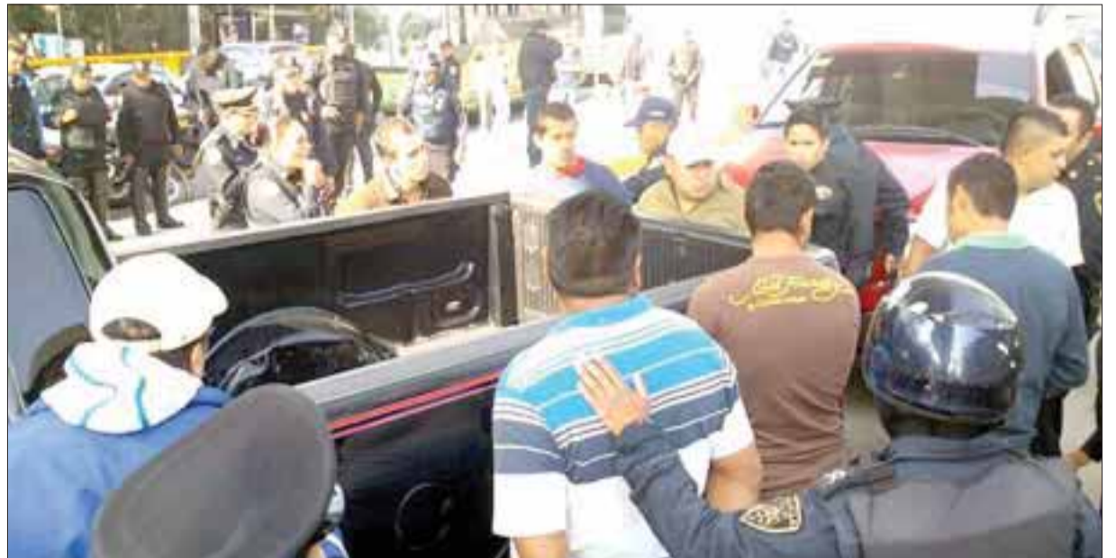
Lo que aparentemente fue un enfrentamiento de dos comandos del crimen organizado, fue interferido por la policía en Santa Fe, que sólo detuvo a un grupo.

Como se recordará, en este municipio, por acuerdo de cabildo, se aceptó la incorporación de 19 policías comunitarios a la vigilancia formal del municipio.