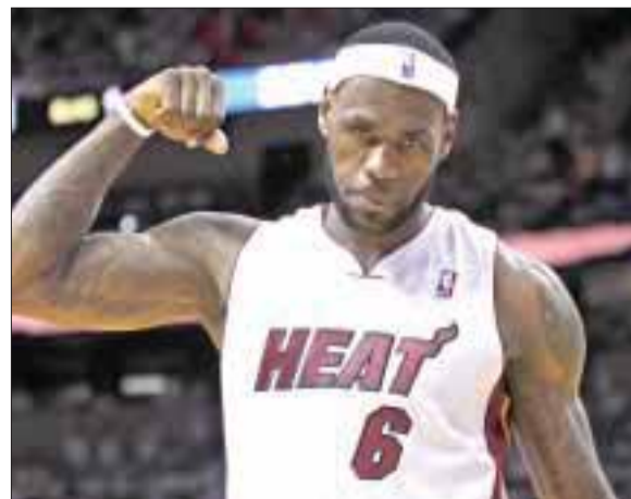
Cinco mil dólares de multa le impusieron a LeBron James por simular faltas.

El triunfo de los Pacers 99-92 el martes estuvo repleto de esas jugadas, y los árbitros pitaron un total de 55 faltas. El quinto partido es el jueves en Miami.