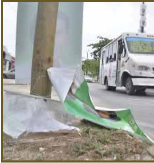
La propaganda del candidato a diputado se encuentra despedazada.