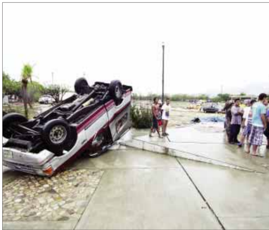
Sólo daños materiales ocasionó el paso del huracán “Bárbara” por el estado de Chiapas.

Los pescadores narraron, según versiones de sus familiares, que cuando sintieron la presencia del viento y la lluvia se refugiaron en una de las pequeñas islas que se localizan entre las aguas de la Laguna Inferior.