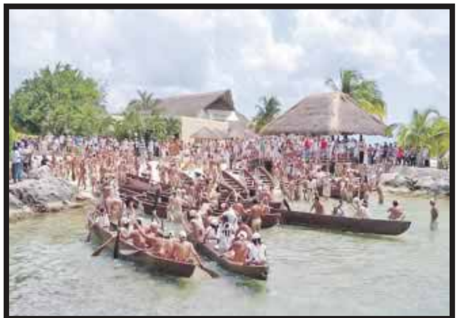
Los canoeros llegan a Cozumel.