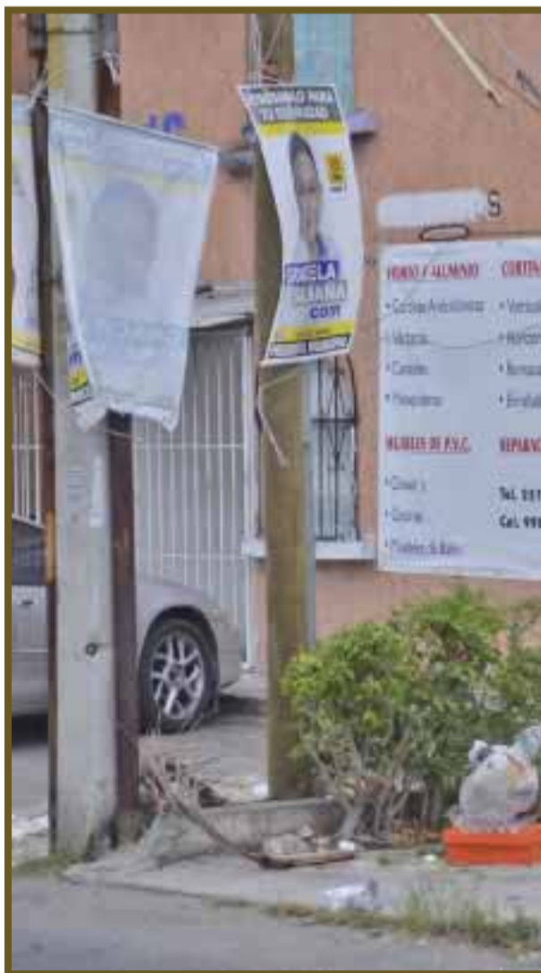
A los encargados de colocar la propaganda, no les importa cómo quede.