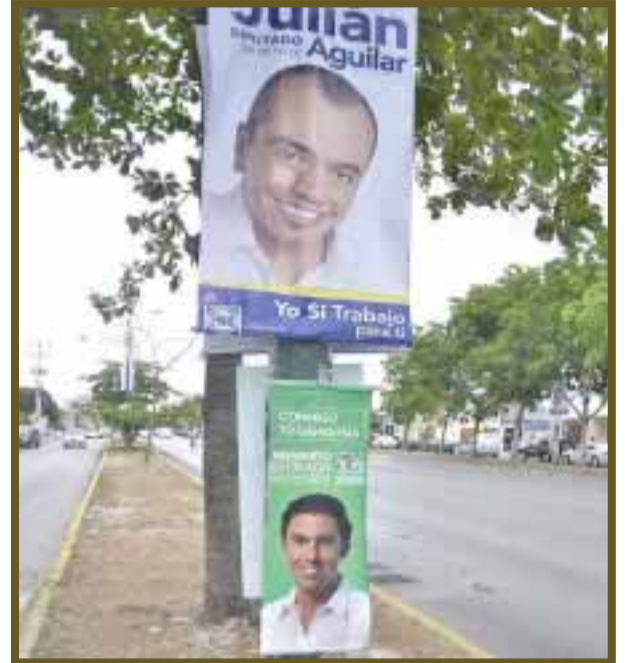
En la López Portillo se aprecian los pendones de los abanderados con botellas de cerveza.