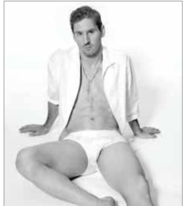
La firma de moda italiana Dolce & Gabbana, que firmó un acuerdo con el jugador del FC Barcelona, Leo Messi, convirtiéndolo en modelo de ropa interior, ha mostrado las imágenes de la campaña

el mundo del fútbol". Con la campaña, el argentino entra a formar parte de los deportistas escogidos por una firma de moda que lanzan campañas mundiales y que han posado en ropa interior para las mismas, como lo han hecho David Beckham y Rafael Nadal.