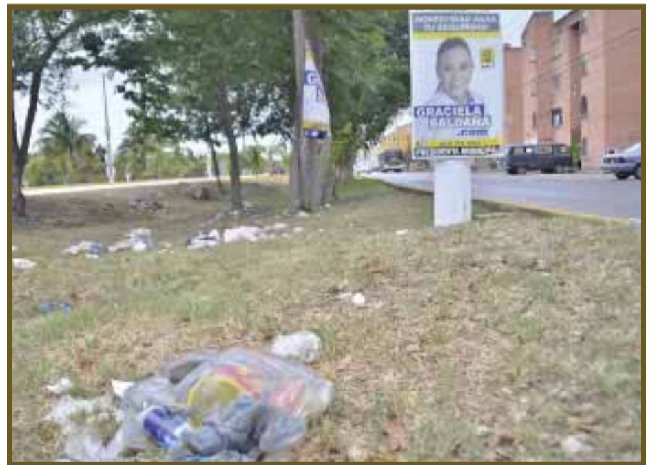
Desperdicios y basura electoral.

No cabe duda que falta regular este tipo de publicidad, que a decir de ciudadanos son incorrectamente puestos en los postes de luz, teléfonos y en algunas paredes.