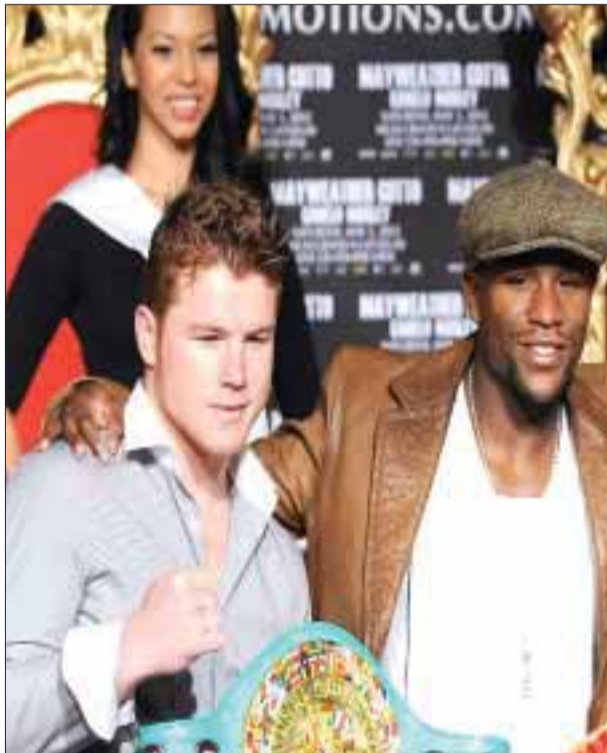
Saúl “Canelo” Álvarez lo quería de rival y Mayweather le dijo que sí.

El campeón estadounidense se embolsó en ese combate de la reaparición 32 millones de dólares, la cifra que habría admitido por enfrentar al mexicano al menos debió de haber sido similar toda vez que se negaba a medirse al joven púgil tapatío.