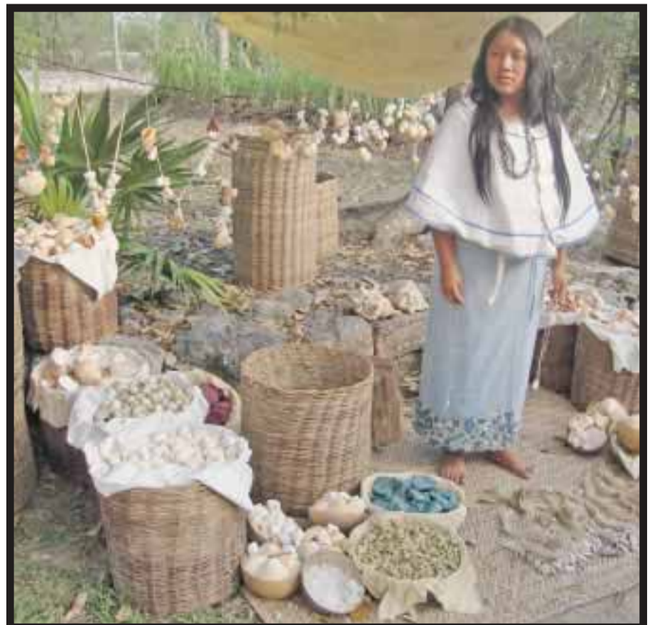
Se vende todo tipo de mercancías.