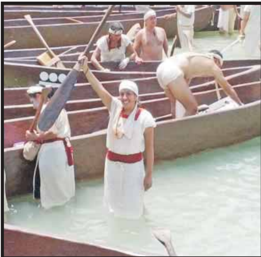
Regreso a Xcaret, con el mensaje de la diosa Ixchel.

Y fue Xel Ha el punto de encuentro misterioso y místico, donde aún se come carne de venado, jabalí y tapir e iniciaron las celebraciones de la Travesía Sagrada Maya al amanecer, a las 5 y media de la mañana, en esta séptima representación