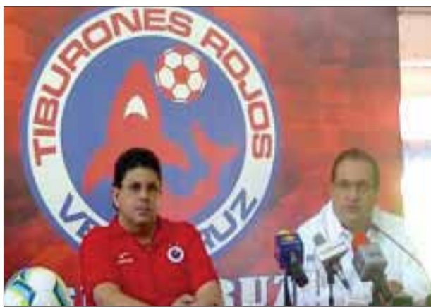
Los nuevos Tiburones Rojos fueron presentados en el puerto.