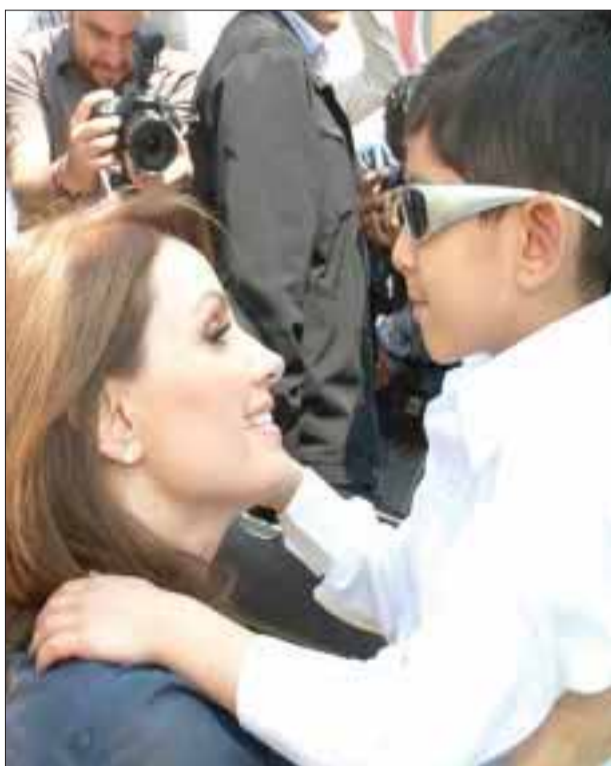
La señora Angélica Rivera de Peña conversó con el pequeño a quien su madre le sacó los ojos en un ritual.