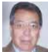
POR ROBERTO VIZCAÍNO

México vive sin duda un tiempo de desconciertos y contrapuntos que por un lado nos lleva a un optimismo no vivido desde hace años, y por el otro a estadios demenciales, donde la violencia y la inseguridad nos sume en la absoluta desesperanza.