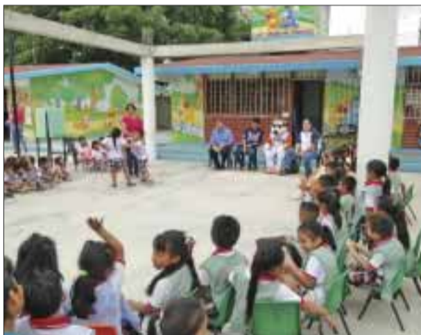
Los niños disfrutaron la lectura del cuento.