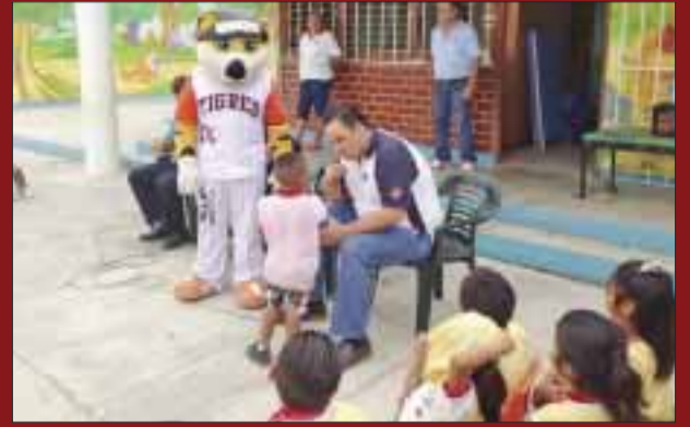
Se realizaron las acostumbradas preguntas en relación al cuento leído.