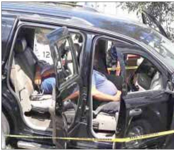
En el kilómetro 42 de la México-Querétaro, fueron acribillados 2 hombres.

Luego del ataque, los ocupantes de la camioneta desde donde abrieron fuego huyeron con dirección al DF. Hasta las 18:30 horas, los dos hombres ejecutados no habían sido identificados.