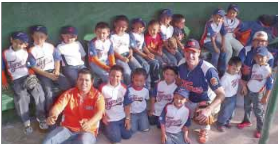
El partido entre los Broncos de Reynosa y la novena de bengala tuvo una improvisada porra.