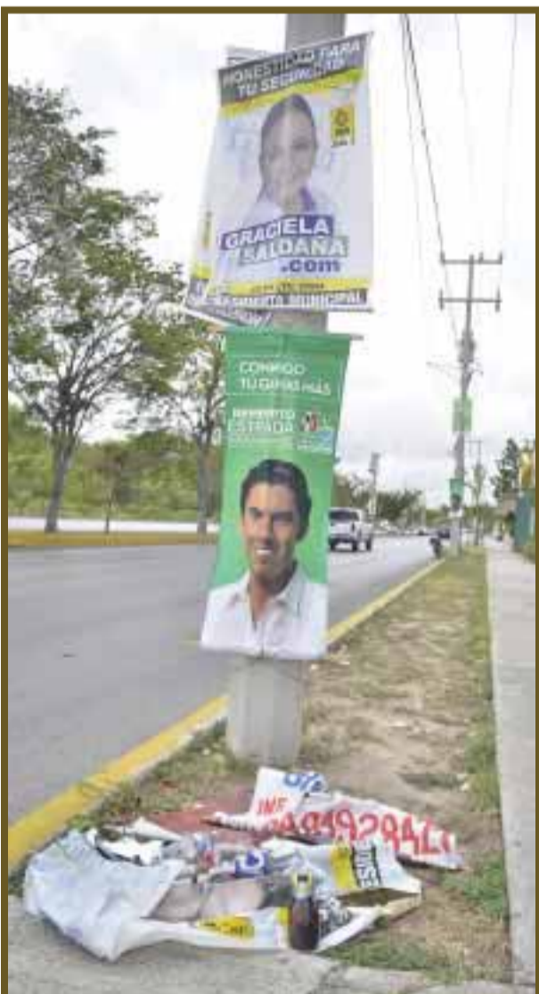
Desplazaron a los anuncios colocados ilegalmente.