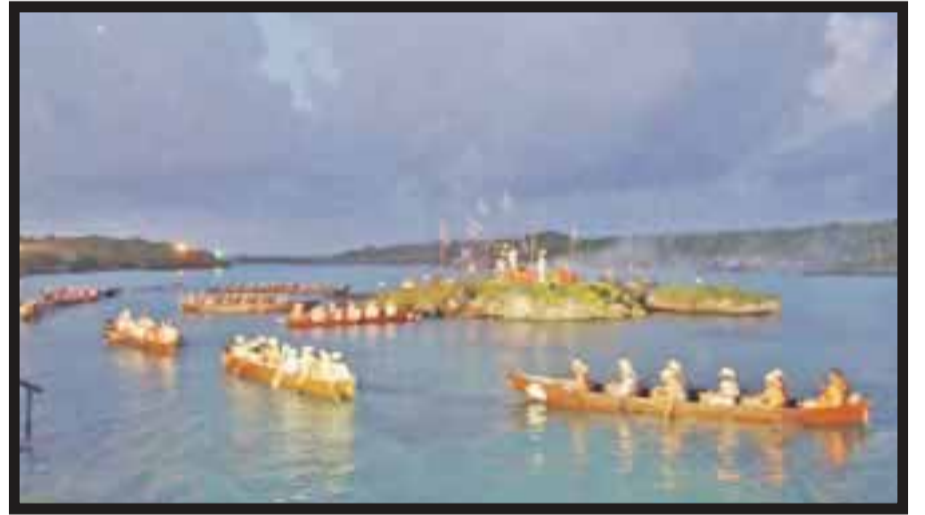
La despedida de los canoeros.

A Ppolé llegó Hun Nal Ye, dios del maíz y hay danzas entre los dioses gemelos con la intención de encomendar a los canoeros que son bendecidos antes de salir al mar en lo que fue esta séptima