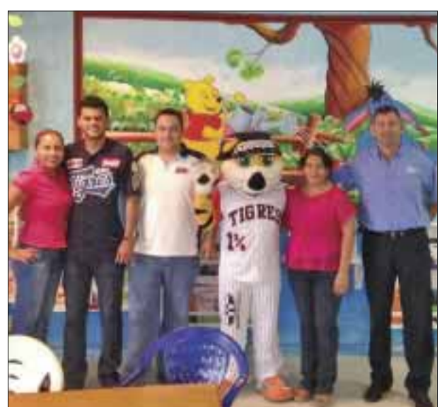
Miembros de los Tigres, con directivos del plantel infantil.