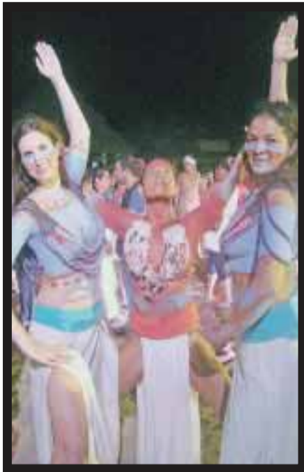
En la ceremonia de despedida.

de donde partieron, por primera vez, 32 canoas con 326 canoeros de los cuales el 40% fueron mujeres, que remaron en mar abierto. Y como dijo Miguel Quintana Pali: salir de Xel Ha "fue un reto que dobló el esfuerzo y triplicó las ganas".