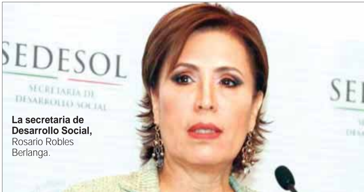
La secretaria de Desarrollo Social, Rosario Robles Berlanga.