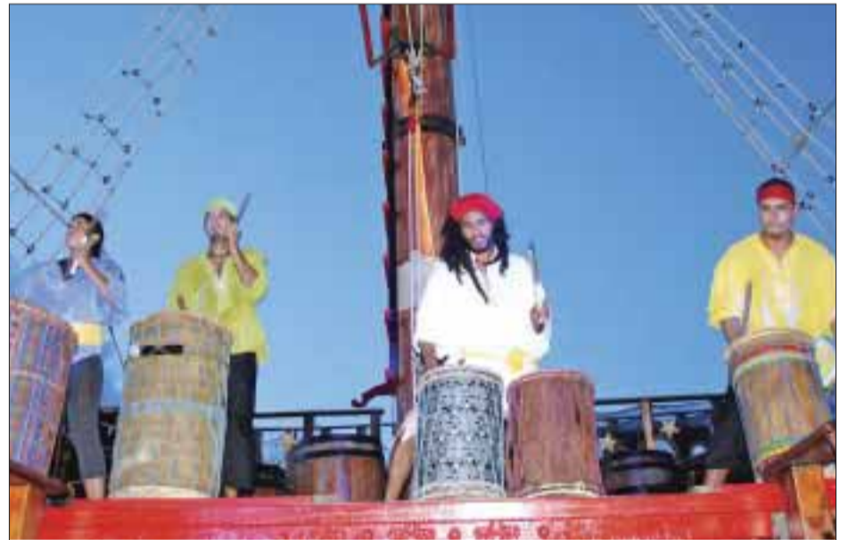
Los tambores de bienvenida.