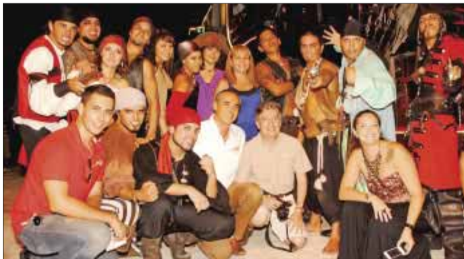
El staff de Jolly Roger y personal de DIARIO IMAGEN.