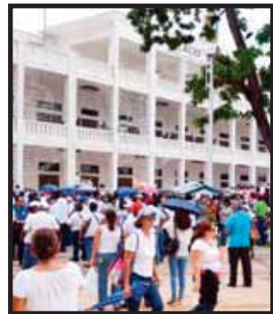
MAESTROS FRENTE a palacio de gobierno.