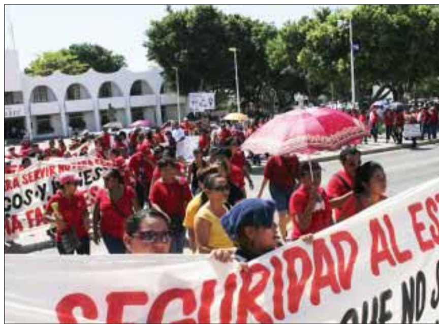
Mestros se manifestaron la semana pasada en varios municipios del estado.

Los mentores agredieron a la escolta del mandatario y a los trabajadores de la Secretaría de Gobierno y de otras dependencias que estaban en el estacionamiento, buscando salir de sus oficinas.