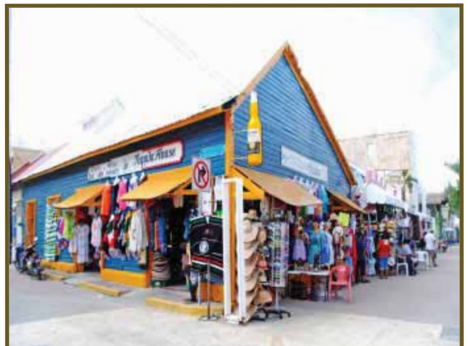
Las tiendas ofrecen mercancía novedosa.