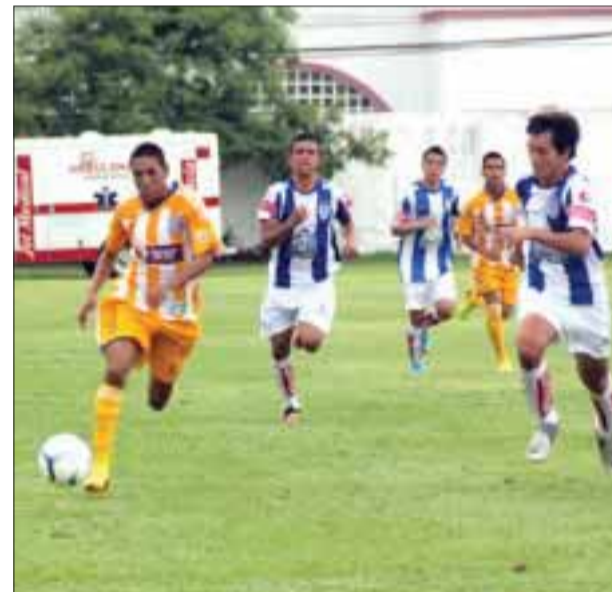
La Jornada 5 de la Liga Nuevos Talentos, fue como "mantequilla" para los caribeños, quienes saborean la cima de la tabla general.