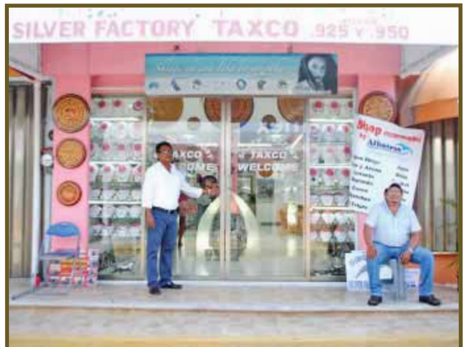
Los artículos de lujo también resienten bajas ventas.