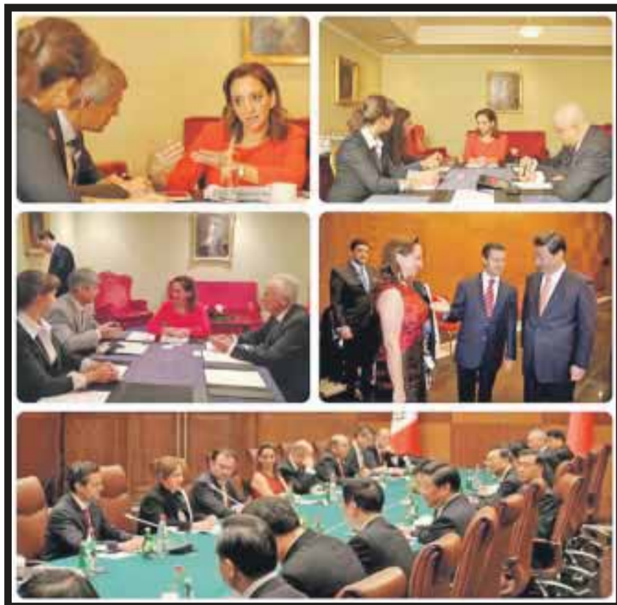
Importantes logros de Claudia Ruiz Massieu en su viaje a Rusia.

manera, la empresa Transaero Tours se comprometió a analizar esquemas económicos y financieros para iniciar operaciones vía Transaero Airlines a la ciudad de México y, en esquemas vía Transaero Charters , en los próximos diez días tendrá propuestas de operaciones con riesgo compartido a Acapulco y Vallarta-Nayarit. Claudia Ruiz Massieu también sostuvo un encuentro con Alexander Shapkin , presidente de la Comisión de Turismo del Gobierno de San Petersburgo, con quien acordó establecer un mecanismo de cooperación turística y cultural entre ambos países, particularmente entre San Petersburgo y la ciudad de México, con participación importante de las entidades del sector turístico y cultural. Las conversaciones continuarán, con el fin de desarrollar un esquema de intercambio basado en conceptos como la "Semana de México en San Petersburgo" y la "Semana de San Petersburgo en México", que permitan aumentar el flujo turístico entre estos mercados. Durante su corta estadía en Rusia, en el marco de la Cumbre del G20, a la que asistió como parte de la comitiva del presidente Enrique Peña Nieto , la secretaria de Turismo se entrevistó con los operadores Versa y South Cross , y se planteó que, en conjunto, desarrollarán estrategias de promoción para reforzar el flujo de turistas desde San Petersburgo al Pacífico mexicano. El Consejo de Promoción Turística comenzará a alinear tácticas con ellos durante la participación de México en la feria Otdykh (a celebrarse del 17 al 20 de