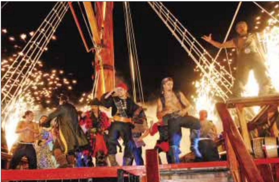
El gran final con fuegos artificiales.