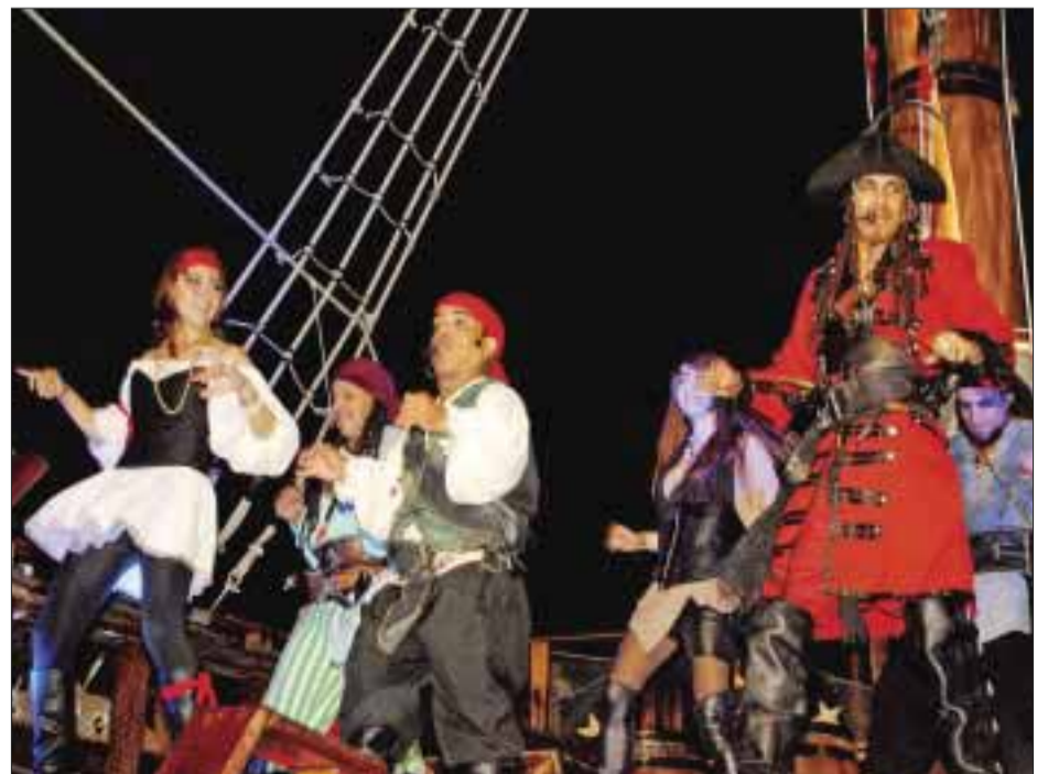
Los piratas ofreciendo su show.