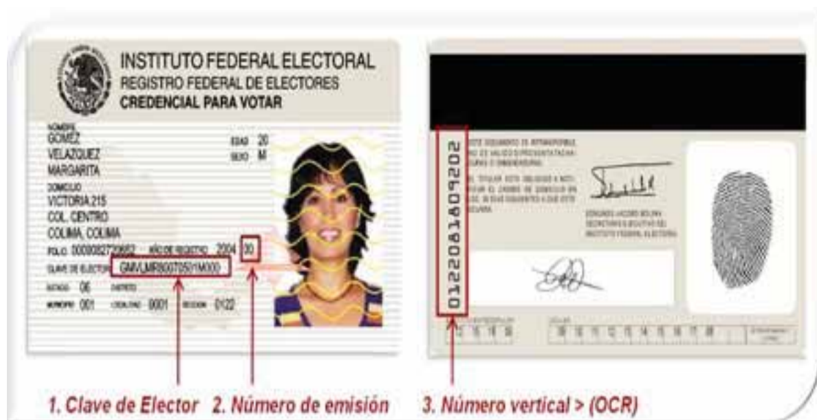
1. Clave de Elector 2. Número de emisión 3. Número vertical > (OCR)

Los módulos para atender a la población de la zona limítrofe, trabajarán con dos turnos y horarios del 31 de octubre, hasta el 31 de enero del 2014.