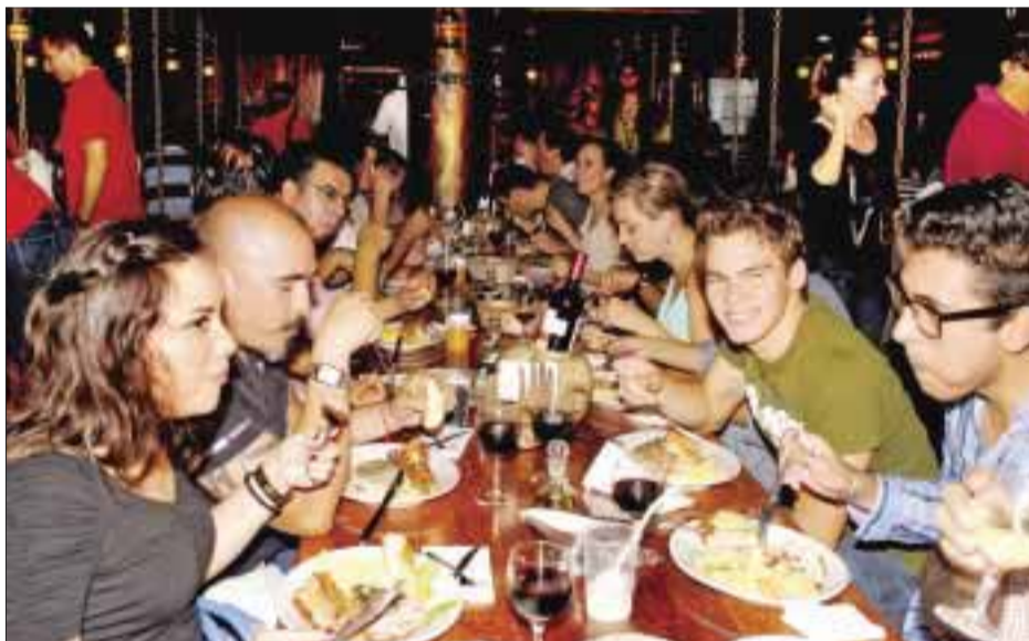
Durante la cena.