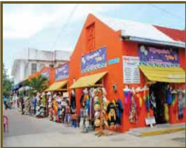
Los negocios ofrecen gran diversidad de productos.