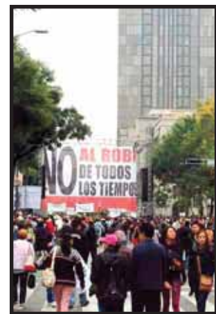
AMLO CONVOCÓ A NUEVA marcha el domingo 22.

Se acabarán los privilegios que no tienen justificación ni razón de ser. Que todos los contribuyentes, sin excepciones ni ventajas para nadie, aportemos al país en la medida de nuestras posibilidades. Con esta reforma todos haremos más por la nación y México hará más por los mexicanos