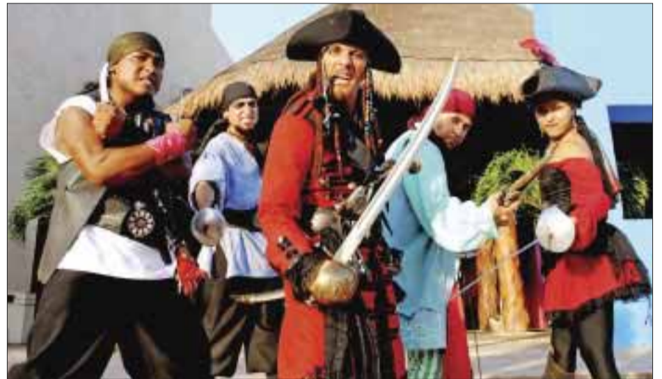
Los piratas posan para DIARIOIMAGEN.

Apreciable lector, si tiene algún evento social, deportivo, cultural, etc., envíenos un correo y con gusto DIARIOIMAGEN lo cubrirá y publicará. fatytoledo5@gmail.com