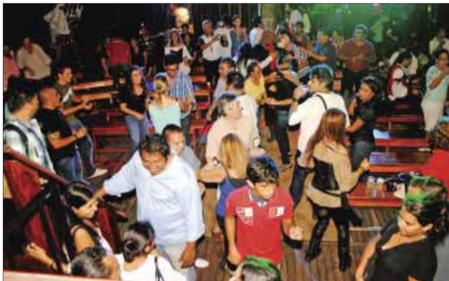
En cubierta todos se divertieron bailando.