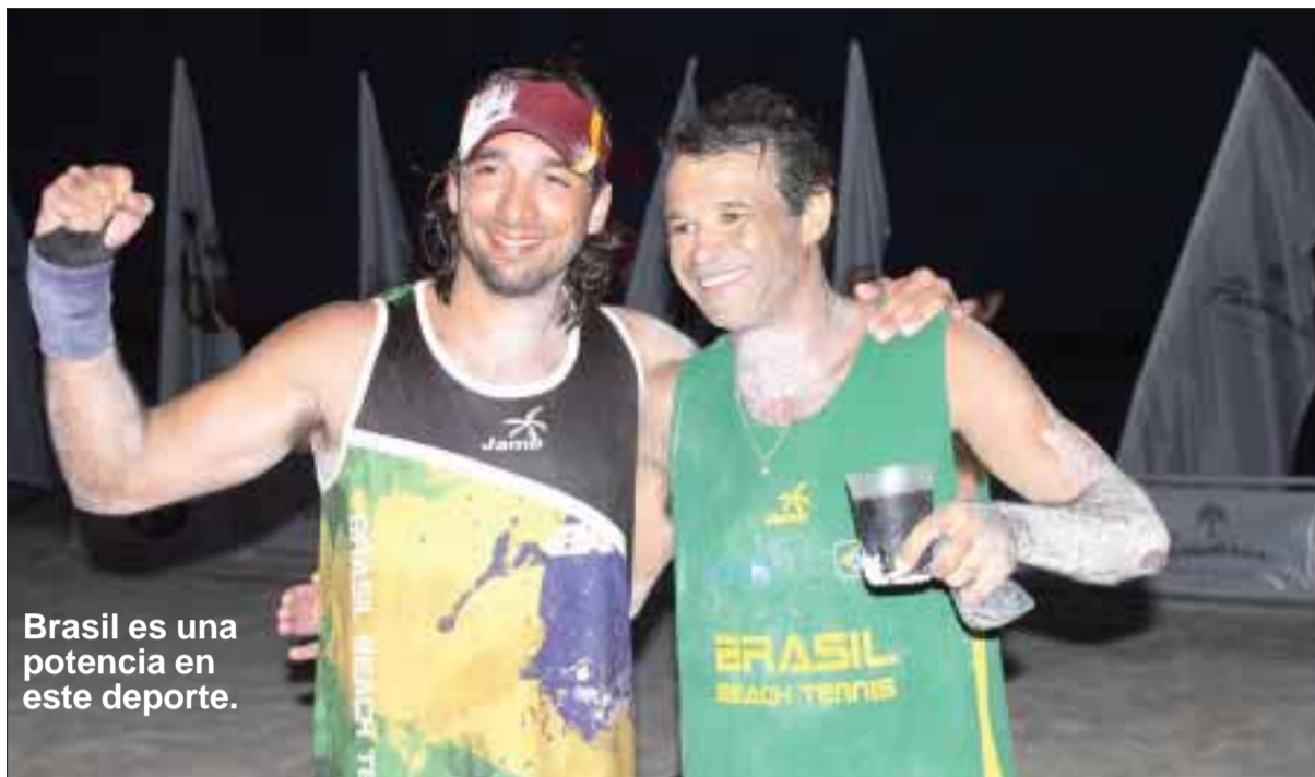
Brasil es una potencia en este deporte.