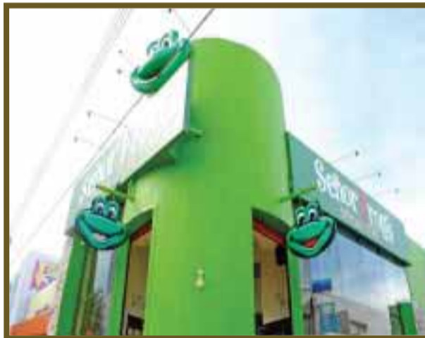
Hasta el "Señor Frogs" padece la temporada baja.