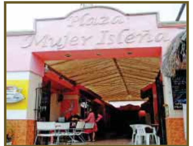
Plaza Mujer Isleña.