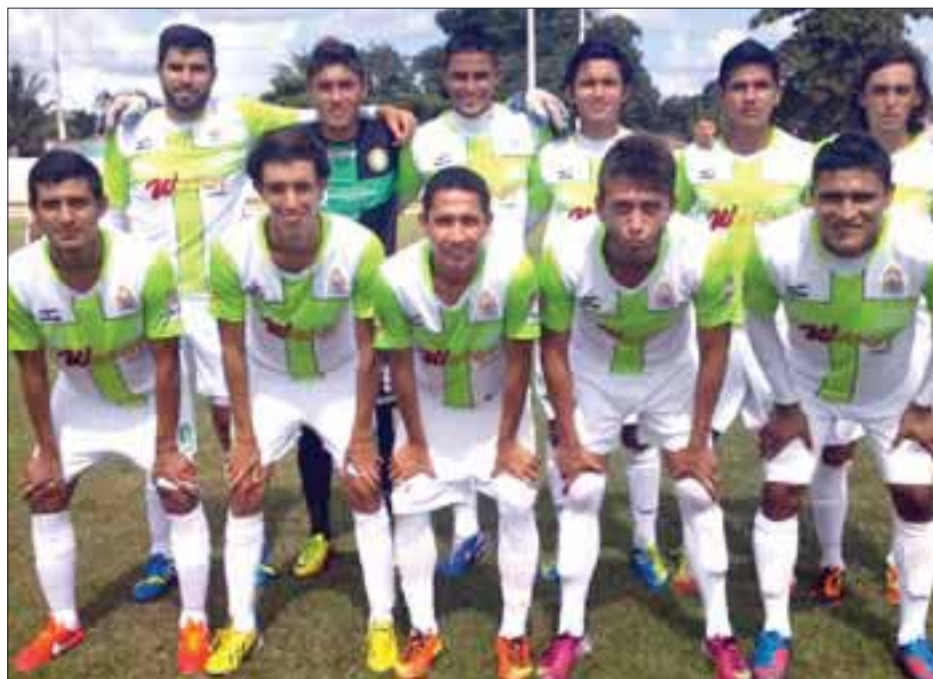
Un solitario gol en el tiempo de compensación, permite que Interplaya retenga el título de invicto, pero sin mayor gloria.