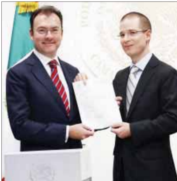
El secretario de Hacienda, Luis Videgaray, entrega el presupuesto 2014.

Lo anterior, explicó, porque trabajaron “con disciplina y amplio sentido patriótico” en el análisis de la reforma financiera, presentada por el Ejecutivo en el contexto del Pacto por México.