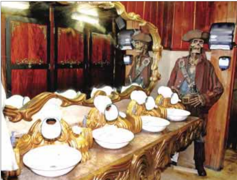
Muy original la decoración de los sanitarios.