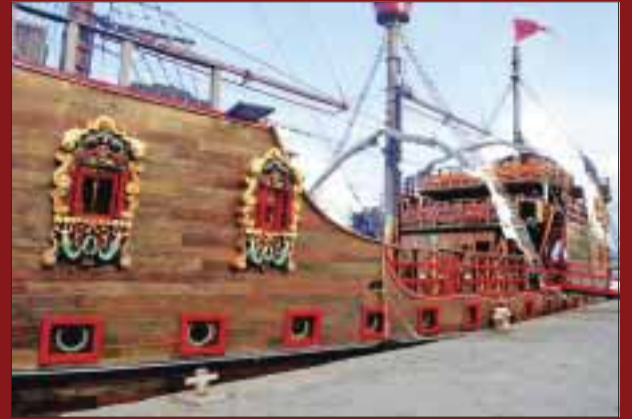
El barco Jolly Roger.