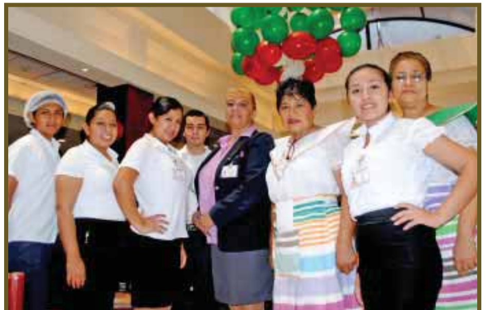
El personal posa para DIARIO IMAGEN.