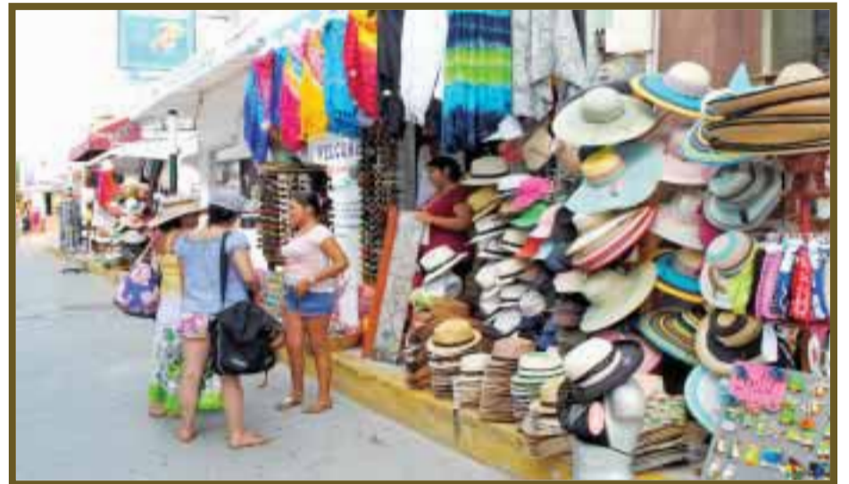
Comercios sobre calles del centro.

Sin embargo, la cuestión no sólo son las temporadas altas o bajas, pues nos comentan que el hecho está en el ahorro durante la buena temporada, pues si no se prevé, entonces ahí empieza a ser más complicado resistir hasta la temporada buena, hecho que obliga a muchos empleados a buscar nuevas fuentes de empleo temporal.