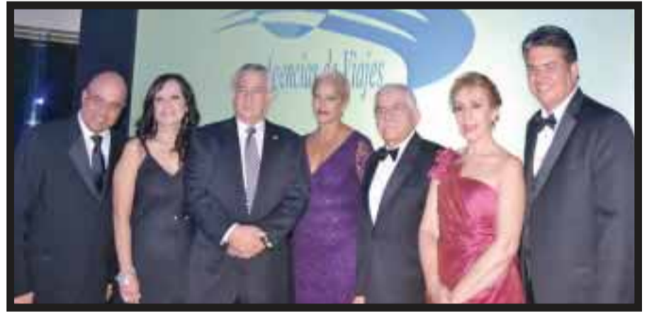
En el aniversario de la Asociación Metropolitana de Agencias de Viajes.