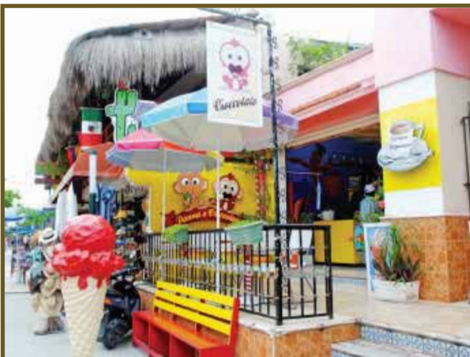
Los restaurantes se ven vacíos.