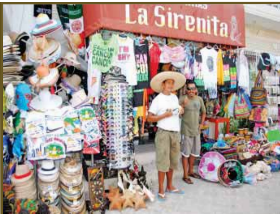
Los locatarios, en espera de la temporada alta.