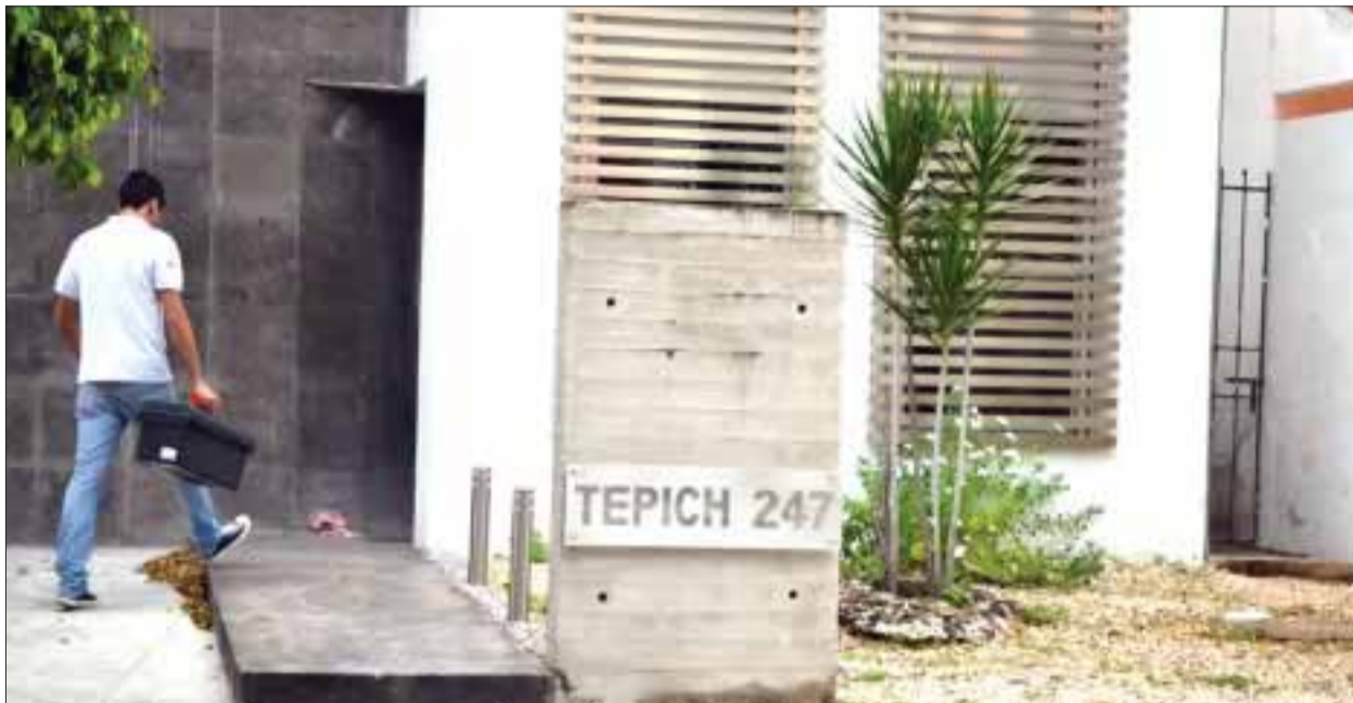
Unos desconocidos dispararon sobre la fachada de una oficina en la Sm. 50 y dejaron un narcomensaje, sin que nadie saliera herido.