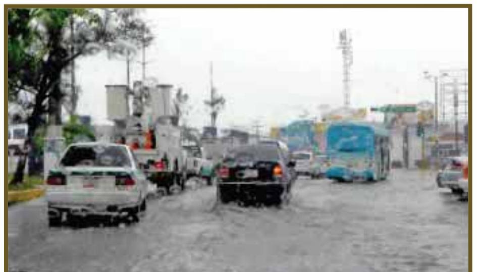
Tráfico e inundaciones que generan caos.