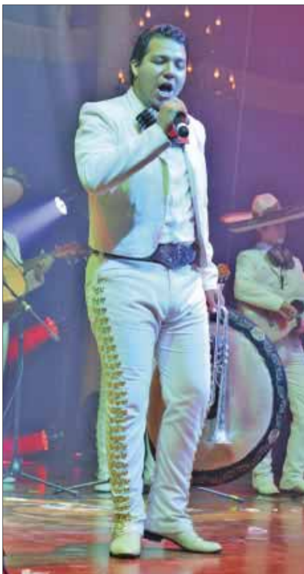
Interpretando con gran emoción sus canciones.