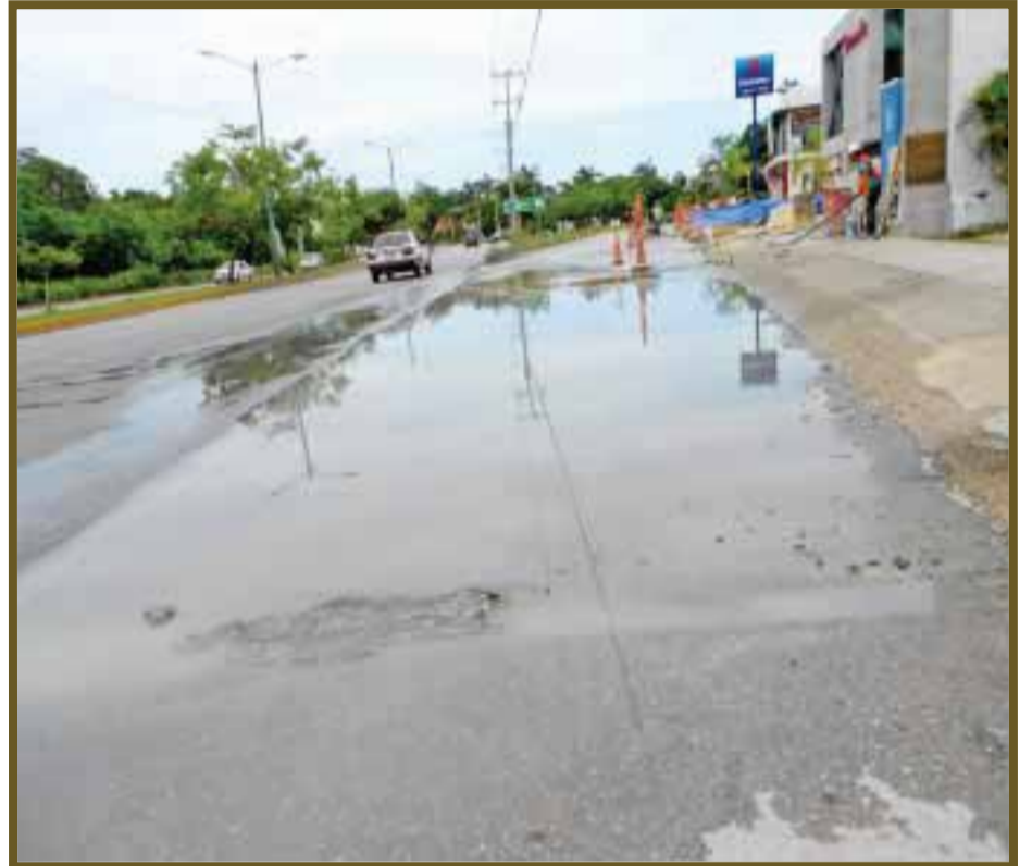
Todavía se observan calles inundadas.

lluvias continúe se seguirá suscitando este tipo de acontecimientos y lo único que nos queda hacer es tomar precauciones, prevenir daños mayores. Guardar bien objetos que puedan salir volando, destapar coladeras, y estar prevenidos ante un cambio meteorológico de mayor magnitud, señalaron algunos vecinos afectados de esta ciudad.