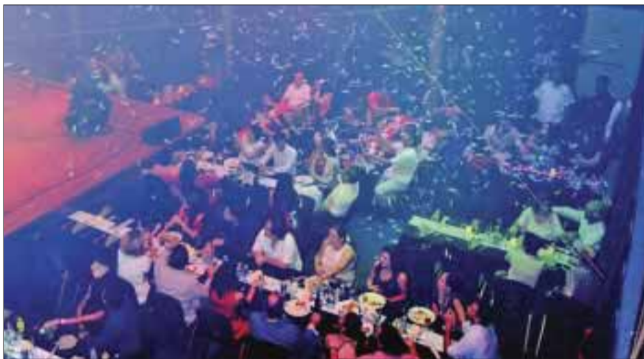
Celebrando el Grito de Independencia.