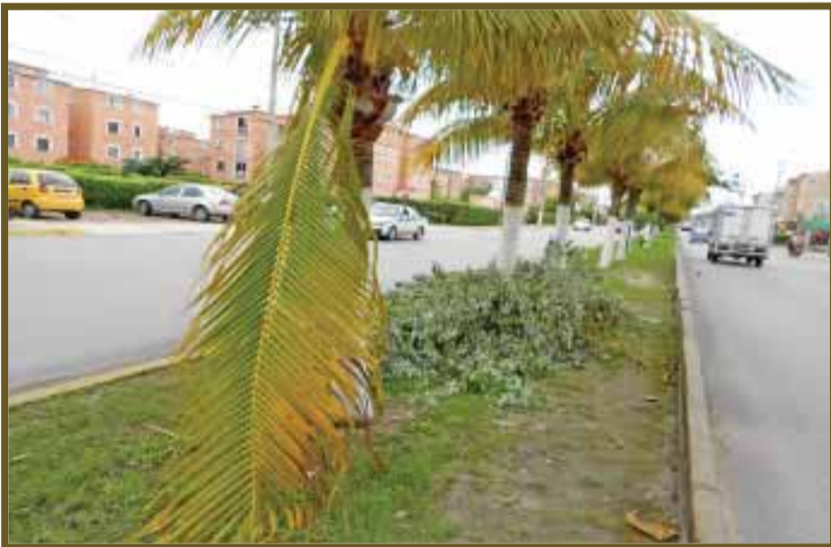
Palmeras derribadas por el viento.