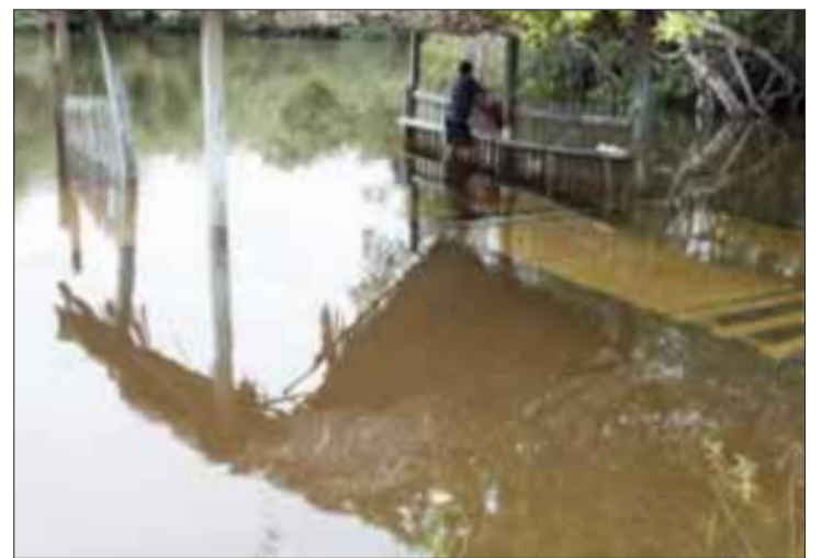
Encharcamientos por arriba de los 35 cm en Bacalar.