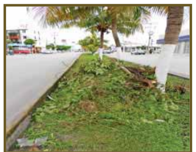
Ramas de árboles derribadas por las ráfagas.