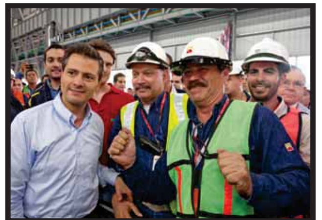
ENRIQUE PEÑA NIETO visita Centro Industrial Ternium en Nuevo León.

del huracán Gilberto , y en 2010 con el meteoro Alex . "Frente a la adversidad y frente a las contingencias climáticas el carácter de los mexicanos debe sobreponerse, para seguir trabajando a favor del desarrollo y el progreso de todo el país"... >14 y 15