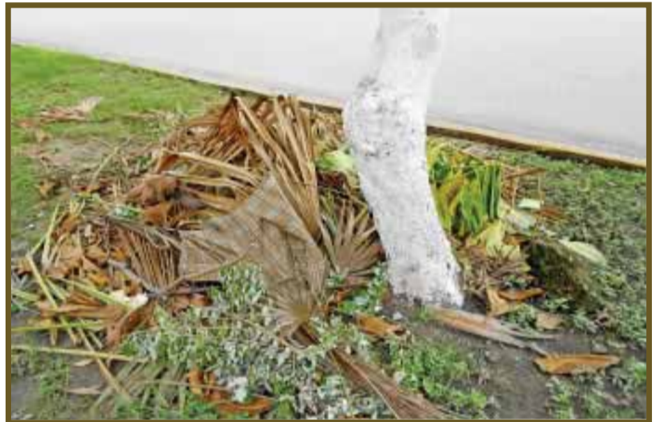
Basura que dejó el viento.