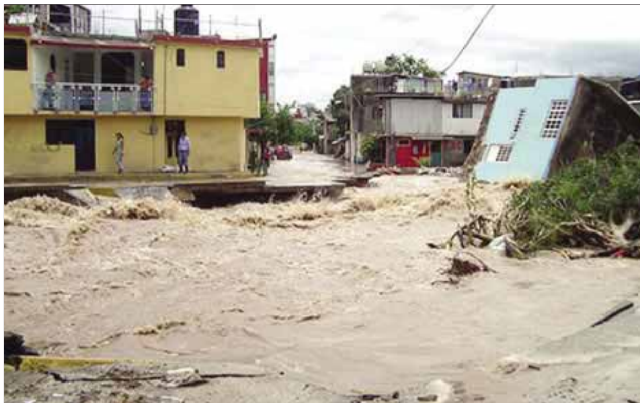
El recuento de los daños se prolongará por dos días, pues la tragedia por los fenómenos meteorológicos no ha concluido.

Por su parte, la Comisión Federal de Electricidad (CFE) calculó en 415 mil usuarios los afectados por las lluvias en todo el país, 43 por ciento de los cuales, unos 280 mil, se concentran en el estado de Guerrero, donde en cuatro días la precipitación