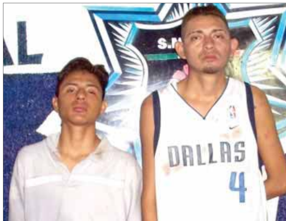
Bajo los influjos de alguna droga, 5 sujetos lanzaban piedras a los carros, hasta que dos de ellos fueron detenidos.

Los daños a la carrocería y el parabrisas, fueron calculados preliminarmente en 7 mil pesos.