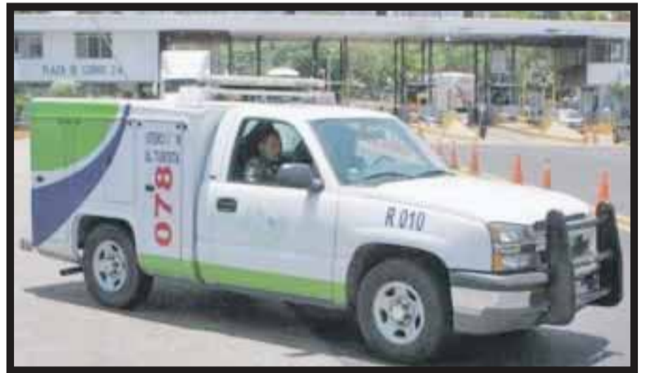
Ángeles Verdes refuerzan su presencia.

☆☆☆☆☆ El Consejo de Administración de Meliá Hotels International aprobó realizar una emisión de obligaciones convertibles y/o canjeables por acciones de nueva emisión y/o ya existentes de la sociedad, por importe nominal de 50 millones de euros. La decisión se enmarca en el objetivo de la compañía de reestructurar su deuda con el fin de aumentar la proporción de financiación en mercados de capitales hasta el 50%, aprovechando además la buena cotización actual del bono en el mercado. De conformidad con la cláusula 16 de los Términos y Condiciones de la "Emisión de Obligaciones Convertibles y/o Canjeables de Meliá International S.A., 2013", aprobada por el Consejo de Adminis-