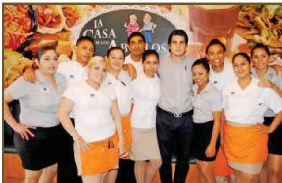
Personal posa para DIARIOIMAGEN.