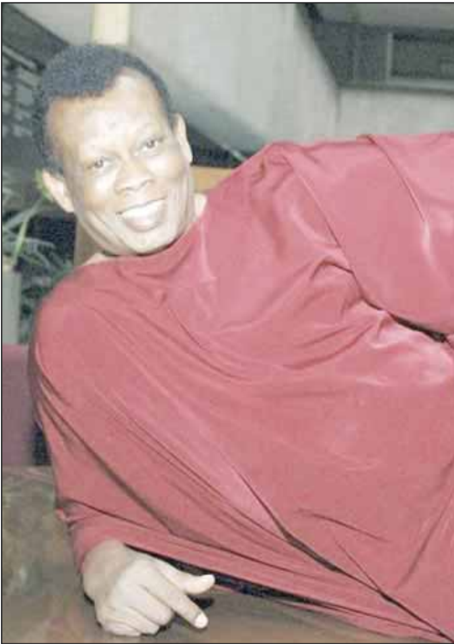
Falleció víctima de cáncer de próstata en la ciudad de México. Ayer mismo sus restos fueron cremados

El llamado Apostol del Rock falleció a los 71 años