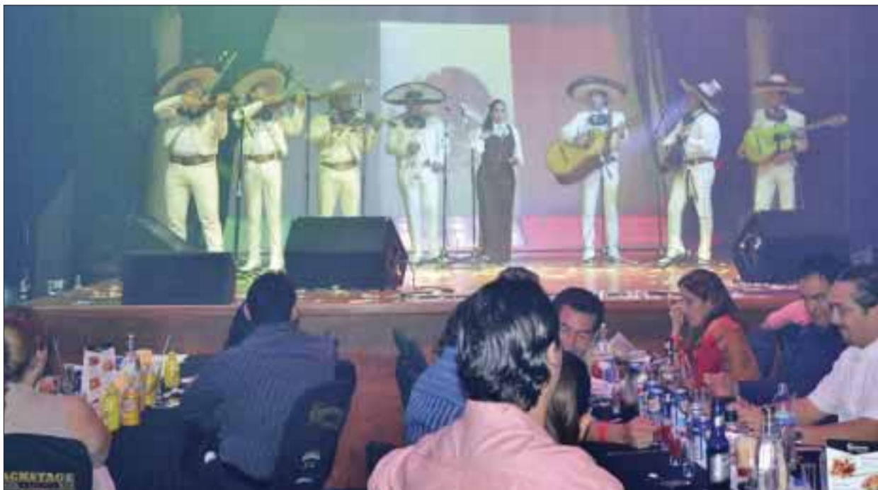
La gente disfrutaba.