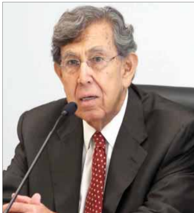
El ex jefe de gobierno del Distrito Federal anunció una consulta revocatoria de la reforma energética.

En conferencia en el salón Heberto Castillo del Senado de la República, también informó que se ha creado un comité convocante para reunir los requisitos para llevar a cabo dicha consulta.