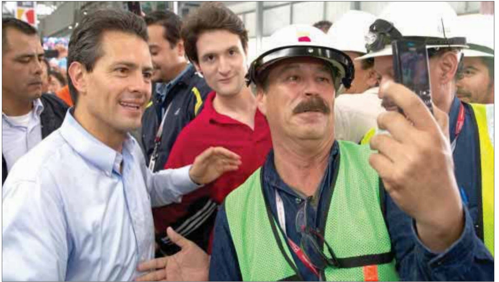
El presidente Enrique Peña Nieto estuvo ayer en Nuevo León, donde inauguró las instalaciones del Centro Industrial Ternium y más tarde visitó Ciudad Mante, Tamaulipas.

Acompañado por el gobernador de la entidad, Rodrigo Medina y el secretario de Economía, Ildefonso Guajardo Villarreal, el mandatario federal dijo que esto reafirma la confianza que hay en el país.