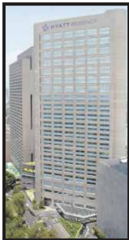
Hyatt Regency Mexico City.

encontramos disitintas terapias de acuerdo a las necesidades que cada persona busca. En el caso de conseguir una mejor figura, no son pocas las terapias, suplementos alimenticios, dietas y "trucos" para conseguirla. Cuidar el peso, además de una cuestión estética, se ha convertido en una necesidad de salud, ya que es una realidad que la acumulación exagerada de grasa en ciertas partes del cuerpo puede provocar enfermedades como hipertensión, diabetes e incluso un infarto. Es por ello que además de una dieta balanceada y ejercicio se pueden buscar opciones no invasivas para disminuir la grasa excedente. Vulá Spa siempre tiene alternativas como el novedoso equipo Ivéa , de tecnología francesa, que se aplica tanto en cara y cuerpo mediante la estimulación transcutánea con lo que se mejora la elasticidad de los tejidos y se incentiva el funcionamiento adecuado de los ganglios y el sistema linfático, cuya función se ve disminuida con el paso de los años, una mala alimentación y la vida sedentaria. Con las sesiones de Ivéa , se ayuda a la ruptura de las capas de tejido graso para moldearlas y eliminar la grasa excedente a través del hígado. Aunado a ello se produce un drenaje linfático, que ayuda a la expulsión de toxinas y los líquidos que se retienen en glúteos, muslos