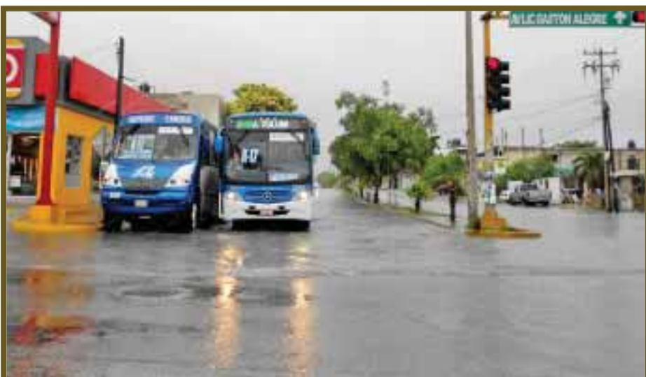
Arterias principales inundadas.