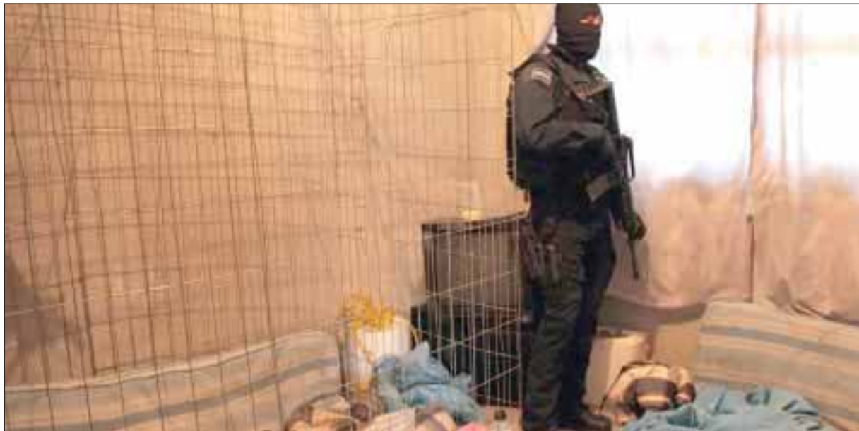
Imagen de archivo de una casa de seguridad, donde secuestradores mantenían a sus víctimas.

Alrededor de las 2:00 horas Castillo Meléndez y varios cómplices que portaban armas de fuego y tenían los rostros cubiertos con pasamontañas irrumpieron en el inmueble, donde preguntaron a los afectados por una supuesta maleta con energías y dinero.