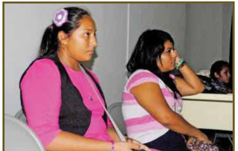
Muy interesados durante la proyección.