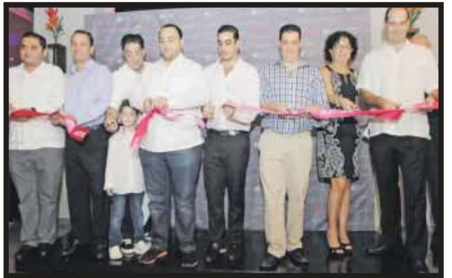
Durante el corte de listón del nuevo hotel en Cancún.

debido a que son pioneros en fomentar iniciativas de música, diseño y tecnología. El inmueble ofrece una experiencia totalmente sensorial, con 177 habitaciones con techos de casi tres metros de altura y ventanas extragrandes, creando un ambiente brillante. El hotel es protagonista de impresionantes espacios públicos, los cuales han hecho de la marca un éxito mundial. Los huéspedes podrán interactuar con otros, leer el periódico, trabajar en sus laptops, jugar un partido de billar o tomarse un trago con los amigos en el área de lobby común re:mix SM o en el bar w xyz SM . El hotel también cuenta con una alberca en el último piso, un café re:fuel , el gimnasio recharge , con un área de vapor y dos cabinas de masajes. Tiene aproximadamente mil 900 m 2 , de espacios para banquetes y juntas. Aloft debutó en América Latina en el 2011 en Bogotá, le siguió San José en Costa Rica y Panamá que abrió sus puertas el pasado 9 de septiembre. Hoy en día existen ocho hoteles en operación, bajo contratos de construcción o desarrollo en la región. En México, la marca estará en Guadalajara y Mérida, y abrirán en los próximos dos años, mientras que en