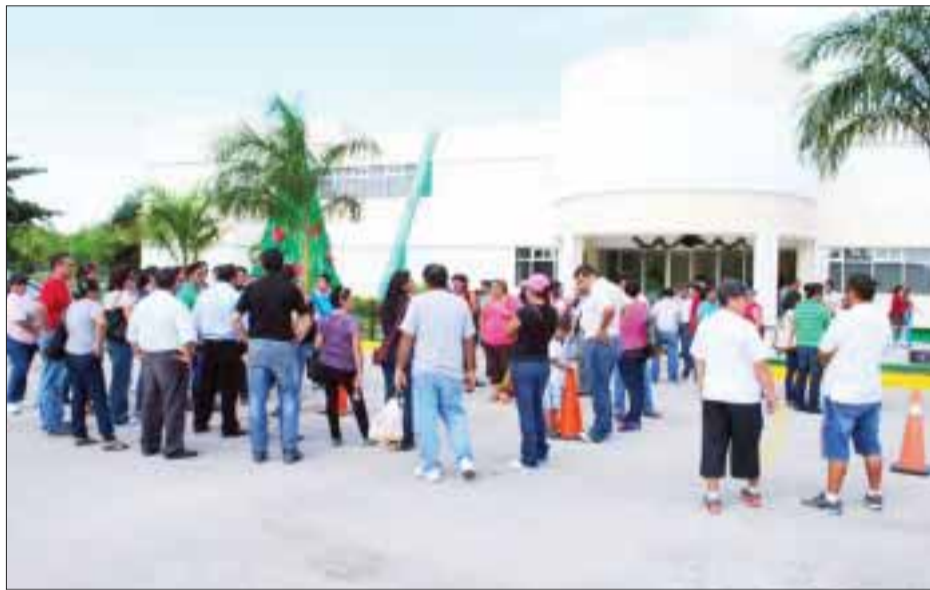
Los profesores en Quintana Roo negaron que el movimiento esté liderado por representantes de la Coordinadora Nacional de Trabajadores de la Educación (CNTE).

El plantón y acciones de protesta se mantendrá a pesar de las amenazas de actas administrativas.