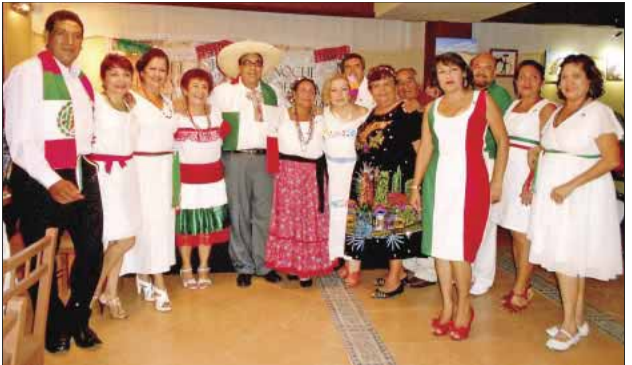
Los Amigos del Danzón.

Apreciable lector, si tiene algún evento social, deportivo, cultural, etc., envíenos un correo y con gusto DIARIOIMAGEN lo cubrirá y publicará. fatytoledo5@gmail.com