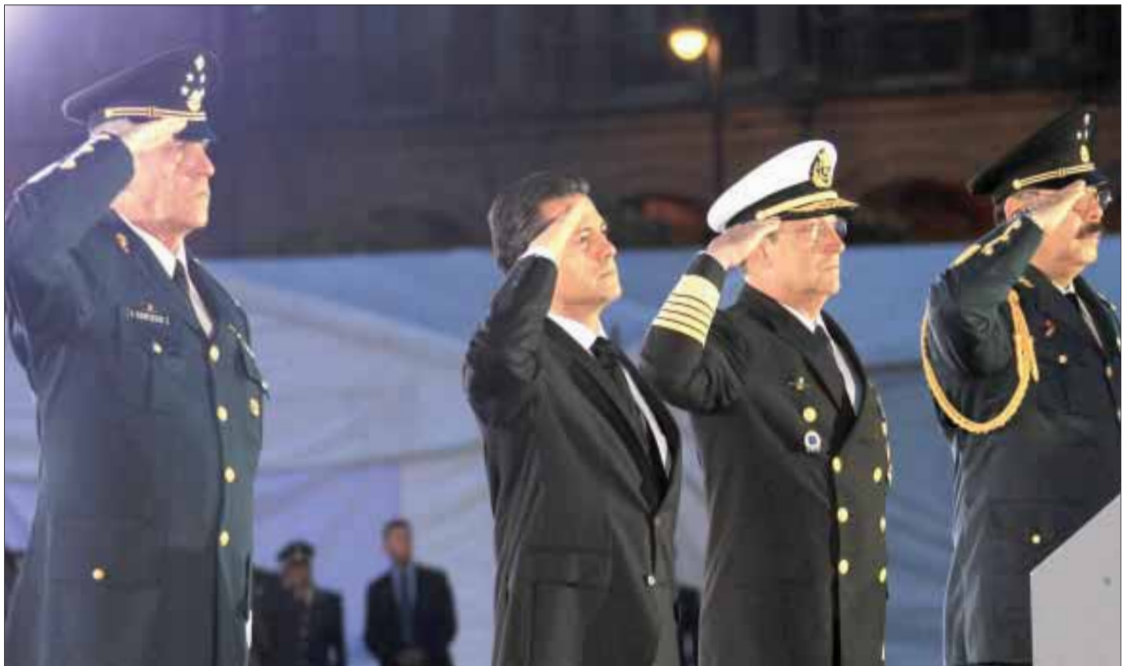
El presidente Enrique Peña Nieto izó la bandera a media asta en recuerdo de las víctimas del temblor de 1985.

Aunque 23 de los 32 estados mexicanos registran afectaciones, Guerrero ha sido la "entidad más golpeada y más afectada" por las lluvias, que desde el fin de semana pasado