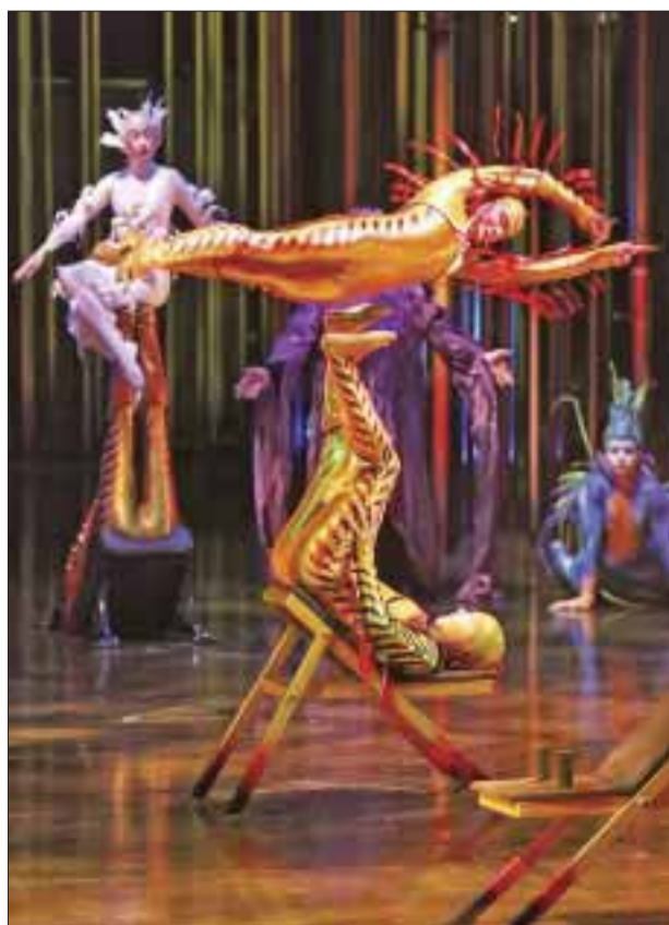
El espectáculo de Varekai es memorable.

En lo profundo de un bosque, en la cima de un volcán, existe un mundo extraordinario donde algo diferente es posible, un mundo llamado Varekai