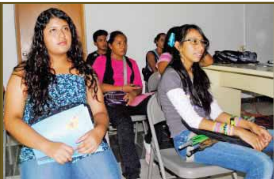
Los jóvenes disfrutaron de las películas.