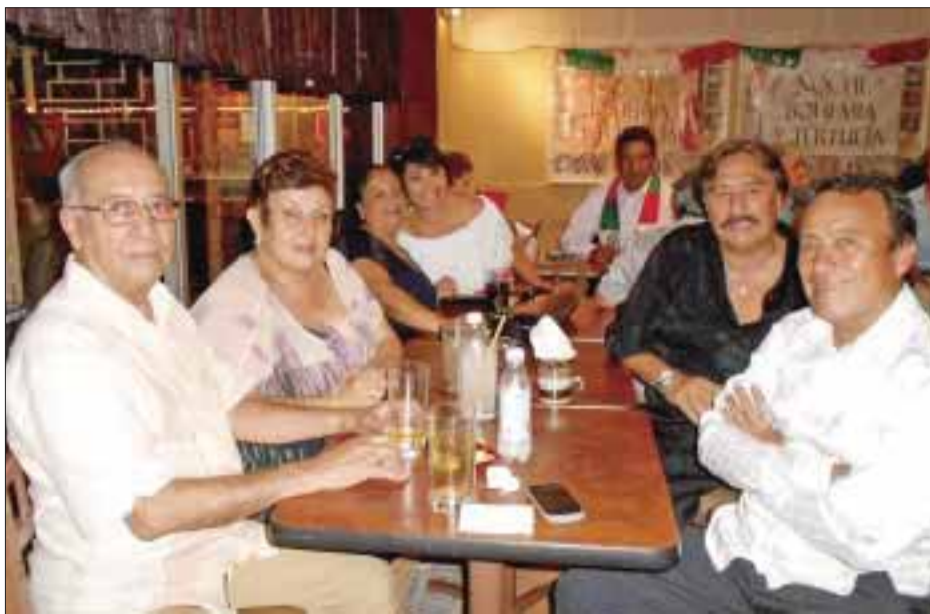
Amigos de los anfitriones posan para DIARIOIMAGEN.