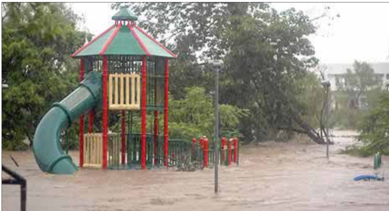
Este es un parque con juegos infantiles de uno de los cinco municipios golpeados por “Manuel”, que tocó tierra ayer en Sinaloa.

Osorio Chong añadió que el gobierno federal ahora envía los recursos y apoyos a los estados afectados por las lluvias “antes de que suceda la emergencia”, por lo que los recursos ya están en los lugares donde se necesitan. A su vez, el subsecretario de Normatividad de Medios de la SG, Eduardo Sánchez, aseguró que el Ejército tiene el con-