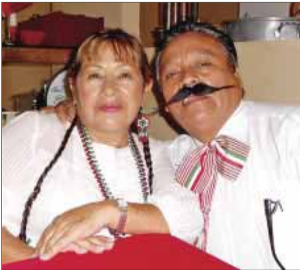
"Pancho Villa y su Adelita".