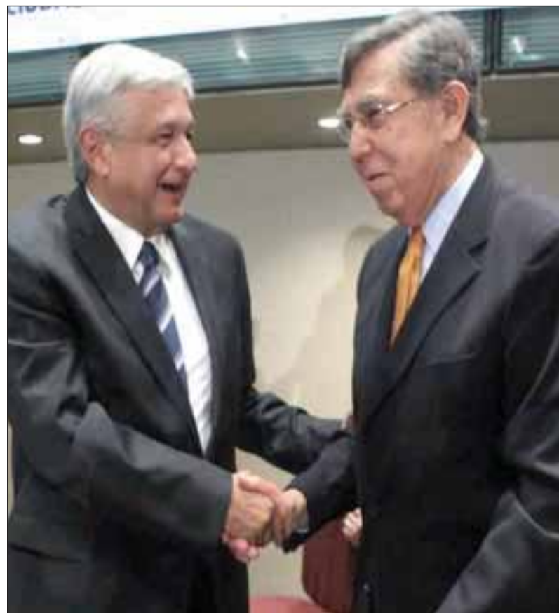
Cuauhtémoc Cárdenas y Andrés Manuel López Obrador, dos ex dirigentes del PRD, se reunieron ayer.

En el documento se pronuncian "a partir del respeto a nuestras diferencias" a organizar la resistencia "reconociendo la autonomía y la independencia de las organizaciones y los in-