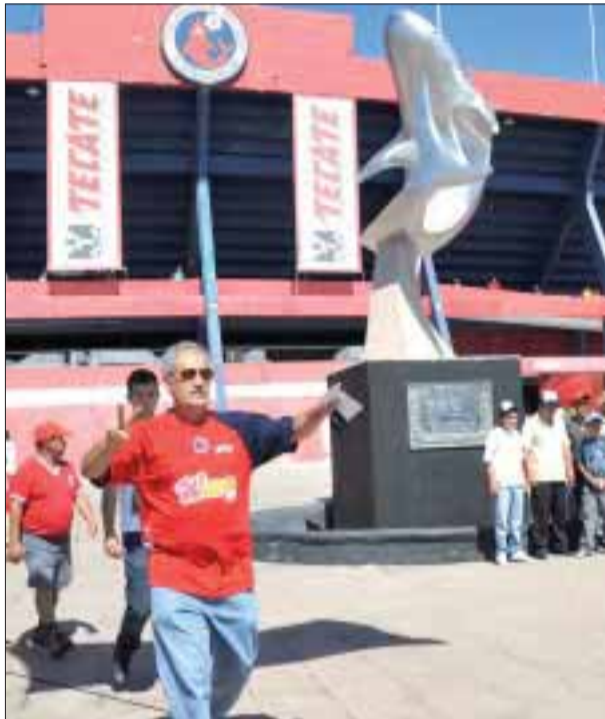
El estadio que otorga localía a los Tiburones del Veracruz fue sancionado.