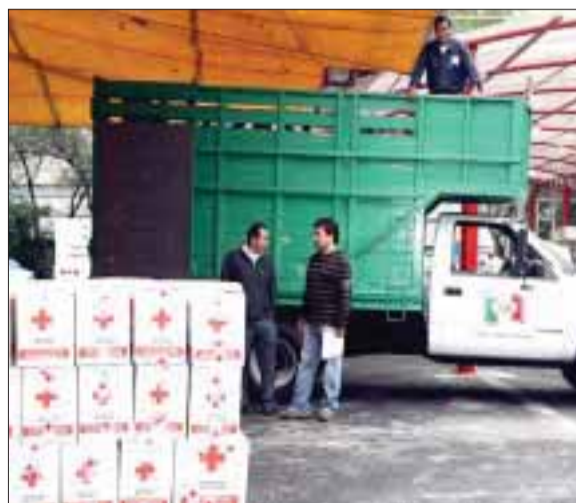
El Comité Olímpico Mexicano llenó un camión con ayuda.

"Exhorto a la comunidad a unirse para brindar la ayuda necesaria para los damnificados. Sería bueno que se acerquen a los diferentes centros de acopio para que apoyen con artículos de higiene y víveres", expresó Padilla.