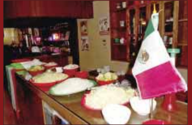
Los platillos mexicanos.