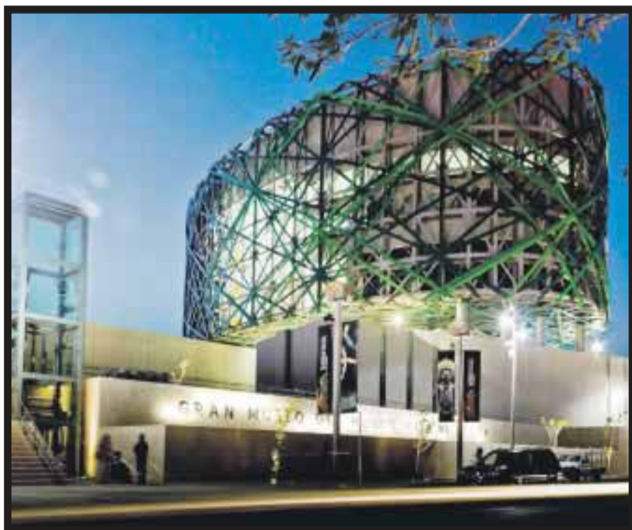
En este museo se exhibe la expo de los mejores diseñadores franceses.

ro en la región". Durante la 19ª Reunión de Comité Estatal de Emergencias, Ruiz Massieu conoció la determinación del gobernador de la entidad, José Francisco Olvera Ruiz , de solicitar la declaratoria de zona de desastre a fin de poder acceder a los fondos federales. Ahí, se informó del deceso de cinco personas y de tres más desaparecidas, además de estimarse que los daños ascienden a mil 300 millones de pesos hasta el momento. Hay alrededor de 80 comunidades afectadas en 25 municipios del estado. Asimismo, se dijo que el 90% de las afectaciones registradas hasta ahora se presentaron en caminos, carreteras y puentes; en tanto que el 10% restante, se detectó en líneas de agua potable, infraestructura básica y viviendas. No hay hospitales ni escuelas colapsadas. Durante su intervención, Ruiz Massieu , quien estuvo acompañada por el director general del Fondo Nacional de Fomento al Turismo (Fonatur), Héctor Gómez Barraza , reiteró el total apoyo del gobierno de la República y reconoció la labor realizada, tanto por las dependencias estatales como las federales. Lamentó la pérdida de vidas humanas por estos hechos, y recalzó que todos, autoridades de los ámbitos federal y estatal, así como la población en general, deben estar alertas y suficientemente informados para poder superar alguna otra contingencia que pudiera presentar-