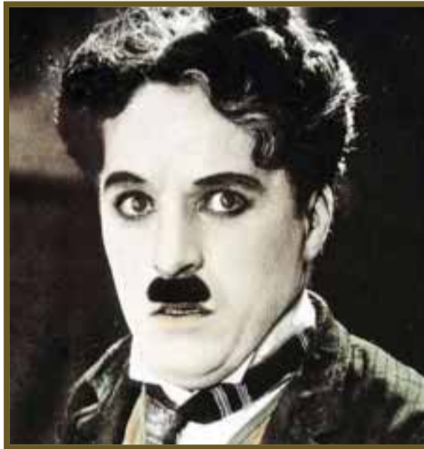
Charles Chaplin, uno de los principales proyectados.