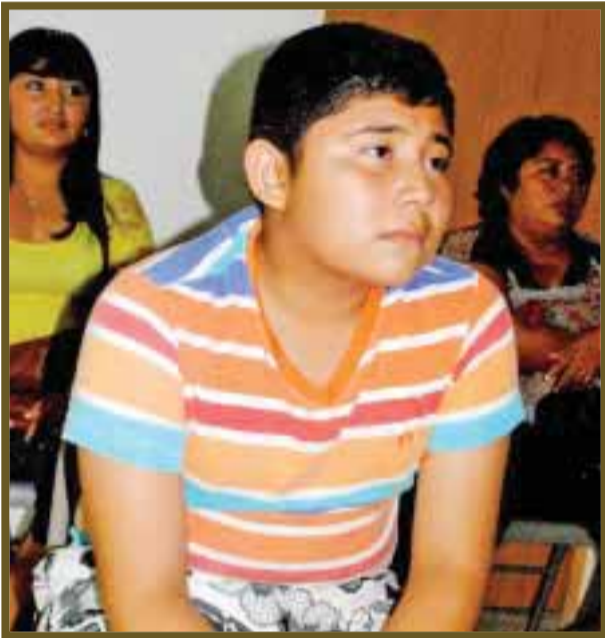
Muy atento a la proyección.