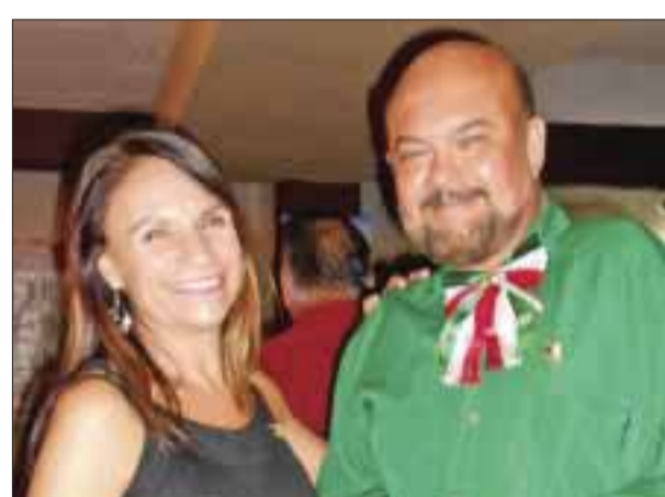
Muy contentos, los asistentes.