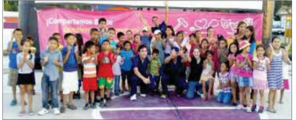
La empresa Dentalia despliega un programa denominado “Sonrisas para Todos” entre los niños.

En ellas se forman 51 mil alumnos, pero sólo 18 mil 296 pertenecen a los 49 programas de odontología acreditados por el Conaedo, mismos que representan poco más de la mitad de las incorporadas a la FMFEO, concluyó.