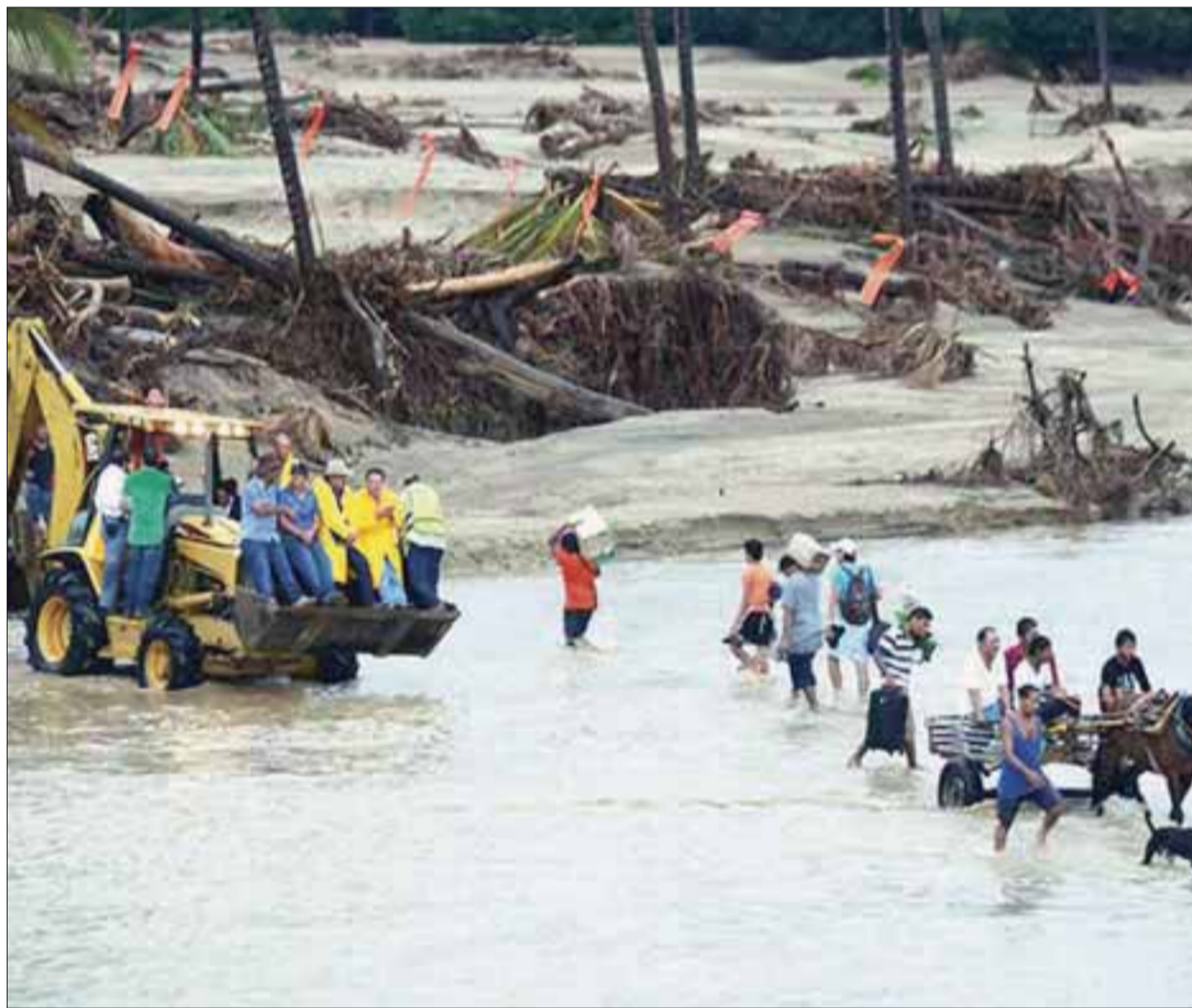
La rehabilitación y reconstrucción del estado de Guerrero comenzó y ya se observó movimiento de sus habitantes, que habían estado en los albergues.

En un ambiente de convivencia familiar participaron 12 mil 100 corredores en la competencia de 21 kilómetros, ocho mil 50 en las carreras de 10 y 5 kilómetros, y asistieron ocho