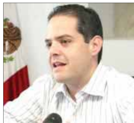
Manuel Ignacio Acosta Gutiérrez , jefe del Registro Agrario Nacional.

ha cambiado y se espera que sus gastos sigan creciendo, pues la rápida urbanización, el aumento de ingresos disponibles y la flexibilidad de las normas que rigen el movimiento hacia el extranjero lo han permitido.