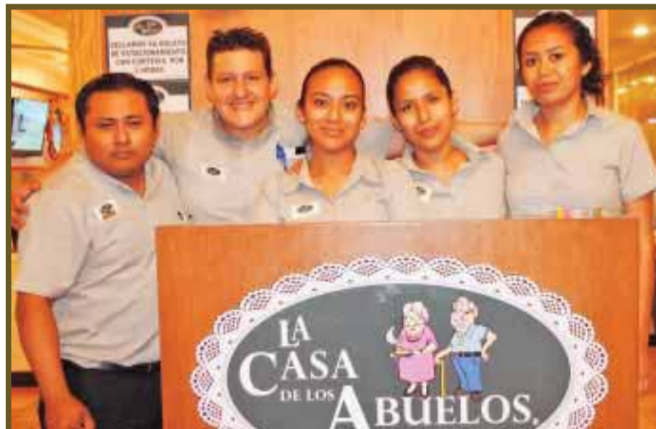
Personal posa para DIARIO IMAGEN.