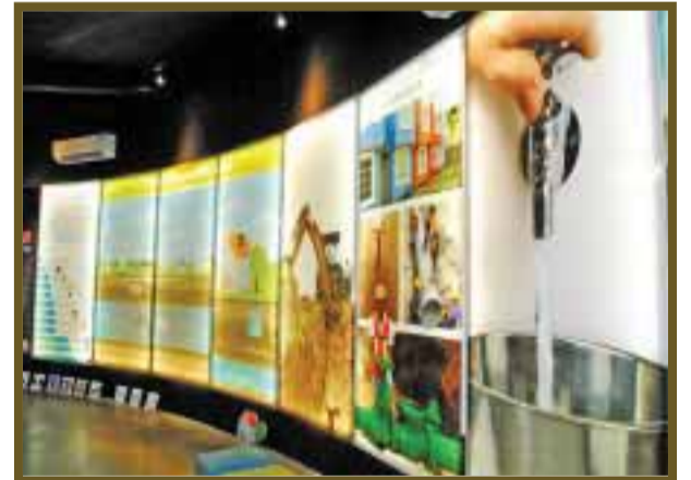
Láminas bien detalladas.