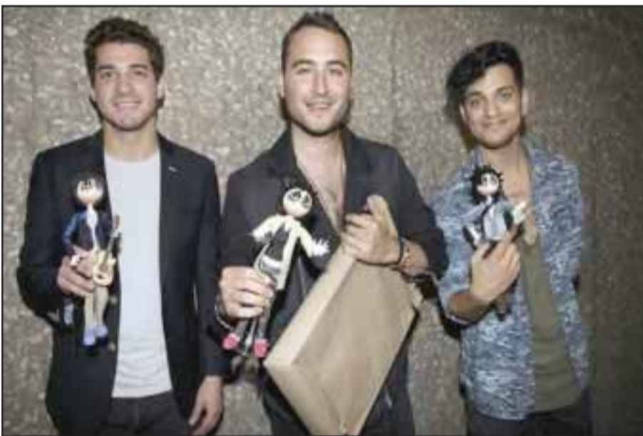
Reik, momentos antes de subir al escenario.