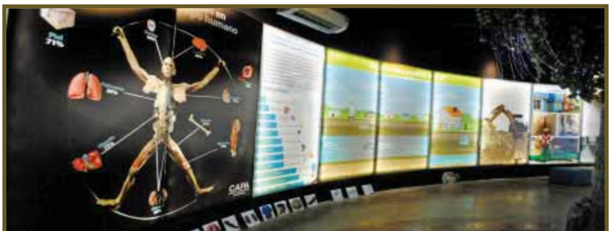
Algunas de las láminas.