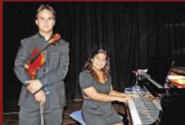
Los músicos, contentos de presentarse en Cancún.