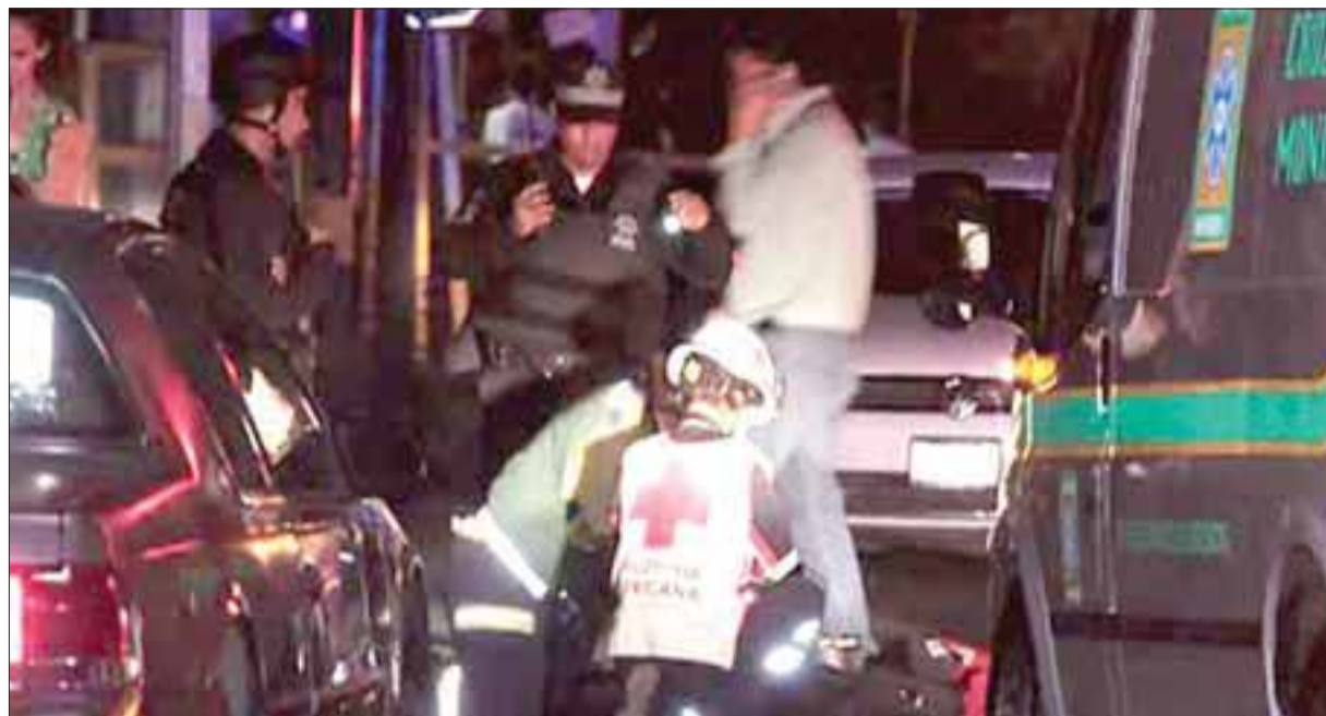
Los cuerpos de los asesinados en Monterrey quedaron sobre la banqueta.