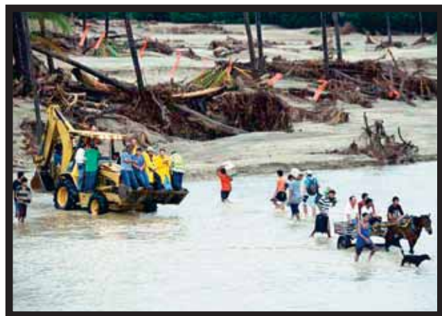
VASTA AFECTACIÓN POR LAS LLUVIAS; ardua la reconstrucción en las comunidades.

Asimismo, la SHCP previó que el efecto sobre el nivel de precios sea acotado y transitorio, con un incremento no mayor a 15 puntos base en la inflación anual. De tal manera, la inflación al cierre de 2013 sería de 3.60 por ciento en lugar de 3.45 por ciento, debido... >14 y 15