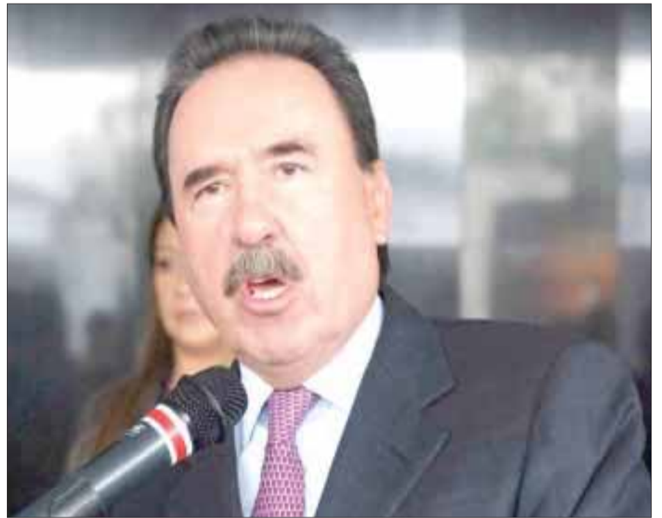
El coordinador de la bancada del PRI en el Senado, Emilio Gamboa Patrón.

Se debe mejorar nuestra democracia para que no sea sólo electiva, sino que se refleje en la vida cotidiana de los mexicanos. "Es decisión de los priístas en el Senado escuchar todos los puntos de vista y tras privilegiar la pluralidad entre los legisladores de las distintas fuerzas políticas, lograr una reforma que favorezca a los mexicanos y no sólo a los partidos políticos, pues estamos convencidos que debemos continuar la transformación democrática en México".