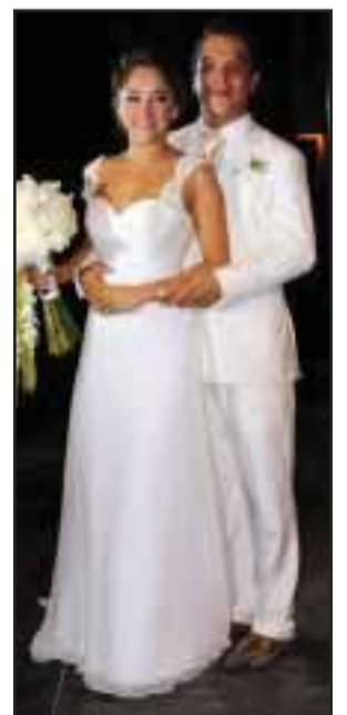
La pareja anunció que su boda por la Iglesia será con muchos más invitados.

"Vamos a mandar otro camión con víveres, todavía hay mucho por hacer", agregó Islas.