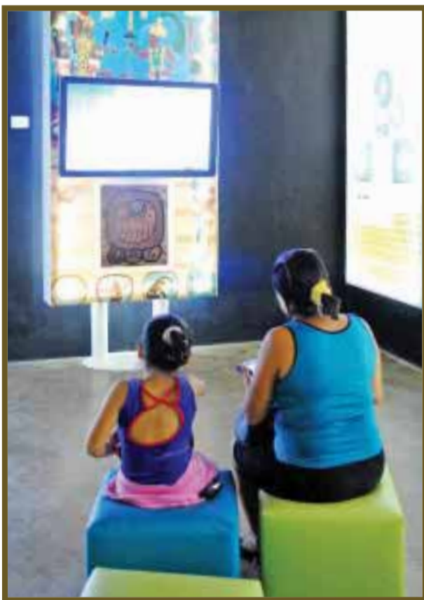
Los videos son proyectados para los asistentes.