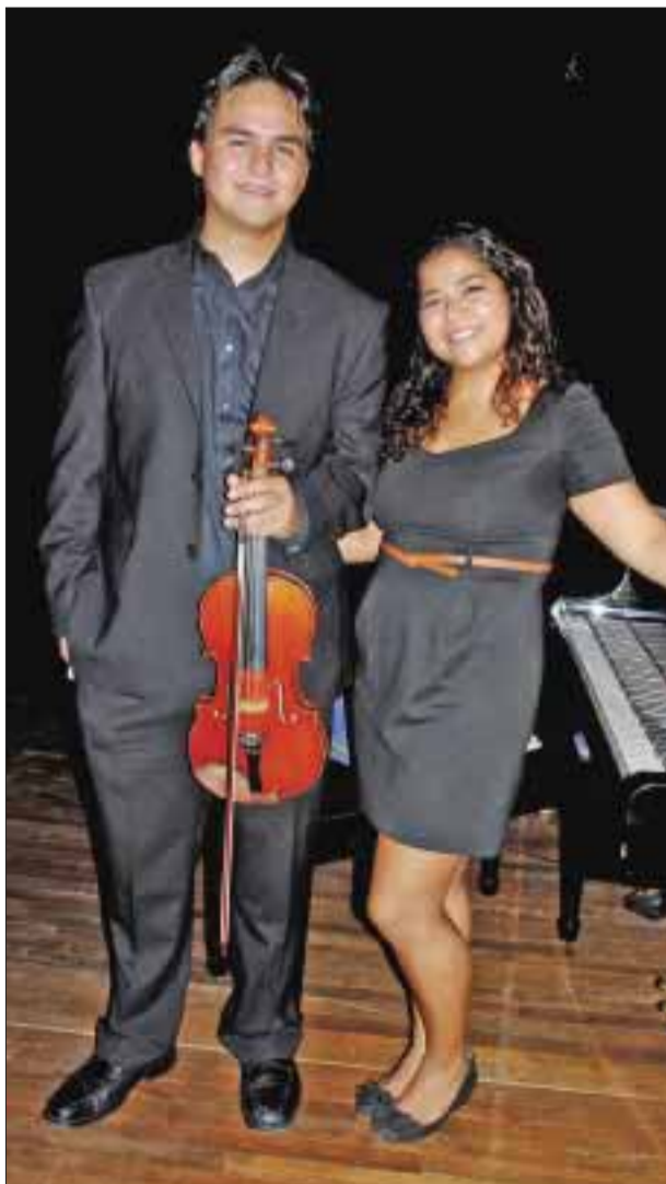
Los talentosos músicos posan para DIARIOIMAGEN.