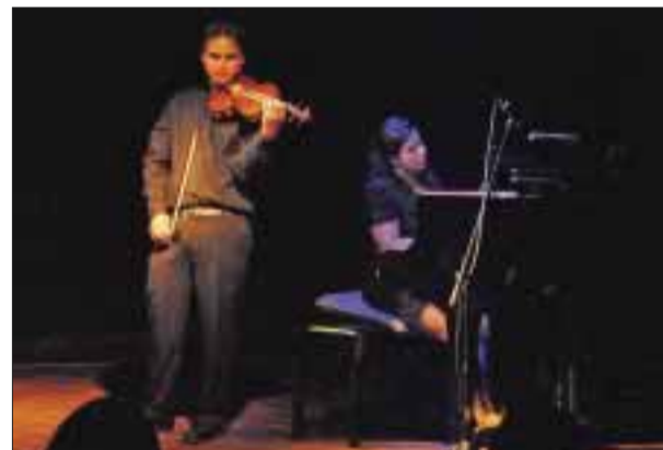
Una gran interpretación.