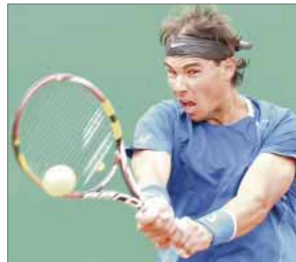
Montecarlo.- El tenista número uno del mundo, Rafael Nadal, pasó sin problemas a la siguiente ronda del Masters 1000 de Montecarlo.

kas Rosol, que venció por 6-4 y 6-4 al francés Michael Llodra.