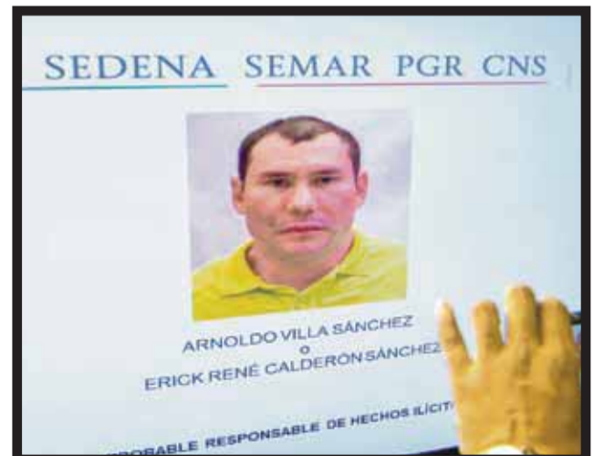
LA DETENCIÓN DEL CAPO ocurrió en la colonia Condesa.