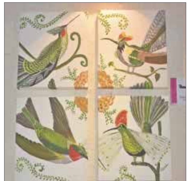
Aves del paraíso.