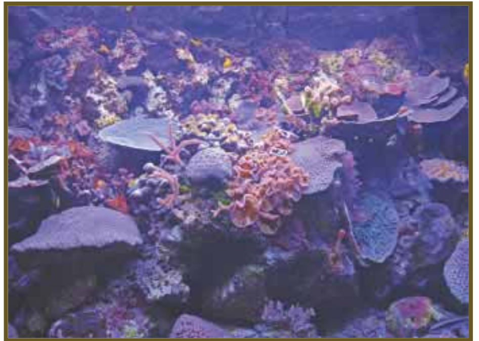
Los bellos corales.

En cada esquina de un coral se reproduce un microorganismo, creando diferentes comunidades, tal como sucede en un arrecife natural; los visitantes pueden observar varias especies, como el pez ángel y el pez perico alrededor de los coloridos corales y morenas durmiendo apaciblemente, es una experiencia increíble bajo el mar.