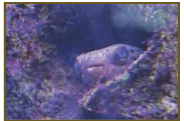
Mientras, el camarón elimina parásitos y piel muerta de la morena, manteniéndola limpia y sana.