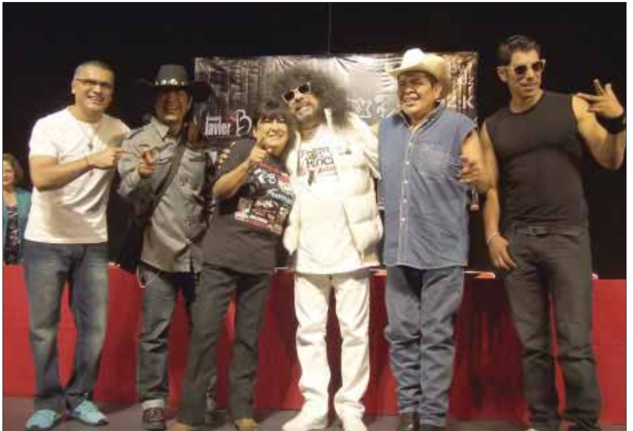
El rock y el blues llegan a Teatro Blanquita con los máximos exponentes de estos grandes géneros, donde se vivirán tres días de intensa energía musical; viernes 18, sábado 19 y domingo 20 de abril.