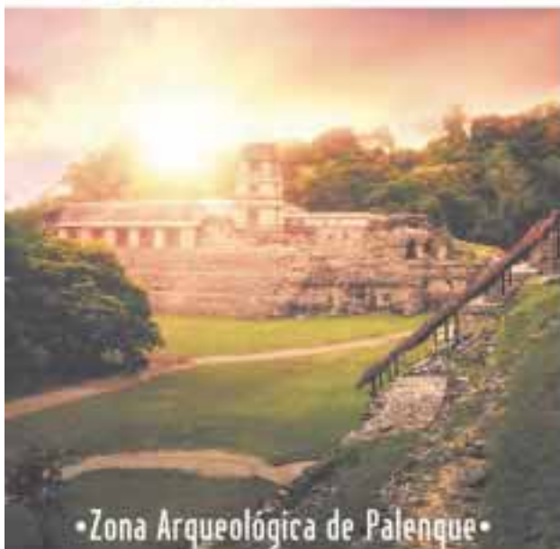
• Zona Arqueológica de Palenque •