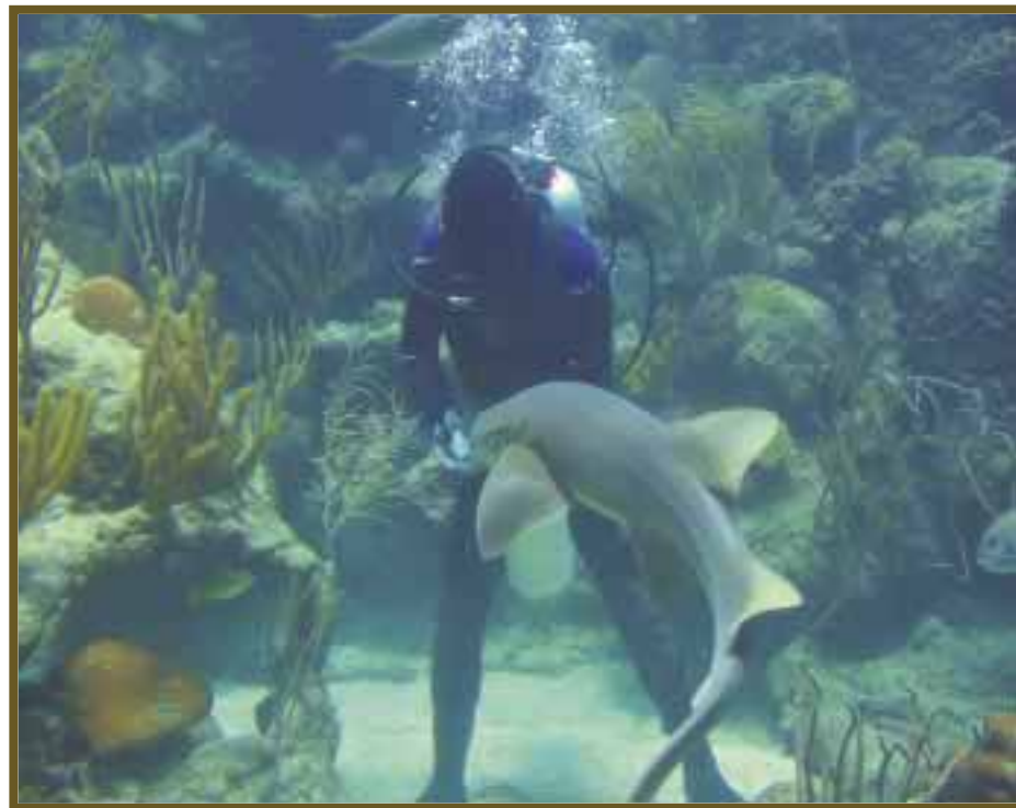
Buzo alimenta un tiburón.