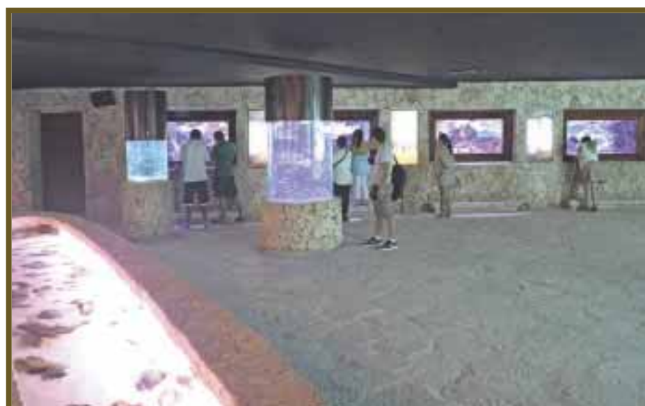
La sala de exhibición es amplia y variada.