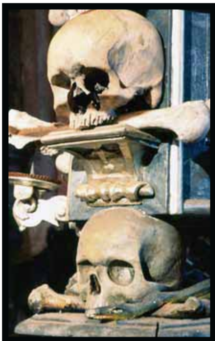
En la capilla de Todos los Santos la decoración está hecha de huesos humanos.