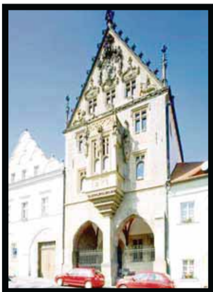
Edificio de Hrádek, museo sobre la historia de la extracción de plata.

Por esa razón se enterraron ahí no sólo la gente local también los de Bavaria, Polonia y Bélgica. En 1318 se enterraron 30 mil cadáveres de las víctimas de la epidemia de la peste. En el siglo XV, el cementerio consiguió su superficie más grande, de 3.5 hectáreas. Luego se fue haciendo más pequeño y los huesos que sobran se ponían al principio alrededor de la capilla y después en su sótano.