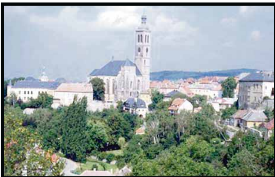
Vista de Kutná Hora, la 'Ciudad de Plata'.

En 1511, un monje semiciego los ordenó por primera vez haciendo de