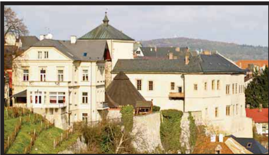
La ciudad es Patrimonio Mundial de la Humanidad.