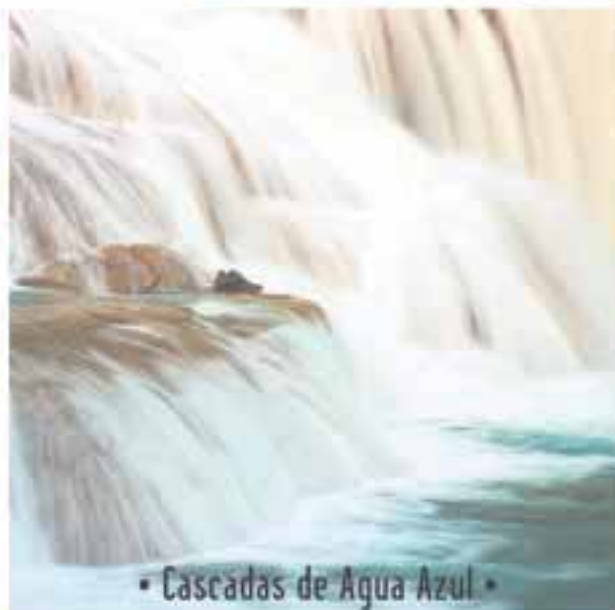
• Cascadas de Agua Azul •