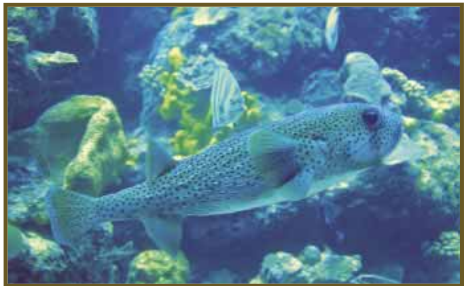
Las especies muestran su variedad en colores y texturas.