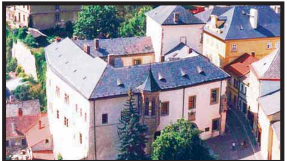
Una pequeña gran ciudad.