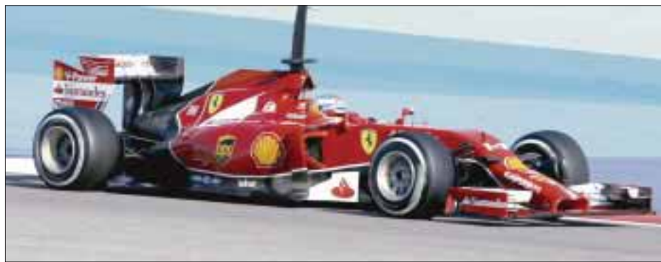
Fernando Alonso, el piloto español de Ferrari, prometió que en el Gran Premio de China se desquitará de las "flechas plateadas".