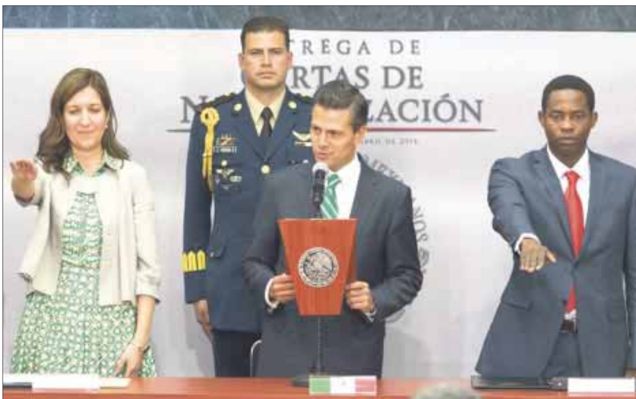
El presidente Enrique Peña Nieto hizo un reconocimiento a los nuevos mexicanos que recibieron su carta de naturalización.

El Ejecutivo federal reconoció “a quienes han decidido hacer de México su casa” y les pidió trabajar en colectivo para con responsabilidad “modelar el país