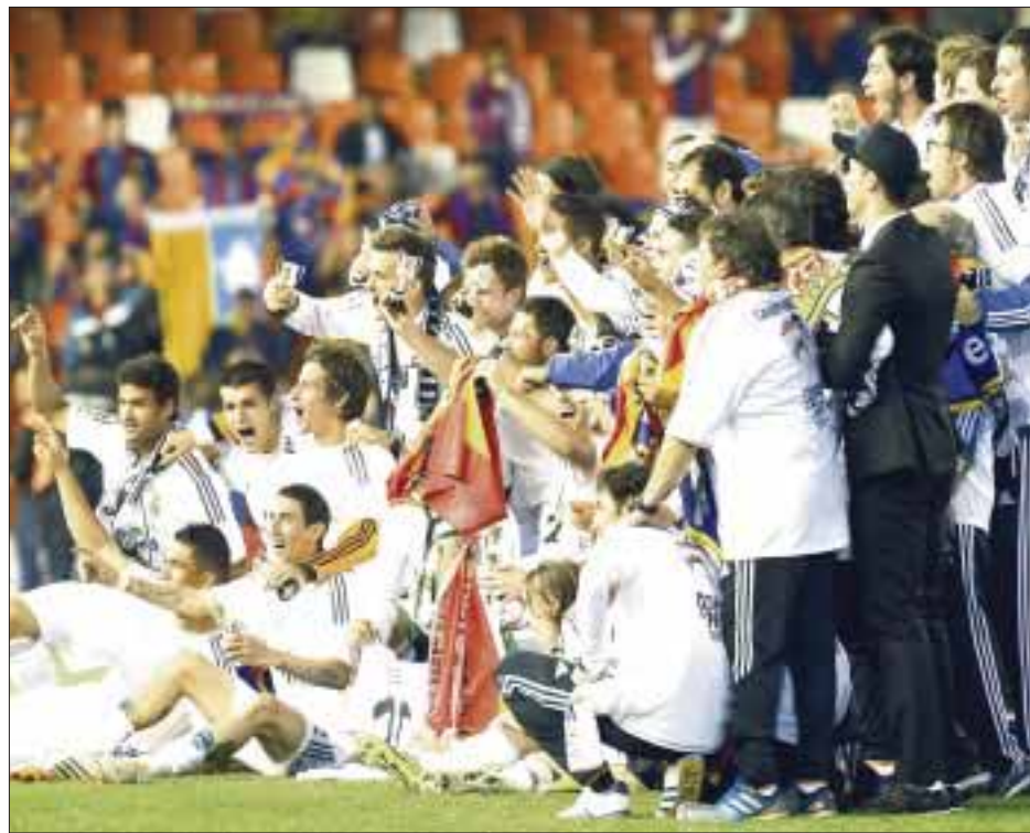
Valencia, España.- Con un marcador de 2-1, el Real Madrid derrotó al Barcelona y se coronó en el torneo de la Copa del Rey.

Los azulgrana que buscaban una victoria que les diera un poco de aire tras su eliminación en la Champions League y su derrota en Granada (1-0), que le hizo caer a la tercera posición liguera y comprometió seriamente sus posibilidades en el campeonato español, tardaron en entrar en el encuentro.