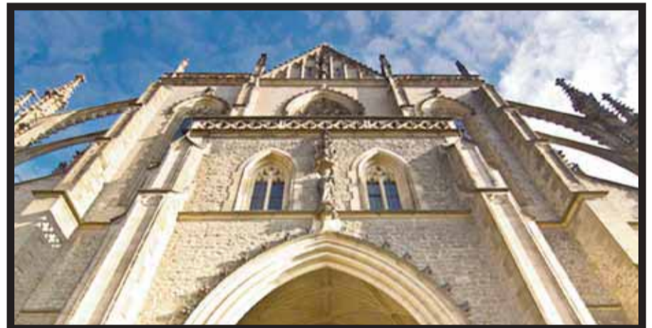
Catedral de Santa Bárbara.

También en el Centro Histórico destaca la Catedral de la Asunción de la Virgen María que hoy está restaurada.