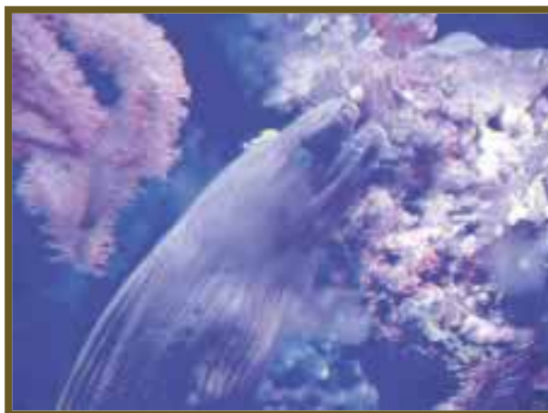
La morena protege al camarón de sus depredadores.