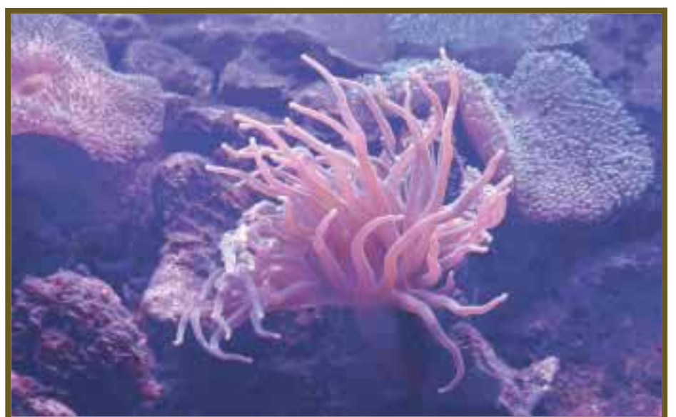
Corales, poseedores de gran belleza bajo el mar.