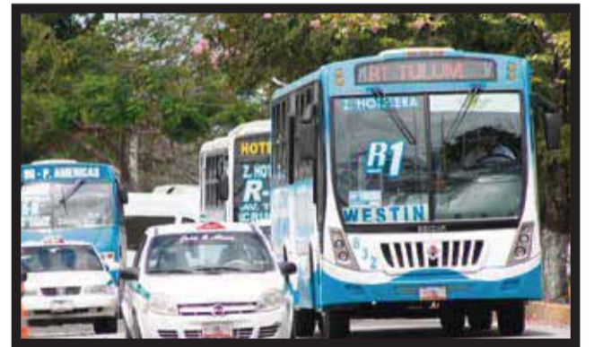
PETICIÓN DESECHADA, respiro para usuarios.

de Benito Juárez, por no cumplir con los requisitos que señala la ley municipal de transporte público. La Comisión Mixta Tarifaria del ayuntamiento después de sostener una reunión para analizar... >6