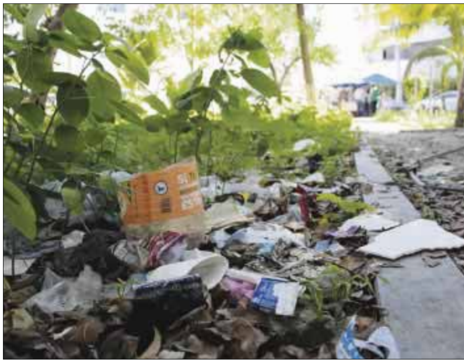
El parque es usado como baño , área de fumadores y hasta de cantina al aire libre y corralón de Protección Civil.

Los choferes de las camionetas foráneas lo utilizan como sanitario al aire libre, sin que la autoridad haga algo; lo usan de corralón