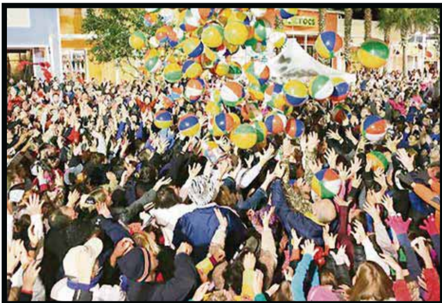
Cientos de pelotas para la celebración.