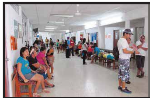
LA ATENCIÓN MÉDICA será de 24 horas.

obligatorio, las unidades de salud, brindará servicio tanto en el turno matutino y vespertino y sólo saldrá de vacaciones el personal que ya lo tenía programado. La población en caso de emergencia podrá acudir al área de... >6