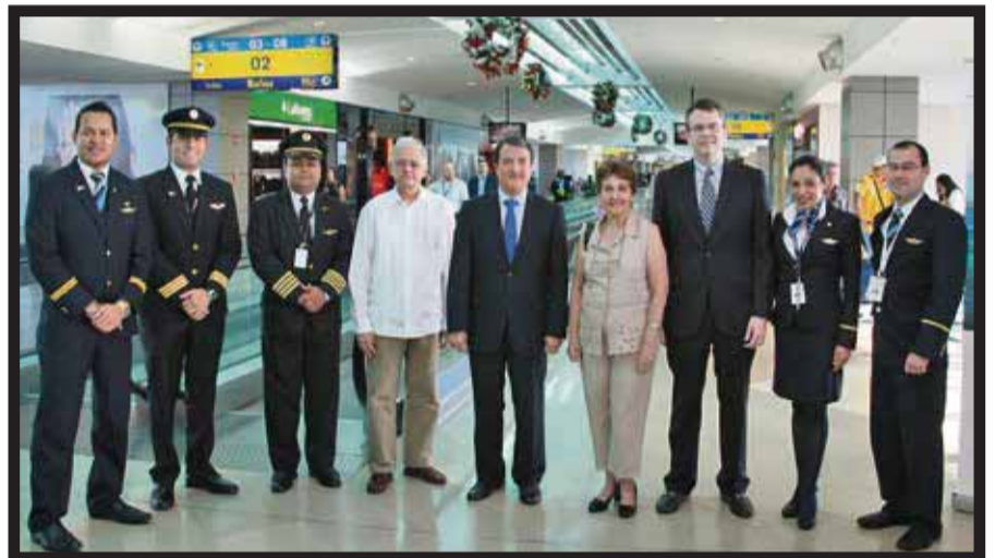
En la inauguración del vuelo de Panamá a Santa Clara.

☆☆☆☆☆ Más de 10 mil pelotas de playa serán soltadas al aire para recibir el Año Nuevo en el marco de la séptima celebración anual Beach Ball Drop en el centro comercial Pier Park en Panamá City Beach , Florida, el 31 de diciembre. Pier Park , el principal destino de compras al aire libre y frente al mar de Pana-