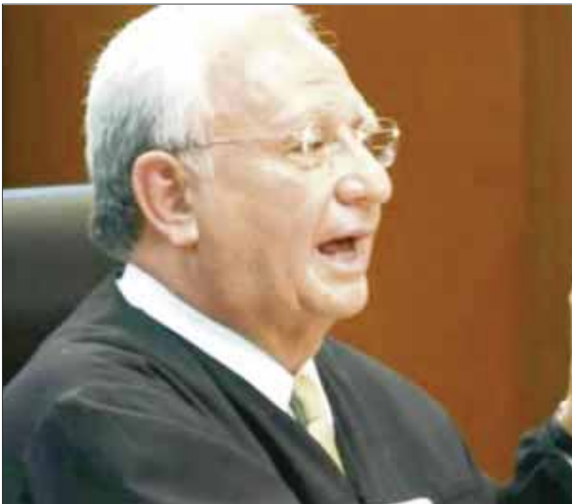
El ministro presidente de la Suprema Corte de Justicia de la Nación, Juan Silva Meza, considera obligatorio conjurar la tortura.

Desde hace 20 años se habla del problema, dice Silva Meza