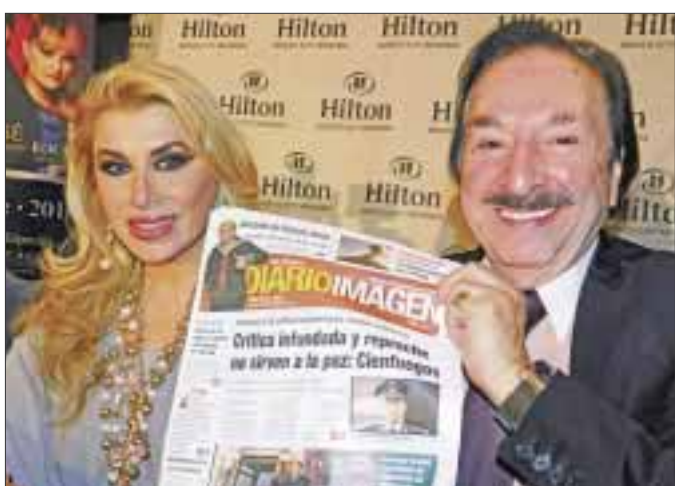
Dulce y Arturo Castro dieron detalles de este gran cierre de año a DIARIOIMAGEN.

Por su parte, Rocío Banquells manifestó que "me da mucho gusto estar con ellos en el escenario, son artistas que han dado éxito tras éxito durante tantas décadas, para mí es la primera vez que comparto el escenario con el maestro Arturo Castro, gran compositor, gran músico, y cantar con su Big Band será increíble; cantar con Dulce, con quien he estado en el evento de 'Grandiosas', estoy muy emocionada de poder estar en el escenario