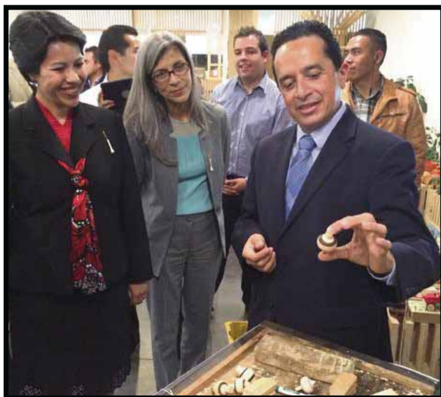
En la apertura de la expo "Yo Soy Mexiquense".

☆☆☆☆☆ Con más de mil 500 piezas artesanales de los municipios de