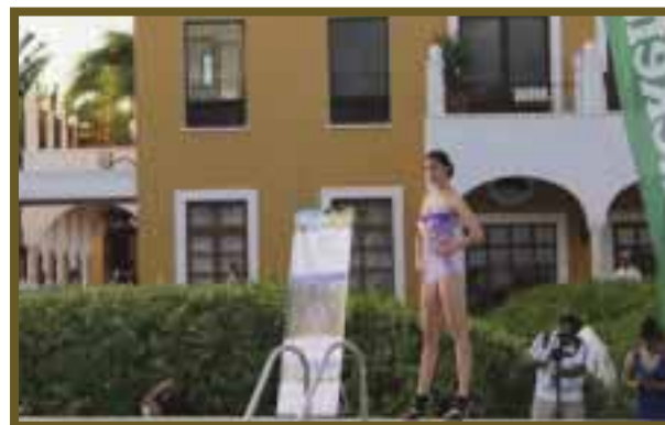
Pasarela en traje de baño.