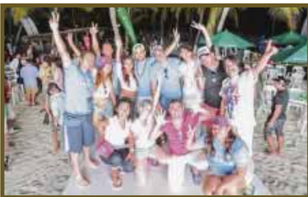
Equipo que organizó el evento.