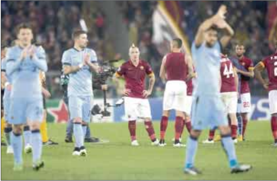
Roma, Italia.- Los jugadores del Manchester City festejan su triunfo ante el AS Roma.

Roma, Italia.- Manchester City y Schalke consiguieron ayer triunfos a domicilio y se quedaron con los dos últimos boletos a los octavos de final de la Liga de Campeones.