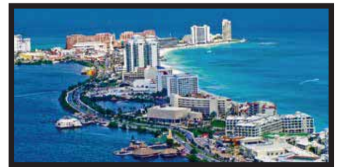
EL BALNEARIO SE CONFIRMA como principal generador de divisas de paseantes en el país.

formidable la actividad desarrollada durante este año en el destino del norte del estado. Indicó que los índices de este año fueron superiores a los... >5