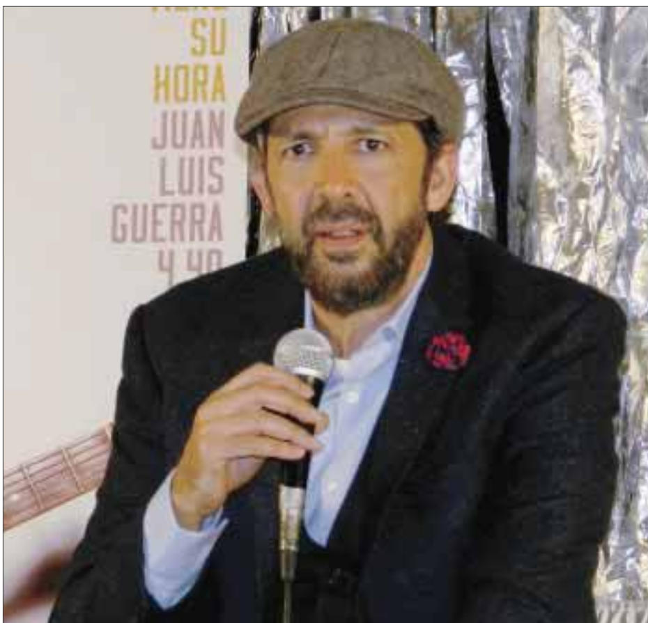
El "Rey de la Bachata", Juan Luis Guerra, presenta nuevo disco en el que abarca varios géneros musicales, como la bachata, el merengue, la salsa y el son. Todas las canciones son de su inspiración.

El intérprete adelantó que le gustaría presentarse el año entrante en concierto para poder cantar sus temas nuevos, así como sus éxitos más conocidos, de aquellos inicios con los álbumes "Mudanza y acarreo" y "Mientras más lo pienso...tú".