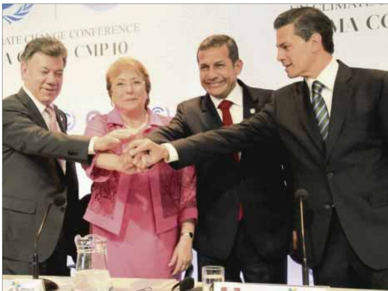
Lima, Perú.- Los presidentes de la Alianza del Pacífico suscribieron una declaración de apoyo a los esfuerzos de las Naciones Unidas para enfrentar los retos que impone el cambio climático.

El Presidente de la República sostuvo que con estas y otras acciones, México