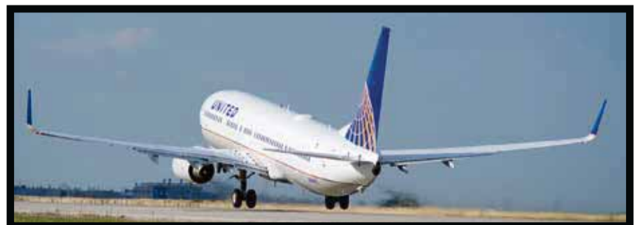
Ya inició el vuelo entre Houston y Santiago, Chile.