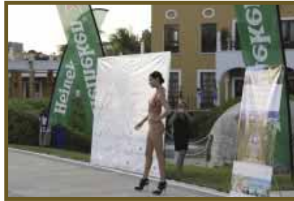
La belleza de las modelos resaltó con los diseños.