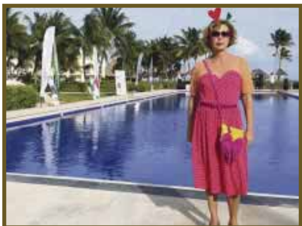
Ágatha Ruiz de la Prada.