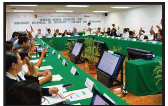
TERCERA SESIÓN ORDINARIA 2014 del Subcomité de Educación y Cultura.

docentes abordaron temas estratégicos del avance educativo como es el caso de la construcción y rehabilitación de infraestructura educativa, acciones en materia cultural. Por su parte, la responsable del área de Educación... >5