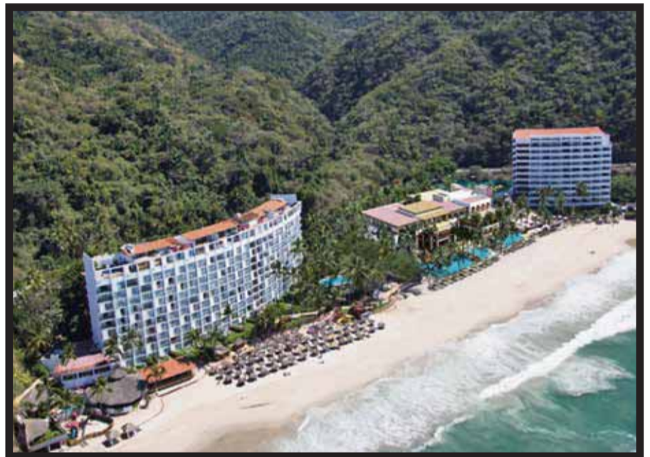
Vista del hotel en Puerto Vallarta.

lujos como malvaviscos asados, entretenimiento y actividades de primera y, para aquellos momentos de paz, nuestros servicios de mayordomo disponibles en la piscina exclusiva para adultos, quienes servirán exquisitos cocteles y congeladas de frutas”, agregó. La propiedad está discretamente ubicada en un paraíso tropical de la romántica playa Las Estacas en Puerto Vallarta, en la Zona Dorada. En la costa sur de la Bahía de Banderas, el complejo está frente al mar y cuenta con 380 metros de playa propia en el brillante océano Pacífico. Esta idílica localidad está siendo rediseñada y se creará nuevamente para superar las expectativas del viajero de hoy. Un nuevo lobby arquitectónicamente inspirado y un área de recibimiento será el punto focal del hotel, dando la bienvenida a los huéspedes con una panorámica vista del océano y de sus recién renovadas piscinas sin límites. La propiedad incluirá 336 espaciosas suites, con atractivas suites signatura con alberca, todas con un estilo para garantizar confort con mobiliario ingeniosamente colocados para captar las vistas del océano, al igual que baños al estilo spa con lujosas superficies de piedra, duchas y cómodos lavabos dobles. La experiencia culinaria será elevada a una delicia, con una selección de restaurantes internacionales a la carta y suntuosos restaurantes con servicio de buffet. Ideal para huéspedes