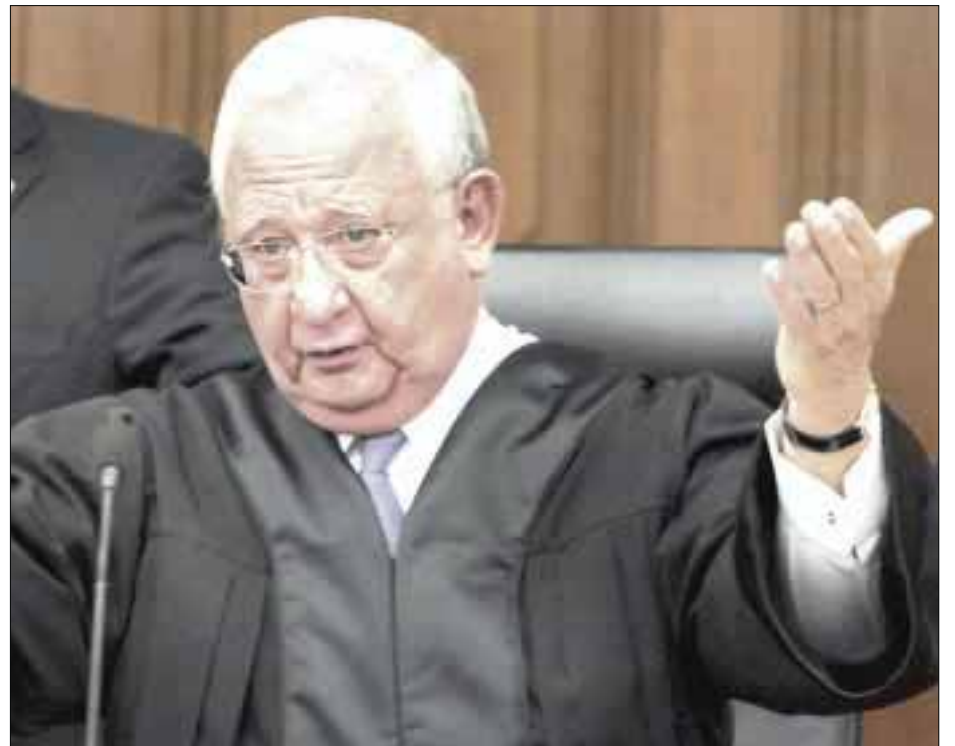
El presidente de la Suprema Corte de Justicia de la Nación, Juan Silva Meza, rindió su cuarto informe de labores, teniendo como invitado al presidente Enrique Peña Nieto.

Ante hechos dolorosos y lamentables, la sociedad ha expresado su inconformidad con la situación que prevalece, en materia de justicia, en el país. Ante estos acontecimientos, el Poder Judicial de la Federación, no permanecerá al margen"