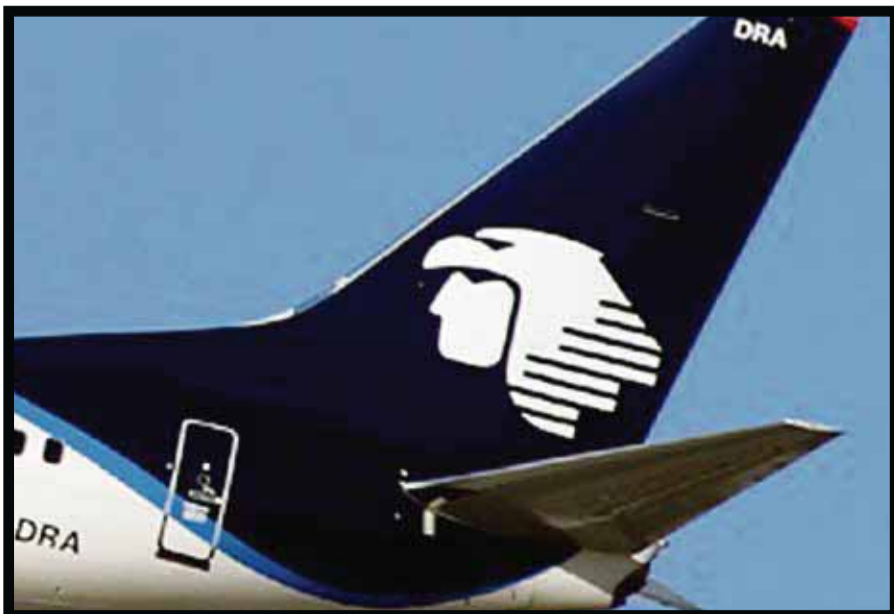
Desde el DF a Toronto.

☆☆☆☆☆ Durante la temporada de fiestas, Fashion Valley ofrecerá varios servicios adicionales para sus clientes, tales como personal shoppers gratuitos y un servicio especial de almace-