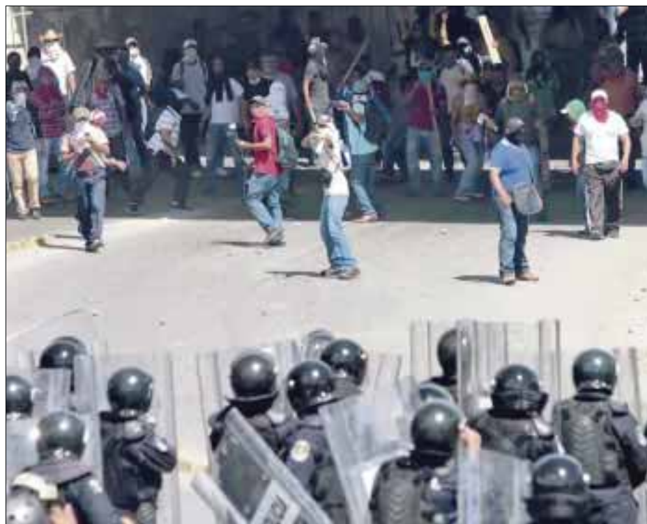
Este es un panorama de cómo los encapuchados agreden con piedras a los elementos de la Policía Federal, en Chilpancingo; al parecer no hubo detenciones.

Las versiones señalan que un grupo de federales en estado de ebriedad, golpeó a dos normalistas. Luego de ello, otros estudiantes llegaron al lugar para respaldar a sus compañeros y detuvieron a algunos agentes federales