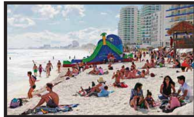
SE REAFIRMARÁ LIDERAZGO como centro vacacional de México y Latinoamérica.

de hoteles de Cancún y la Riviera Maya, en este cierre de año la ocupación será de al menos 95 por ciento, con lleno total en las festividades de Navidad y Año Nuevo, principalmente con... >2