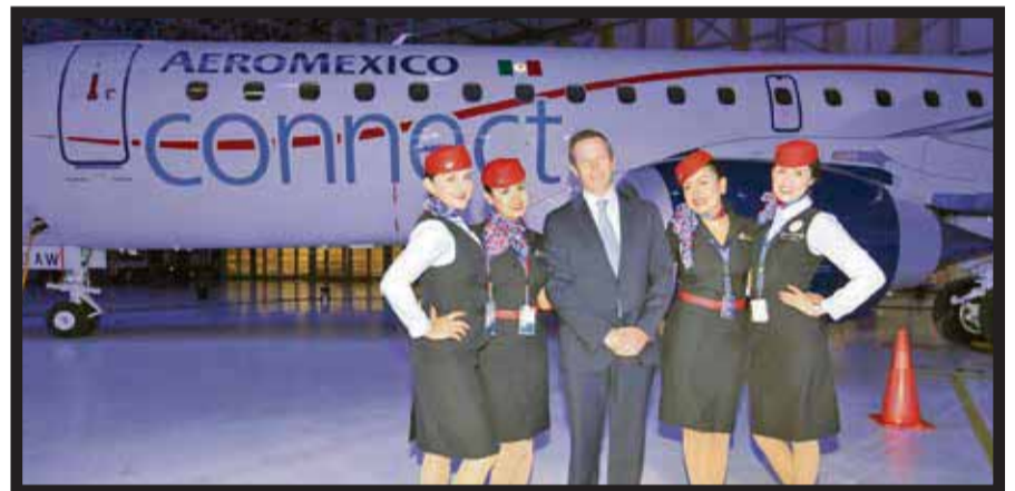
En la entrega del avión mil 100.

☆☆☆☆☆ La Secretaría de Turismo del gobierno de la República dio a conocer la convocatoria #AmoMéxico, dirigido a los usuarios de Twitter , con el propósito de mostrar los múltiples atractivos del país por medio de experiencias memorables. Los interesados podrán participar subiendo, en hasta seis tuits breves historias de viaje, que deberán evocar alguna experiencia de amor, éxito, diversión o gourmet, que hayan vivido en algunas vacaciones por el territorio nacional y que resalten la belleza, tradición, sabores, calidez y hospitalidad de los mexicanos. Los protagonistas de las historias más originales podrán viajar con un acompañante y con los gastos pagados a Los Cabos, Acapulco o Cancún. Podrán participar desde hoy lunes 15 al 26 de diciembre, personas mayores de 21 años y que sean usuarios de Twitter . El criterio de selección está relacionado con la narración de un hecho atractivo, memorable y poco usual, que evaluará el jurado integrado por representantes de la Sectur y del Consejo de la Promoción Turística de México (CPTM). Las historias tendrán la opción de ser subidas con una fotografía original que identifique el lugar mencionado. Los participantes deberán ser seguidores de la cuenta oficial de la Secretaría de Turismo @SECTUR_mx. La extensión será hasta de seis tuits y al momento de subirlos deberán estar identificados con la etiqueta #AmoMéxico. La Sectur escogerá las tres historias más atractivas y los seleccionados se darán a conocer el 9 de enero