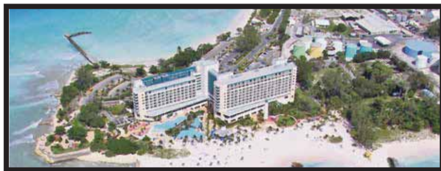
El hotel en Barbados.