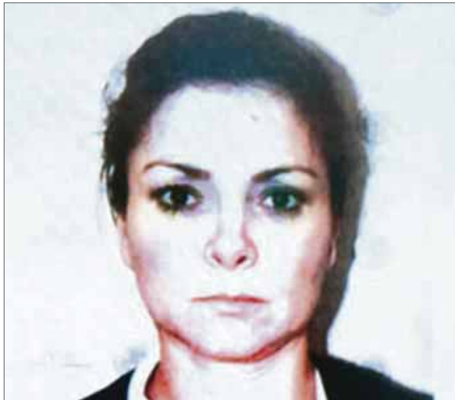
María de los Ángeles Pineda Villa seguirá arraigada en la colonia Doctores, en razón de que la averiguación previa no ha sido concluida, lo que no implica su inocencia.

El funcionario indicó que los normalistas no deberían acercarse a un baile con el que se festejaba el segundo informe de Pineda Villa, al frente del DIF-Municipal.