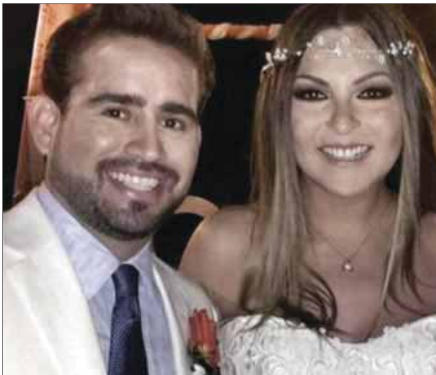
Mariana compartió a través de las redes sociales una serie de fotografías del emotivo enlace.