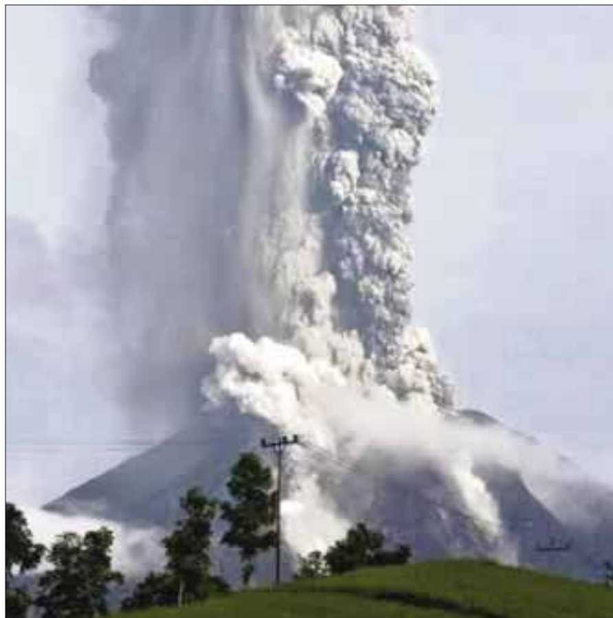
El Volcán de Colima registró una fuerte explosión el pasado 21 de noviembre.

Asimismo, el Servicio Médico Forense también acudió al municipio de Xochitepec, localizado al sur de la entidad, para levantar el cuerpo putrefacto de un hombre encontrado en el interior de un domicilio.