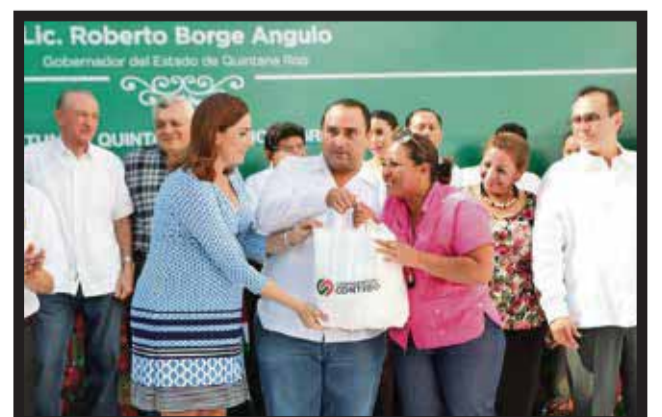
CONVIVENCIA DECEMBRINA con trabajadores.

que cada año perciben los trabajadores al servicio del gobierno del estado. En total, erogamos, entre aguinaldos, prima vacacional, canasta navideña, vales de despensa a trabajadores de base, bono navideño... >2