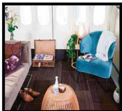
Avión convertido en departamento.