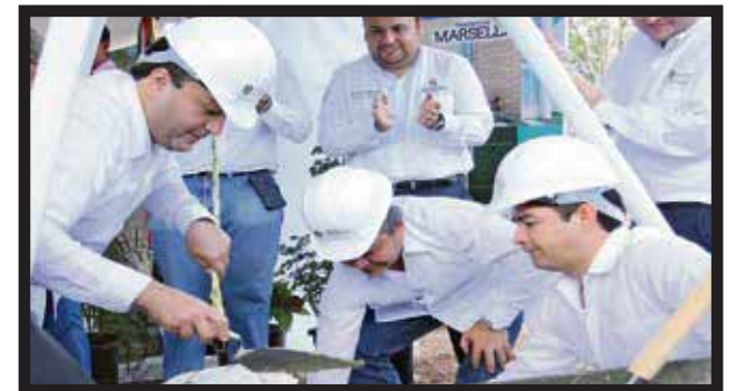
EL NUEVO DESARROLLO costará 700 millones de pesos.