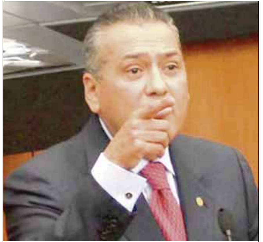
Manlio Fabio Beltrones , coordinador de los diputados del PRI en San Lázaro, festeja la conformación de la bancada del partido Morena en la actual legislatura.