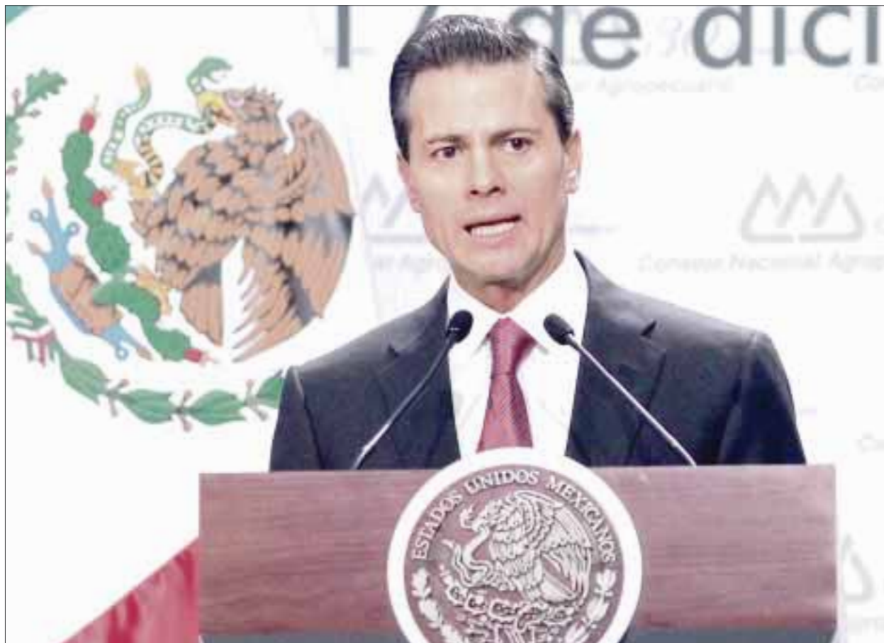
El presidente Enrique Peña Nieto, durante su participación en la clausura de la Asamblea General Ordinaria y 30 Aniversario del Consejo Nacional Agropecuario.