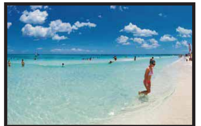
DE ENTRADA la competencia sería con Varadero.

representará una competencia franca para los destinos del Caribe mexicano, agregó. Consideró que habrá que ponerse al mismo nivel y seguir mejorando para estar a la vanguardia en el Caribe como líderes de turismo... >7 y 19