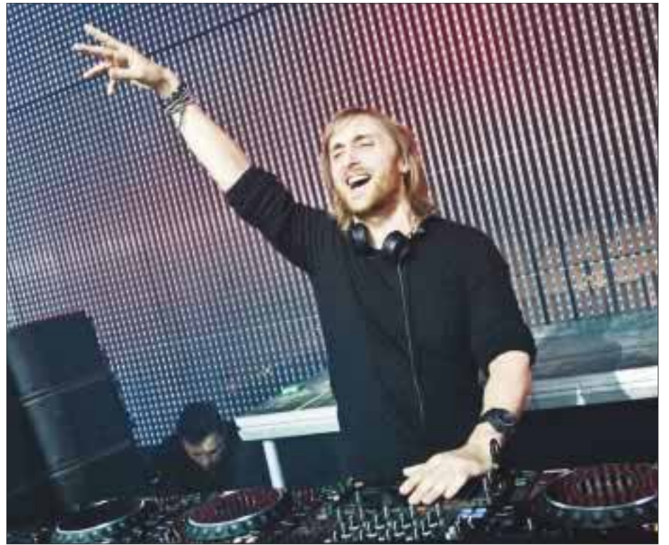
El nombre de David Guetta es sinónimo de leyenda para las tornamesas e incluso se le acusa de haber fulminado al rock de las listas de ventas.

poco después las sesiones compartidas Unity en el Rex-Club y no dudó en ficharlo para liderar el grupo de 8 DJ confirmados, entre ellos el reputado Didier Sinclair. A principios de 1990 Kien y Guetta se asociaron para tomar la dirección artística del nuevo club Folies Pigalle, un antiguo cabaret en el degradado barrio de Pigalle, al que imprimieron su propio sello. Sus sesiones house eran cada vez más aplaudidas y multitudinarias y, casi sin quererlo, se convirtieron en pioneros de la transformación de aquella parte del distrito 18 en la zona de la movida parisense. Más tarde, ya asociado con Cathy Guetta, una senegalesa con la que David contrajo matrimonio en 1992, llegarían otros locales (el