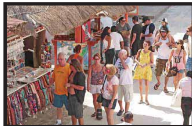
RECONOCIMIENTO DE LA PRESTIGIADA revista Travel Weekly . >3