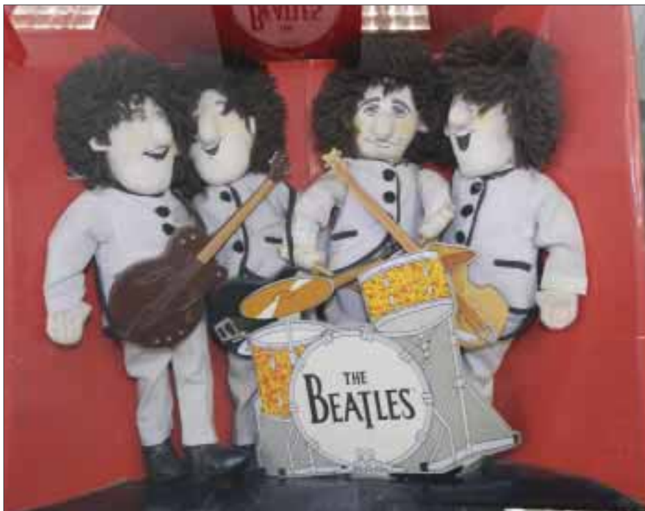
El festival incluyó una exposición y una galería, así como memorabilia de los cuatro grandes.

Entre los grupos que tocaron podemos mencionar a La Caverna, In Vitro, Beat Beatles, Nowhere Boys, Silver Hammer, Liverpool Guys Band, Get Back, 4 Melenas, Beatowls, Sí Bemol, Be Here Now, Onion, Kuikuiris, Across The Universe, Fad Four, Sea of Time, Bad Boy, Strawberry Band, Revolver, Sgt. Pepper Band, Beagles, Proyecto Macca, Bulldog, Alebrije, Rubber Soul, Sheep Dogs, Wigs, entre otros. Como músicos invitados, encargados de cerrar el Gran Festival Beatle, estuvieron los grupos London Town, Morsa, y desde Inglaterra, Ringer, personificador de Ringo Starr, quien ofreció este año un concierto exclusivo en la Torre Mayor.