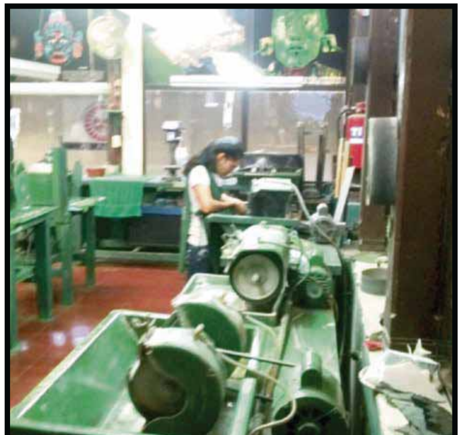
Fábrica de jade.