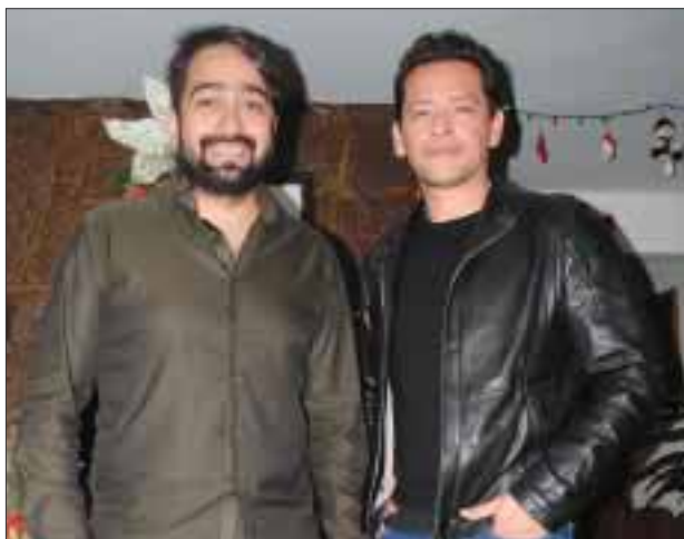
Los músicos rinden tributo a Pink Floyd, Depeche Mode, Soda Stereo, entre otros.