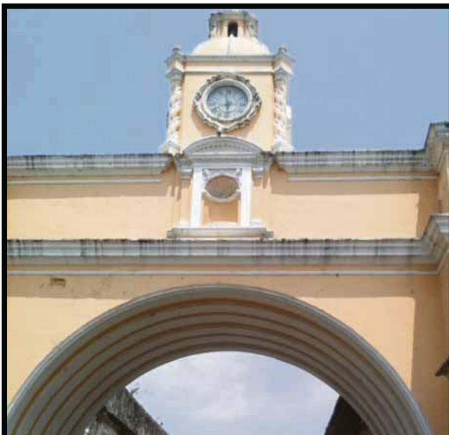
El famoso arco.

de la esplendorosa arquitectura colonial y con ellos basta para darnos una idea de la grandeza de la ciudad que recorrimos paso a paso y si nos cautivó la primera vez, hoy con nuevos lugares, hoteles y