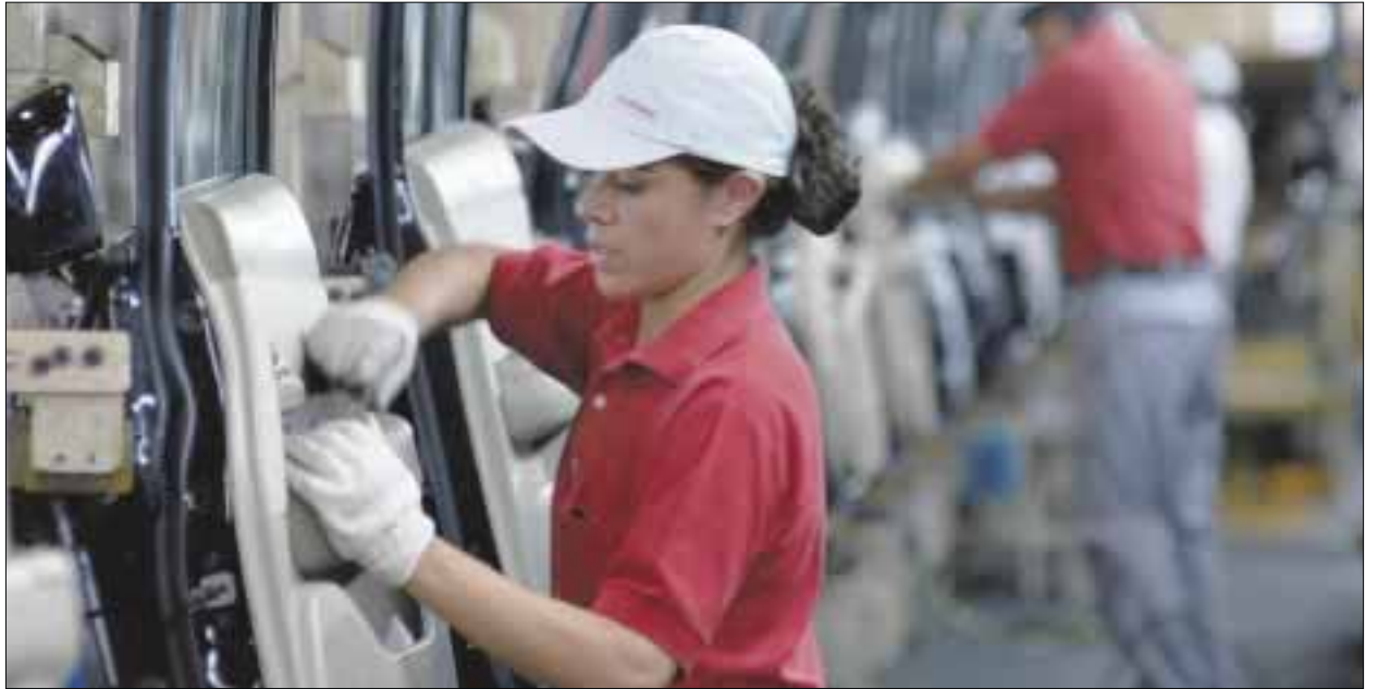
La empresa General Motors anunció inversiones por 5 mil millones de dólares en los cuatro complejos industriales que opera en territorio nacional.

Estas cifras demuestran que está en marcha la consolidación de la industria automotriz y de autopartes como pilares del desarrollo económico de México, agregó.