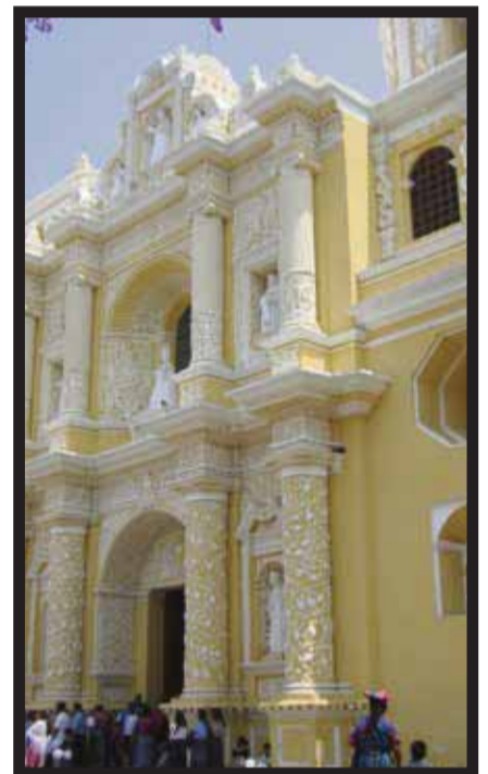
Una de las iglesias tradicionales.

Antigua Guatemala hoy, conserva un gran número de edificios coloniales restaurados, que constituyen una fracción