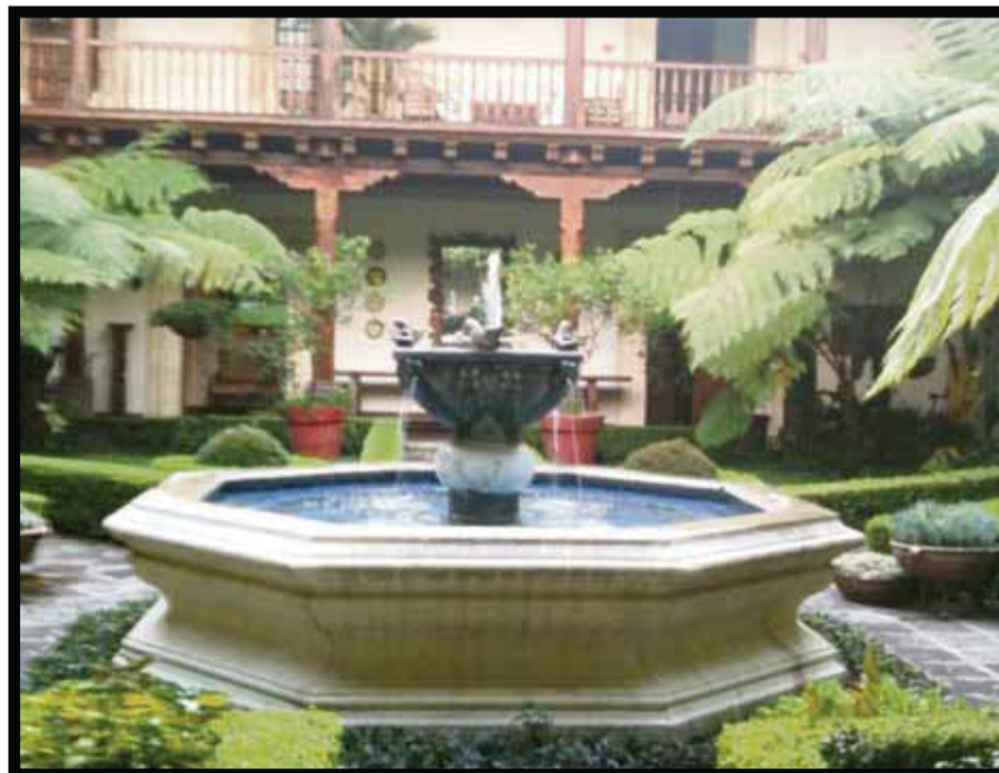
El patio central en el hotel Posada de Don Rodrigo.