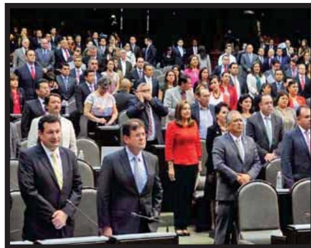
PALACIO LEGISLATIVO abordó un tema sensible para la población.