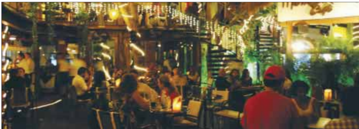
El ambiente en Maracame.