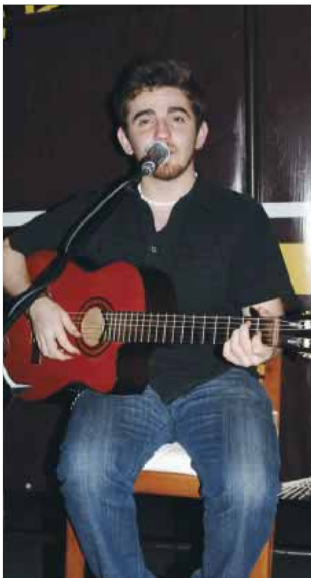
El cantante Alejandro Sevilla.