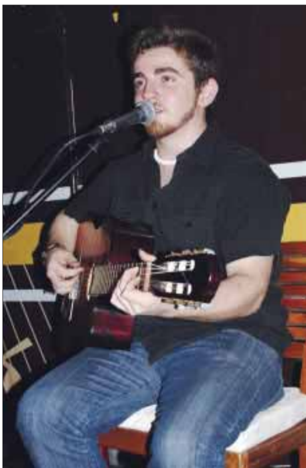
Ex participante de varios realities shows.