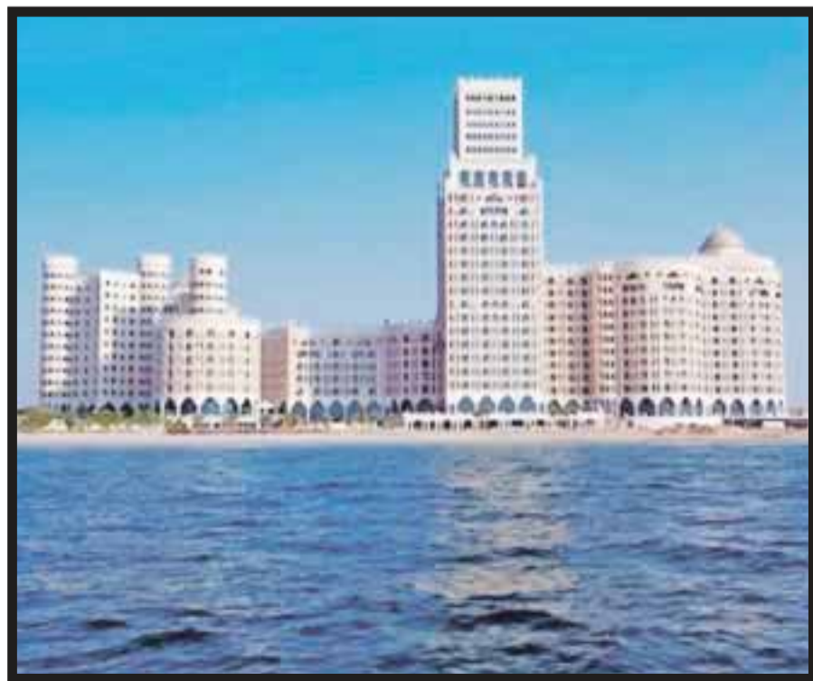
El Hilton Al Hamra Beach & Golf Resort