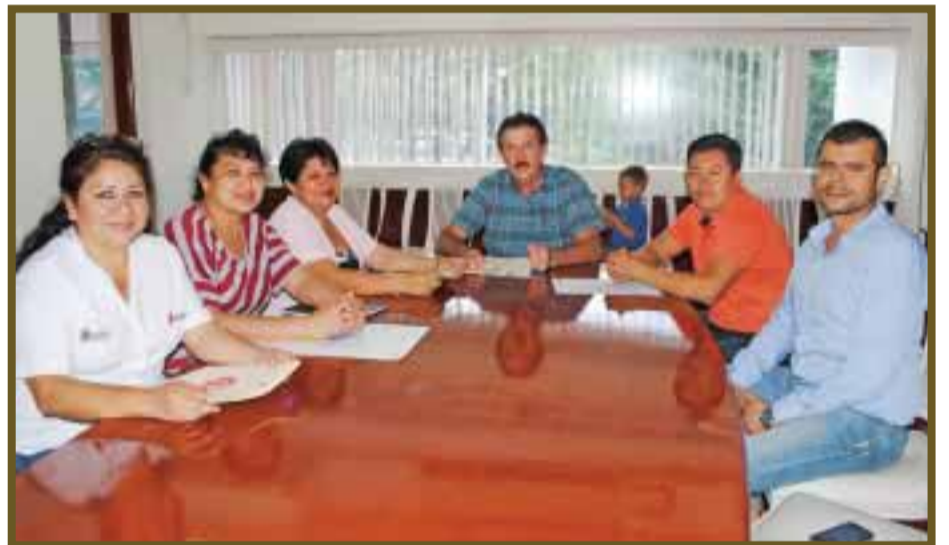
Posando para DIARIO IMAGEN.