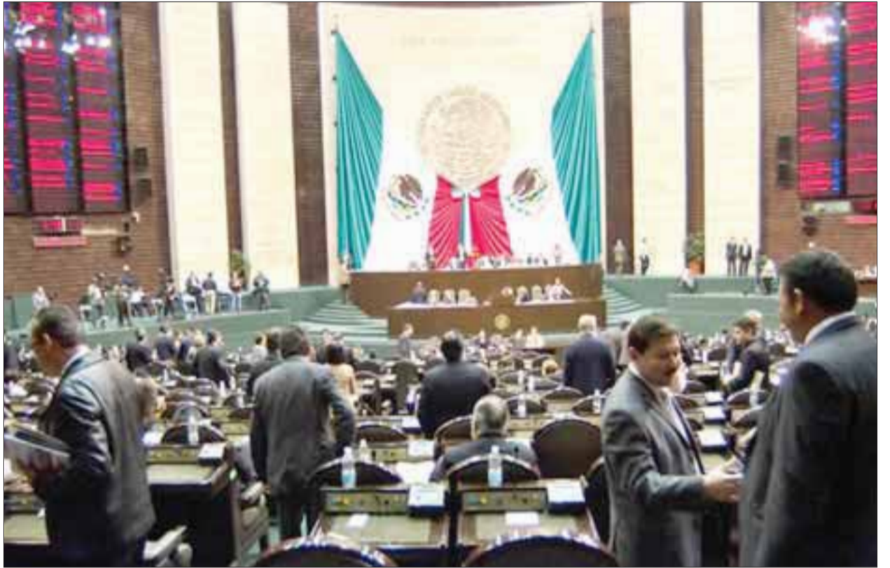
La Cámara de Diputados aprobó ayer la Ley General para Prevenir y Sancionar los Delitos en Materia de Secuestro.

También se indica que las consecuencias sobre las víctimas de un secuestro son colectivas, ya que no sólo conlleva a la privación de la libertad de una persona, sino una serie de daños físicos, psicológicos, económi-