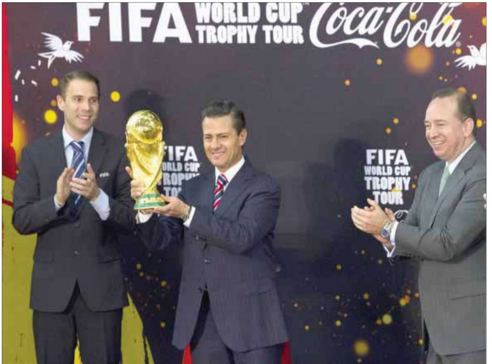
El presidente Enrique Peña Nieto sostiene en sus manos la Copa del Mundo que será disputada en Brasil 2014. La FIFA con este trofeo realiza un recorrido por 89 países.