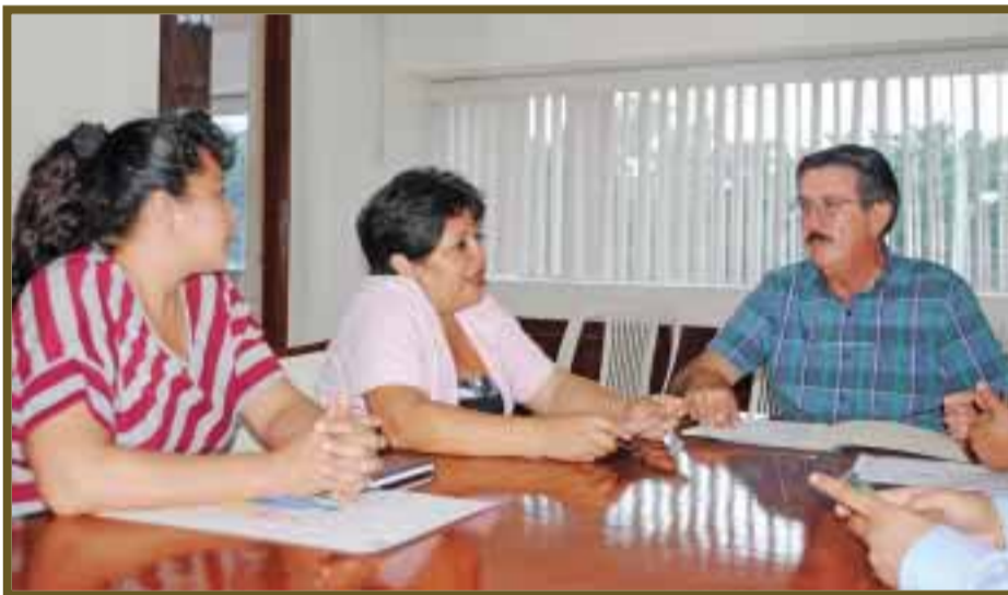
Durante la firma del acuerdo.