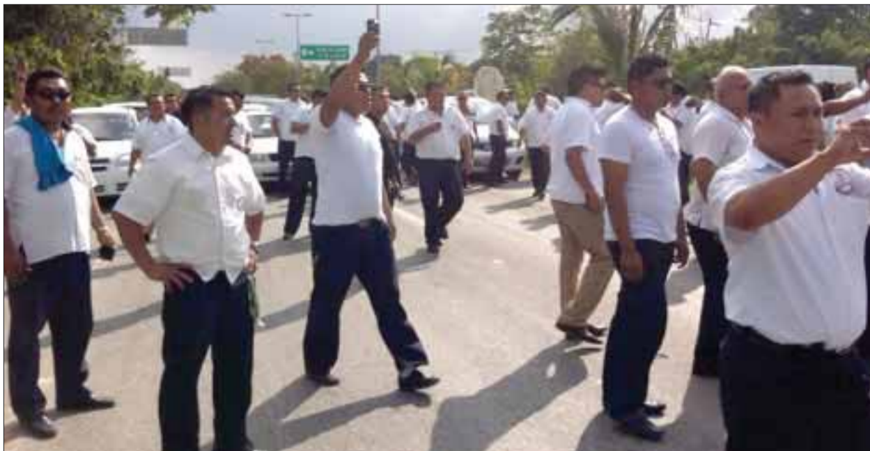
Los taxistas de Tulum no pudieron pasar a Cancún, porque la policía les cerró el paso a la altura del aeropuerto internacional.