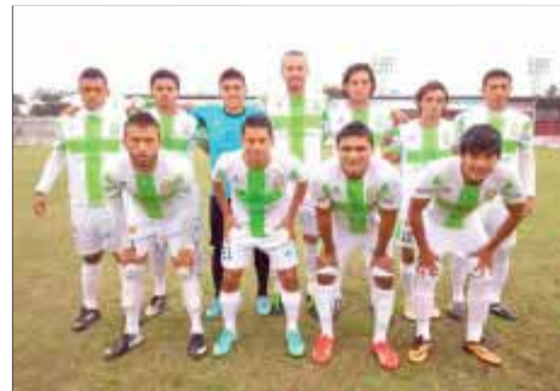
Vapuleados en patio ajeno, Inter Playa buscará en los de Neza, no quien se la hizo sino quien se la pague para recuperar los 3 puntos.