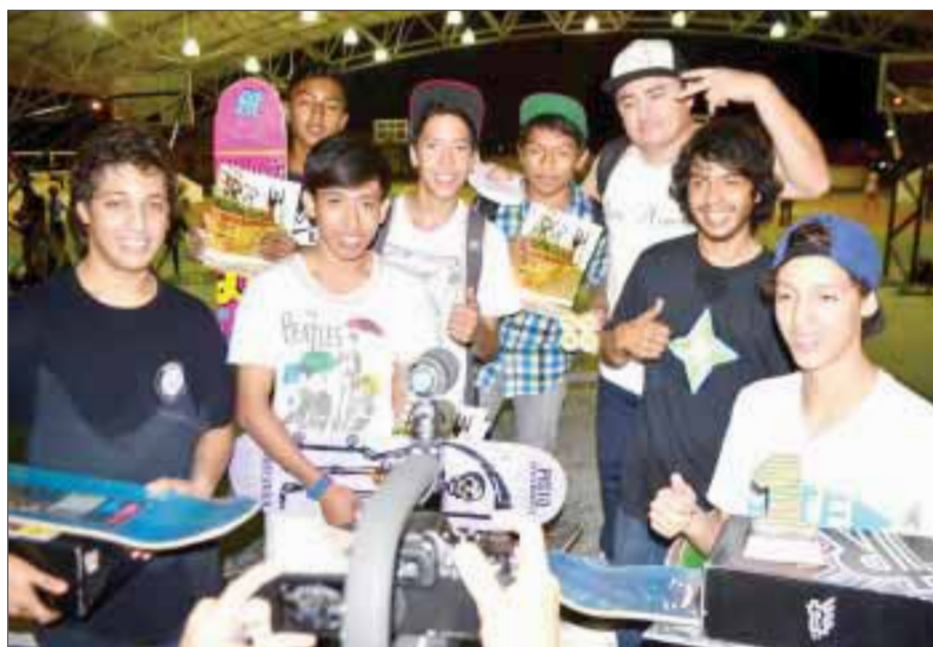
La siguiente competencia denominada "La Fiesta de Skateboard", que se efectúa cada 4 meses, en esta ocasión será en abril, en Playa del Carmen.