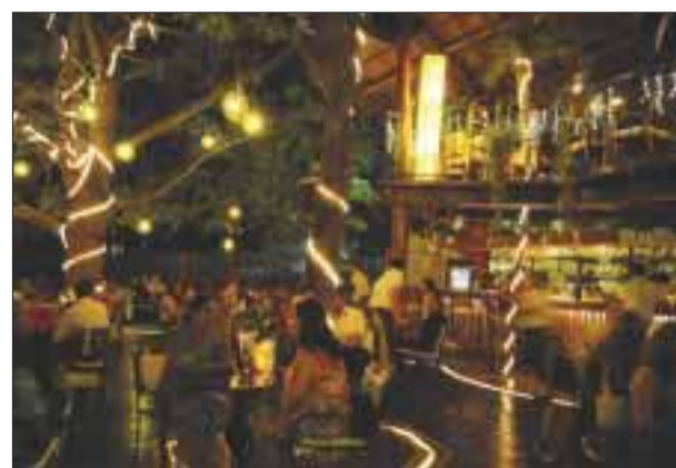
La decoración es bonita.