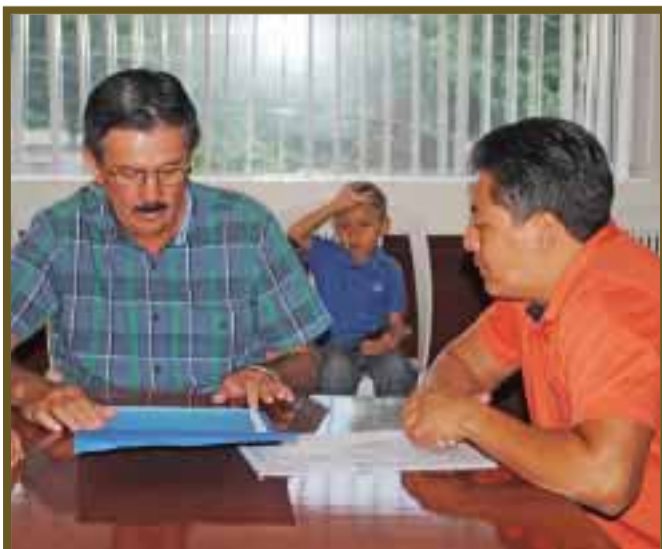
El proyecto de "Dental Confort".