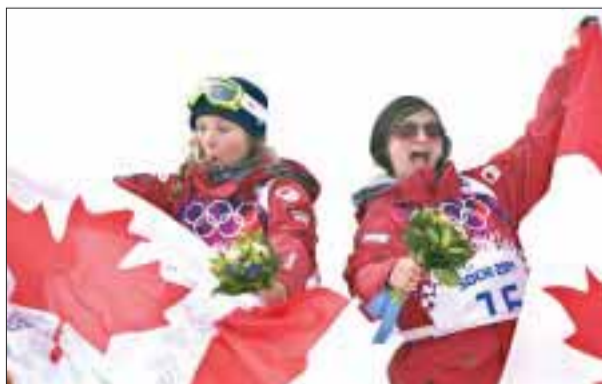
Sochi, Rusia.- Las canadienses Dara Howell, ganadora del oro, y Kim Lamarre, bronce, celebran su triunfo en los Juegos Olímpicos de Invierno Sochi 2014.