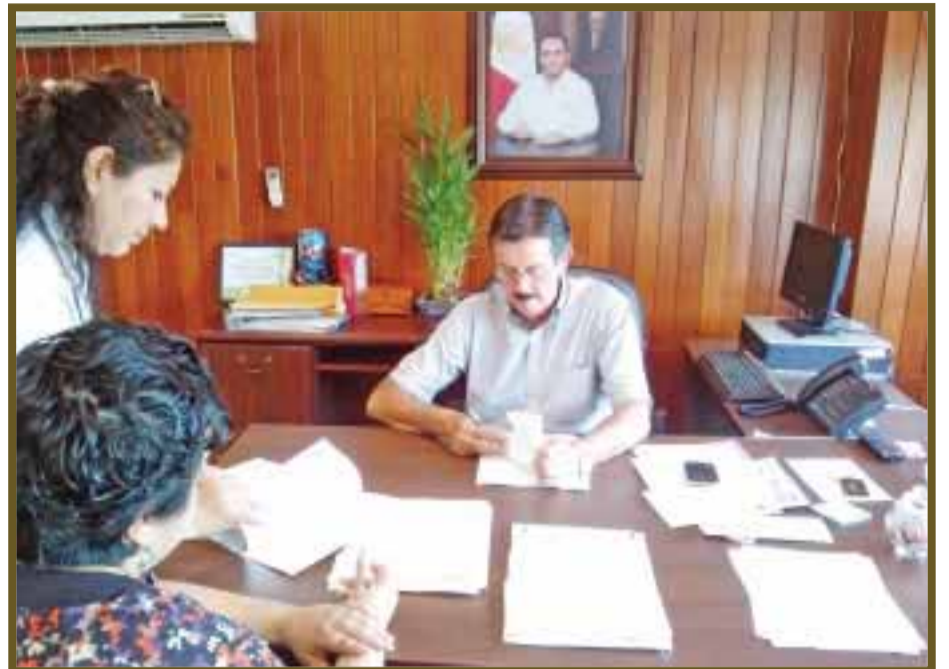
Firma del convenio.

Puede inscribir a su empresa para recibir los beneficios o asistir individualmente.