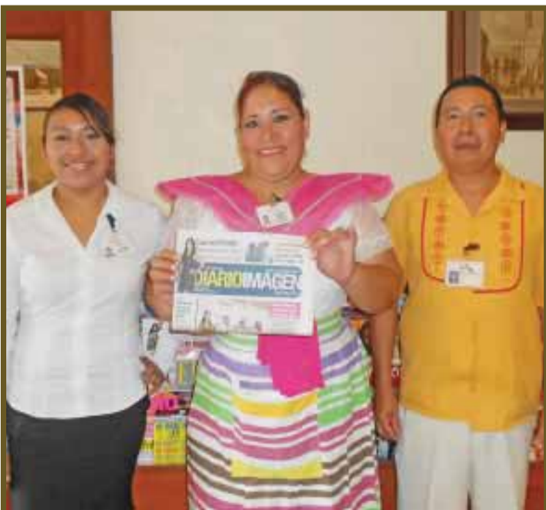
Personal posa para DIARIO IMAGEN.