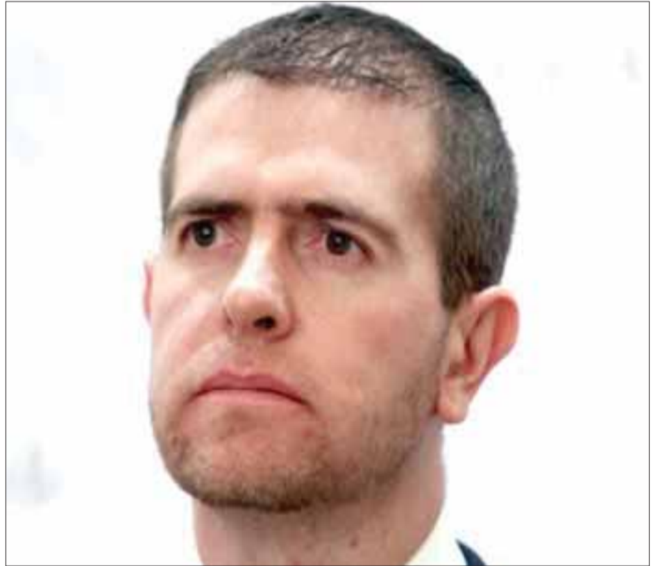
El comisionado para la Seguridad y el Desarrollo de Michoacán, Alfredo Castillo Cervantes.

El secretario del Sistema Nacional de Seguridad Pública, Monte Alejandro Rubido, reconoció que "siempre estará latente la posibilidad" de que autodefensas formen parte de la delincuencia y por eso se realizará una evaluación "casuística" de quienes se integren a policías municipales.