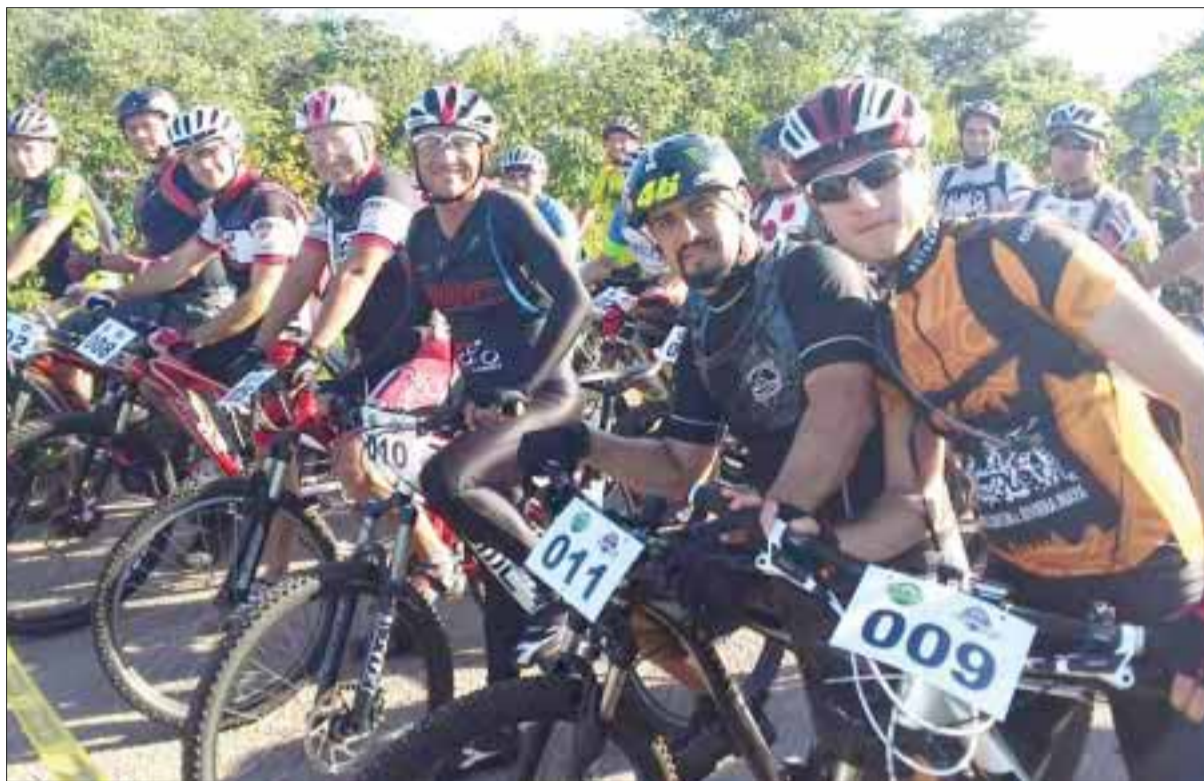
La próxima carrera será el 20 de abril en la ciudad de Chetumal, donde se espera que el número de competidores a nivel regional sea de mil 200.