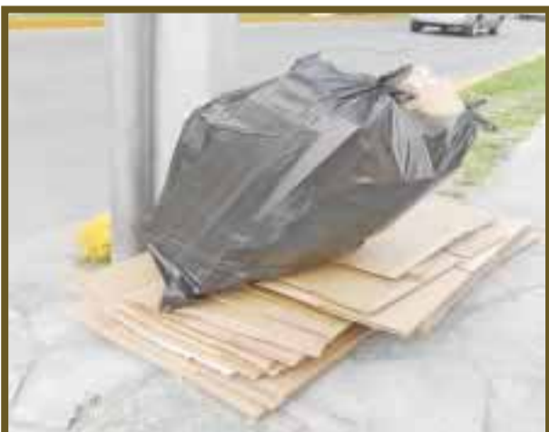
Vecinos contribuyen separando su basura.