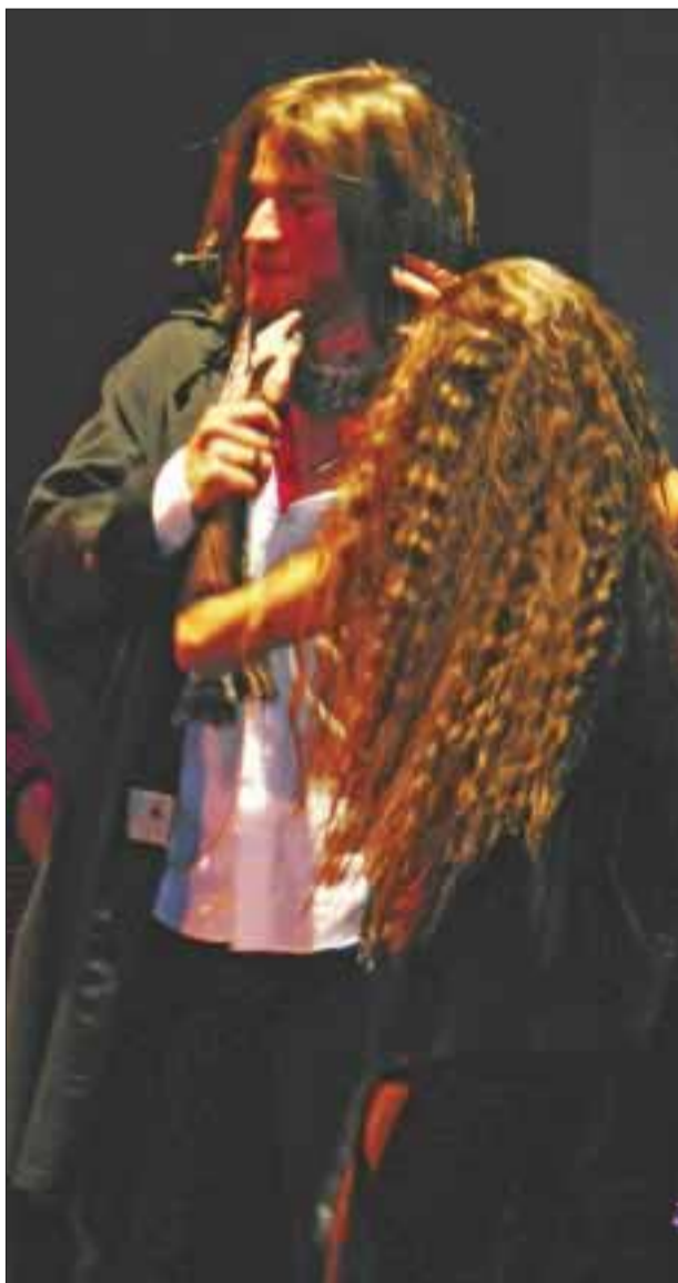
Las actuaciones hicieron vibrar al público.