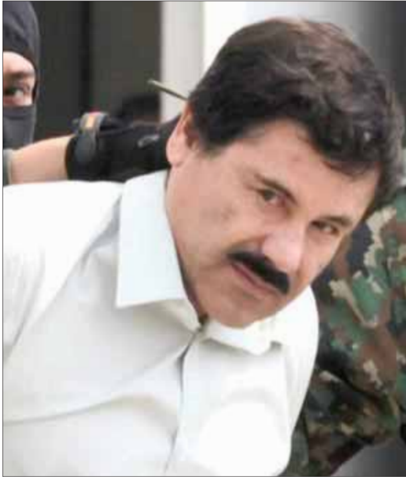
Joaquín Guzmán Loera fue informado del quinto juicio que se le sigue en su reaprehensión.

Jueces federales de otros estados pedirán a juzgadores de Edomex que le tomen declaración preparatoria