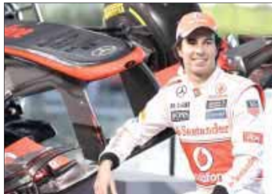
Sergio "Checo" Pérez se prepara para el inicio de la temporada en Melbourne, Australia.