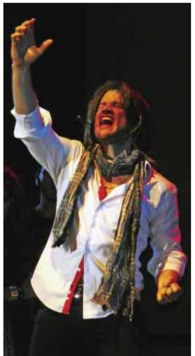
Excelentes voces del elenco.