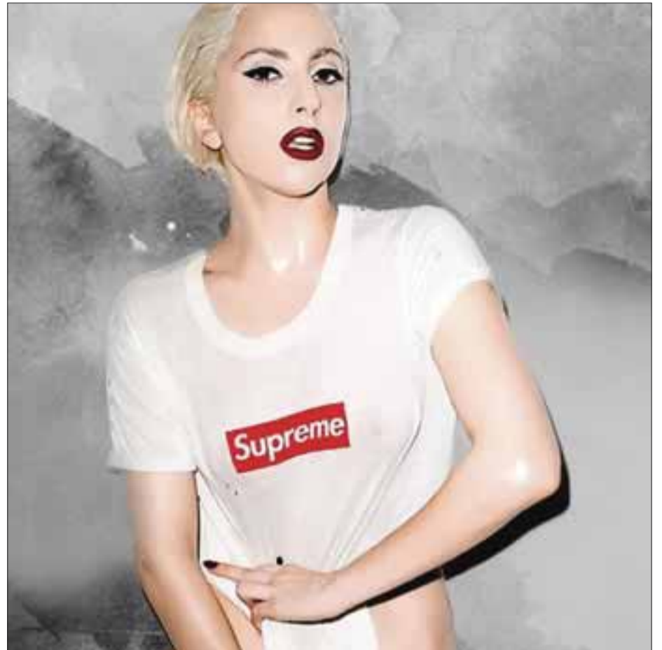
Dicen que el promotor que anuncia la supuesta gira no tiene ninguna autoridad para promocionar conciertos de Lady Gaga.

El promotor que anuncia esta información no tiene ninguna autoridad para promocionar conciertos de Lady Gaga. Los fans y medios tienen que estar conscientes de que estos conciertos están siendo anunciados bajo falsas pretensiones y no deben comprar ningún boleto para conciertos de Lady Gaga en México hasta que sean advertidos por Live Nation o por sus promotores autorizados.