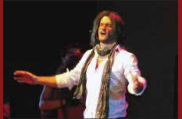
Las emociones estuvieron a flor de piel.

Una obra con calidad que llegó para conquistar