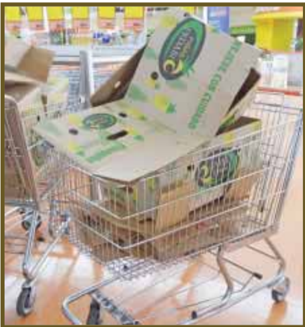
Personas realizan recolecta de cartón en supermercados.