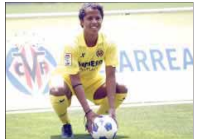
Giovani dos Santos podría jugar en el fútbol italiano en la próxima temporada.

El rotativo "Calciomercato" informó que el cuadro lombardo desea un elemento de variadas características en el ataque y el mexicano cumple con velocidad, desbordes y buen disparo de zurda.