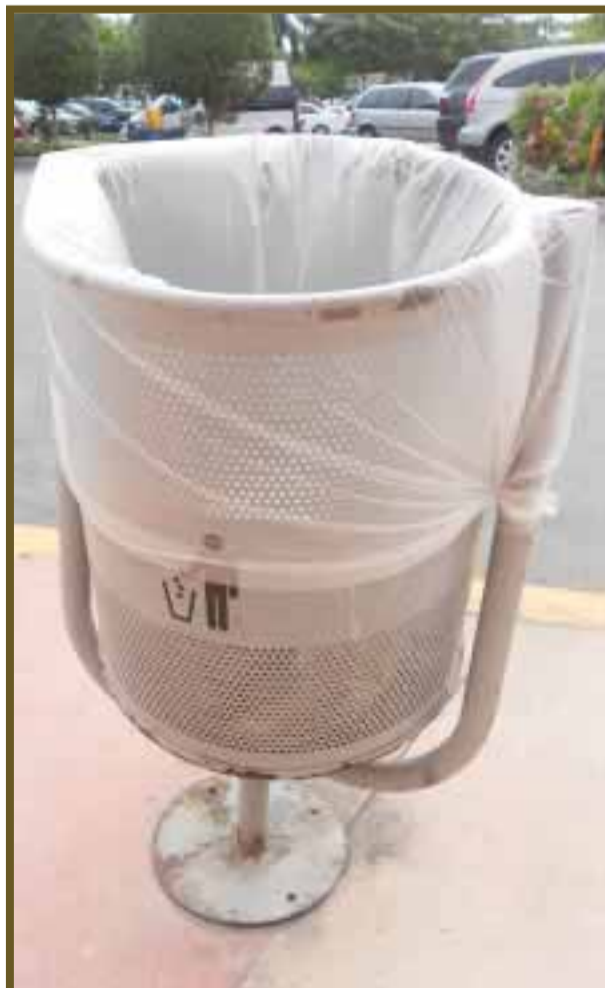
Se debe reconocer la importancia de reciclar.