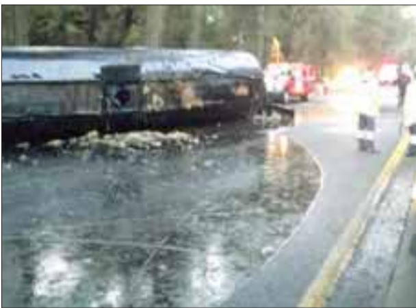
La volcadura de una pipa cargada con chapopote obligó a cerrar la autopista México-Cuernavaca.

La circulación vial fue reabierto minutos después de las 15:00 horas.