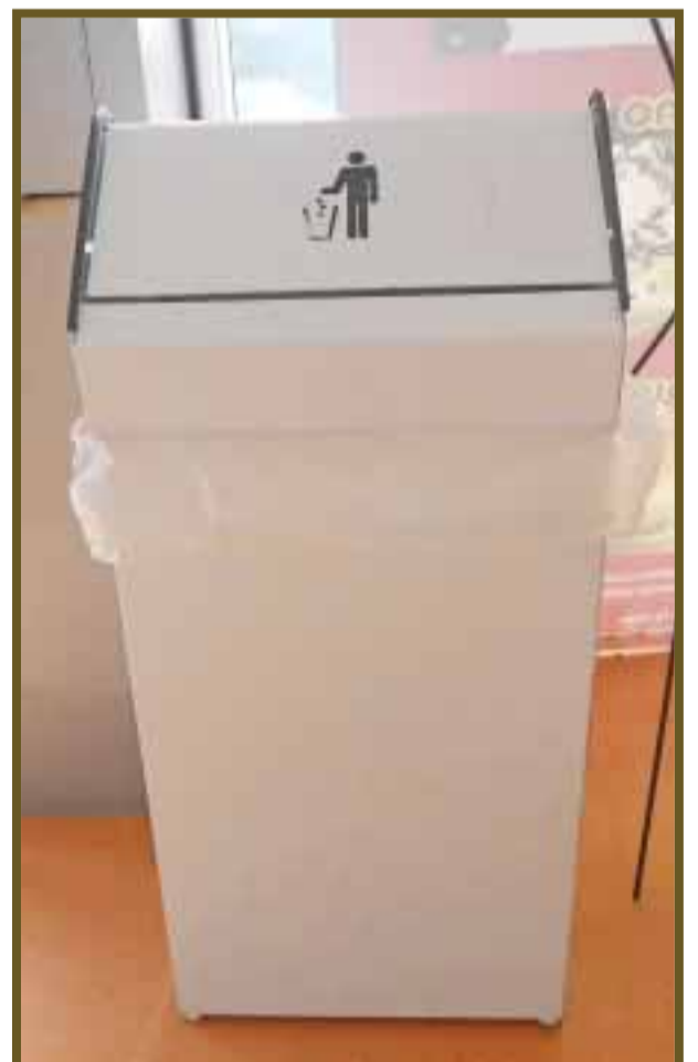
El orden en la clasificación de los desechos contribuye a mejorar el planeta.