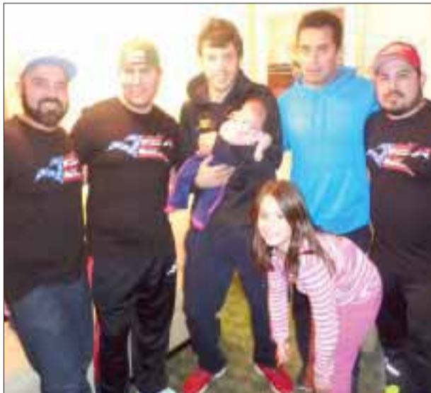
San Antonio, Texas.- Julio César Chávez Jr. se encuentra motivado por el nacimiento de su hija, a quien cargó durante la conferencia de prensa.