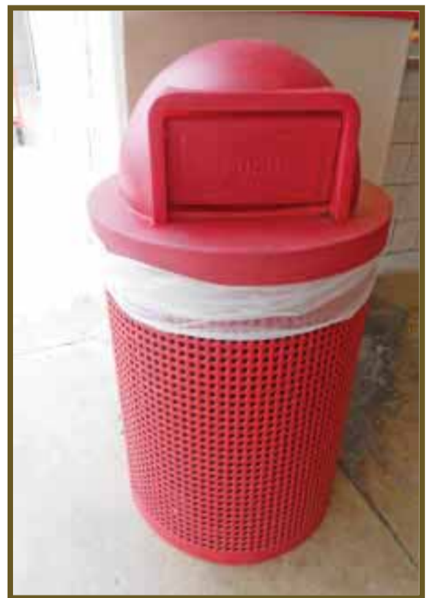
Contenedores son utilizados para transportar plástico o cartón.