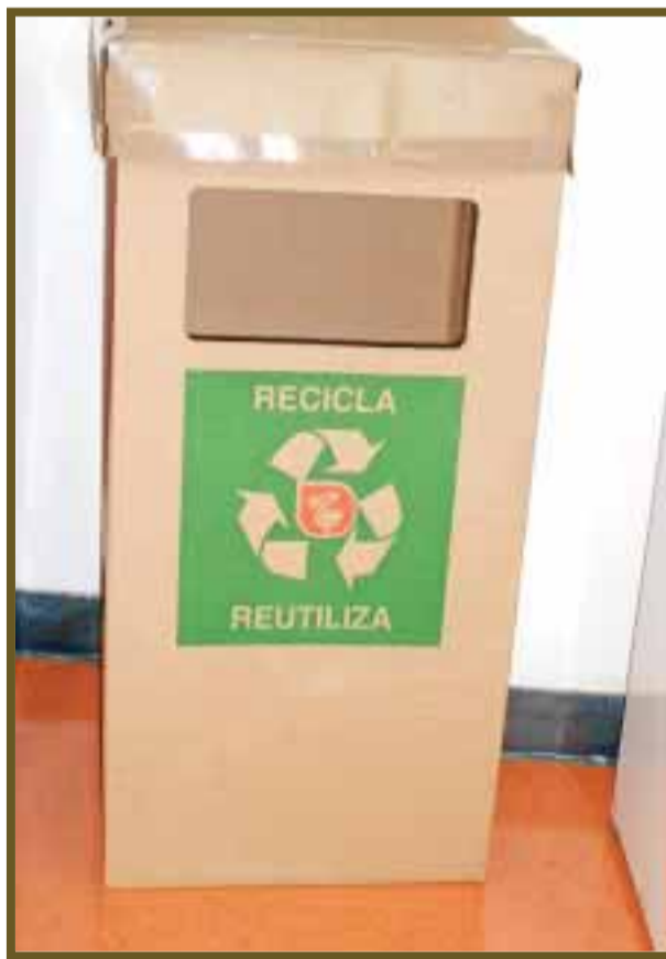
Cestos de basura incitan al reciclaje de la basura.