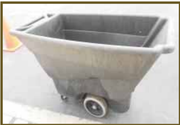
El contenedor gris (orgánico). En él se depositan residuos biodegradables.