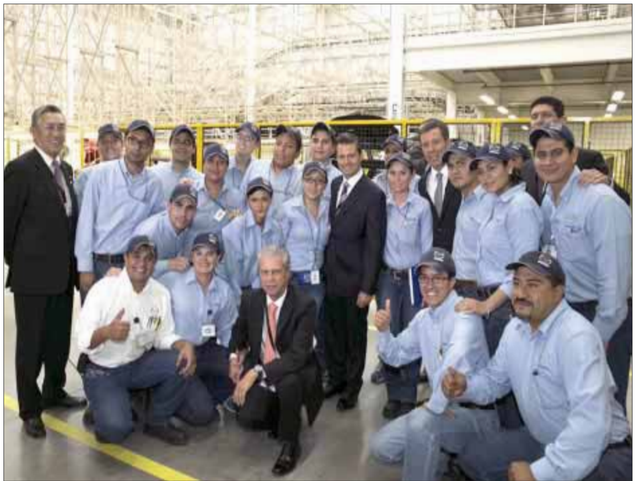
Salamanca, Gto.- Luego de inaugurar las instalaciones de la empresa automotriz Mazda y recorrerlas, el presidente Enrique Peña Nieto se tomó la foto del recuerdo con los trabajadores de la planta.

La planta de Mazda que hoy estamos inaugurando formalmente, continuó, "es reflejo de lo mucho que se puede lograr cuando la confianza que se de-