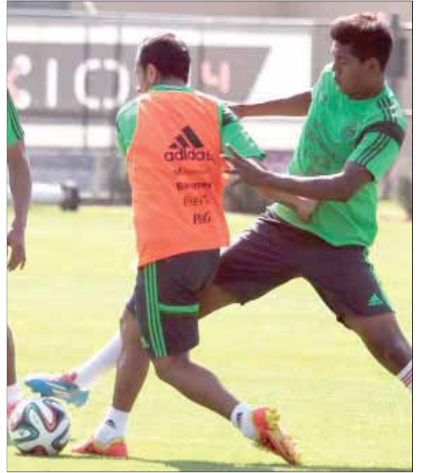
La Federación Mexicana de Fútbol dio a conocer los nombres de los jugadores convocados para el amistoso contra Nigeria.