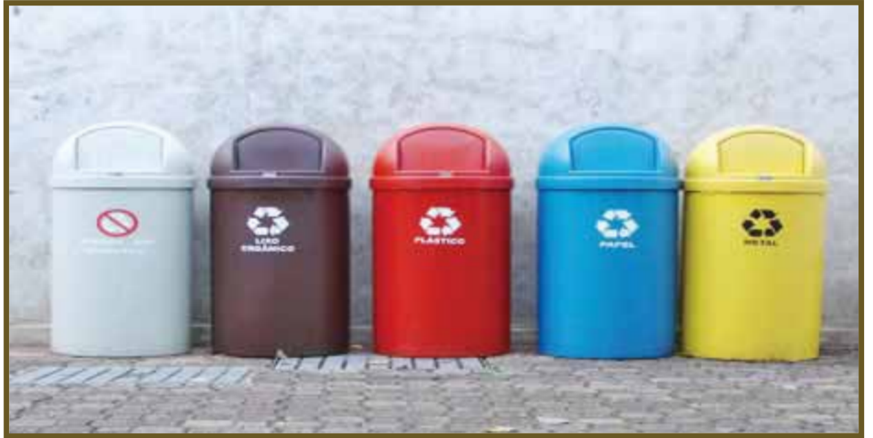
Gris, desechos en general; café, lujo orgánico; rojo, hospitalarios-infecciosos; azul, papel; amarillo, plástico y envases metálicos.

Mientras que muchas personas se dan cuenta que el reciclaje es bueno para el medio ambiente en términos de aliviar la demanda de los recursos limitados, deben darse cuenta también de que la decisión de reutilizar y reciclar algunos elementos también permite reducir los costos al producir productos de manera significativa, lo cual puede sanar el planeta y contribuir al ahorro económico.