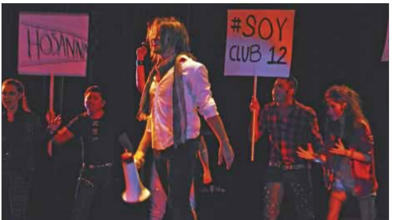
Gran energía y talento sobre el escenario.

Estimado, lector si tiene algún acontecimiento social, cultural, deportivo, etc. Envíenos un correo y DIARIO IMAGEN con gusto lo cubrirá y publicará. diarioimagenqroo@gmail.com