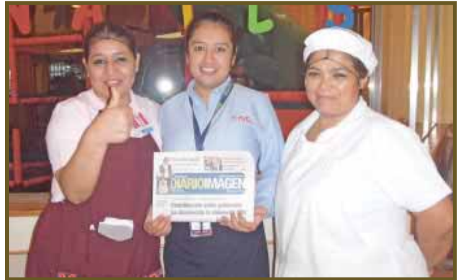
Personal posa para DIARIO IMAGEN.