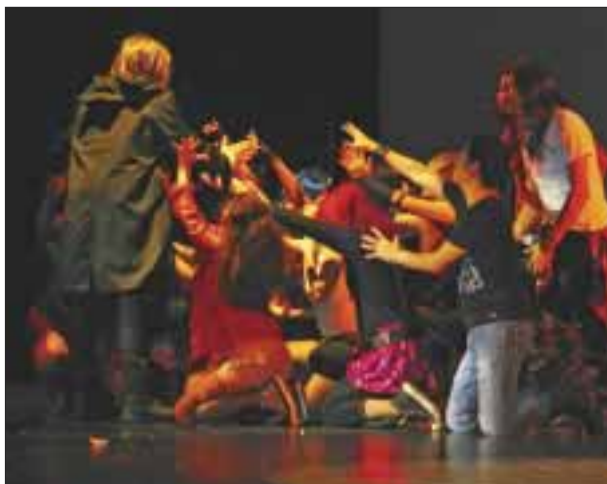
Obra emotiva y con gran mensaje.