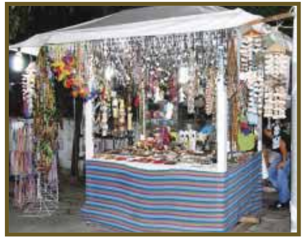
La bisutería artesanal tiene gran movimiento en la zona.