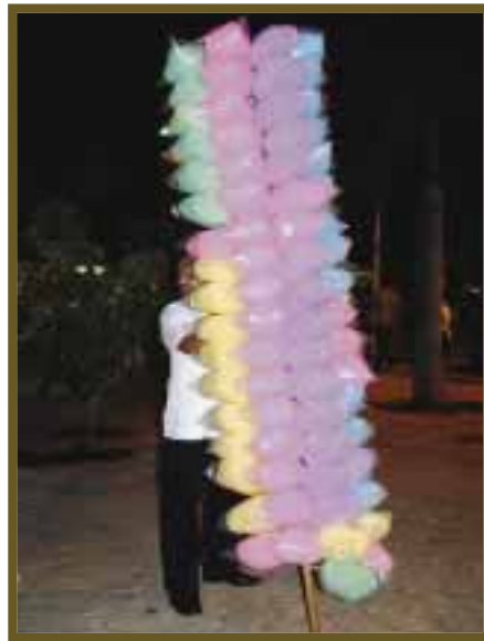
Para no perder la tradición, los deliciosos algodones de azúcar que le dan el toque de feria al concurrido parque.

Los habitantes tienen ya por costumbre salir el fin de semana con la familia a relajarse, hacer sus compras y elegir variedad de artículos y comida, quienes señalan que les da gusto, además de aportar con sus compras al crecimiento y desarrollo de los comerciantes locales y conservando así también la tradición.