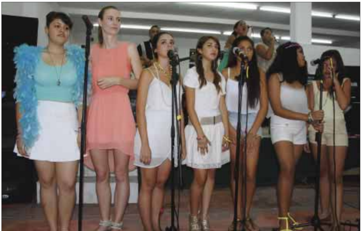
Alumnas interpretando una canción juvenil del momento.

Estimado lector, si tiene algún acontecimiento social, cultural, deportivo, etc. Envíenos un correo y DIARIO IMAGEN con gusto lo cubrirá y publicará. diarioimagenqroo@gmail.com