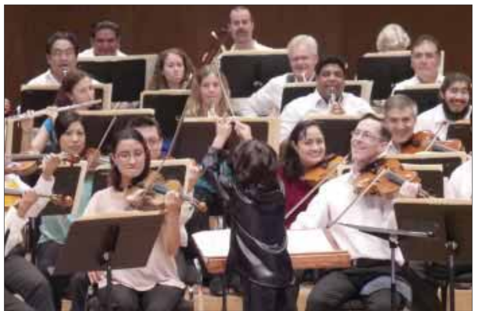
El concierto terminó de manera espectacular, con un baile a ritmo de "Galop de Orfeo en los infiernos", mejor conocido como "Can Can" de Jaques Offenbach, dirigida por un pequeño de no más de 5 años, que entusiasmado subió al escenario y se adueñó de la batuta.