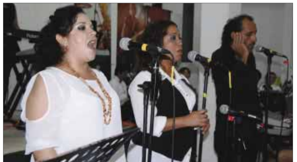
Los cantantes encantaron al público.