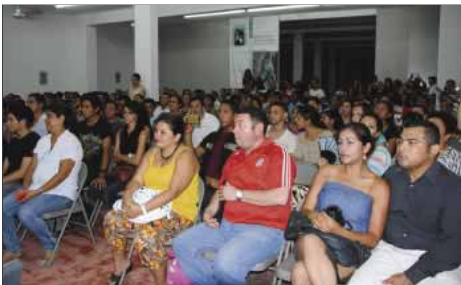
Se registró gran audiencia.