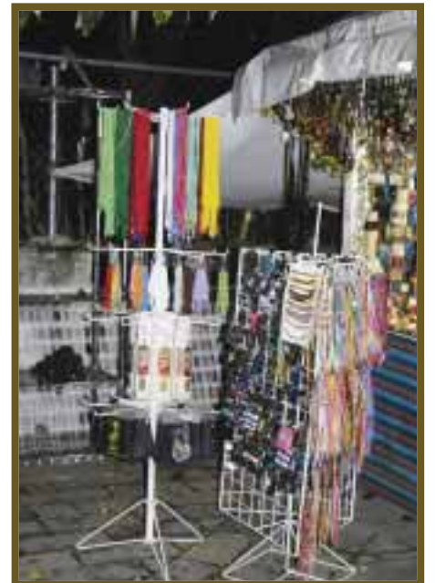
Pulseritas, incienso y collares.