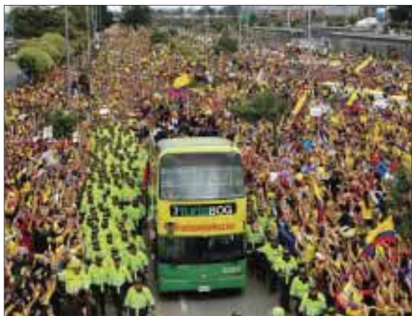
Miles de colombianos vitorearon a los integrantes de su selección nacional de fútbol.

técnico argentino José Pekerman caminaron sobre una alfombra roja desde el avión que aterrizó en aeropuerto Eldorado.