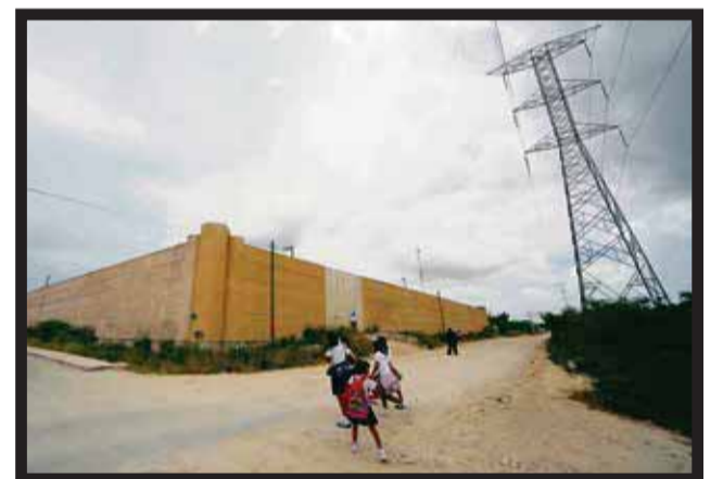
MÁS HOGARES podrán contar con electricidad.

que estas acciones se concretaron con el respaldo del presidente Enrique Peña Nieto. El funcionario recordó que para reforzar la cobertura, en este 2014 se pusieron en operación dos subestaciones: Aktunchén y Zacté en abril y junio... >2