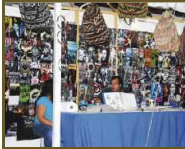
Artículos roqueros, además de tatuajes y algunos souvenirs.