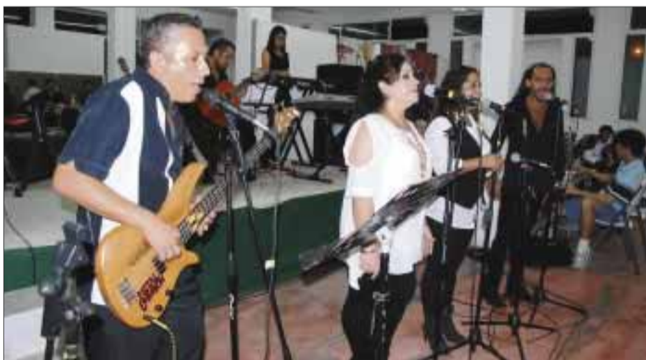
Músicos y cantantes mostraron su conocimiento.