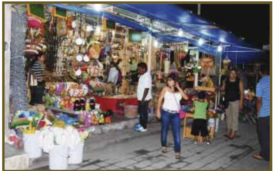
Artículos, que en su mayoría están elaborados en madera son los favoritos de las amas de casa.