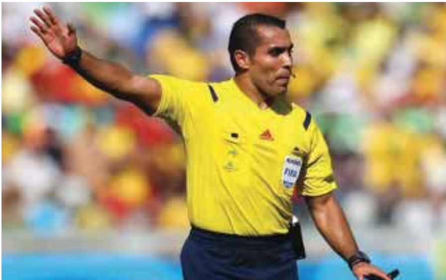
Marco Rodríguez fue designado por la FIFA para dirigir el primer partido de semifinales de la Copa del Mundo Brasil 2014.

Rodríguez, de 40 años, trabaja en su tercera Copa del Mundo, y en las dos anteriores pitó en dos partidos en cada una. La semifinal del martes será en el estadio Mineirao de Belo Horizonte. Argentina y Holanda se enfrentan al día siguiente en Sao Paulo en la otra serie.