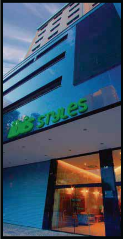
La nueva marca abrió sus puertas en Brasil.