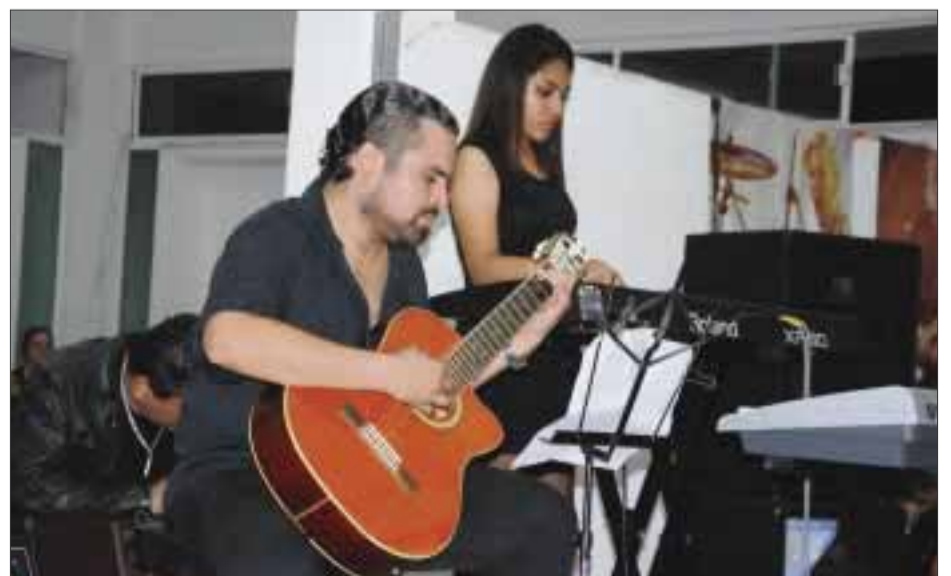
Las estrofas reflejaron el gran trabajo que han desarrollado durante el curso.