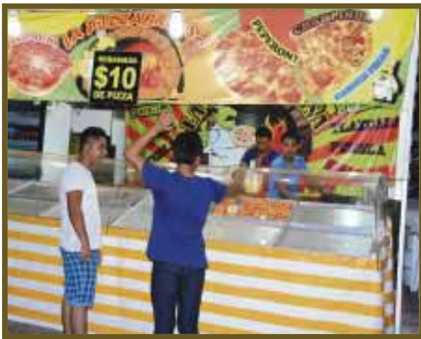
Pizzas calentitas se venden con gran rapidez.