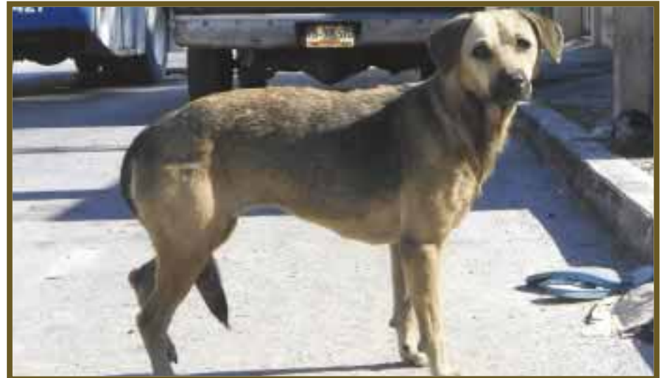
Perros salvajes que han sido víctimas de maltrato, deambulan por las calles.