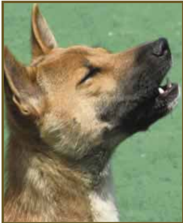
Adopte un cachorrito, es el animal más agradecido.