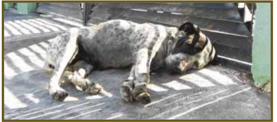
El abandono y desprecio dejan a miles de perros en las calles.

también educarlas, quererlas, así como evitar ciertas prácticas que afectan la calidad de vida de los perros: su cruce indiscriminado, el supuesto valor monetario que tienen sus razas, la distinción, discriminación y sobre todo el abandono y maltrato, los cuales han estado presentes en últimos tiempos.