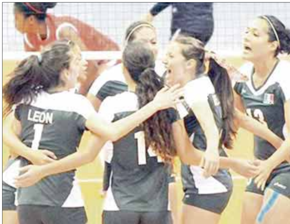
La selección mexicana de voleibol estará en la justa mundialista que se realiza el presente año.

El primer español de la lista es el tenista Rafael Nadal, que se encuentra en la novena posición e ingresó 44,5 millones de dólares, provenientes de los premios económicos de los torneos y sus acuerdos publicitarios con diferentes marcas.