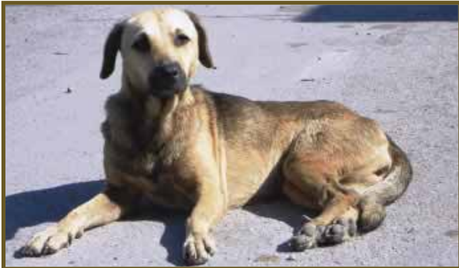
La adopción está dando alternativa de vida a miles de canes callejeros.