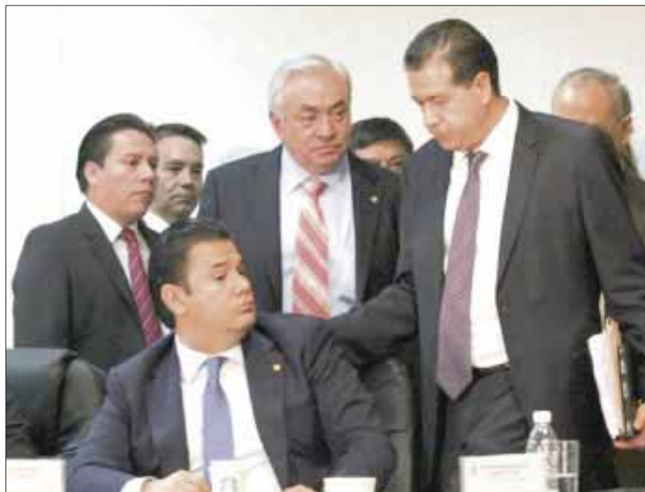
La Comisión de Energía de la Cámara de Diputados se retira satisfecha de haber aprobado la minuta que le turnó el Senado.

Los diputados aprobaron en lo general el dictamen y acordaron que presentarán las reservas en el pleno, cuando inicie el cuarto periodo extraordinario, que podría ser convocado a partir del lunes 28 de julio