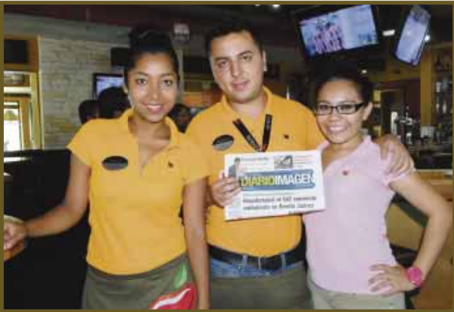
Personal de Apple Bees.