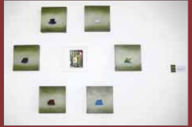
"Vestimenta del matrimonio 2011".