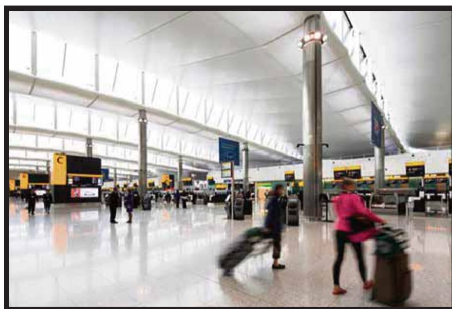
La nueva T 2-hogar de Star Alliance en Heathrow recibió a los primeros pasajeros.

cutivo de Star Alliance . “Nos parece ha sido muy apropiado que uno de nuestros miembros fundadores, United , sea quien opere uno de los primeros vuelos a esta terminal, ya que esto eleva los estándares de servicio al cliente de la alianza y conveniencia de los viajes en este importante centro de conexión”. La Terminal 2, diseñada por el arquitecto Luis Vidal , fue desarrollada en conjunto por Heathrow , Star Alliance y sus miembros, con el objetivo de establecer un verdadero centro de conexiones rápidas en uno de los mejores aeropuertos del mundo. Optimizadas para las necesidades del viajero moderno, las instalaciones de las 23 aerolíneas de Star Alliance están integradas como nunca antes sentando las bases para un servicio al cliente con excelencia. Cuando todas las aerolíneas estén instaladas, los tiempos de conexión serán menores que los que se tenían en Heathrow anteriormente, con un promedio estándar mínimo de 60 minutos de conexión. Las fechas de traslado para las 22 aerolíneas restantes se han planeado cuidadosamente para asegurar que cada grupo tenga tiempo de sentar sus opera-