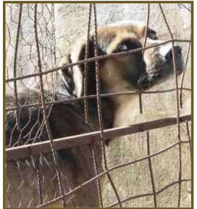
La libertad de los animales se ve coartada, cuando se les deja encerrados por tiempo prolongado, lo cual les provoca depresión y agresividad.