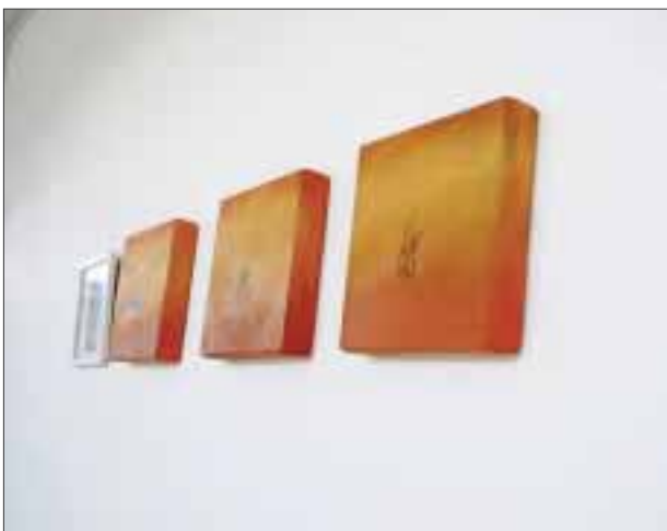
"Los objetos de alquimista".