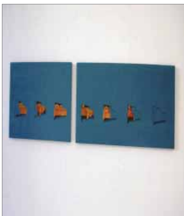
"Acto de contricción".