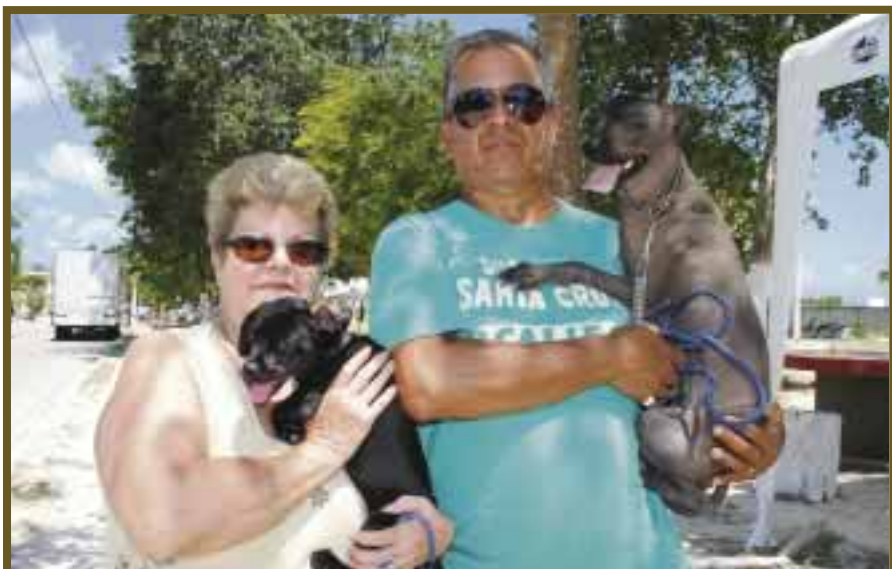
Un cachorrito es una excelente compañía para el ser humano.