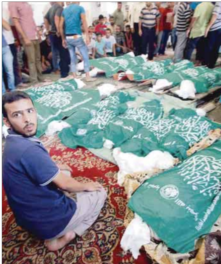
El avance de tropas de Israel sobre la Franja de Gaza ha dejado 3 mil heridos y cientos de muertos.

En los 12 días de ofensiva israelí sobre la Franja también han muerto 25 soldados de Israel en combates con milicianos y un civil israelí y un beduino alcanzados por cohetes lanzados desde Gaza.