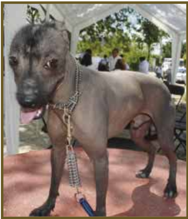
La explotación desmedida ha ido en aumento, lo cual ha traído la extinción de algunas razas, como el xoloitzcuintle.