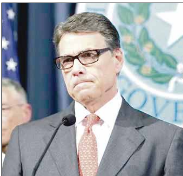
El gobernador de Texas, Rick Perry, informó de las previsiones de su gobierno.