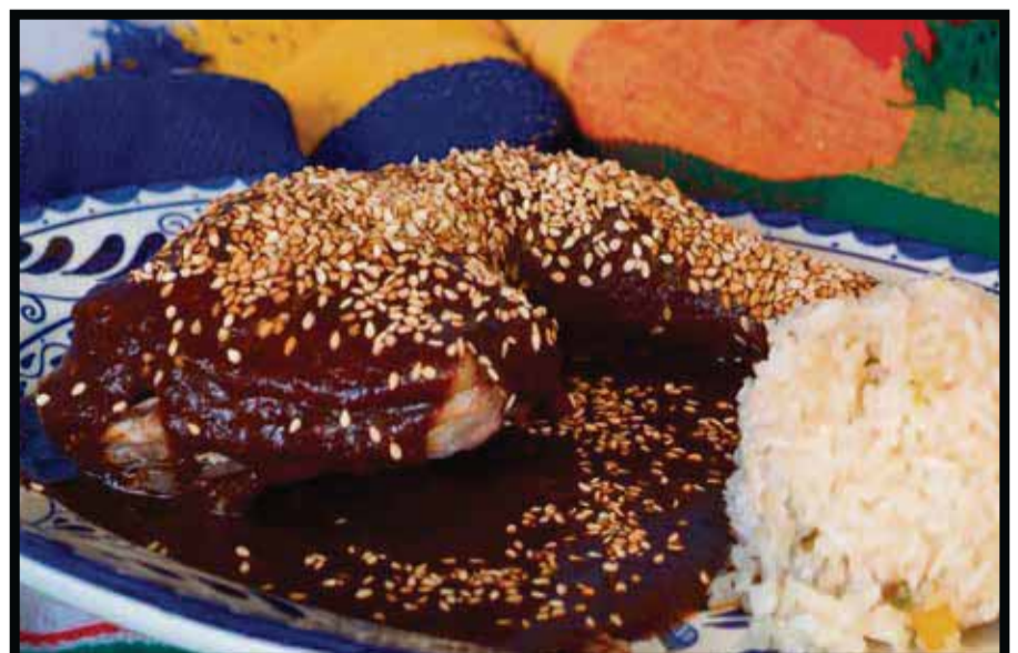
El famoso mole poblano.