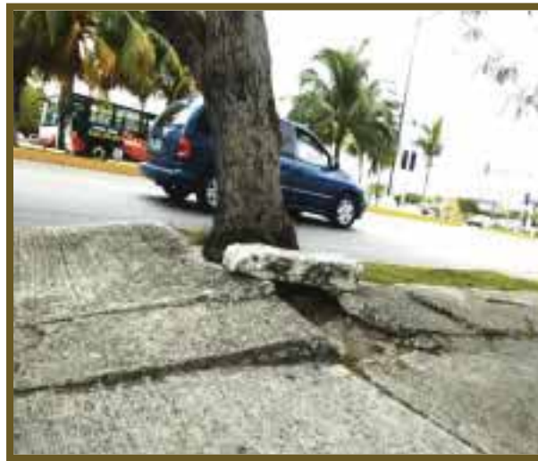
A causa de las raíces de los árboles, las banquetas se levantan y representan un obstáculo.