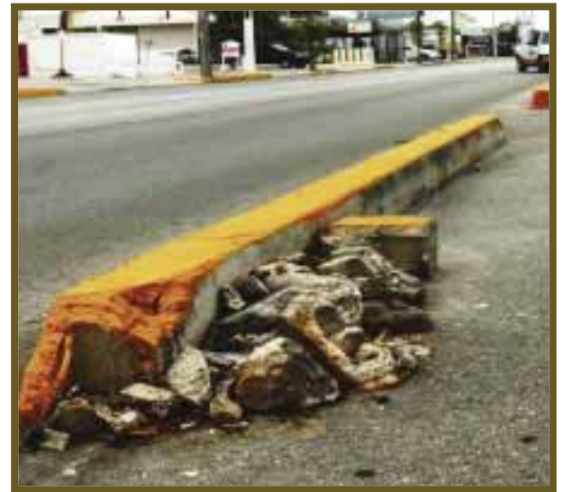
Restos de concreto olvidado en obras inconclusas.