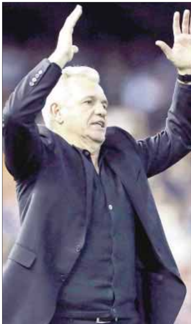
Javier Aguirre fue designado por la Asociación de Fútbol de Japón como director técnico de la selección nacional de ese país.