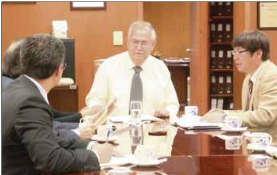
Autoridades del Instituto Nacional de Investigaciones Forestales, Agrícolas y Pecuarias y la Universidad de la Ciudad de Yokohama, durante la firma del acuerdo.