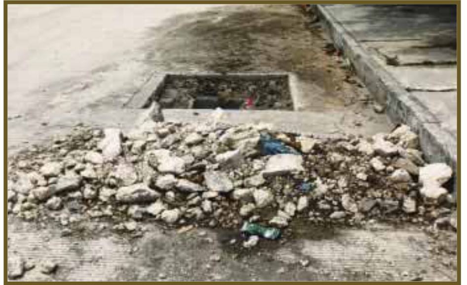
Alcantarillas abiertas y escombros.

Difícilmente se puede encontrar en Cancún una vía que esté libre de baches, hoyos y desperfectos, por lo cual es preferible prevenir que lamentar, y es tarea de cada peatón cuidar su seguridad al caminar con la vista atenta a cada paso, con el fin de evitar algún accidente.