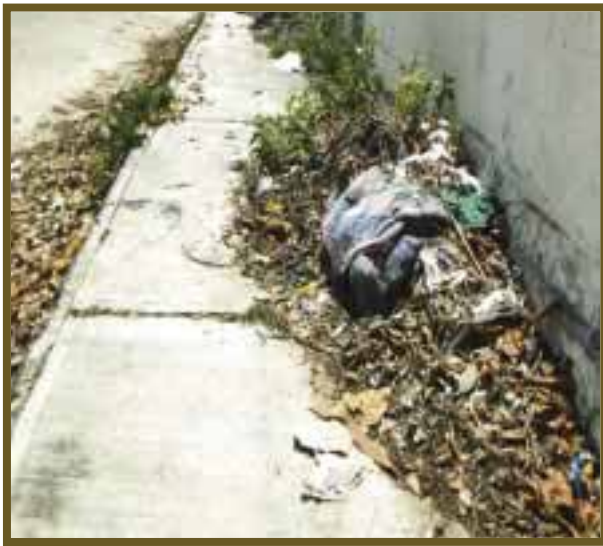
Basura con alimañas y roedores.