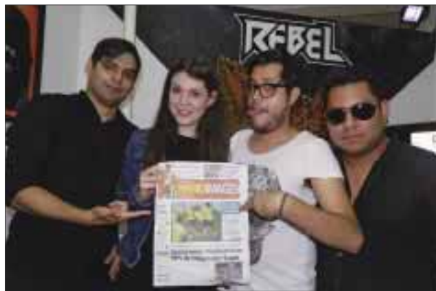
La agrupación posó para DIARIOIMAGEN y se dijo en evolución musical continua, brincando del punk a diferentes estilos.