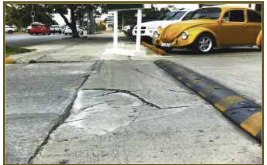
Pasos peatonales deteriorados.