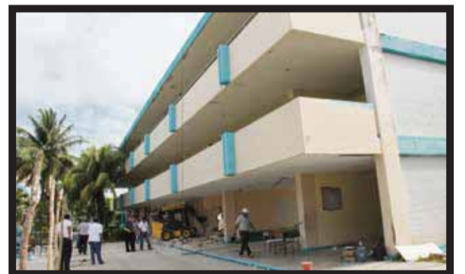
PARA LOS MAESTROS está prohibido recibir aportaciones monetarias.

nivel medio superior como Conalep, Bachilleres, Eva Sámano de López Mateos y Cebtis ignoran la reforma educativa y sus leyes secundarias al condicionar la educación con el cobro de cuotas... >7