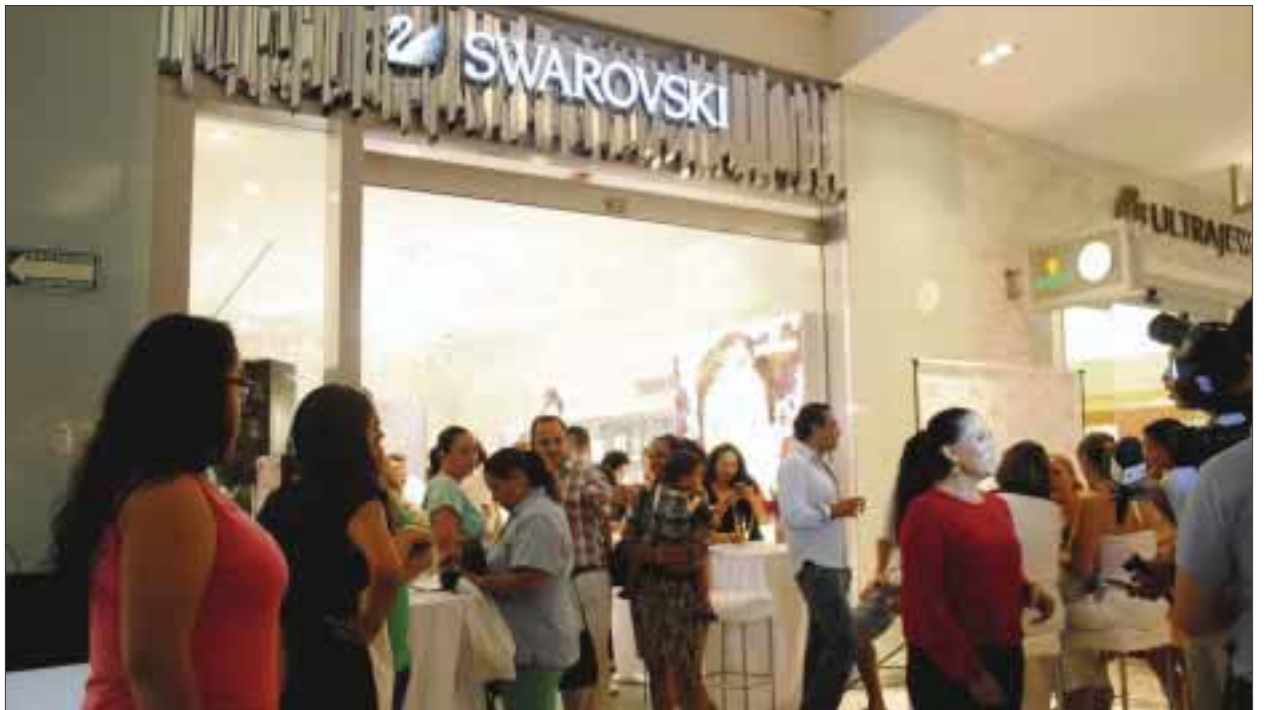
El DJ amenizó el acontecimiento con música agradable.

Estimado lector, si tiene algún evento social, deportivo, cultural, etc., envíenos un correo y con gusto DIARIOIMAGEN lo cubrirá y publicará. diarioimagenqroo@gmail.com