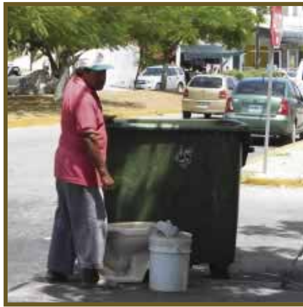
Para muchos es usual llevarse objetos que pueden ser rehabilitados.