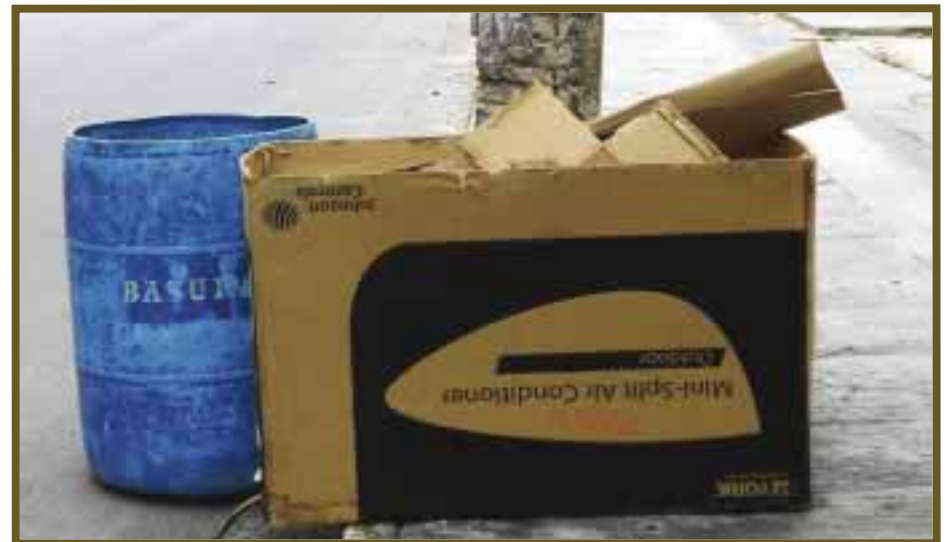
Juntando el cartón poco a poco, mientras van y buscan en otros contenedores.