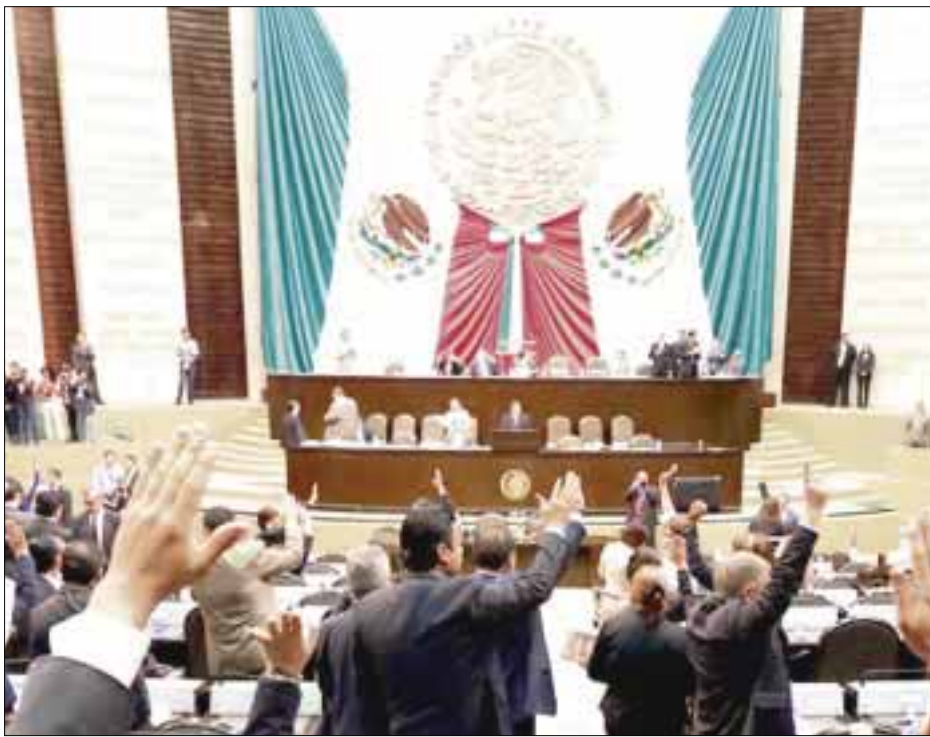
El pleno de la Cámara de Diputados aprobó el primer dictamen del paquete de leyes reglamentarias de la reforma energética.

Prevé contratos de servicios, de utilidad o producción compartida y de licencias con empresas particulares