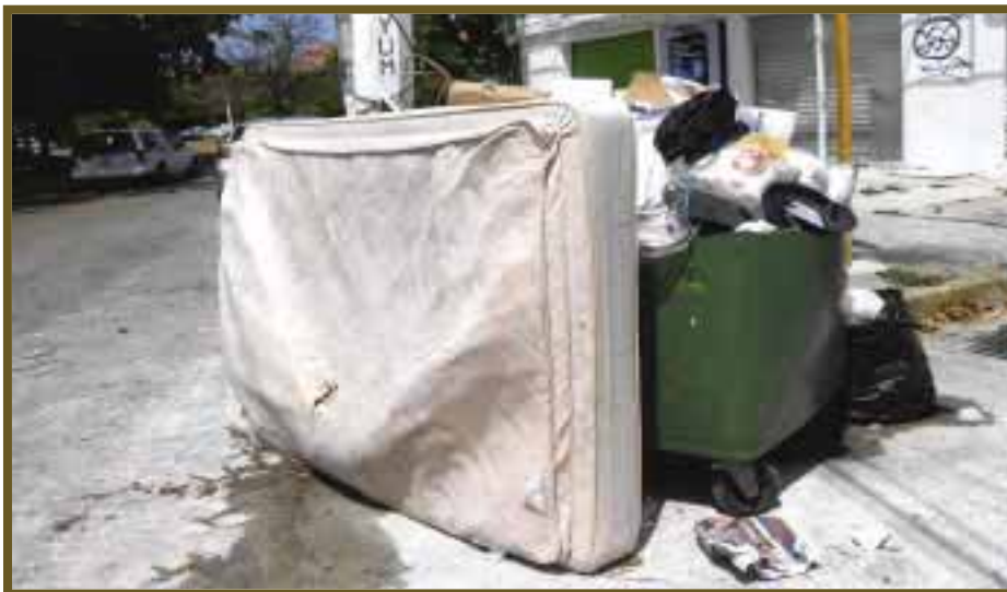
Hasta los colchones son reciclados y vendidos en partes después de sacar el metal.