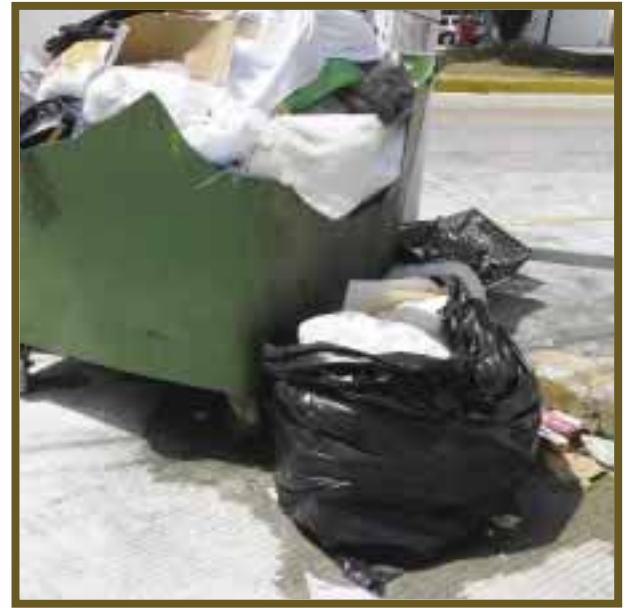
En los contenedores pueden encontrar desechos en buen estado para ser reutilizados.