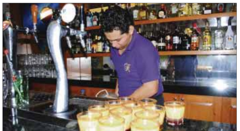
Las bebidas, a cargo del barman.