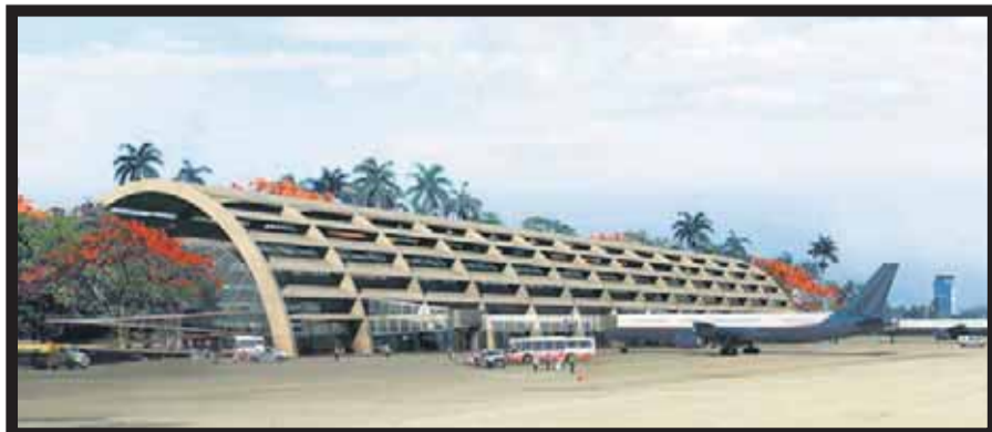
A finales del 2014 iniciará la construcción.