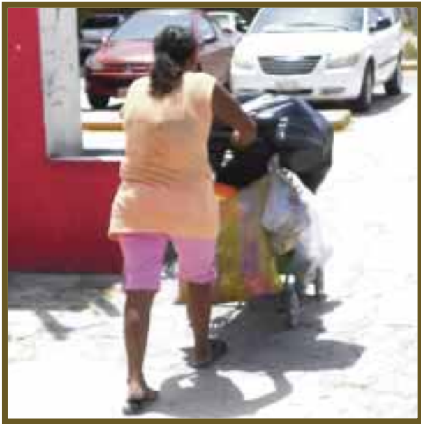
Desde temprano salen a su jornada, transportando lo encontrado en un carriola.