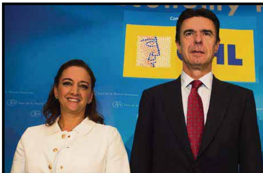
Durante la reunión en Nueva Economía Fórum.