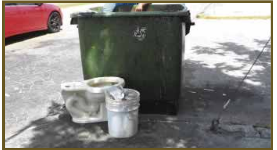
Después de vaciado el contenedor, pueden buscar más desechos.

Muchos heredaron el oficio de sus padres y abuelos, para otros esto se convirtió en su modo de subsistir o una costumbre. Comentan que en un buen día pueden reunir hasta 200 pesos y les basta para alimentar a su familia; sin embargo, esta actividad es peligrosa, pues están expuestos a bacterias, agujas contaminadas y un sin fin de enfermedades.