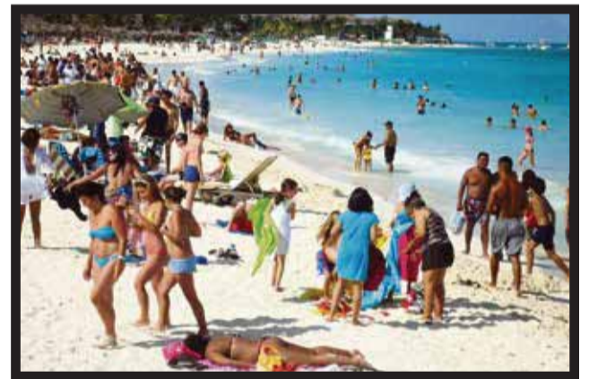
TAMBIÉN HA CRECIDO la infraestructura urbana.