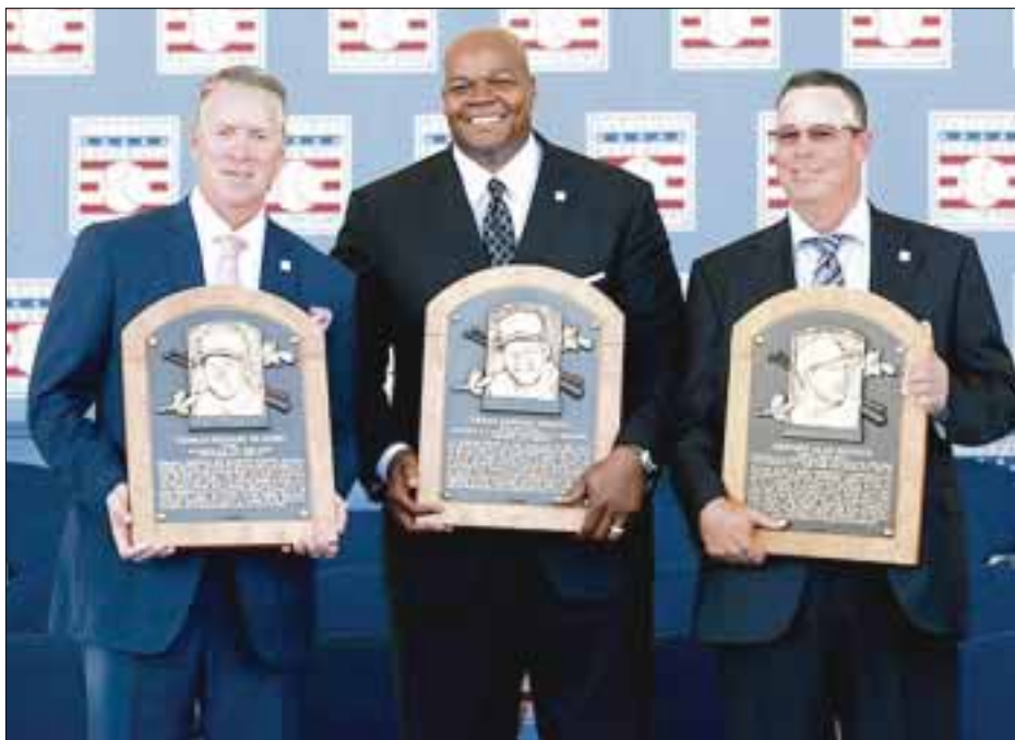
Los lanzadores Greg Maddux, Tom Glavine y el toletero Frank Thomas, en el recinto de Cooperstown.

Los jugadores Frank Thomas, Joe Torre, Tony La Russa, Tom Glavine y Bobby Cox ingresaron al templo de los recuerdos para los aficionados