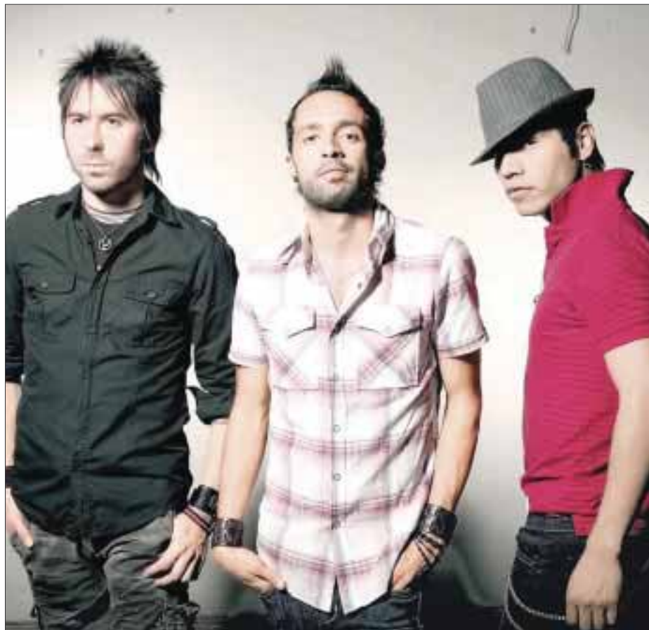
Con nuevo disco bajo el brazo lanzan Decidiste dejarme , primera huella sonora de Elypse , el tercero y tan esperado álbum de Camila.

Durante el show interpretarán temas del nuevo disco