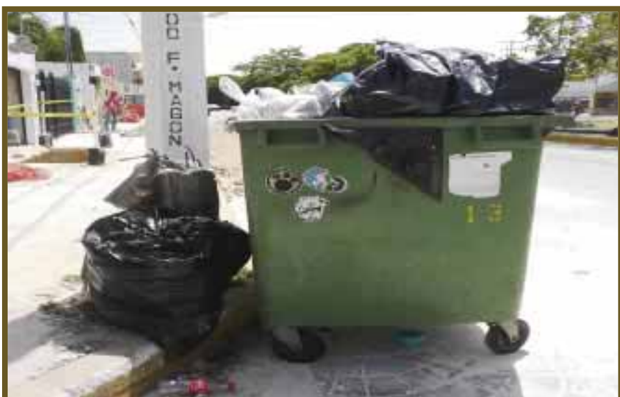
Son miles de toneladas las que diariamente los “recicladores” tienen que hurgar.