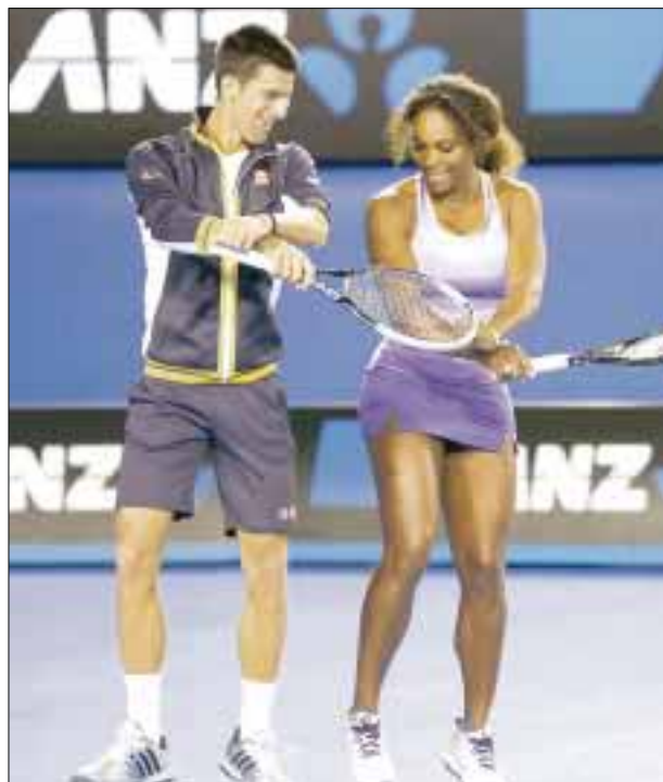
Novak Djokovic y Serena Williams no dejan la cima del tenis mundial.

La clasificación de la WTA se mantiene sin cambios entre las diez primeras tenistas, con la estadouni-