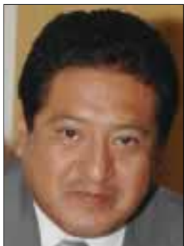
POR JORGE VELÁZQUEZ

Este primer paquete establece el marco jurídico que regirá a las actividades estratégicas de exploración y extracción de petróleo y gas, así como a la industria de los hidrocarburos