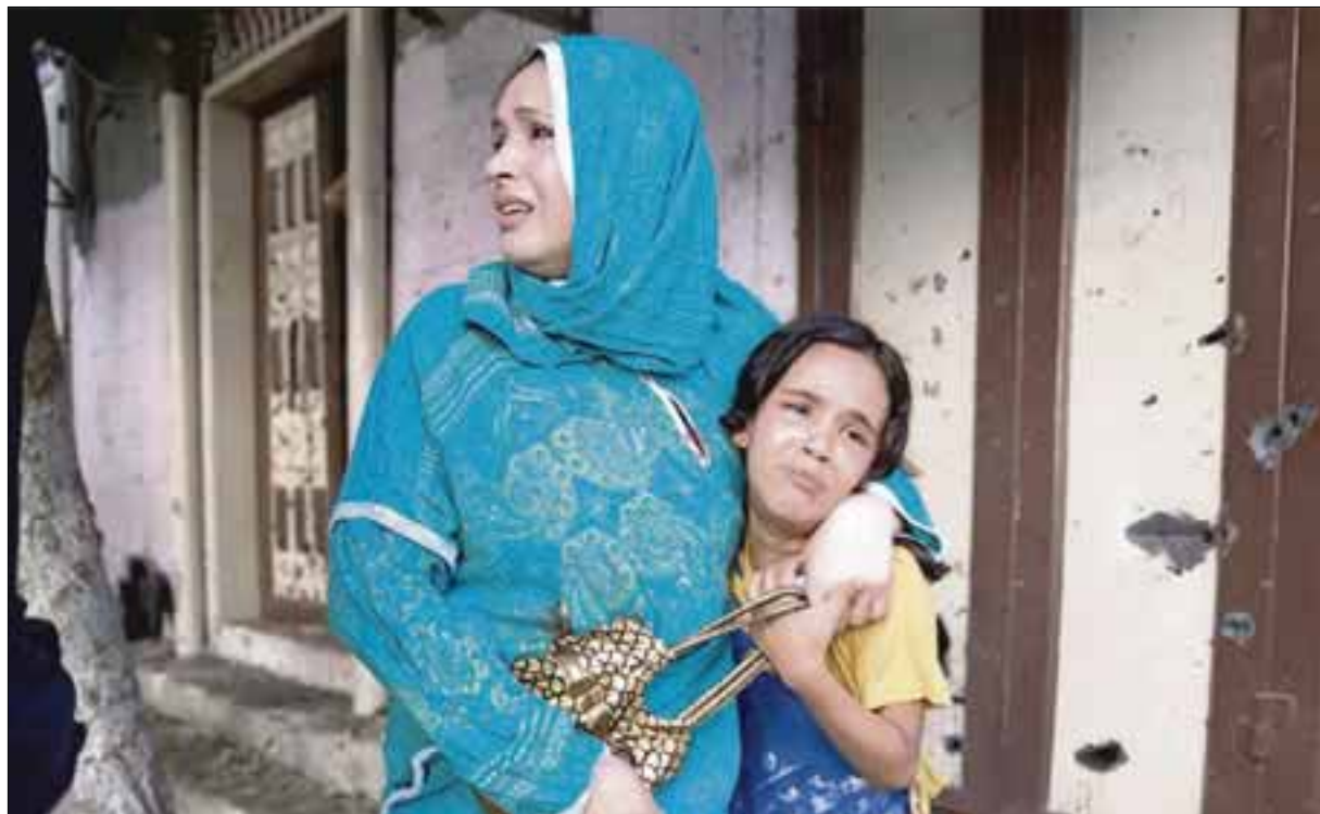
Esta mujer de origen palestino corre debajo de unos portales llorando y abrazando a su pequeña hija, luego de un bombardeo judío.