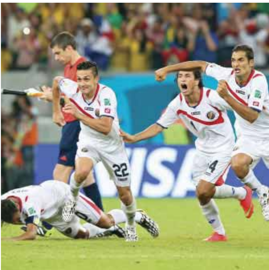
Los jugadores de Costa Rica celebran el triunfo obtenido mediante penales que le da su clasificación a los cuartos de final de la Copa del Mundo Brasil 2014.

"Es un buen equipo que le creó problemas a Argentina y Francia no debe confiarse porque debemos vencer", expresó el jugador francés Yoann Miguel Gourcuff, quien está entre los primeros lugares de popularidad.