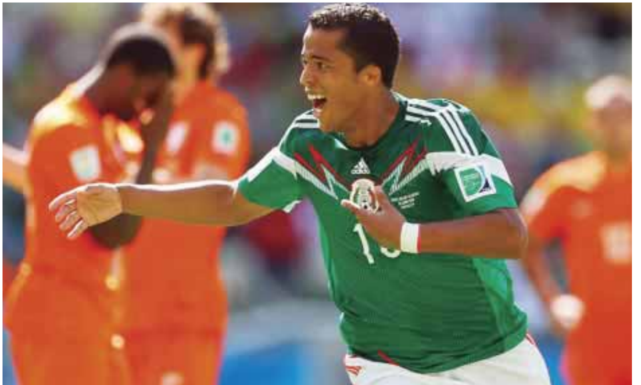
Giovani dos Santos anotó el primer gol del partido, pero no bastó y Holanda ganó el partido en los últimos minutos.

La selección mexicana de fútbol se había puesto adelante con gol de Giovani