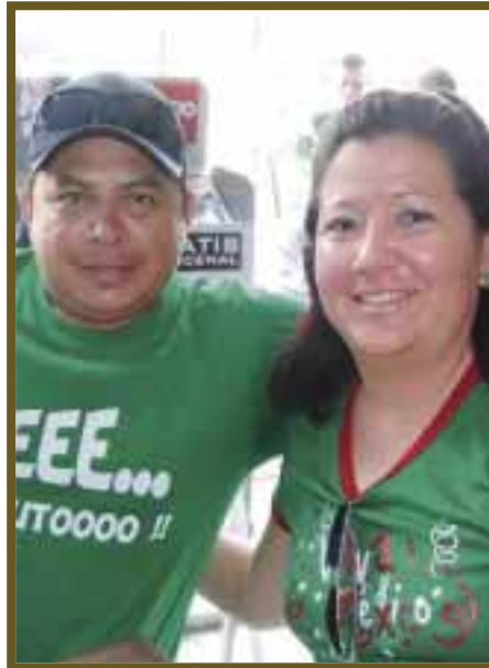
Ramsés y Berenice.

porque la selección dio todo en la cancha, y son unos campeones por haber enfrentado a sus oponentes como todos unos guerreros”, expresaron los aficionados con resignación y lágrimas en los ojos. En otra voz “A México le robaron la victoria”. Con tristeza, pero a la vez con ese orgullo que apasiona a los aficionados, aseguraron que México hizo historia.