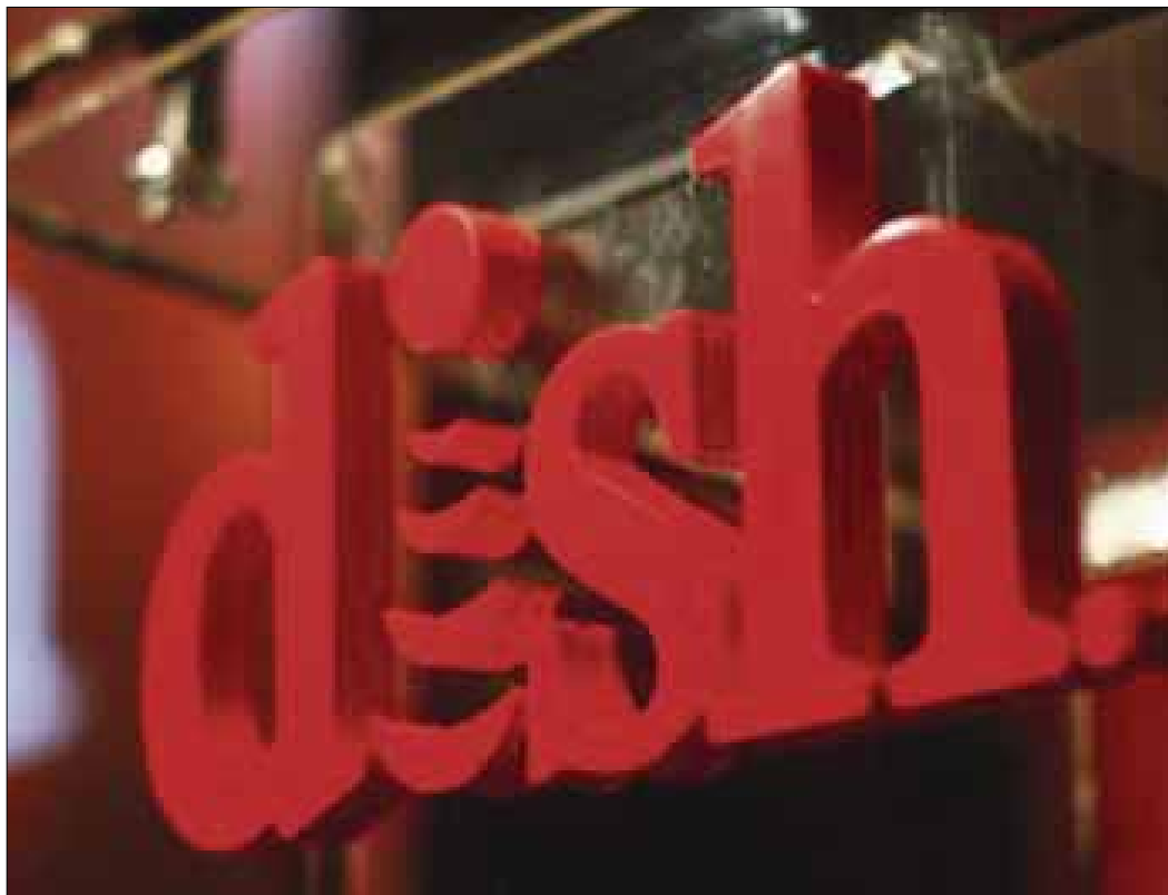
Los operadores de las telecomunicaciones comenzaron a cabildear con los legisladores, a quienes formularon propuestas concretas y públicas.

En un comunicado, aseguró que a pesar de lo ya establecido en la reforma constitucional en materia de competencia, el proyecto de Ley secundaria que se discutirá en los próximos días contiene disposiciones que implican un riesgo de retroceso y frustración de dicha reforma