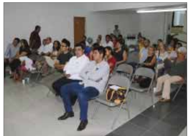
El público asistente a la conferencia.