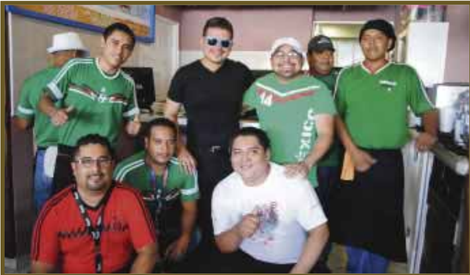
La afición posa para DIARIOIMAGEN.