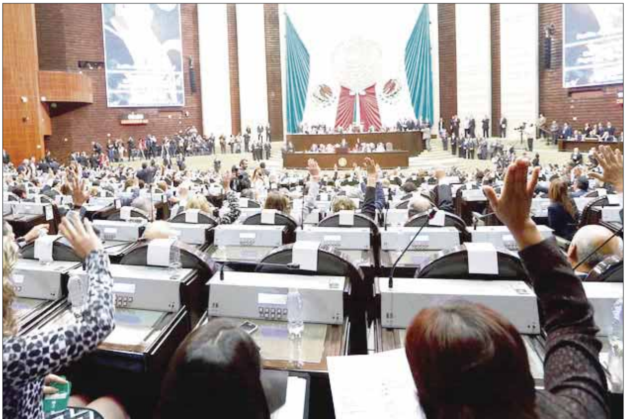
En la víspera de que se discutan las leyes reglamentarias del paquete de reformas a las telecomunicaciones, el Senado se prepara para ese debate.

El problema es estructural: desde arriba nace (nueva credencial oficial, triple no circula, trámites interminables, impuestos absurdos, leyes abusivas).