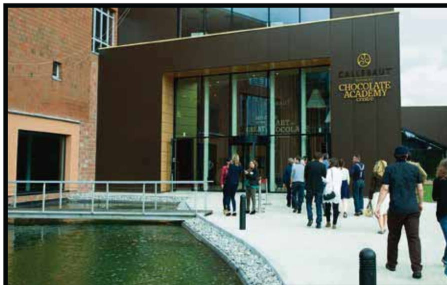
El flagship de Callebaut Chocolate Academy .