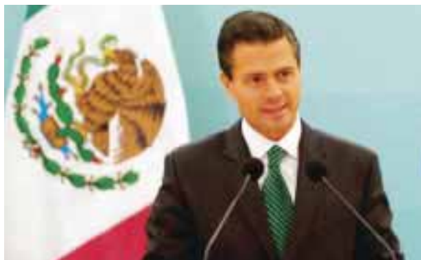
El presidente Enrique Peña Nieto felicitó a los jugadores de la selección nacional de fútbol y les agradece su actuación en la justa deportiva.