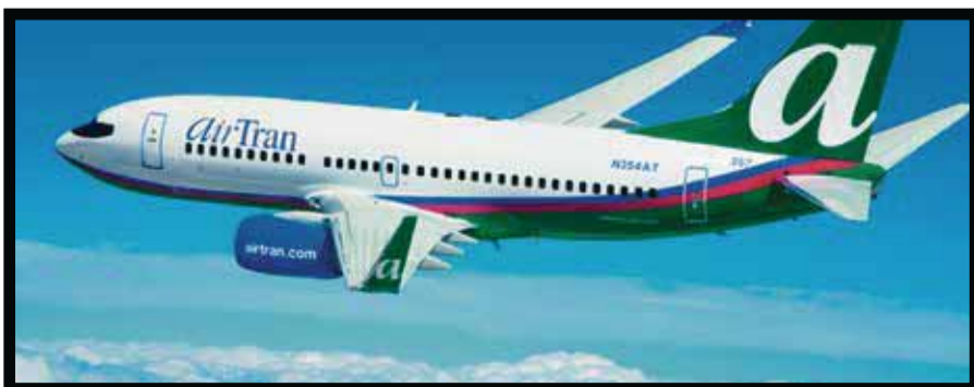
Southwest vuela en México bajo el nombre de Airtran Airway

☆☆☆☆☆ DHL Global Forwarding firmó un contrato con el fabricante de aviones Airbus para transportar los componentes de los aviones A319, A320 y A321 y cargas generales desde la planta de producción de Airbus en Hamburgo, Alemania, hasta la línea de montaje final de Airbus en Mobile, Alabama. Así, brindará una solución de transporte multimodal con servicios de transporte aéreo, marítimo y ferroviario a partir de 2015, afirmó Christoph Remund , director ejecutivo de DHL Global Forwarding, EU . “Con nuestro equipo de profesionales altamente capacitados, hemos trabajado diligentemente para diseñar las mejores soluciones de transporte multimodal para trasladar estos componentes a lo largo de casi 5 mil millas hasta su destino final”. Debido a la sensibilidad de los componentes de los aviones, el proceso de transporte es complicado. Las partes