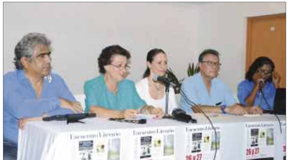
El distinguido presidium realizando la presentación de los escritores.